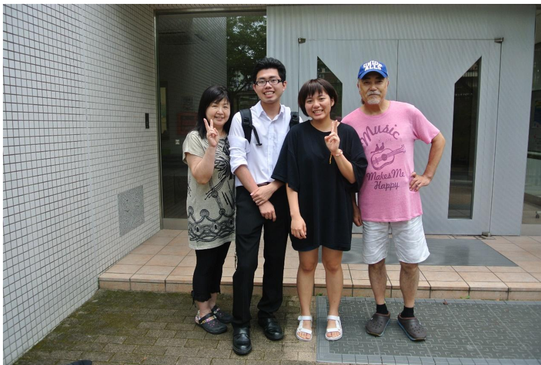
(お世話になりました 地点: 宿舎前 撮影者: 秘密 日期 2016/7/31)