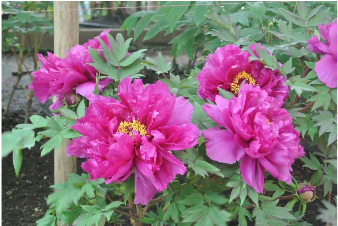
(綻放 地點:上野東照宮 日期:2016/5/03)