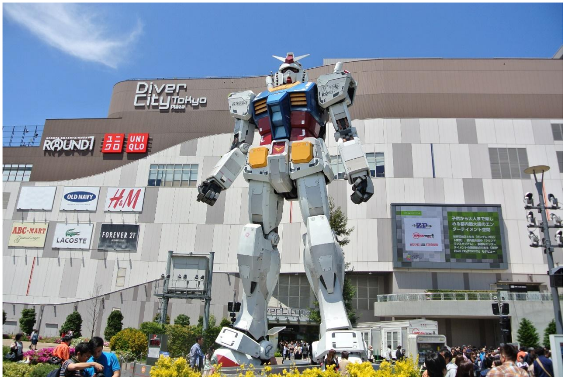
(1:1 白色惡魔 地點:台場 Diver City Tokyo 日期:2016/4/29)