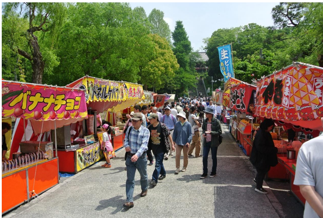
(這不是祭り 地點:上野恩賜公園 日期:2016/5/03)