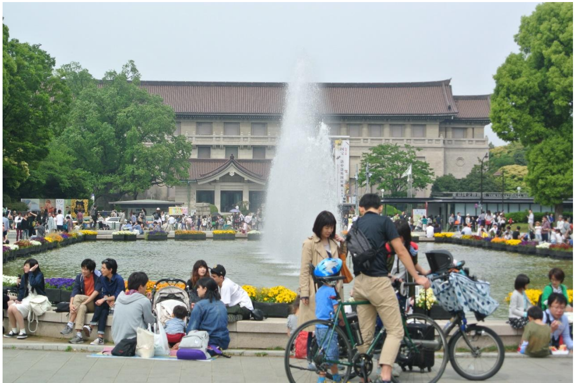
(黃金週 地點:東京國立美術館噴泉前 日期:2015/5/03)