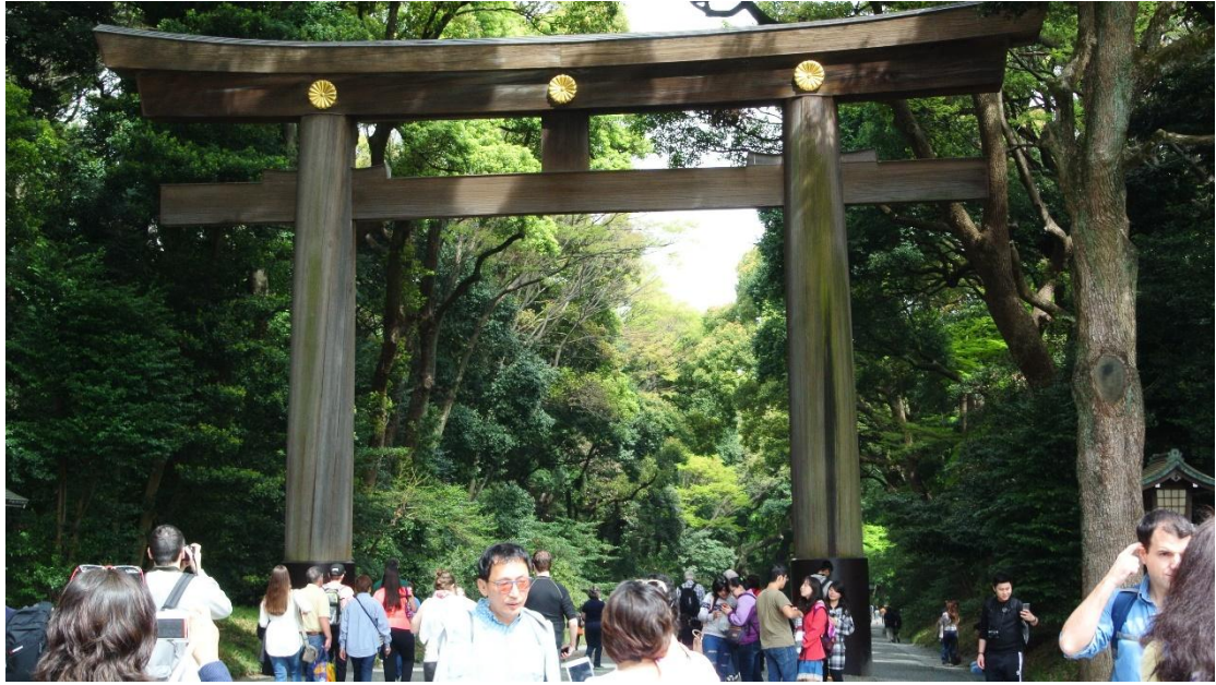
(明治神宮與觀光客 地點:明治神宮 日期:2016/4/10)