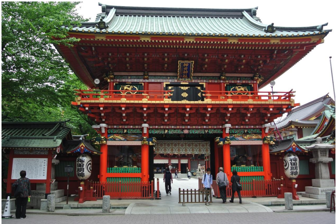
(神田神社 地點:神田神社 日期:2016/5/02)