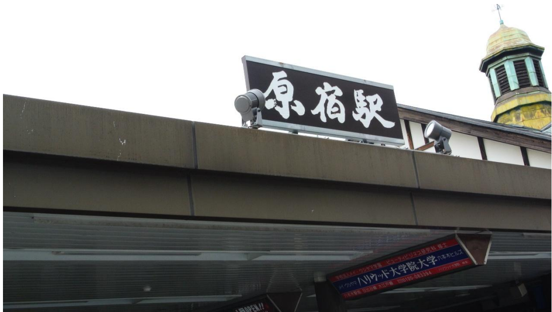
(原宿車站站牌 地點:原宿車站前 日期:2016/4/10)