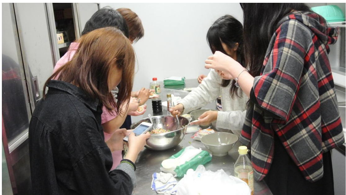
(宿舍餃子會 地點:宿舍公共廚房 日期:2016/4/10)