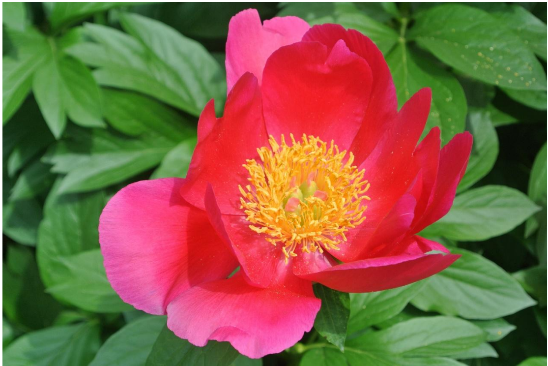
(烈陽 地點:上野東照宮 日期:2016/5/03)