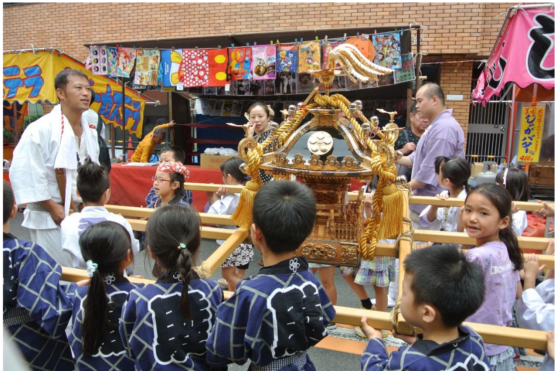
(祭りだ！！！！ 地點:湯島神社前 日期:2016/5/28)