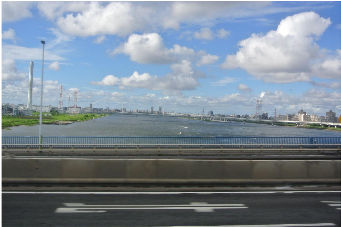
(前往機場的窗外風景 地點:巴士上)

但也多虧這便利的「鐵路系統」，我才能前往「淺草」、「明治神宮」等等的觀光景點。更不用說那「一日券」之類的優惠券，皆能成為探索「秘境」的「千里馬」。