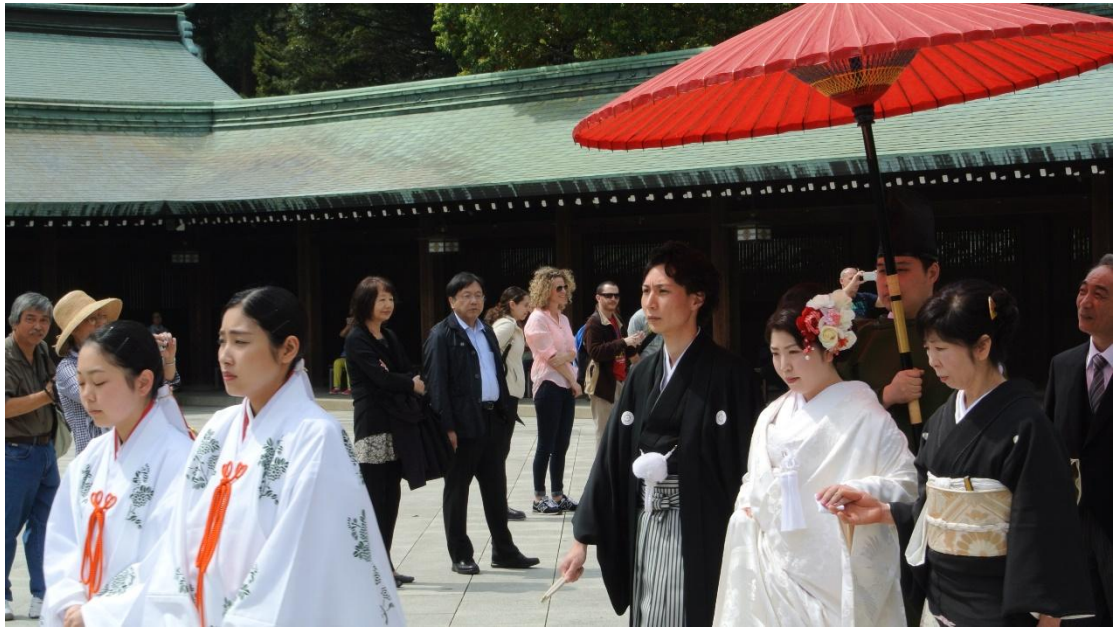
(日式婚禮 地點:明治神宮)

剛到學校時，映入眼簾的是一整片的櫻花。這是我第一次看到櫻花，還是如此大片的櫻花道路，心中的感嘆自然不用多加敘述。邊拖著行李邊向宿舍邁進時，擦肩而過的3名大學生，3個人的服裝呈現出了非常強烈的反差。最左邊的高個子男性穿著厚實的大衣及圍著一條褐色的圍巾，展現出成熟的氛圍。而中間略顯嬌小的男性則穿著短袖及短褲，一臉絲毫不畏懼這不到15度的四月，嶄露他那熱情滿溢的笑容。而最右邊的女性為無肩的藍白色小洋裝搭配著稍微強眼的粉紅色背心，下半身為有著蘇格蘭花紋的短裙及黑色的絲襪。因為他們聊天的音量略為大聲，因此能聽到片段的內容。看來在日本，每個家庭的換季都不同，但公家機關則有一個統一的時間。這聽起來像是一個理所當然的結論，但對我這位對日本抱持著許多幻想(甚至可說是妄想)的人而言，領會到現實與幻想始終是有落差，心情上著實有點小複雜。