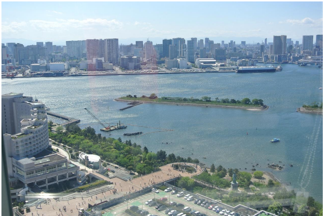
(台場風景 地點:富士電視台瞭望台)

「攝影」固然有趣，但本人也不是只有「攝影」而已。在此說一句本人曾聽過的話。「攝影最奇妙的地方即為每一張照片都截然不同。」，看似同一個地點、時間拍攝的照片，但攝影者每張照片所專注的「焦點」皆不同。也多虧了這「娛樂」方式，我才能用更廣泛的視角認識這個國家。