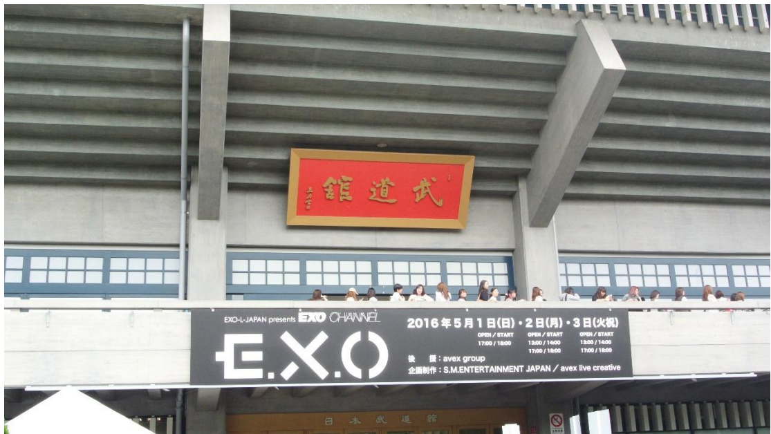
(武道館 地點:武道館前 日期:2016/5/02)