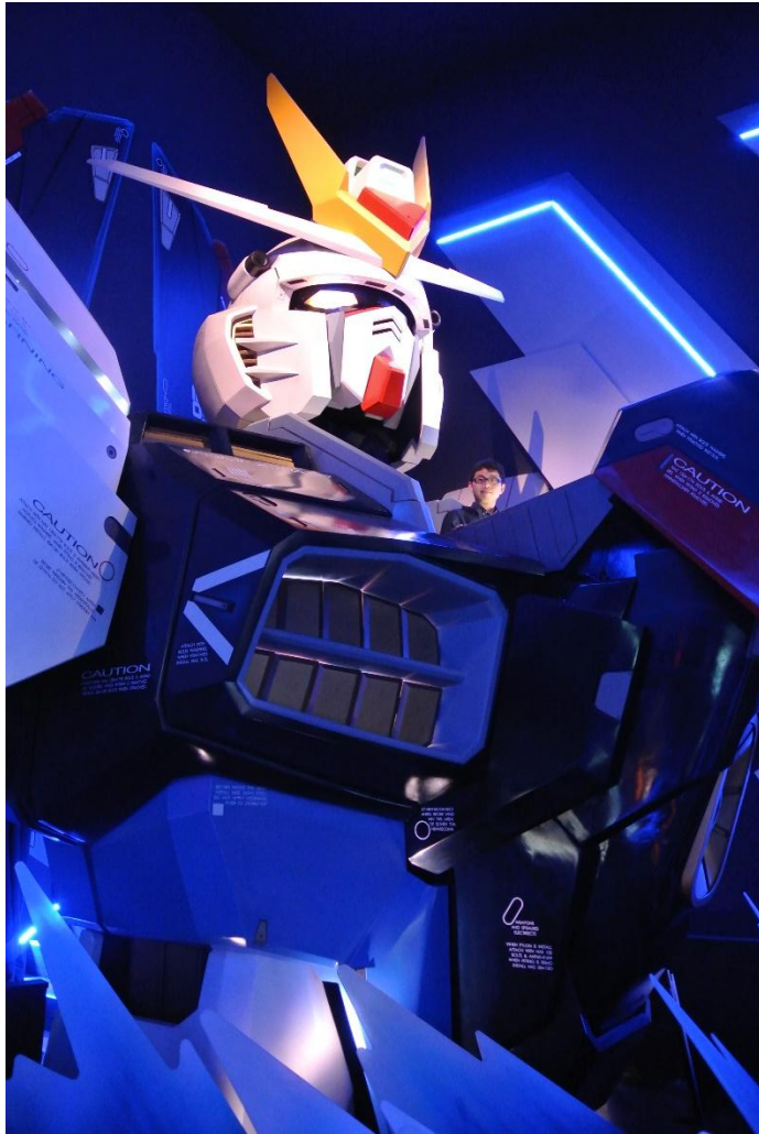
(我與自由鋼彈 地點: 台場 Diver City Tokyo 日期:2016/4/29)