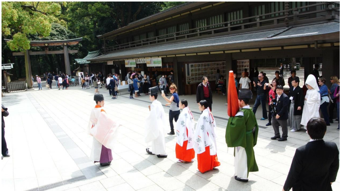
(日式婚禮 2 地點:明治神宮 日期:2016/4/10)