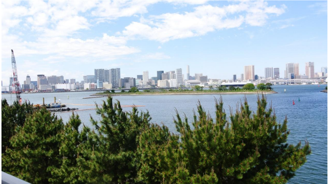
(台場風景 地點:台場觀望台 日期:2016/4/29)