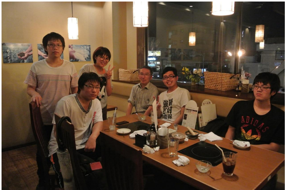
(謝謝招待 地點:牛角 日期:2016/7/15)