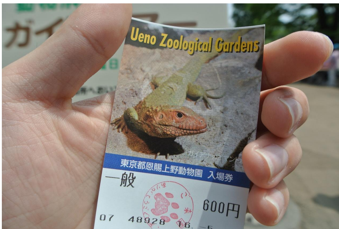
(動物園門票 地點:恩賜上野動物園 日期:2016/5/03)