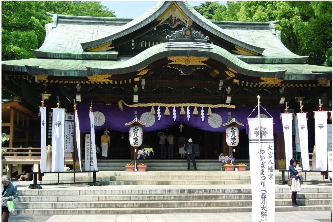
(八幡神社 地點:八幡神社 日期:2016/5/01)