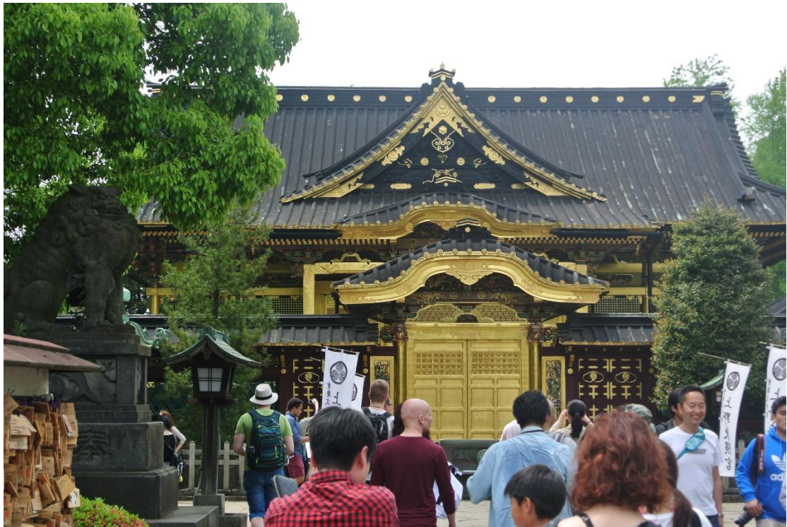
(上野東照宮 地點:上野恩賜公園)

「對於你而言，想像中的日本房子是長怎麼樣呢？」，這是課堂上老師向我所提出的疑問。我不假以思索的回答。「有著榻榻米跟紙門，以及庭院的木式房屋。」，老師只是點點頭後繼續上課。為了理解老師那「點點頭」的意義，下課後前往超市的途中，我開始觀察周遭的建築物，我發現到周遭的建築物，以民房為首，給我一種「不協調」的感覺。大眾印象中的「洋房」，都有著氣派或華麗的感覺，但日本的「洋房」卻給我一種「裝腔作勢」的感覺。從外觀來看，的確具備了洋房的基本條件，但十分擁擠，感覺就像是在那坪數不大的空間中，硬將洋房的一切塞進去一般。就像是沒有「基本」的條件，卻硬要呈現出「基本」的結果。除此之外，日本還有一個十分有趣的建築樣式，就是日式建築融合洋式建築的「附加體」，為什麼不是「混合體」而是「附加體」呢？因為看起來就是在日式建築的基本設計中把洋房「附加」上去而已。這就像是榻榻米的地板配上花俏的壁紙一樣，又或是洋式房間裡擺上一幅浮世繪一樣，給人一種不思考整體性，只是把東西加進去的「即興」創作一般。當然，如此「即興」的建築也為代表著日本曾經歷過的「戰爭」、「奇蹟」、「衰敗」的一大象徵。