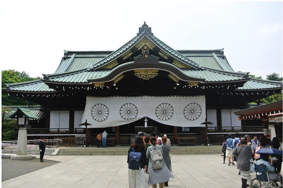
(靖國神社 地點:靖國神社 日期:2016/5/02)