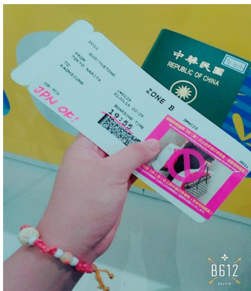
成田機場 回國 2016/07/31