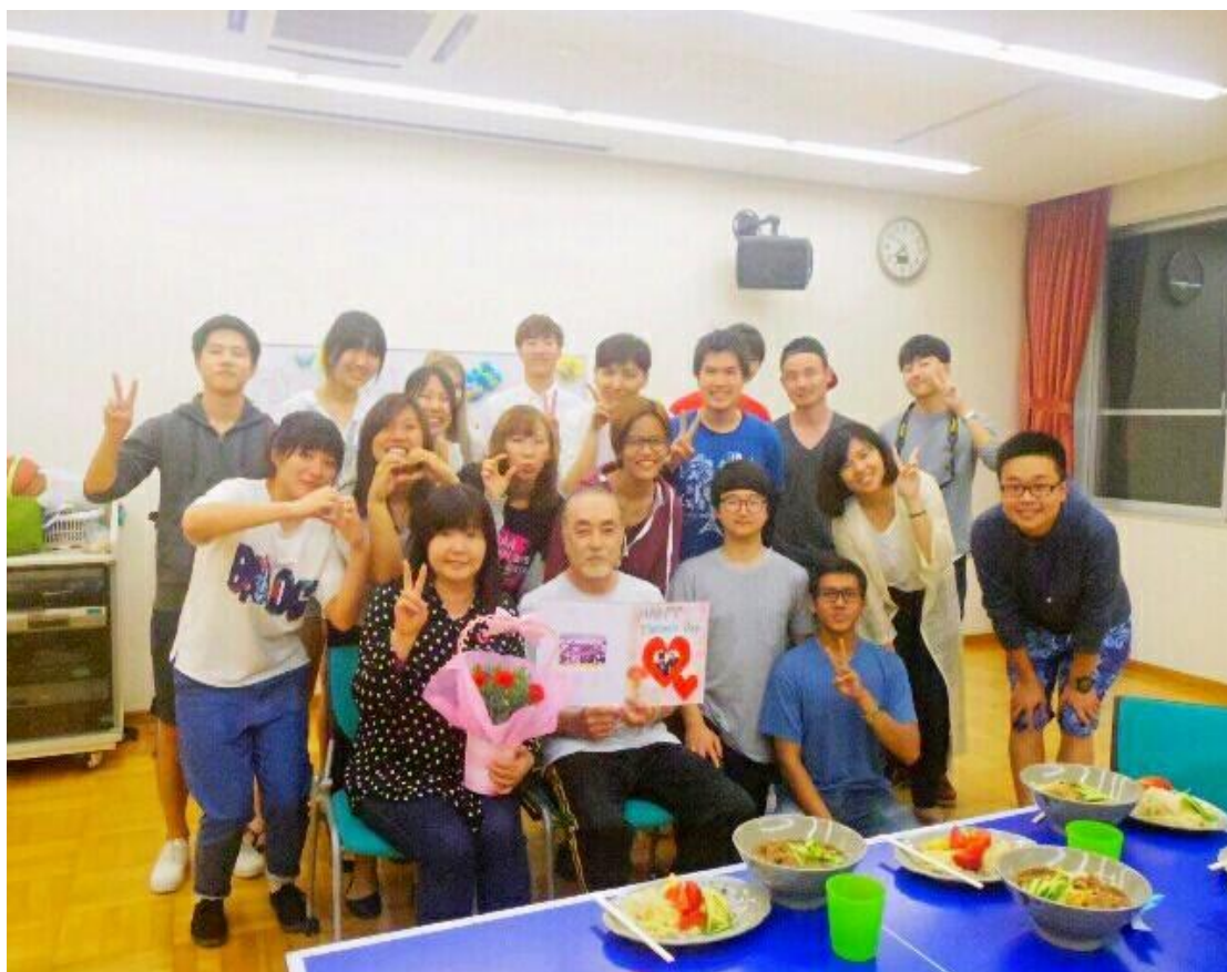
留學生宿舍 母の日 2016/05/07