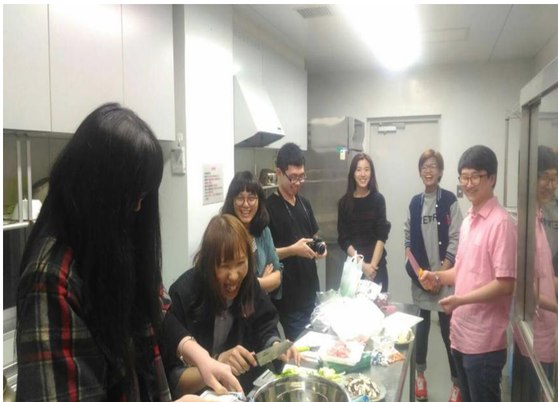
留學生宿舍餃子會 一起做 2016/04/10