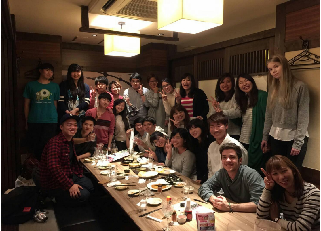
和民 聚會 2016/04/21