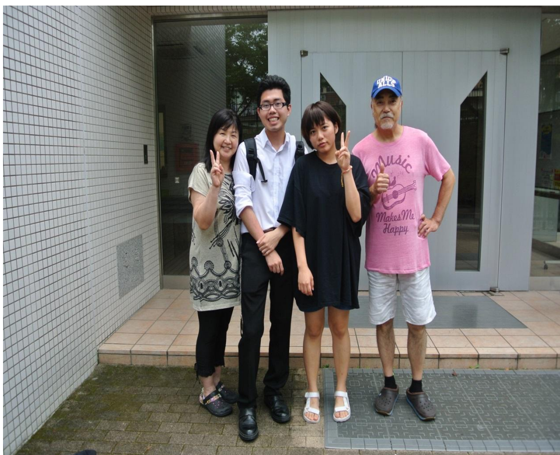
留學生宿舍前面 回國 2016/07/31