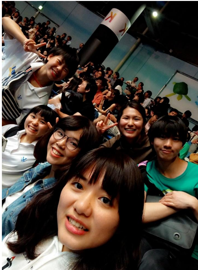
品川 水族館 2016/06/04