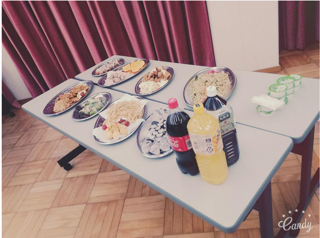
交換留學生宿舍 歡迎會 好吃的食物 2016/04/08