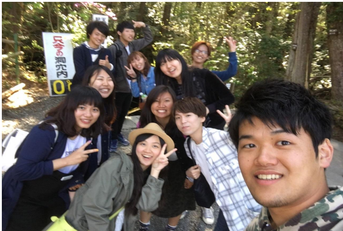
山梨 賞花 2016/04/29