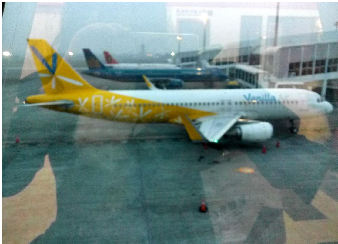
小港機場 第一次坐飛機 2016/04/01