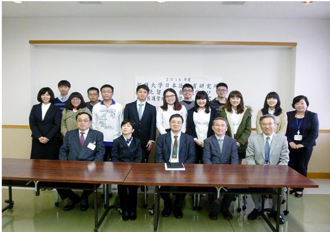
拓殖大學 始業式 樹人醫專 東吳大學 2016/04/08