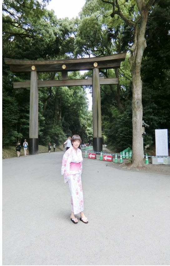
原宿 明治神宮 2016/08/28