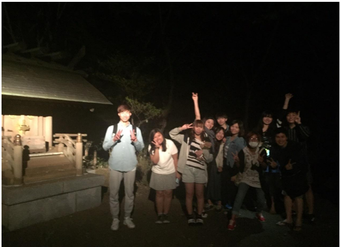
拓殖大學 夜遊神社 2016/05/06