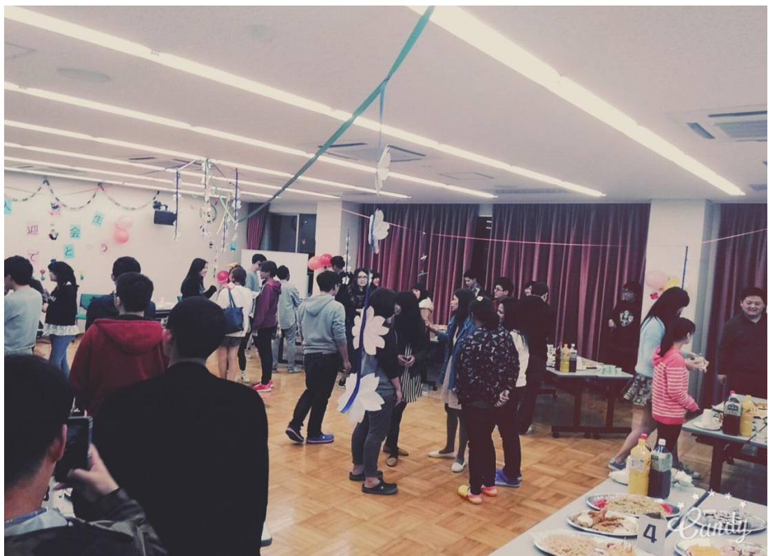
交換留學生宿舍 歡迎會 2016/04/08