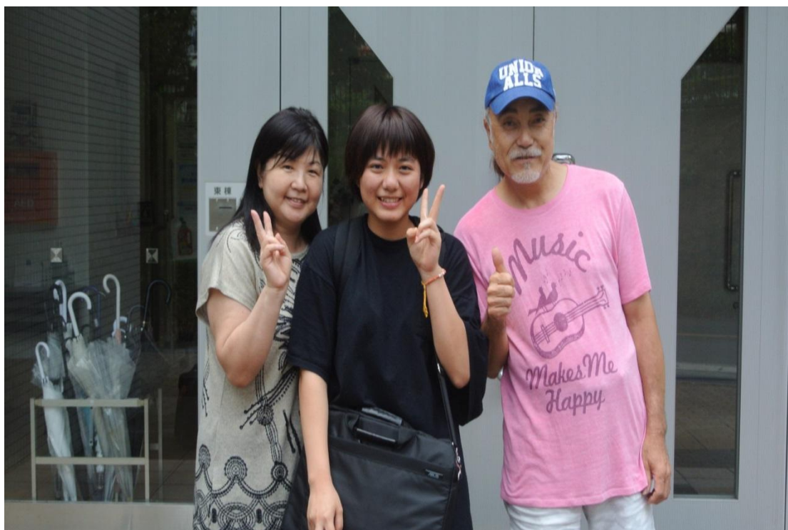
留學生宿舍前面 回國 2016/07/31