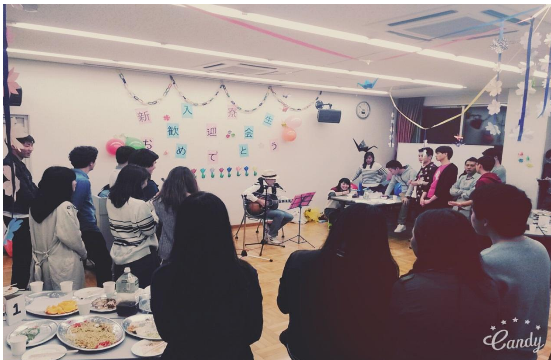
交換留學生宿舍 歡迎會 2016/04/08