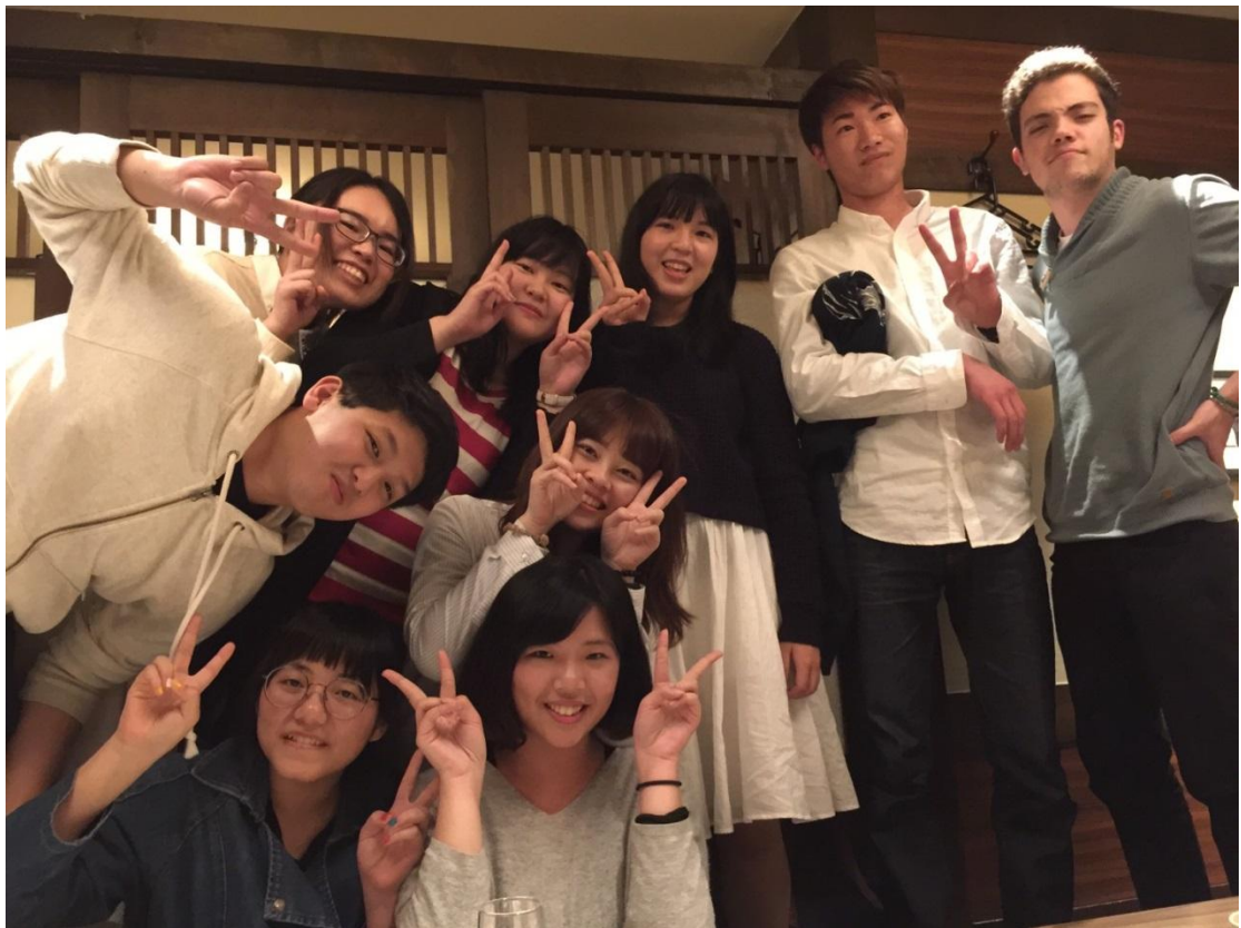
和民 聚會 2016/04/21