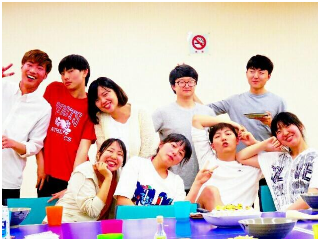
留學生宿舎 母の日 2016/05/07