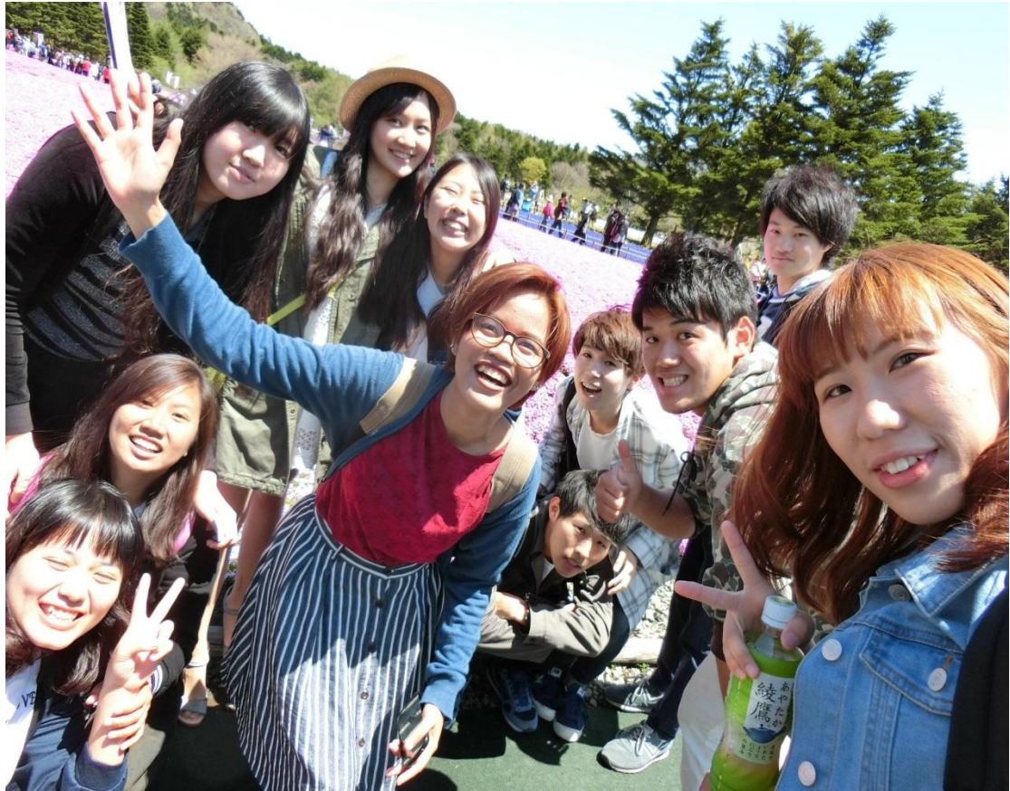
山梨 賞花 2016/04/29