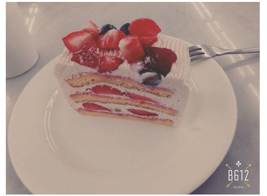
中野 體驗入學 做蛋糕 2016/06/12