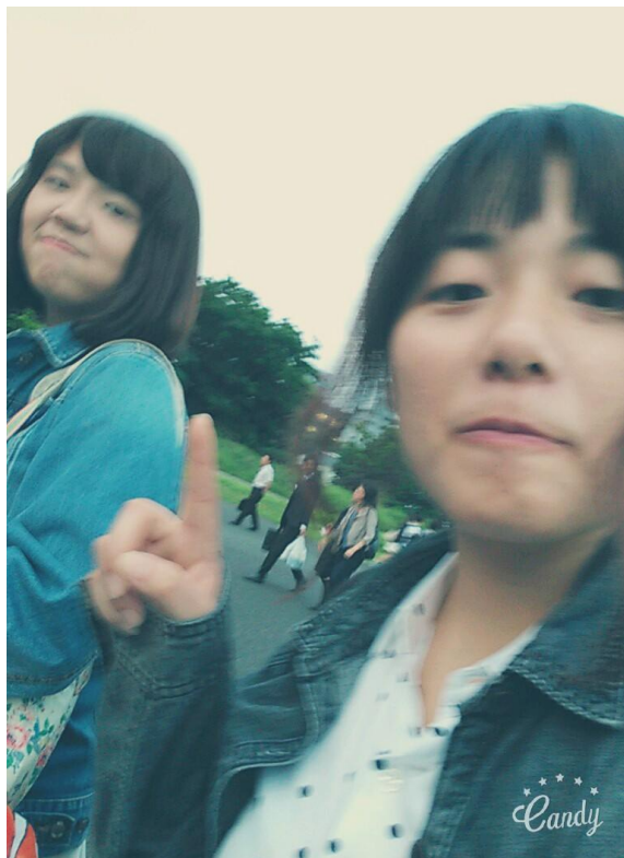
立川 食物展 2016/05/27