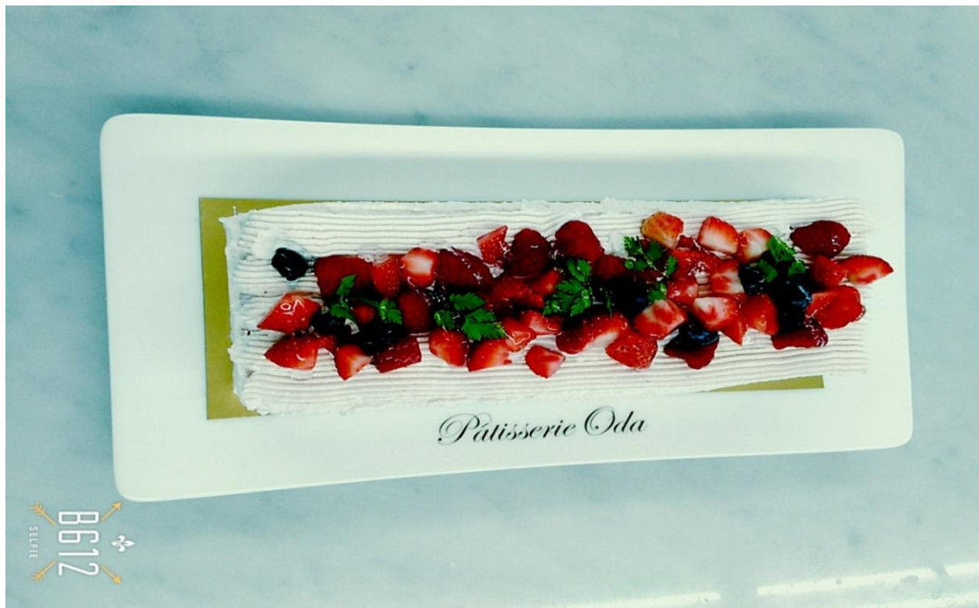
中野 體驗入學 做蛋糕 2016/06/12