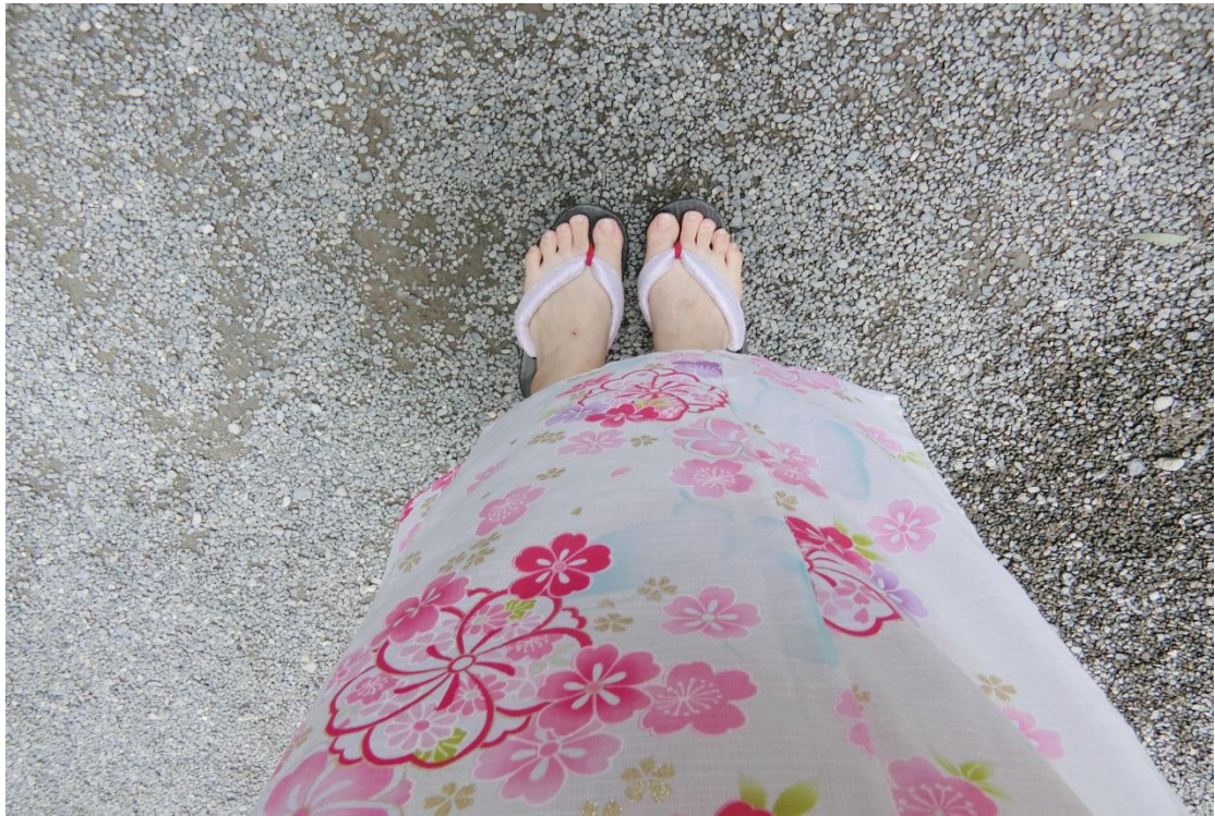
原宿 明治神宮 2016/08/28