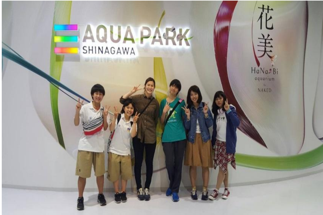
品川 水族館 2016/06/04