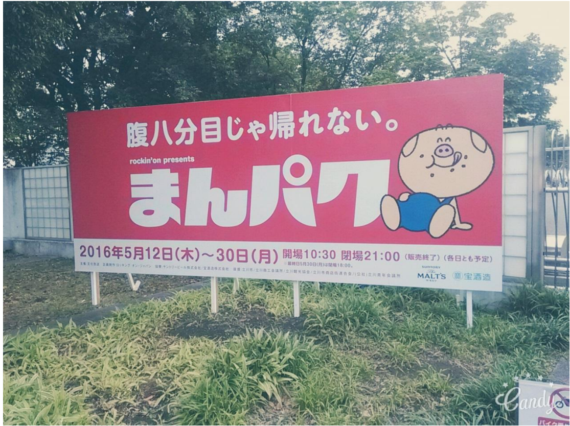
立川 食物展 2016/05/27