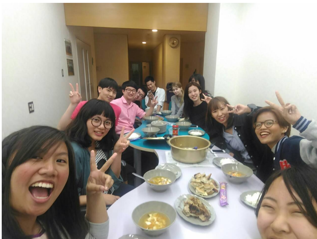
留學生宿舍餃子會 一起吃 2016/04/10