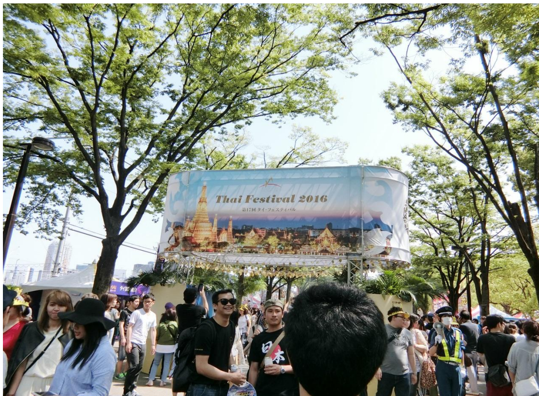
原宿 泰國料理展 2016/05/14