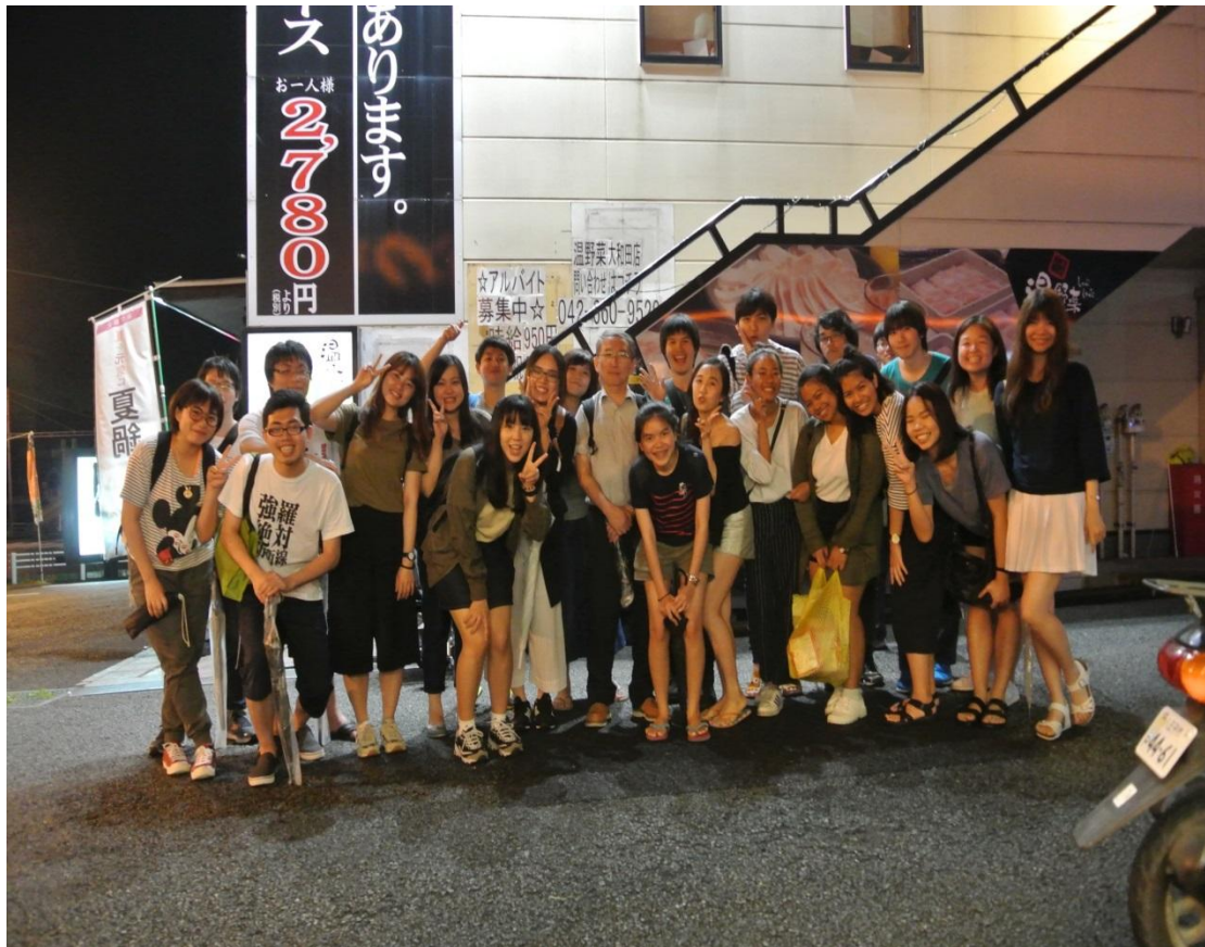
八王子 謝師宴 2016/07/15