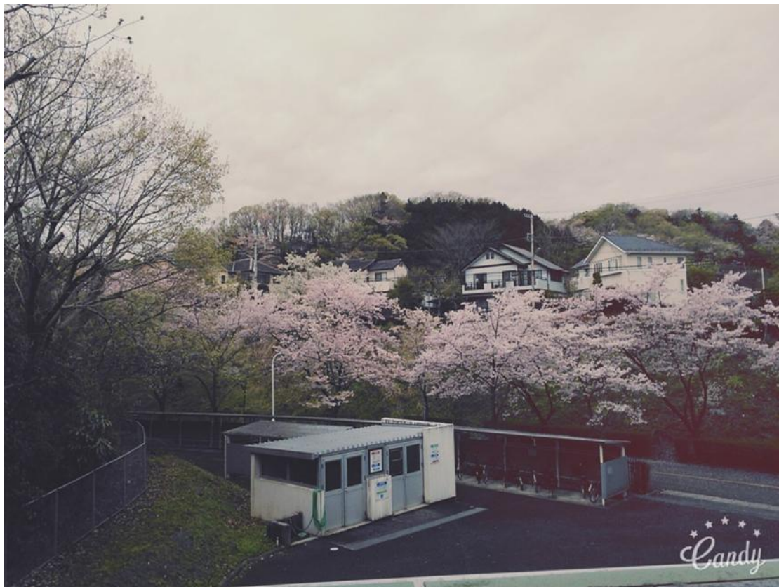
留學生宿舍的窗外 櫻花 2016/04/08