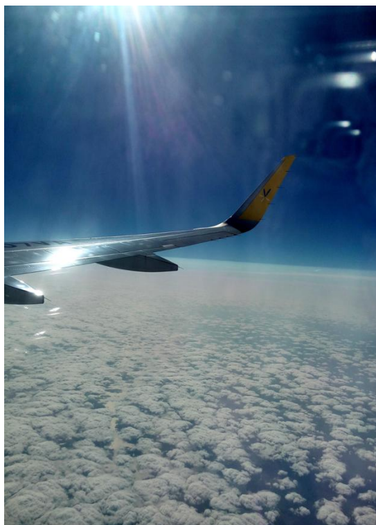
小港機場 出發 抵達 2016/04/01