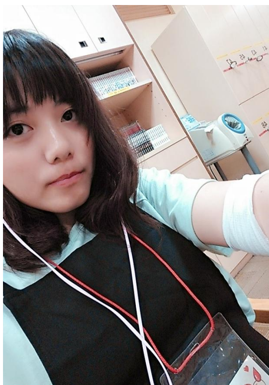
立川 捐血 2016/05/24