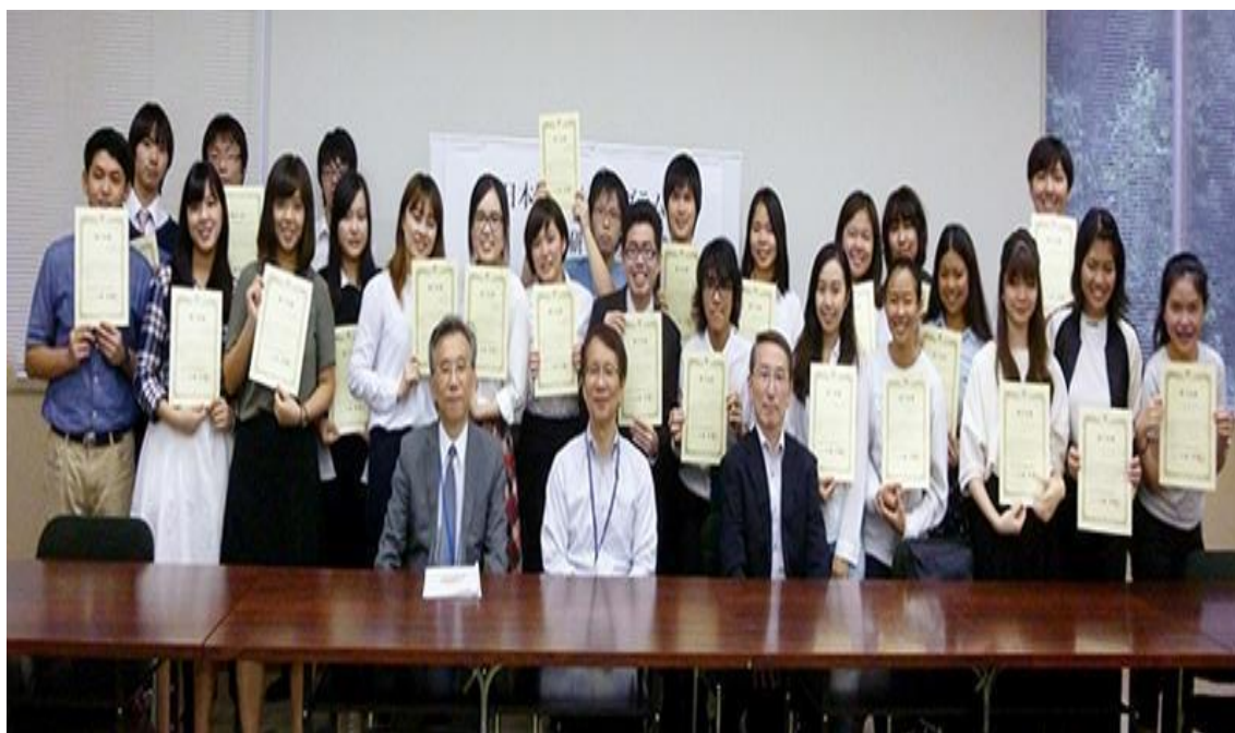
拓殖大學 結業式 樹人醫專 東吳大學 泰國大學 2016/07/27