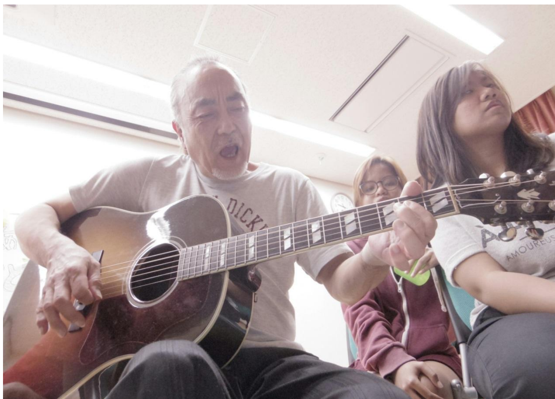
留學生宿舎 母の日 舎監 お父さん 2016/05/07