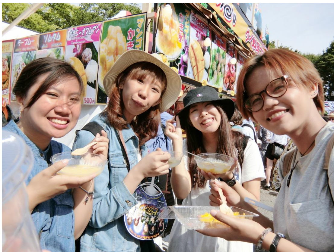
原宿 泰國料理展 2016/05/14