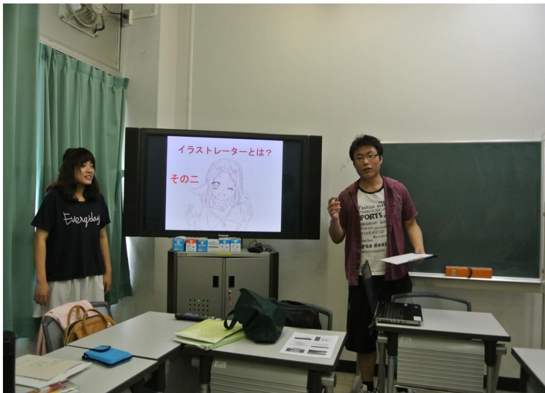
拓殖大學 報告発表 2016/05/20