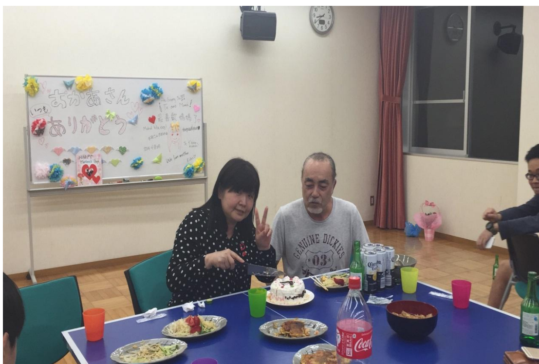
留學生宿舍 母の日 舎監 お母さんとお父さん 2016/05/07