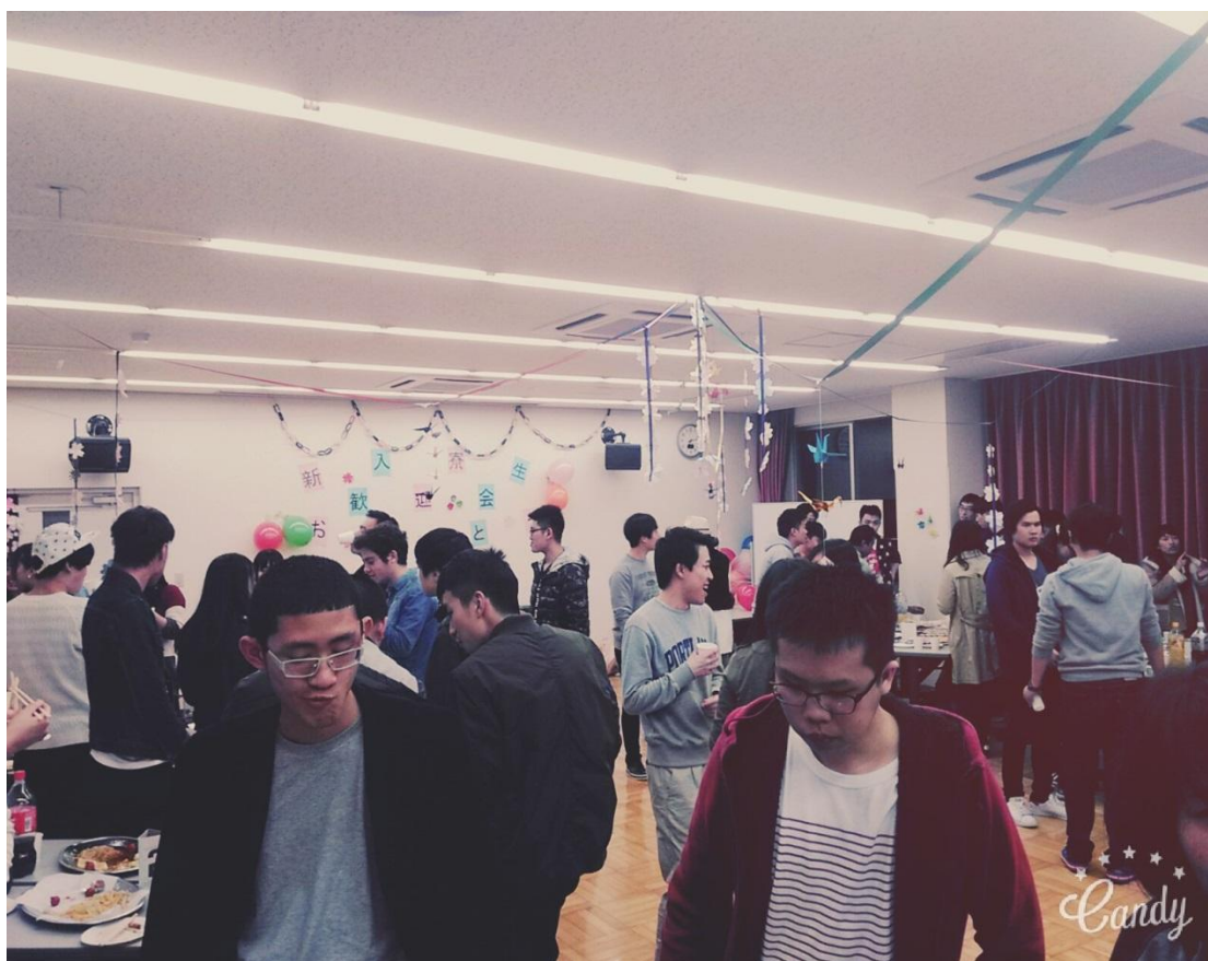
交換留學生宿舍 歡迎會 2016/04/08