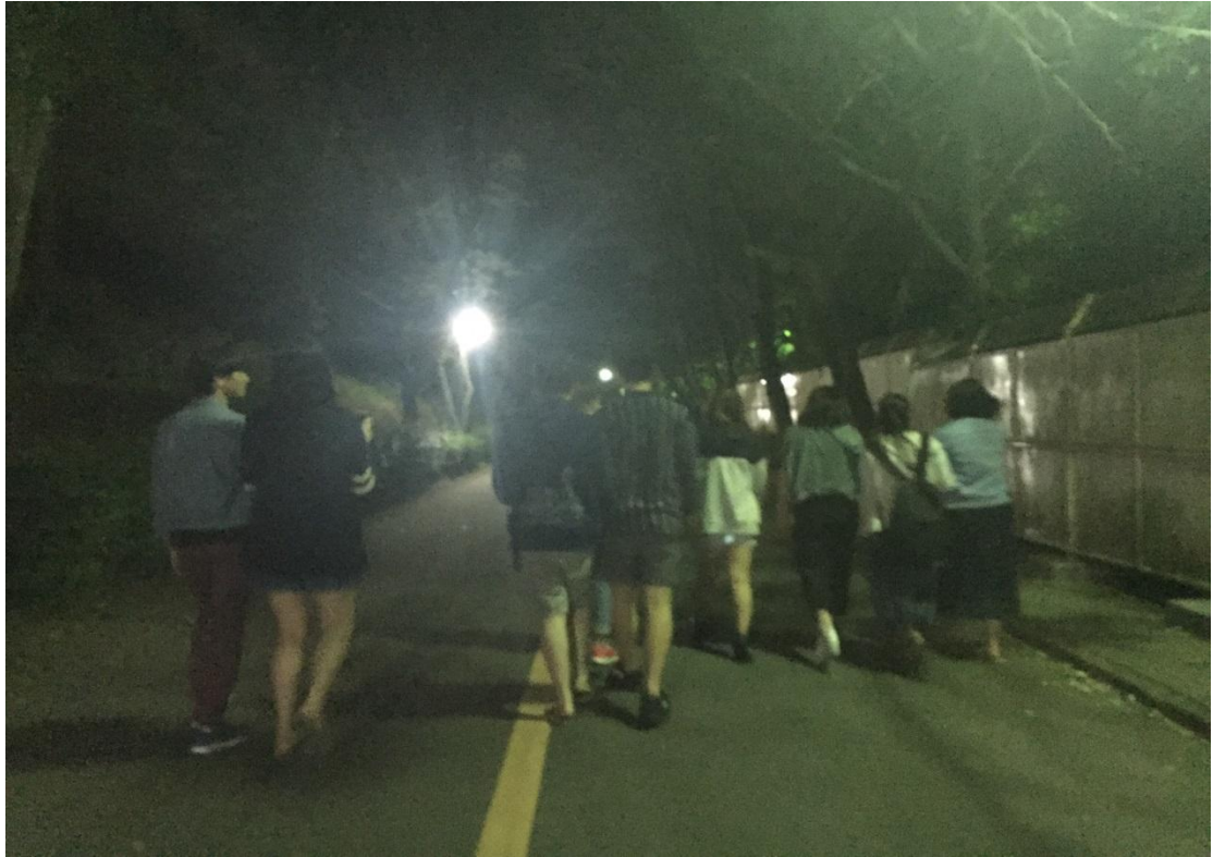
拓殖大學 夜遊神社 2016/05/06