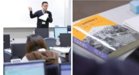
政經學院包括政治法律系. 經濟系