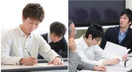
商學院包括經營系. 國際商務系. 會計系