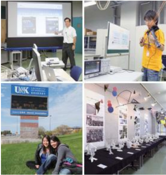
工學院包括機械. 通信. 系統系. 信息. 設計. 媒體系