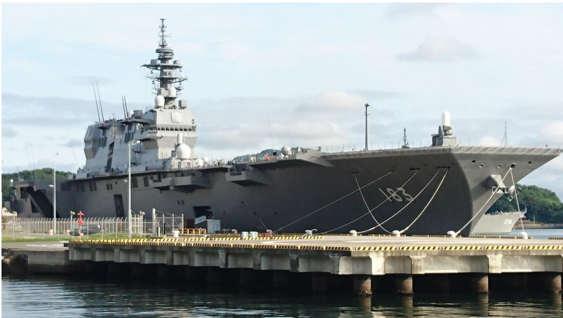
停在港口的いずも(105/7/28)