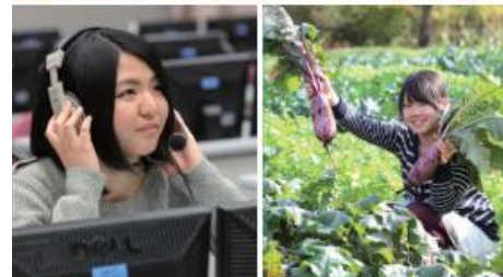
國際學院包括經濟. 政治. 觀光. 文化. 農業綜合課程