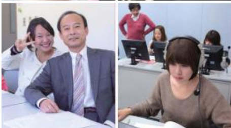
外國語學院包括英文系. 中文系. 西班牙語系