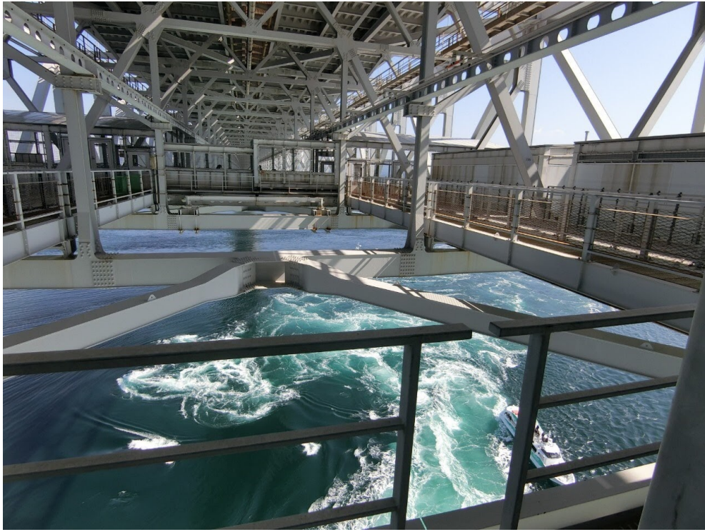
說明：德島-鳴門漩渦（2020/02/24）