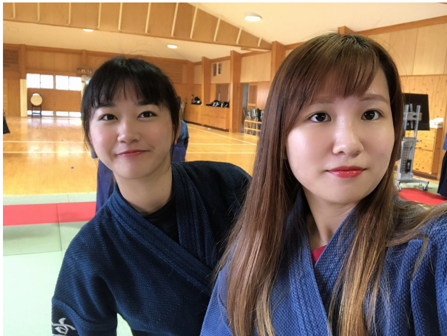
說明：學校選修體育劍道課（2019/10/31）