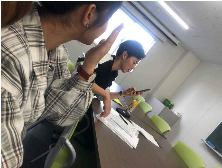
說明：跟日本同學討論期中報告（2019/10/29）