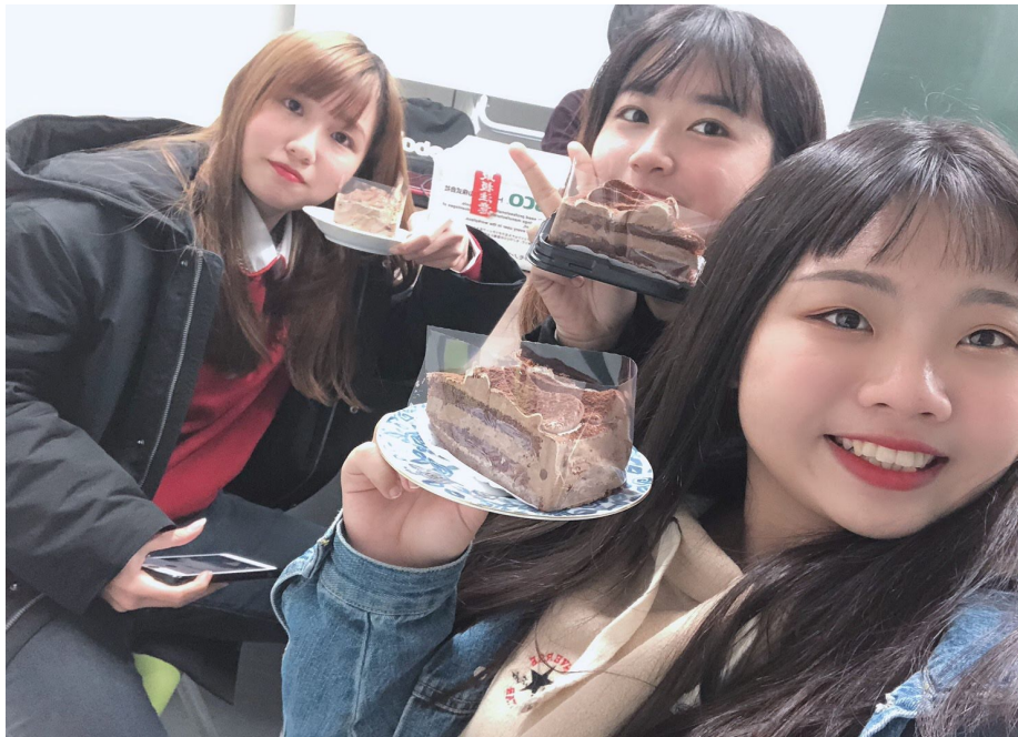
說明：和ゼミ的朋友一起慶祝聖誕節（2019/10/26）