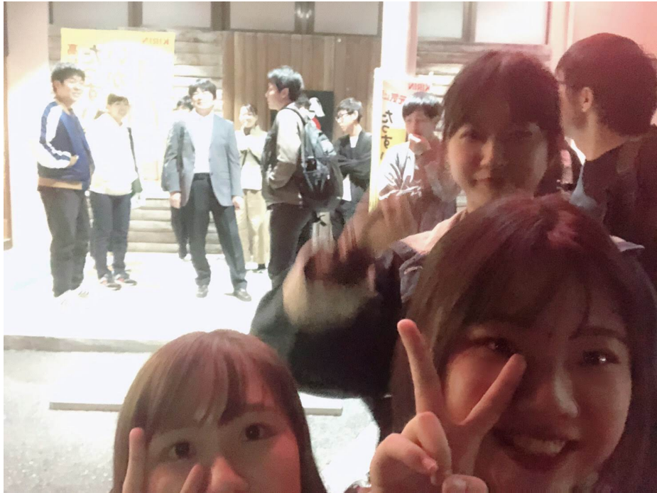
説明：ゼミ新生歓迎會（2019/11/5）