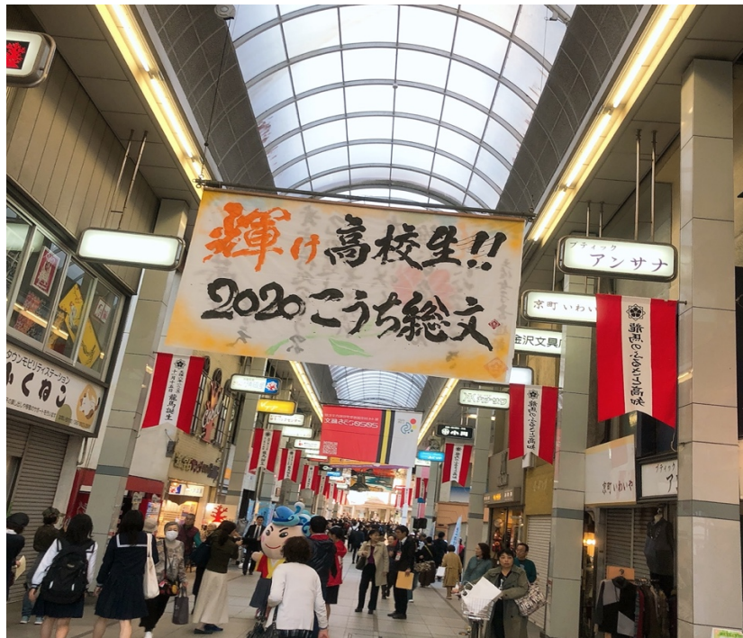
説明：高知総文祭典（2020/11/09）