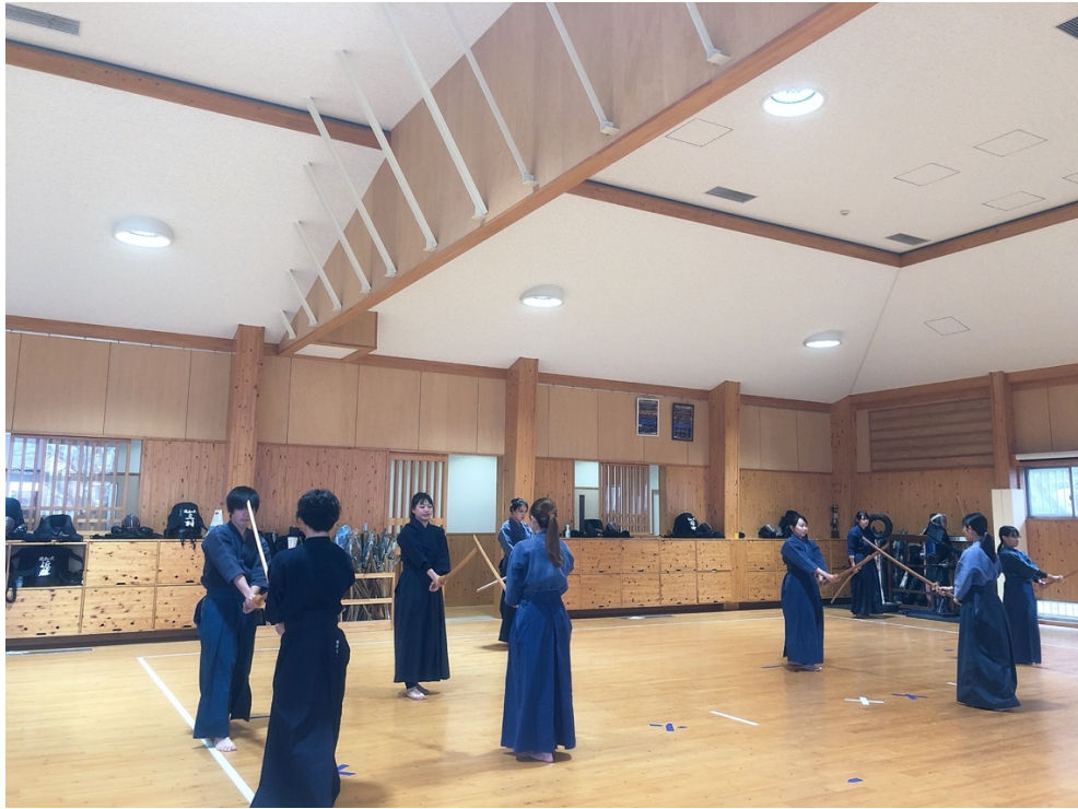
說明：學校選修體育劍道課（2019/10/31）