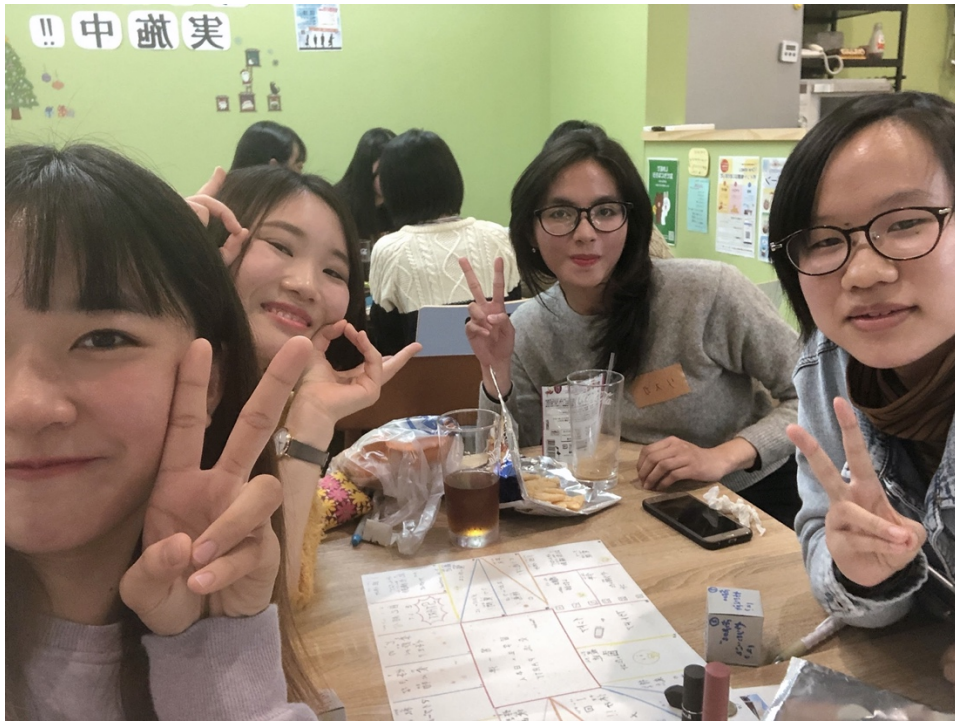
說明：參加國際茶屋的活動（2019/12/11）