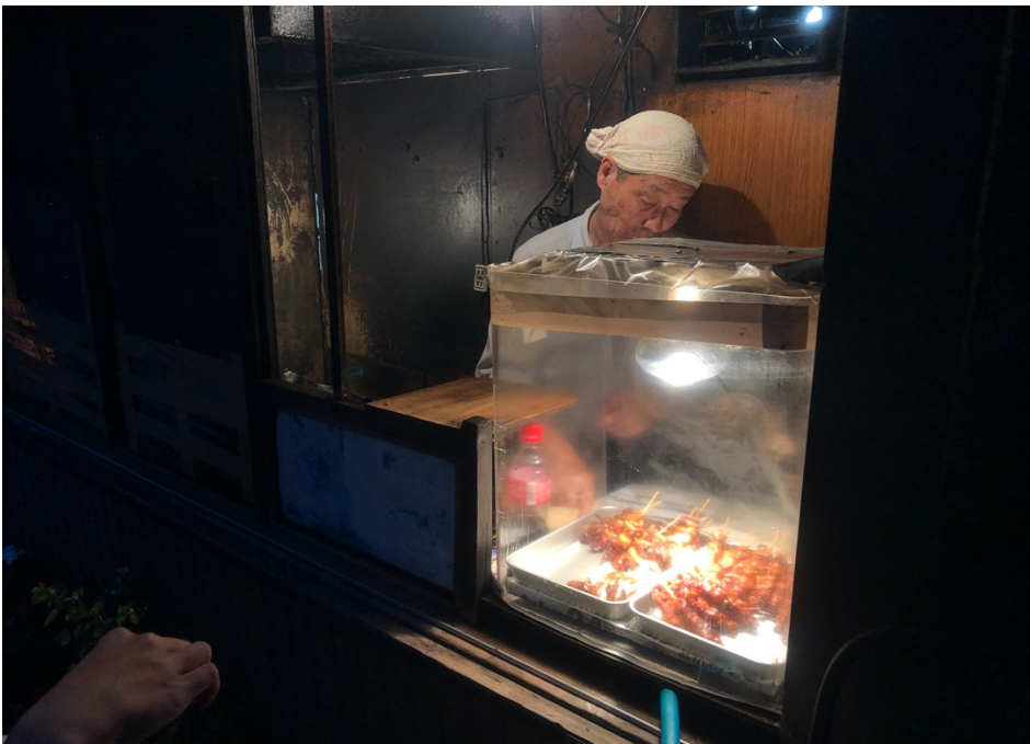
説明：學校附近一間很好吃的やきとり（2019/09/24）