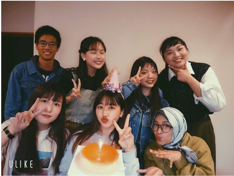
說明：在朋友家慶生（2020/03/29）