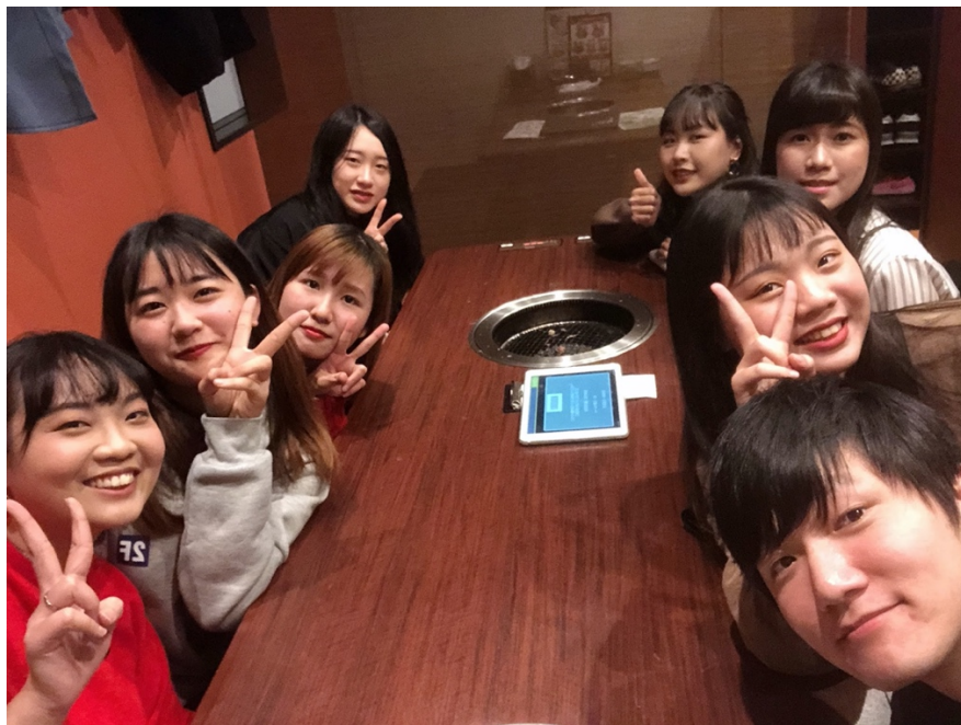
説明：過年時和台灣留學生一起吃牛角 (2020/01/24)