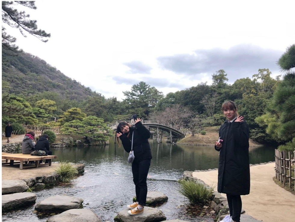
説明：高松-栗林公園（2020/12/30）