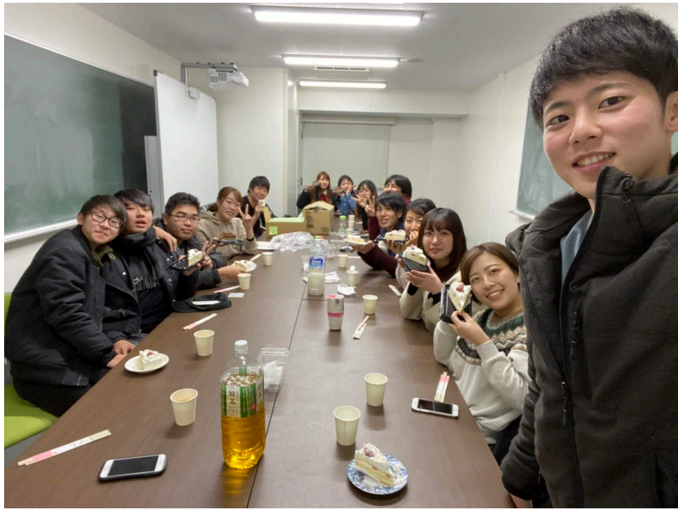
說明：和ゼミ的朋友一起慶祝聖誕節（2019/10/26）