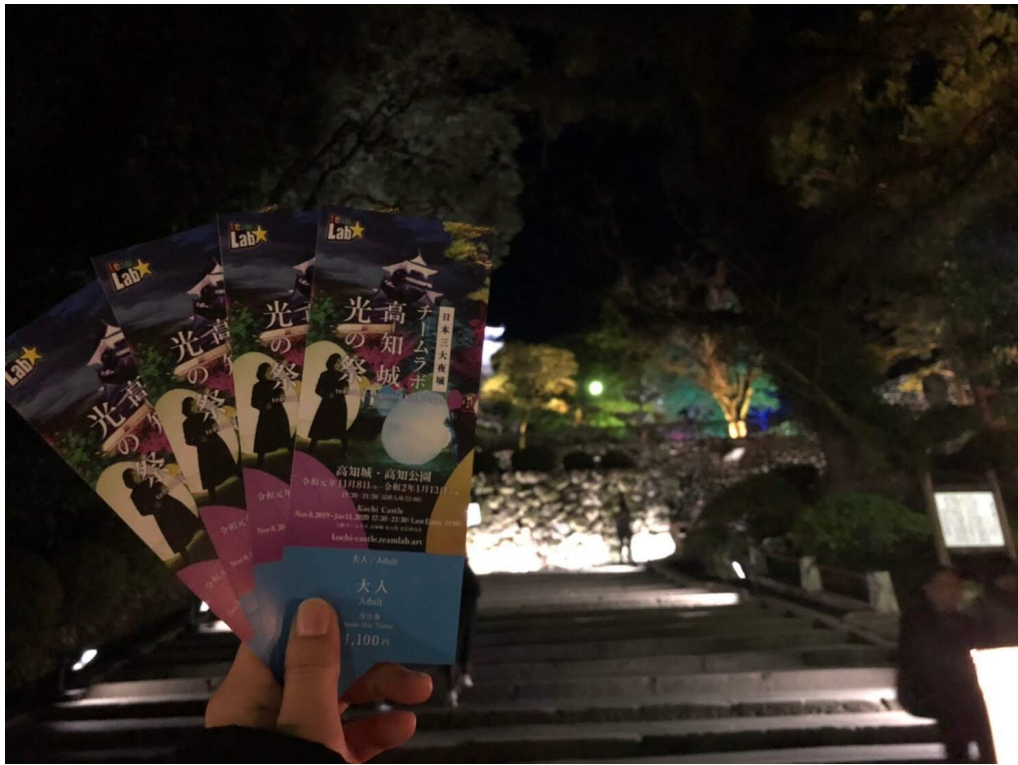
説明：高知城光之祭（2020/01/02）