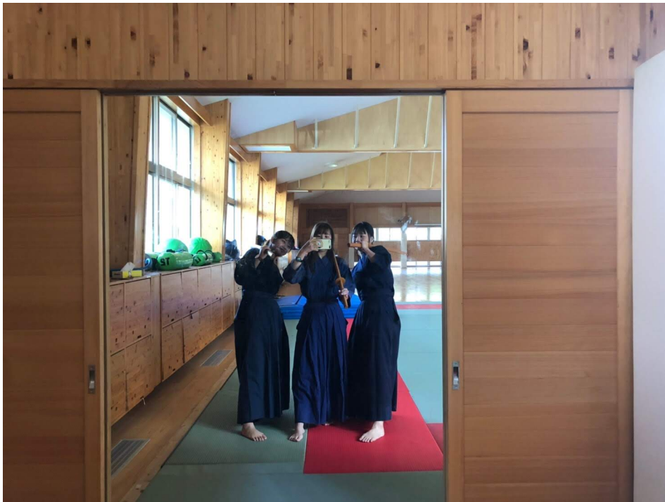
説明：學校選修體育劍道課（2019/10/31）