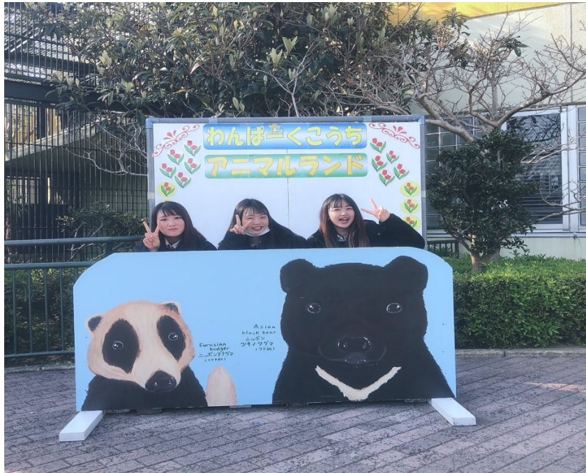
説明：市區附近的小型動物園（2020/03/04）