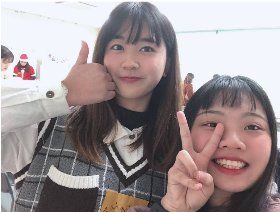
說明：國際茶屋辦的聖誕活動，和學校附近小朋友一起做蛋糕（2019/10/25）