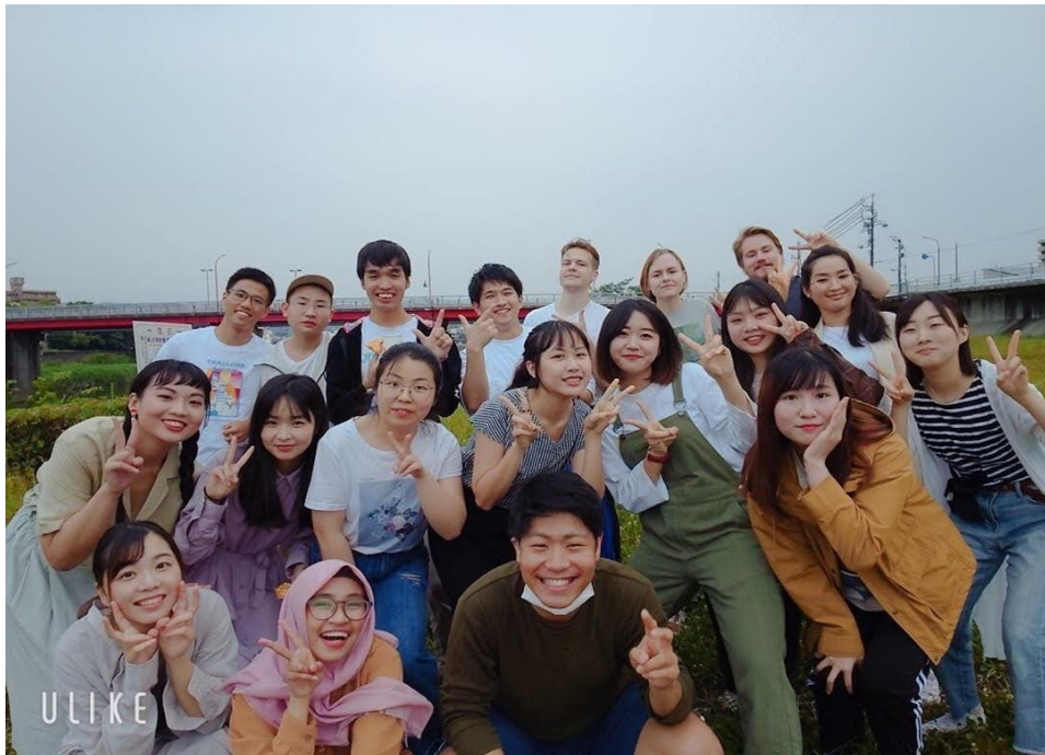
說明：和其他外國留學生們野餐、放煙火（2020/06/06）