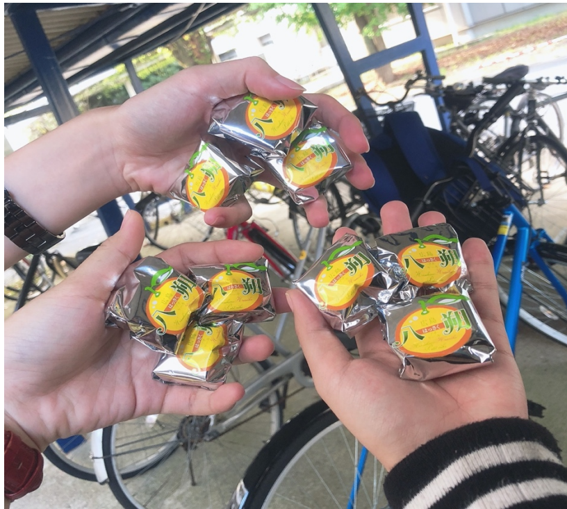
說明：第一次跟指導老師見面時，老師給的（2019/09/25）