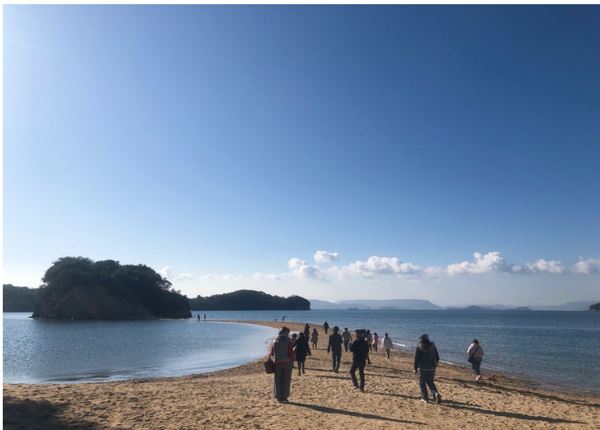
說明：小豆島-天使之路（2020/12/28）