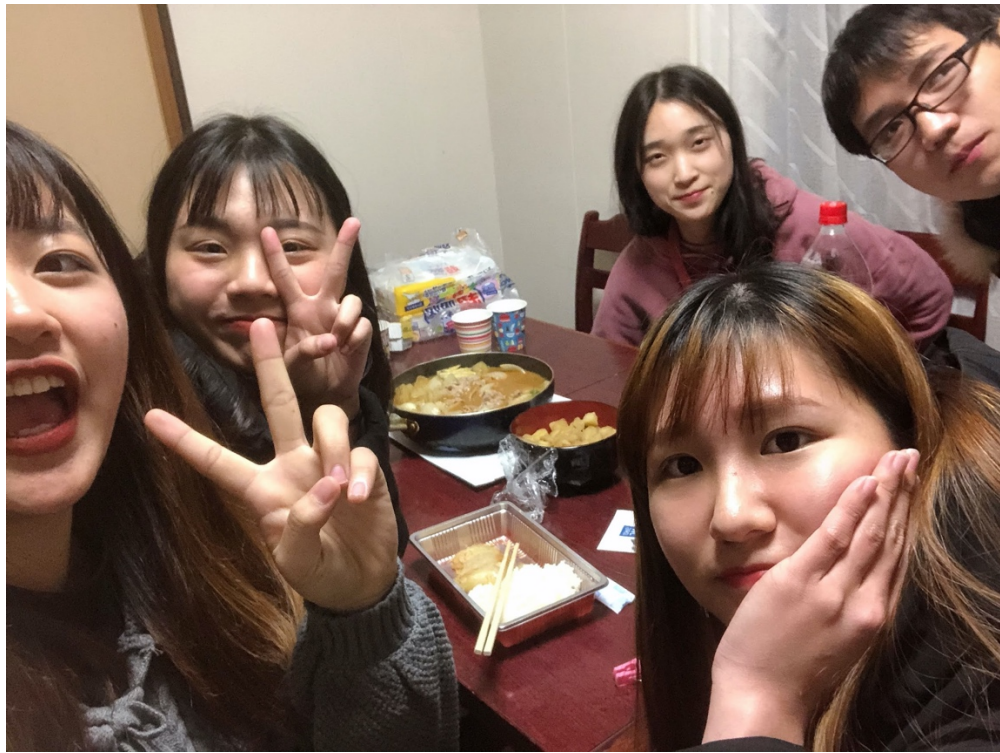
說明：期末和留學生一起吃飯（2020/02/28）