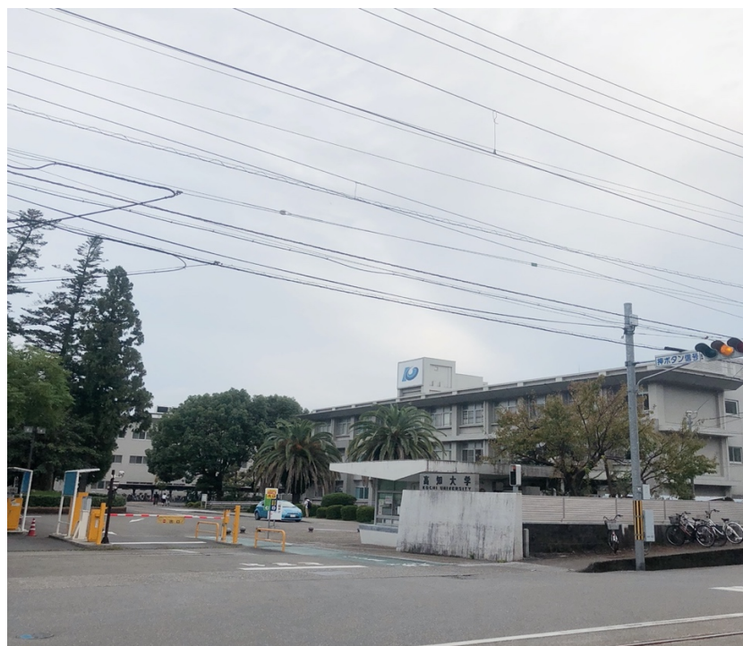
說明：高知大學門口(2019/09/20)