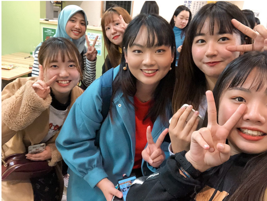
說明：參加國際茶屋的活動（2019/12/11）