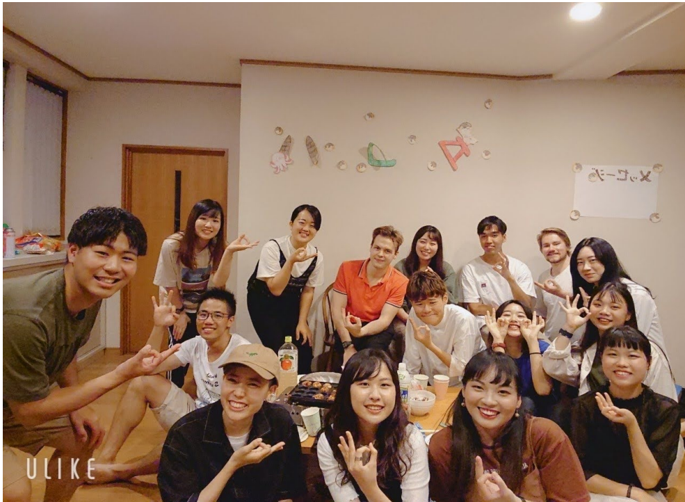
說明：在朋友家辦的章魚燒派對（2020/07/18）