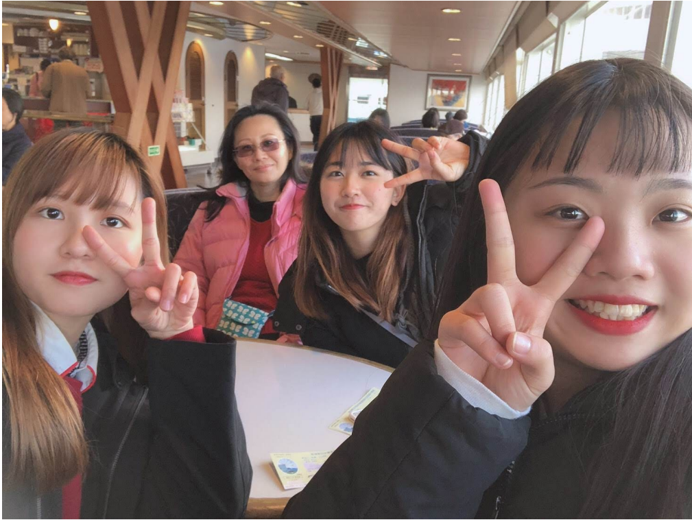
說明：寒假坐船去小豆島玩（2020/12/28）