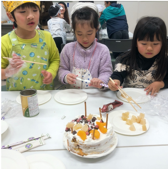
說明：國際茶屋辦的聖誕活動，和學校附近小朋友一起做蛋糕（2019/10/25）