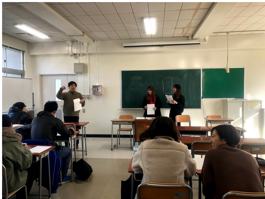
說明：期中上台報告（2020/12/16）