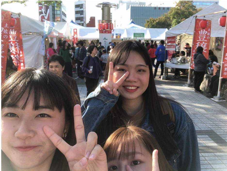
説明：土佐豊穰祭典（2019/11/09）