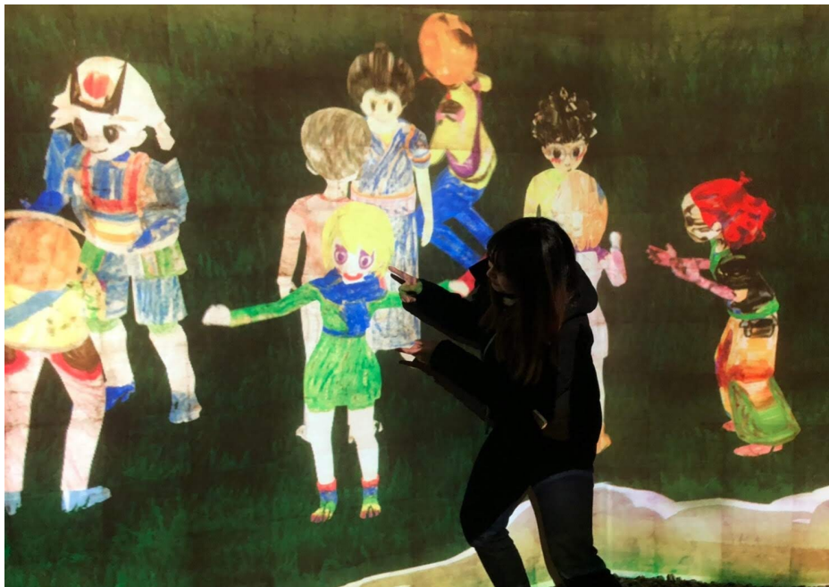
説明：高知城光之祭（2020/01/02）