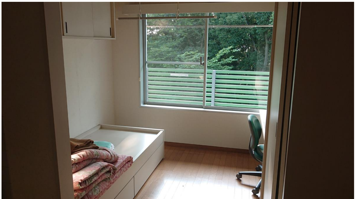
説明：宿舎房間。( 107 / 04 / 04 )