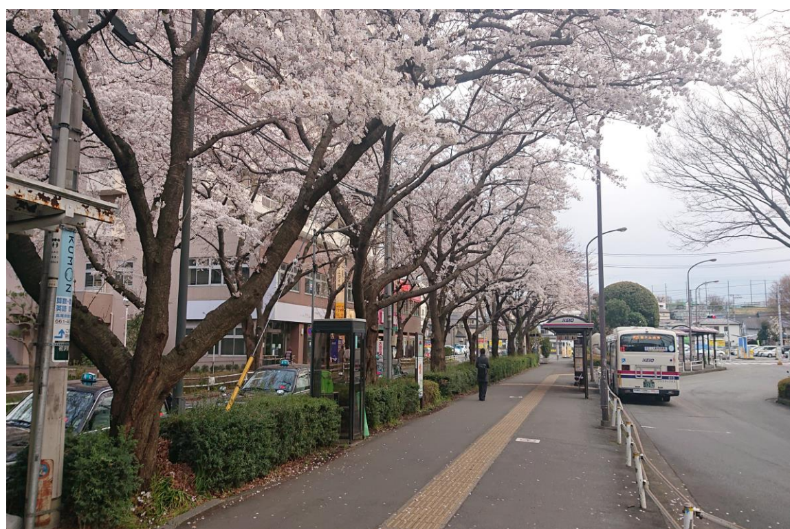
説明：高尾駅外。( 107 / 04 / 01 )