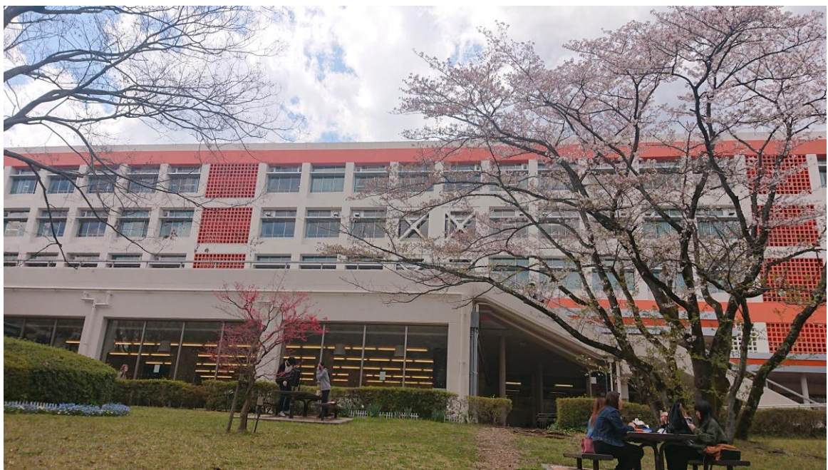
説明：拓殖大學校園。( 107 / 04 / 08 )