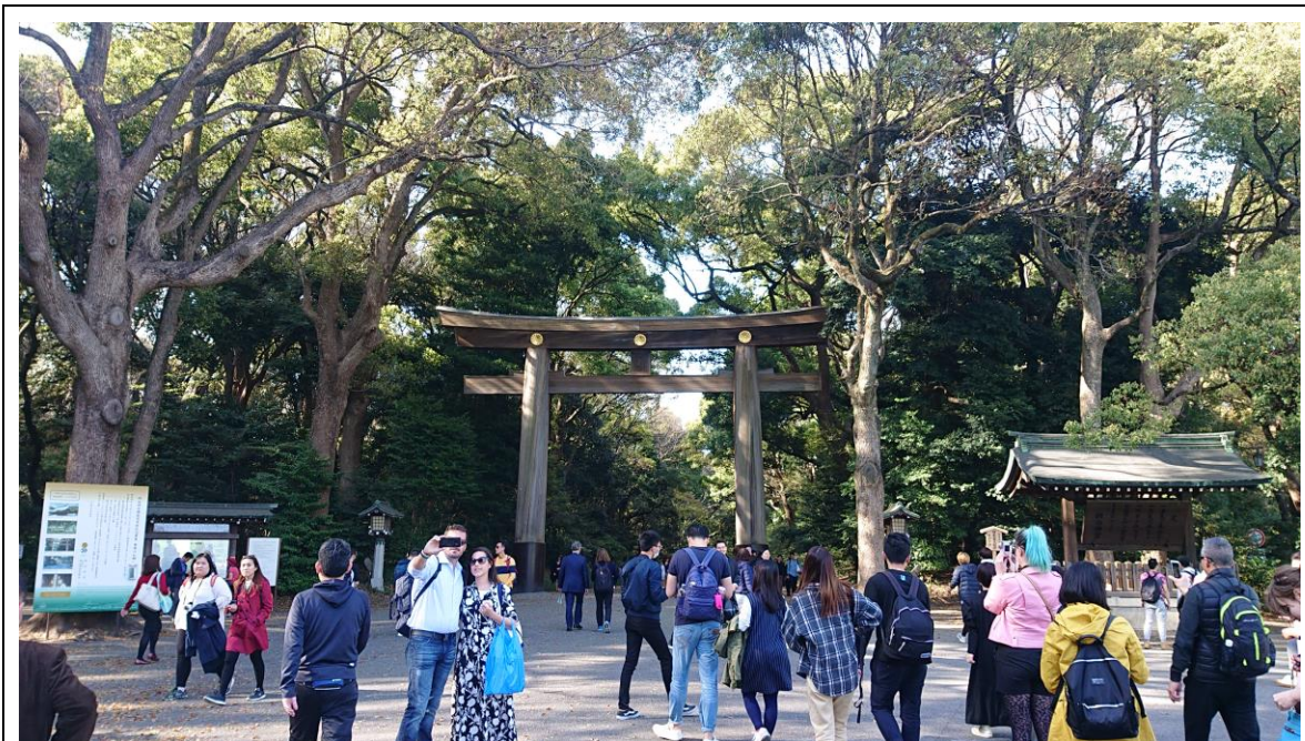
説明：代代木公園。( 107 / 04 / 05 )