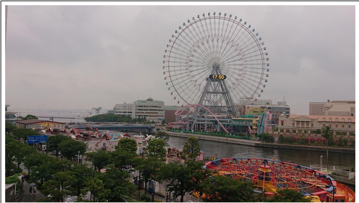
說明：橫濱。( 107 / 06 / 13 )