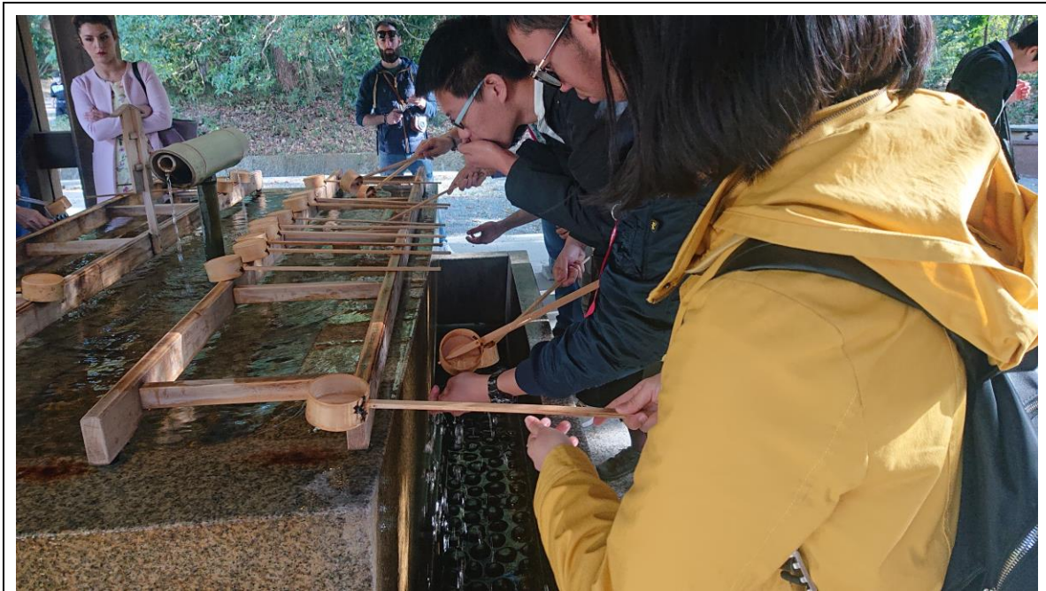
説明：代代木公園手水舎。( 107 / 04 / 05 )