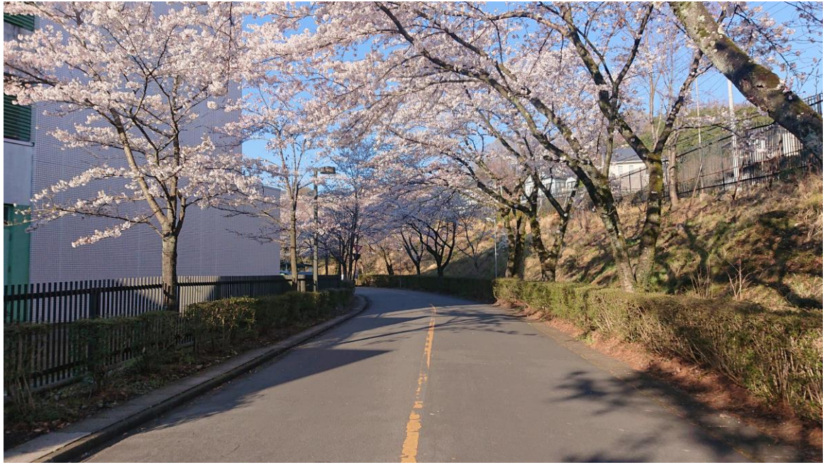
説明：宿舎外部通往學校必經之路。( 107 / 04 / 03 )