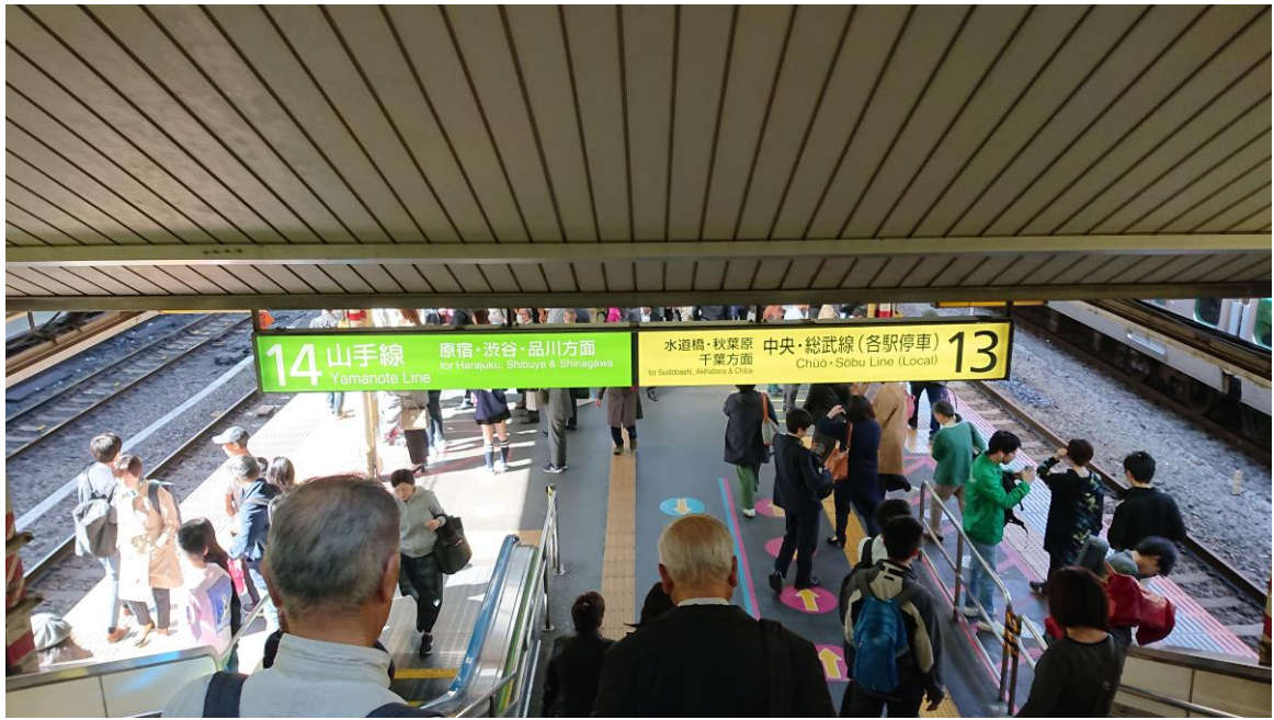
説明：新宿車站轉山手線。( 107 / 04 / 08 )