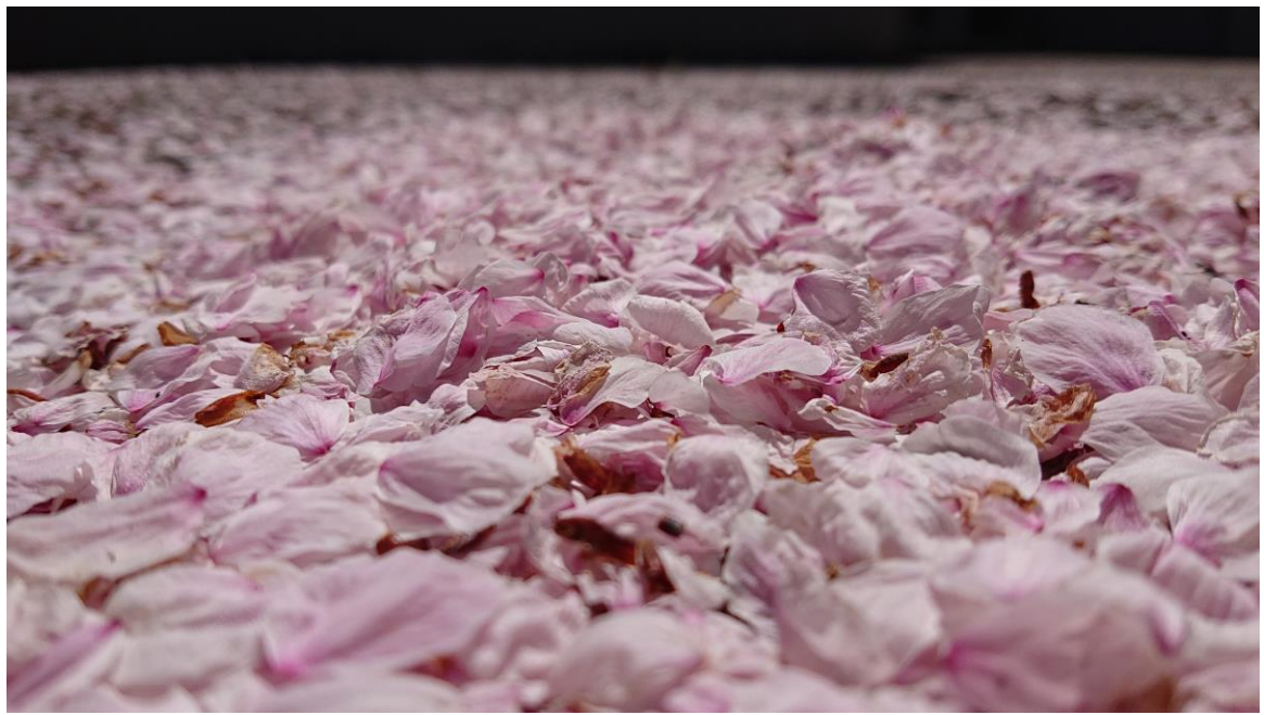
說明：宿舍外部落櫻。( 107 / 04 / 10 )