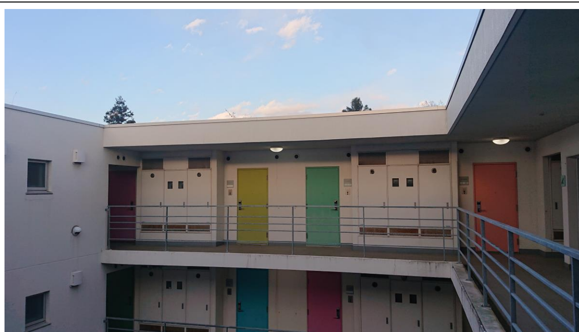
説明：宿舎房間。( 107 / 04 / 01 )