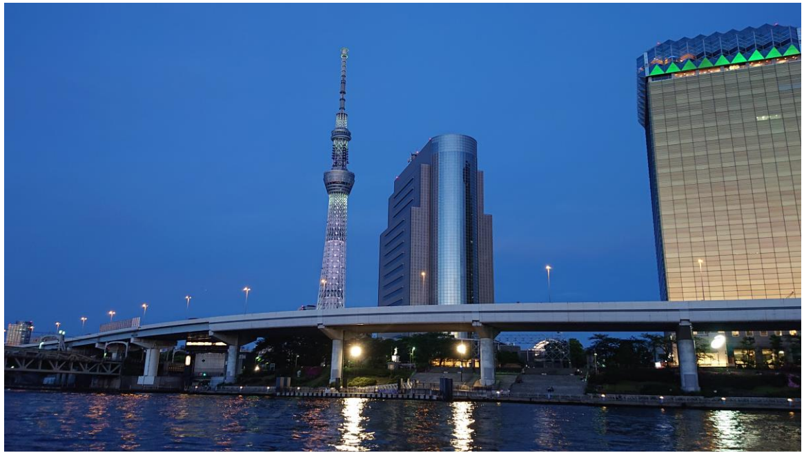
說明：晴空塔。( 107 / 05 / 02 )