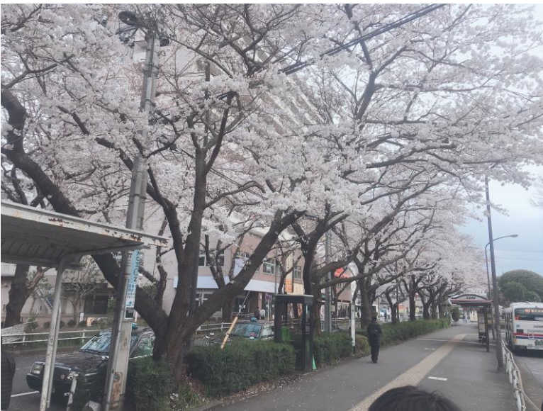
說明：高尾車站櫻花(2019/4/1)