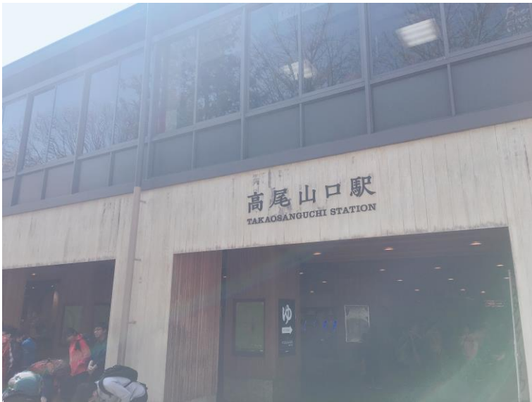
說明:高尾山口車站(2019/4/20)