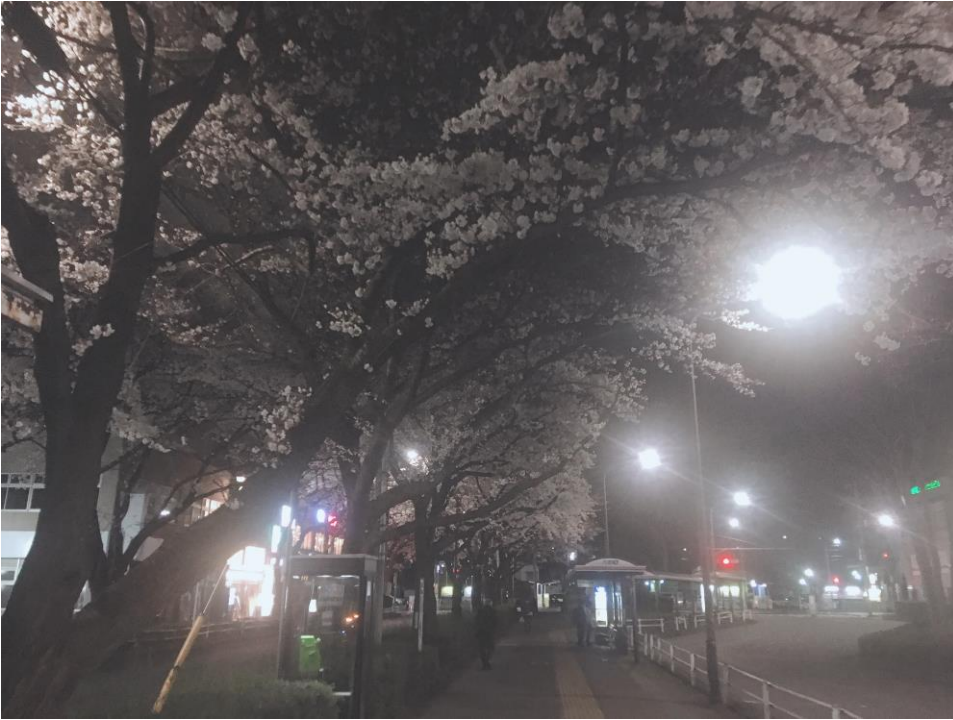
説明： 晚上高尾車站櫻花(2019/4/2)