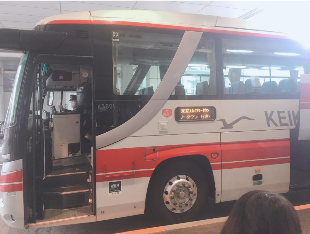
說明：剛到日北前往拓殖的巴士 (2019/4/1)