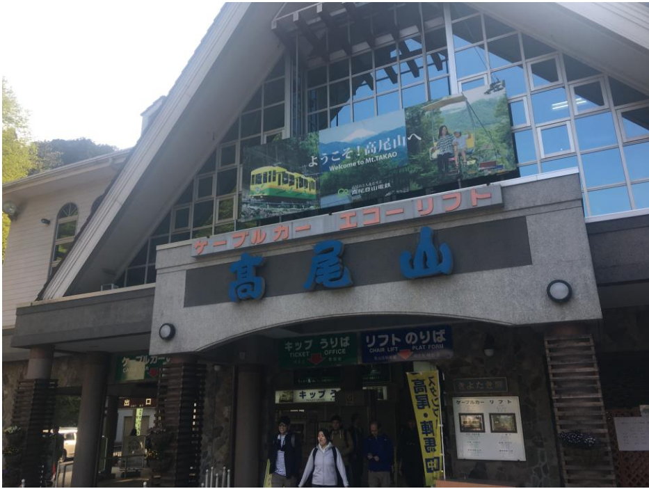
説明:高尾山纜車站(2019/4/20)