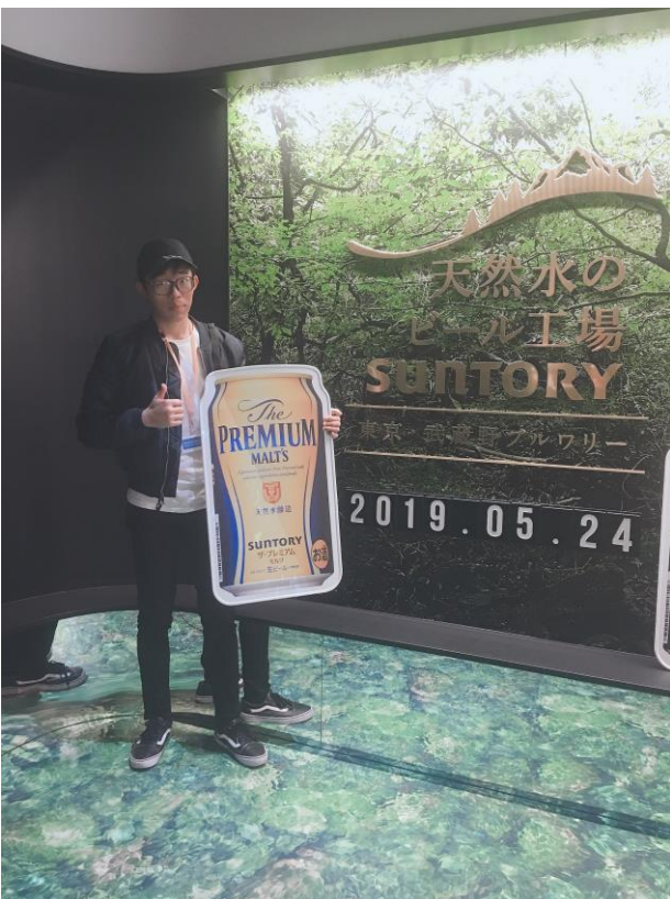
説明:啤酒工廠見習(2019/5/24)