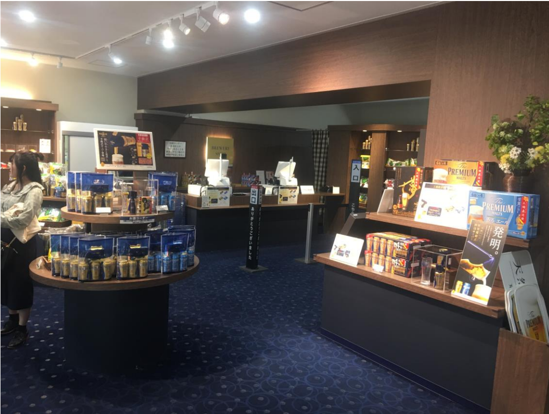
説明:啤酒工廠見習(2019/5/24)