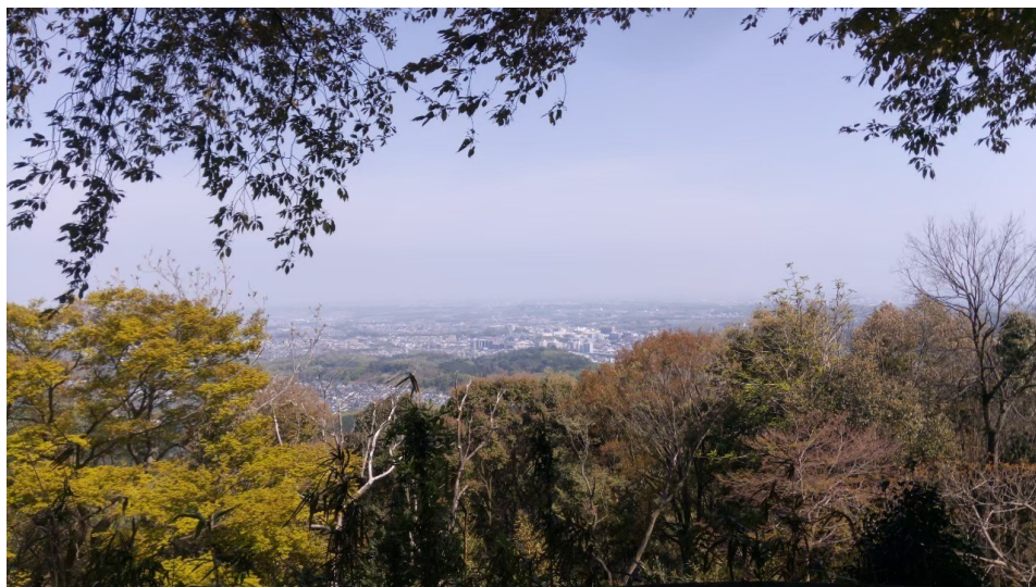
說明：八王子城蹟山頂(105/04/20)