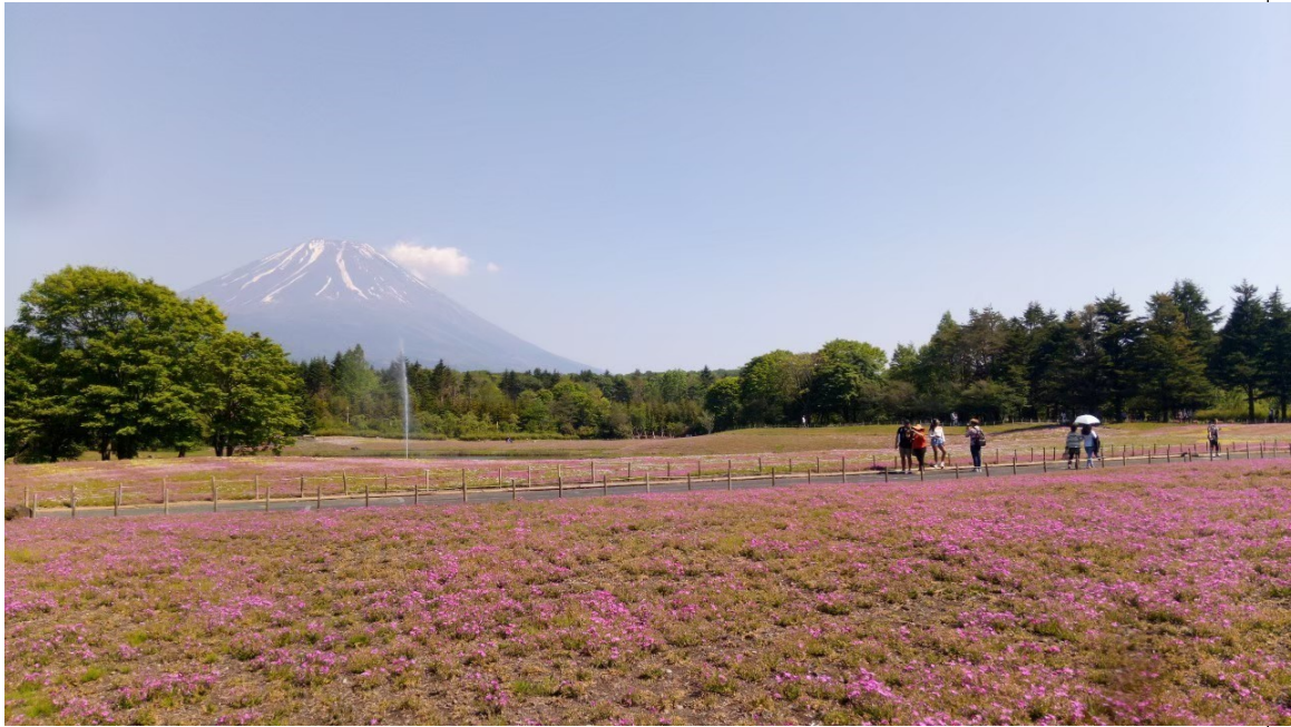
説明：富士芝桜まつり(2019/04/01)