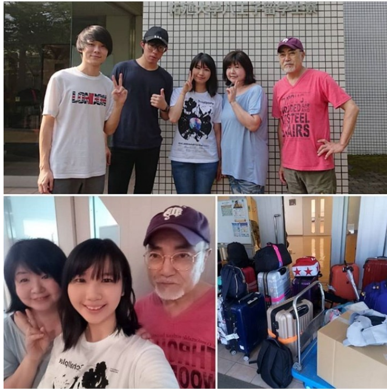
說明：回國當天早上和宿舍爸爸媽媽拍照(2019/7/31)