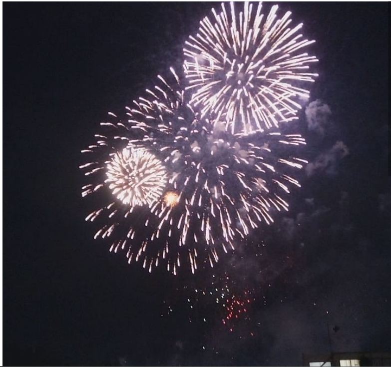
説明：八王子花火大會(2019/07/27)