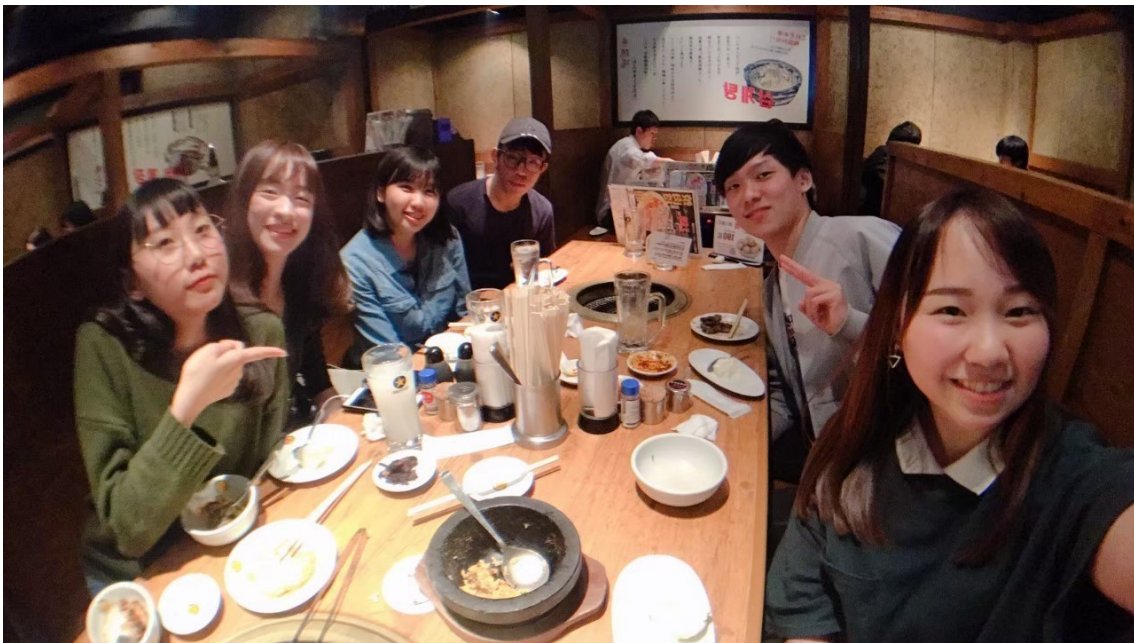
說明：第一次起吃烤肉)(2019/05/11)