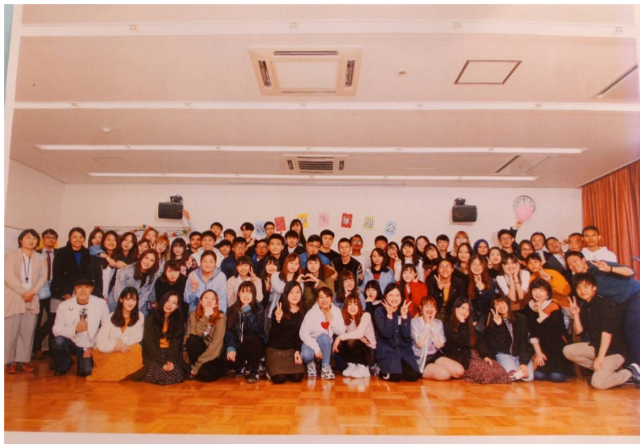
說明：新入寮歡迎會(2019/04/12)