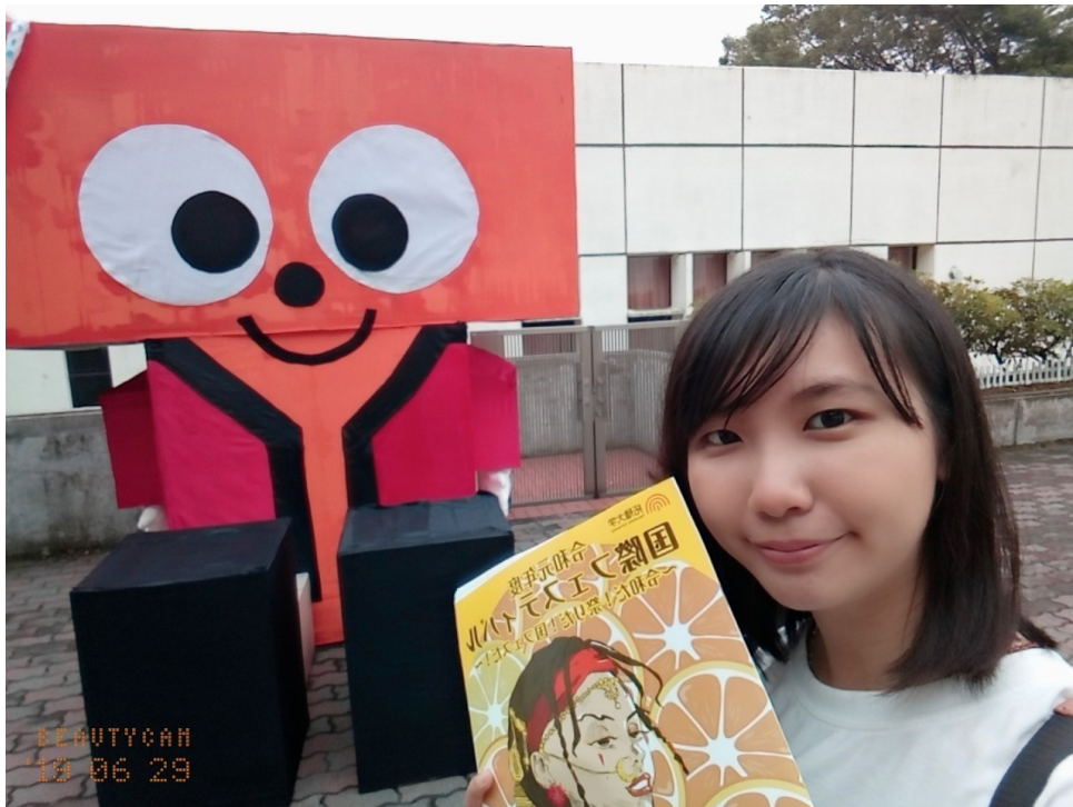
説明：拓大国際フェスティバル(2019/06/29~30)