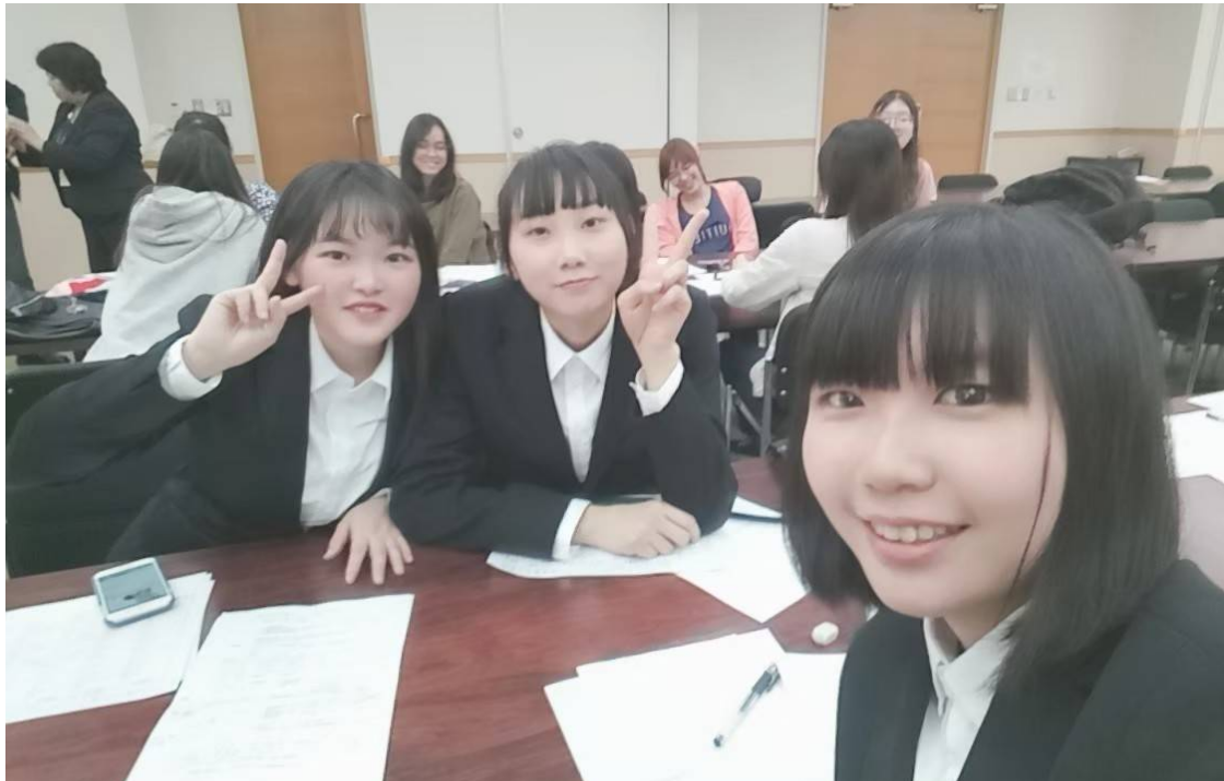
說明：始業式和東吳的姐姐們第一次接觸)(2019/04/6)