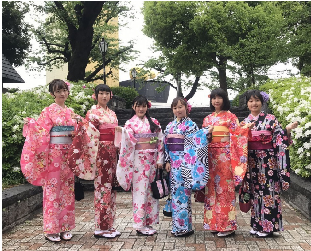
說明：和東吳的姐姐們一起體驗穿和服(2019/04/26)