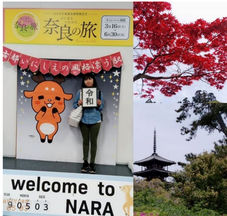
説明：黄金周大阪京都奈良遊 (2019/05/3)