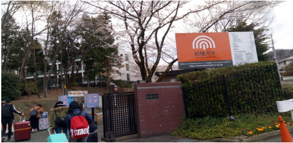
說明：第一天到達拓殖大學北門. 宿舍(2019/04/01)