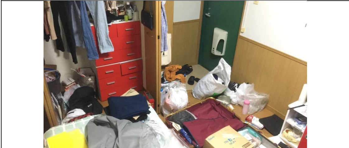
說明：回國前的房間慘況。(2019/08/27)