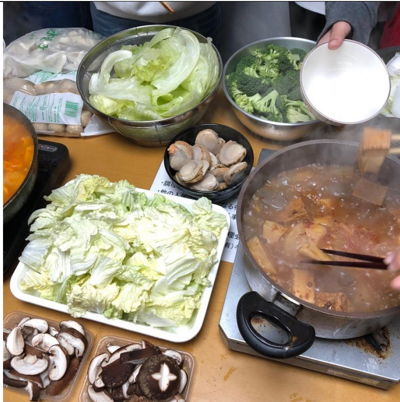
說明：宿舍聚會之火鍋。(2018/12/11)