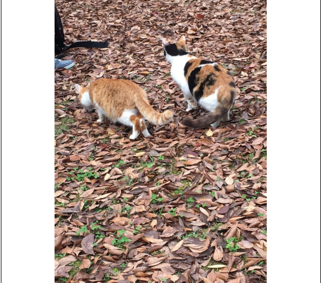
說明：考日檢時遇到的貓咪們。(2018/12/02)