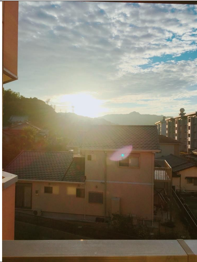
說明：從陽台看出去的日落。(2018/09/19)