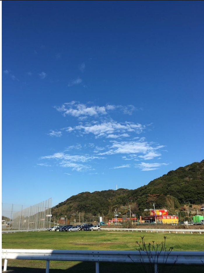
說明：學校後門外的風景。(2018/12/10)