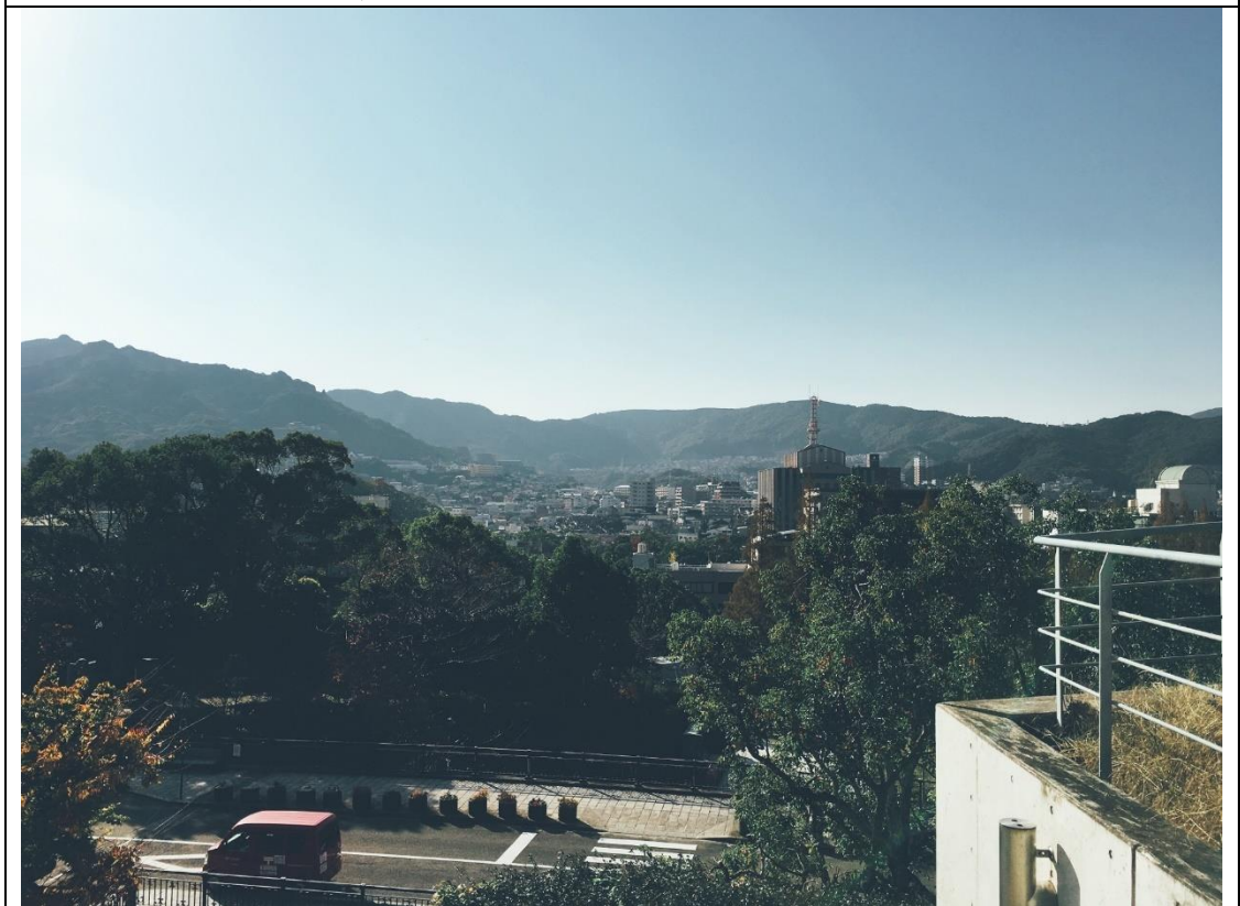
說明：長崎原子彈博物館外的風景。(2018/11/10)