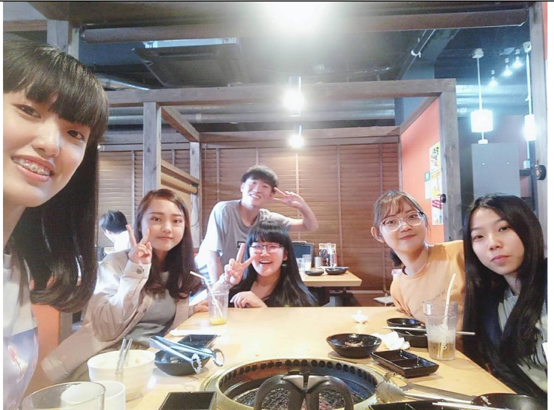
說明：長崎三人組與香川三人組的烤肉約會。(2019/06/26)