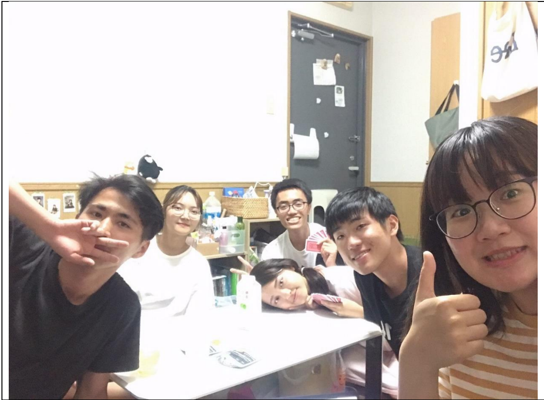
說明：在別人房間開趴。(2019/08/06)