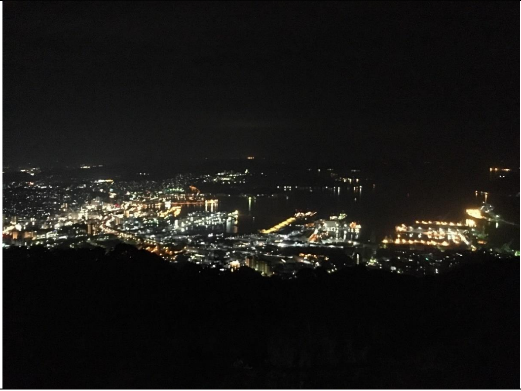
說明：長崎三人組跟韓國學長一起去看夜景。(2019/01/11)