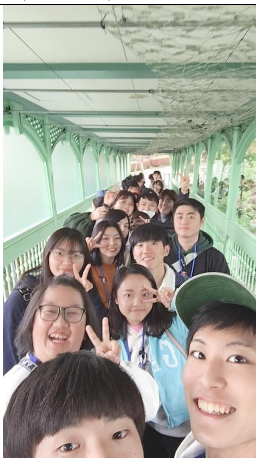
說明：學校國際交流活動跟大家的合照(終於有合照了)。(2018/11/18)