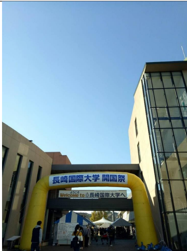
說明：學校的校園祭。(2018/11/3)