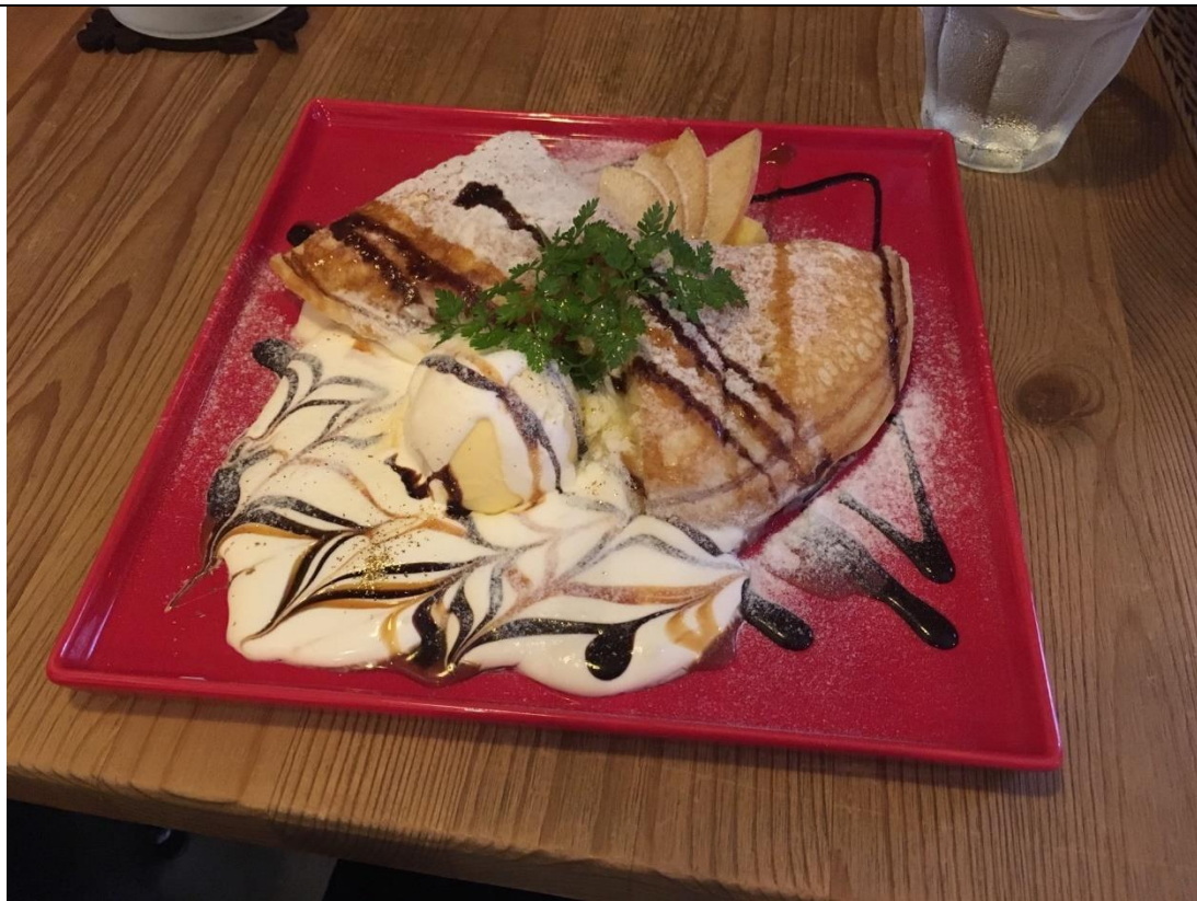
說明：與日本人組員們去咖啡廳吃飯。(2019/07/08)