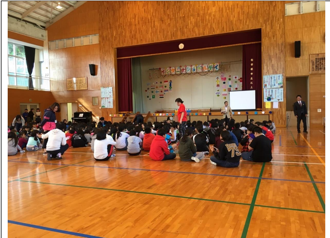
說明：參加上江小學校的國際活動。(2018/11/15)