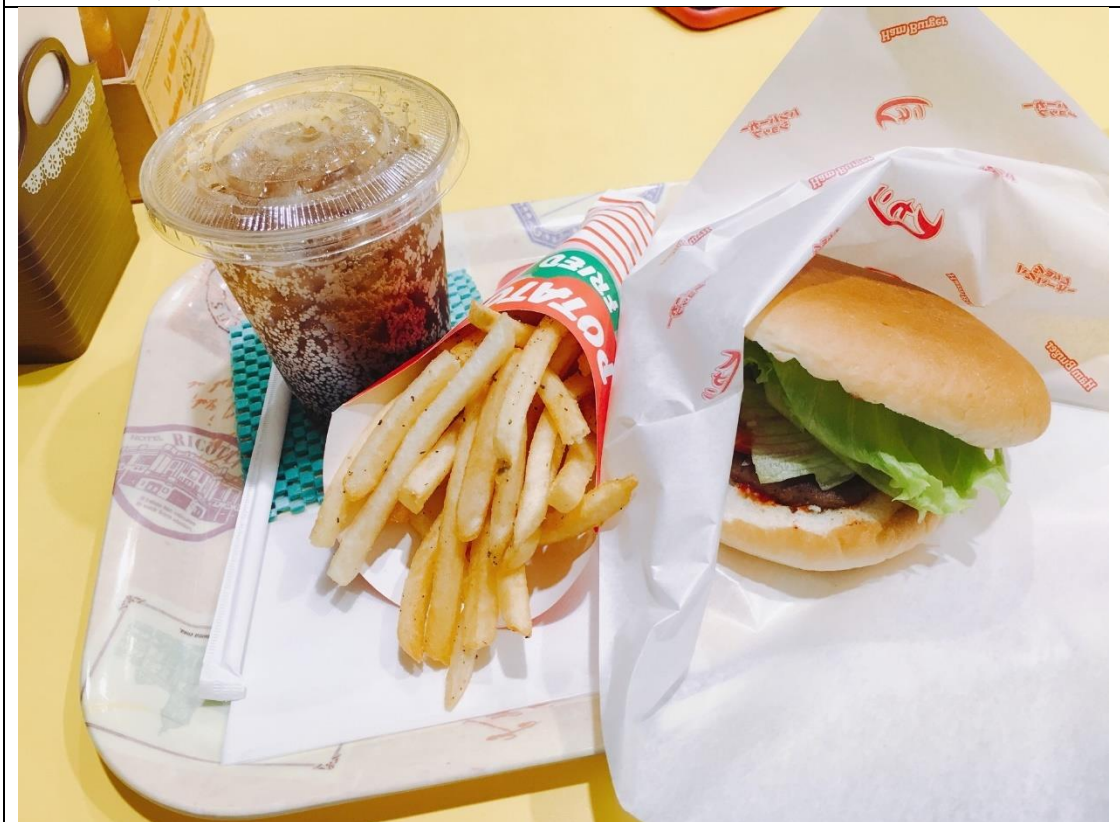
說明：好吃的佐世保漢堡。(2018/10/20)