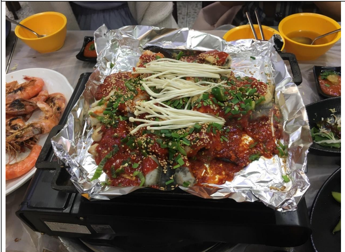
說明：害我們食物中毒的釜山名產盲鰻。(2019/04/27)