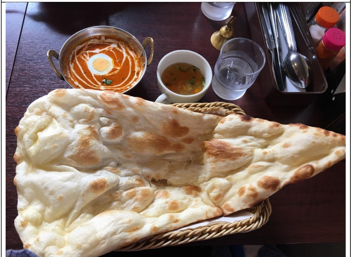
說明：第一次吃囊(有夠好吃)。(2019/05/15)