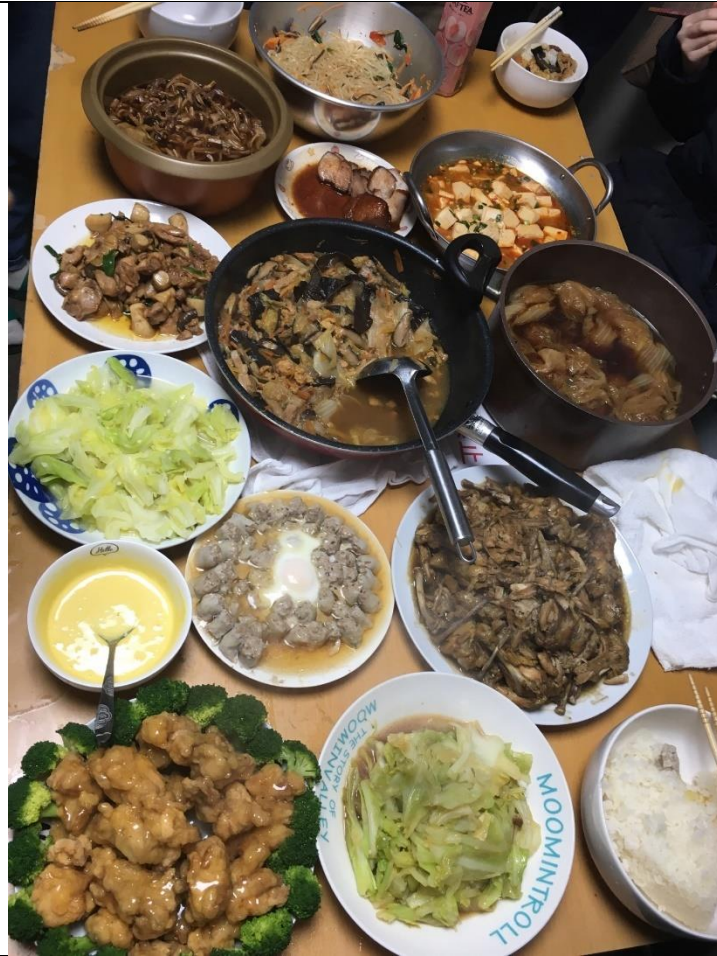
說明：宿舍聚會之抽籤做菜。(2019/01/15)