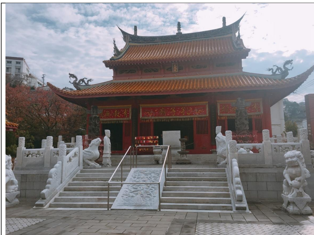
說明：日本的孔子廟。(2018/11/18)