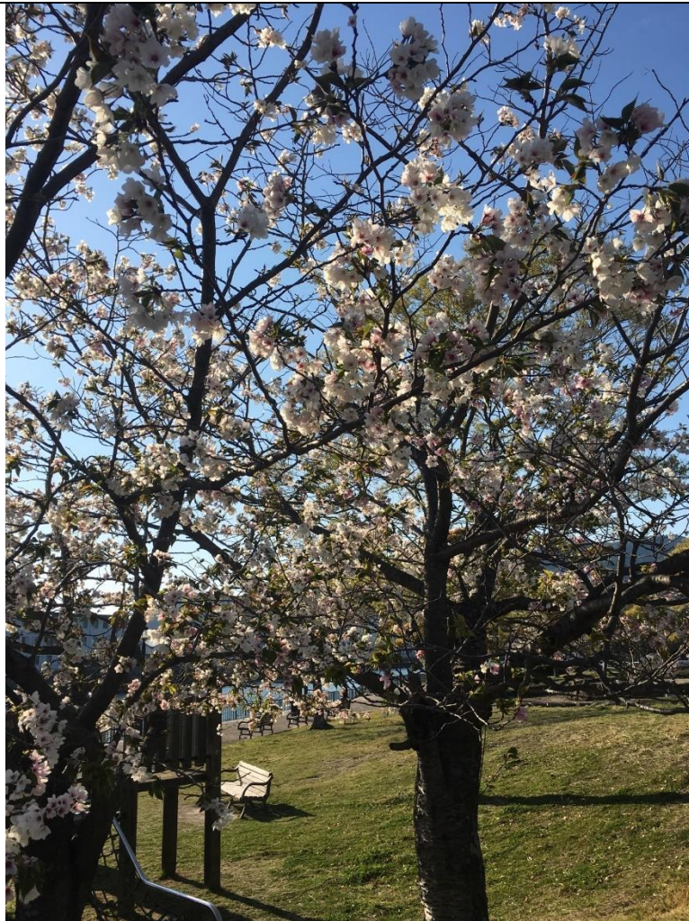
說明：佐世保公園的櫻花。(2019/04/03)