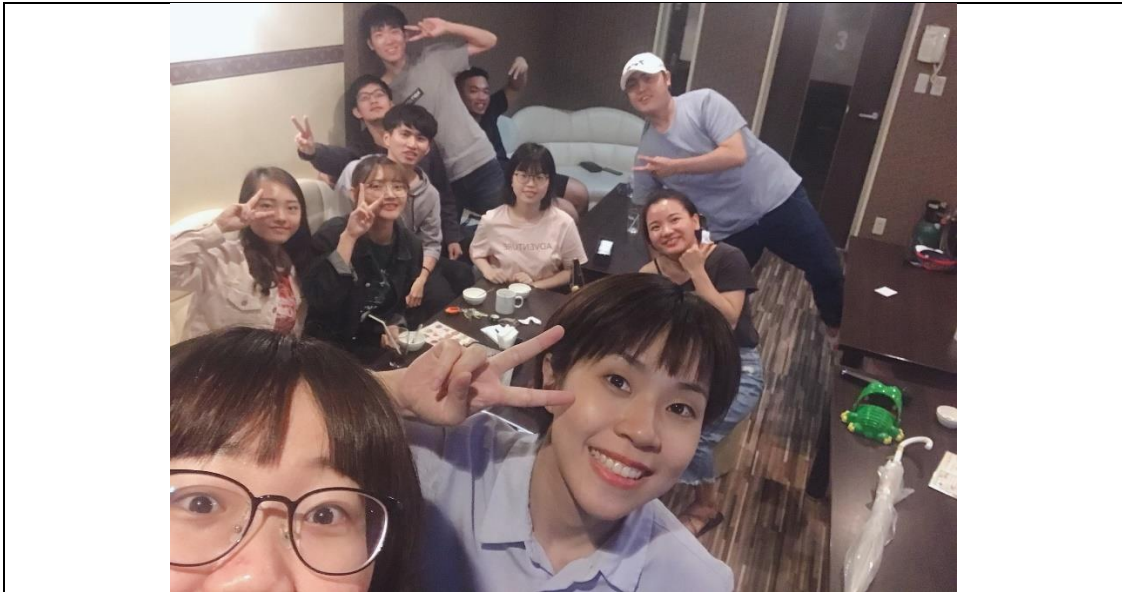
說明：在日本最後的宿舍聚會。(2019/08/22)