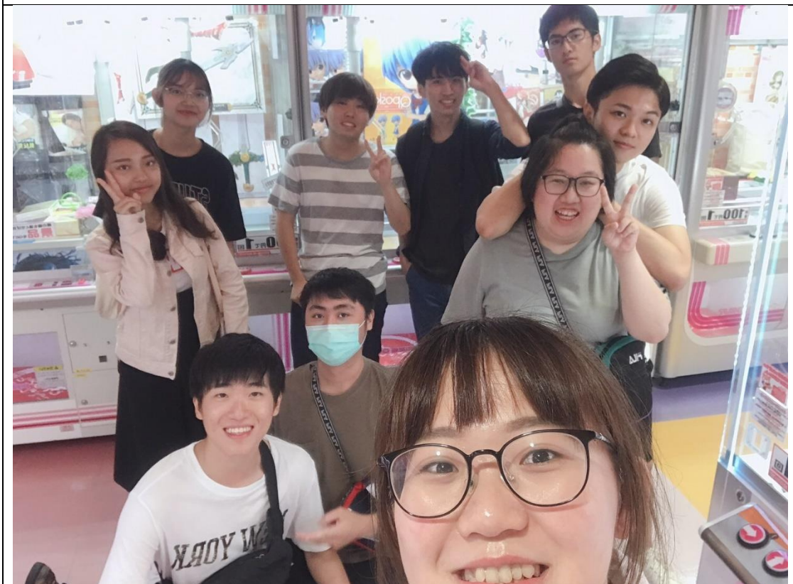
說明：台灣然聚會之遇到日本朋友。(2019/08/21)