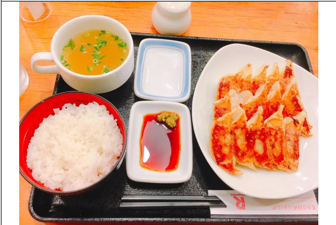
說明：第一次吃到飯配煎餃。(2018/10/2)