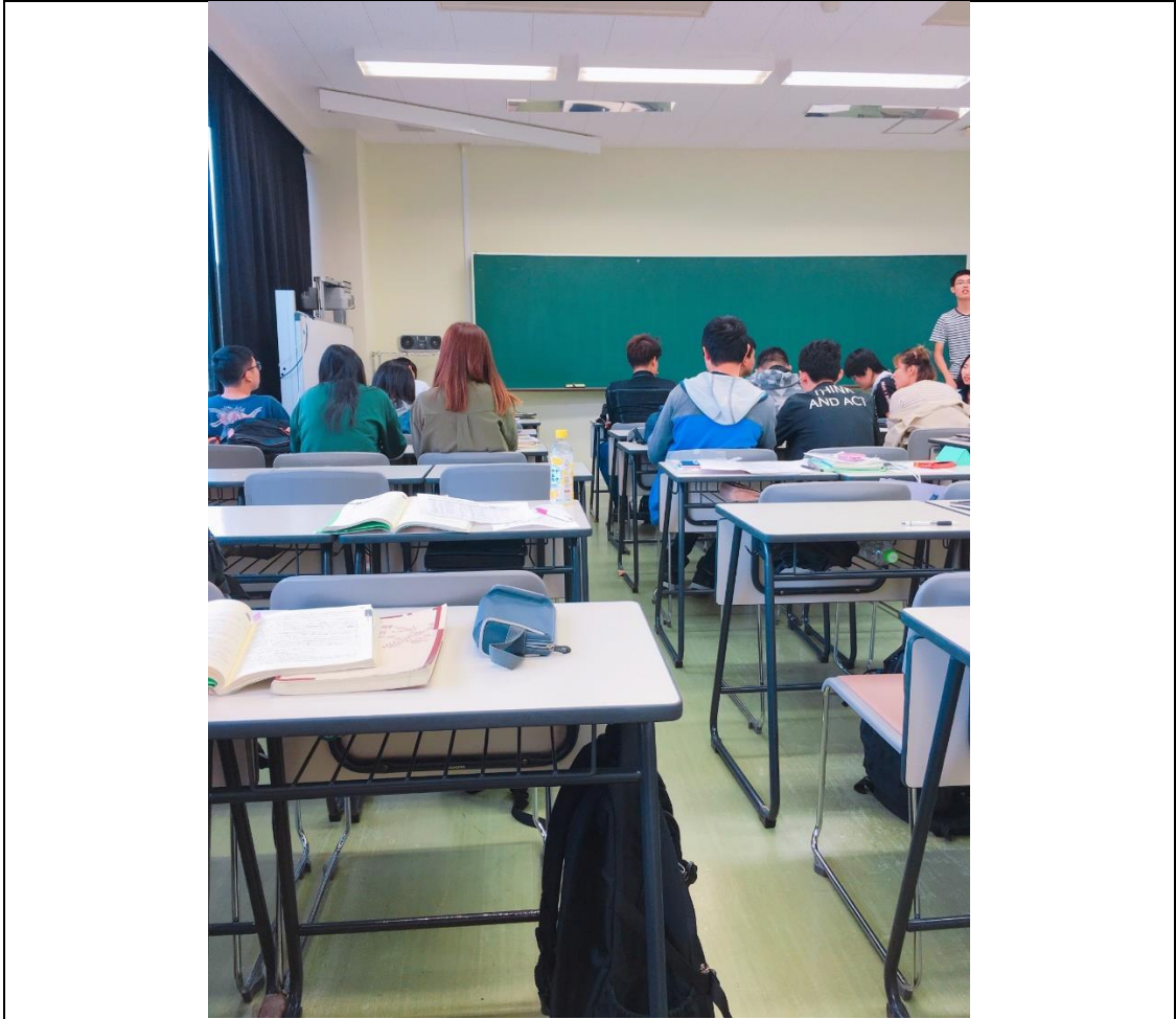
說明：上日文課的教室及留學生們。(2018/09/24)