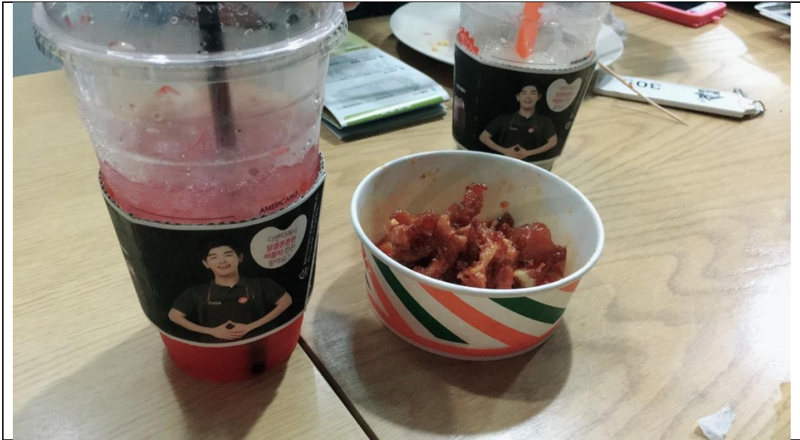
說明：在韓國吃的消夜。(2019/04/26)