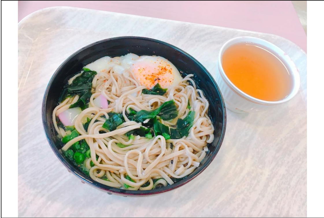
說明：學餐之半熟蛋蕎麥麵。(2018/10/2)