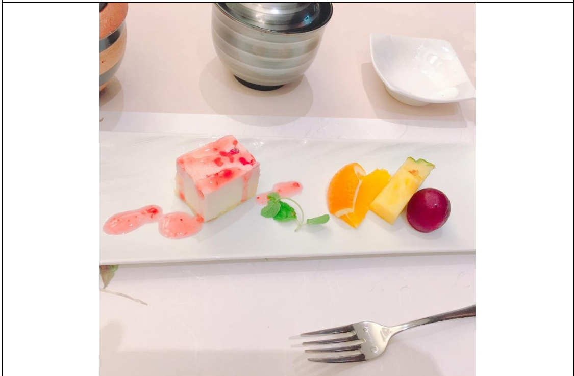
說明：參加學校的活動的餐點中的甜點。(2018/09/29)