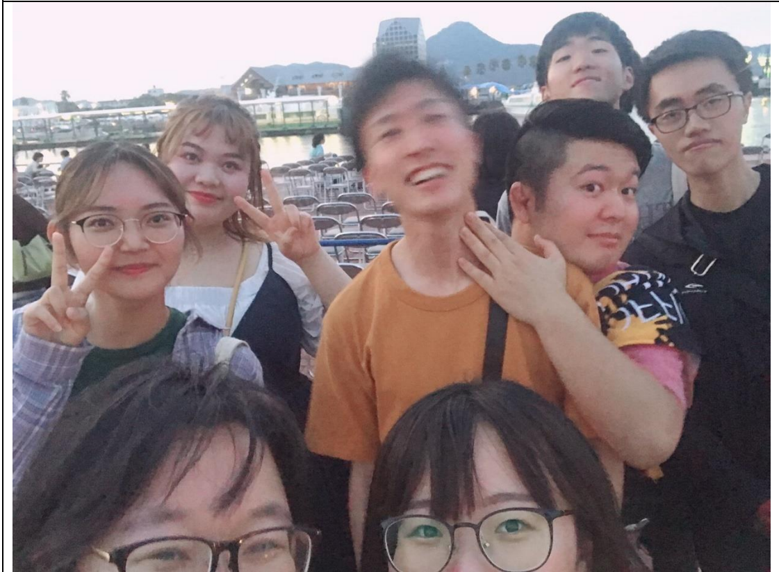
說明：去看煙火大會。(2019/08/04)