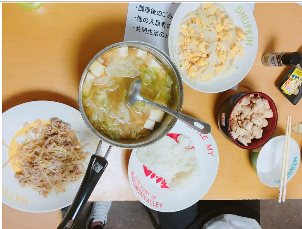
說明：第一次一起煮晚餐。(2018/09/18)