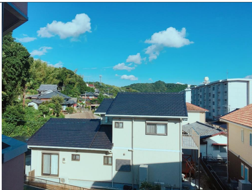
說明：房間陽台看出去的風景。(2018/09/16)