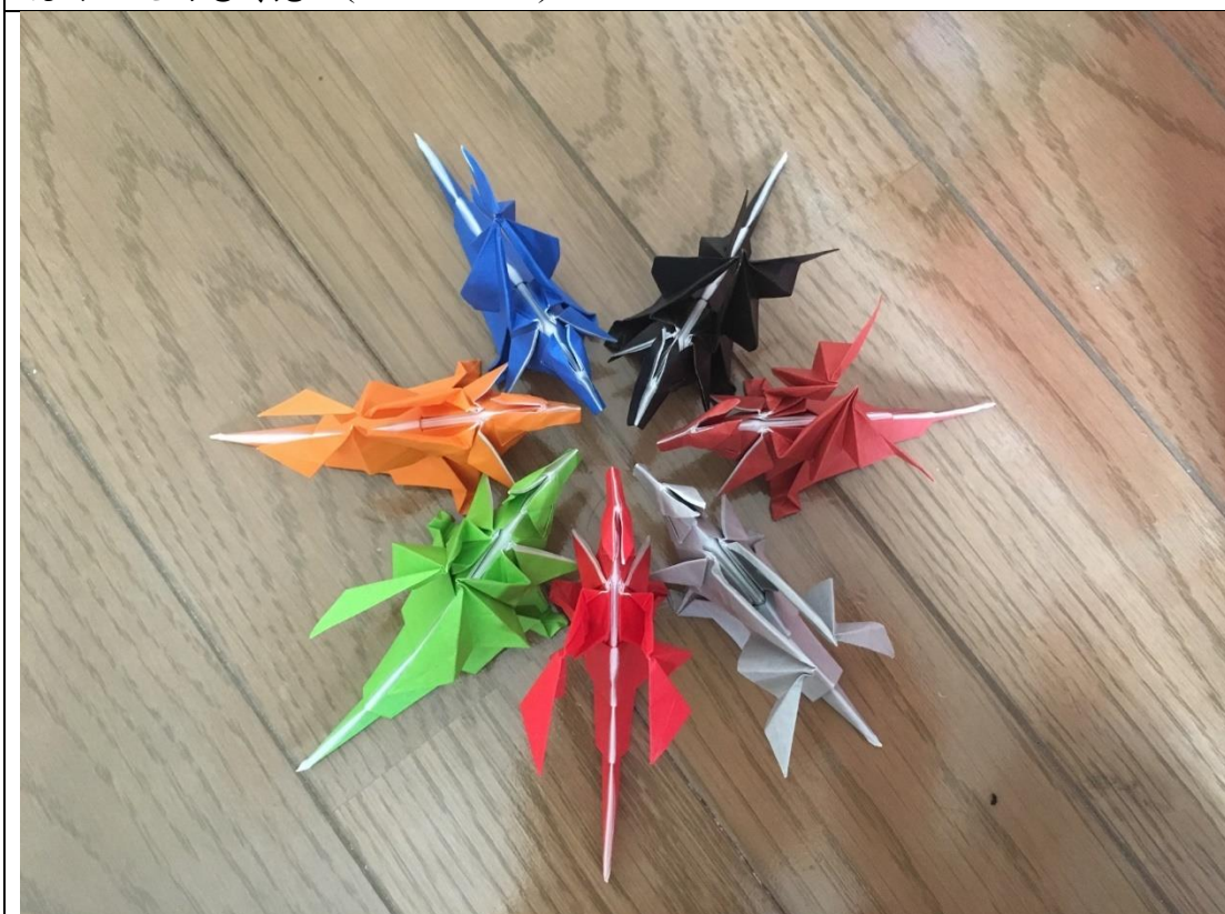
說明：我折的飛龍家族。(2019/06/08)