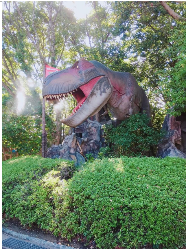
說明：豪斯登堡裡的暴龍。(2018/09/22)