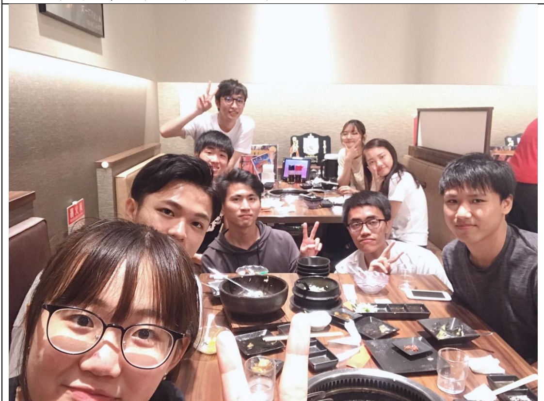
說明：朋友生日吃佐賀牛。(2019/08/09)