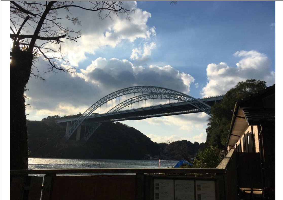
說明：跟日本人組員們去的西海橋公園。(2018/12/12)