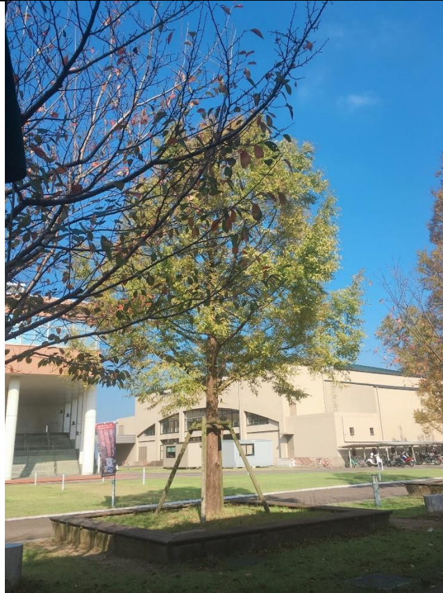
說明：學校食堂外的樹。(2018/10/24)