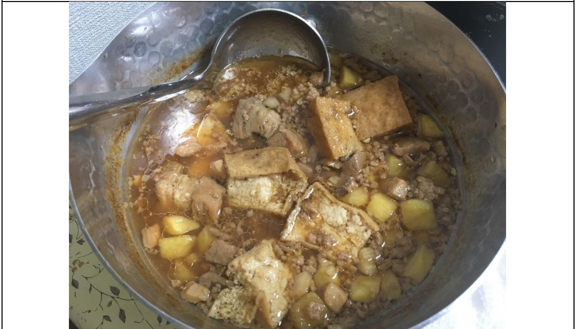
說明：自己煮的肉燥。(2019/07/15)