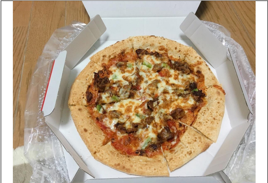
說明：佐世保名產檸檬牛排口味的披薩(有夠好吃)。(2019/02/09)