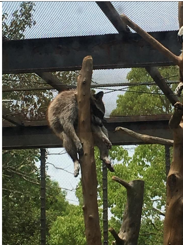
說明：一起去動物園玩之睡翻的浣熊。(2019/05/06)