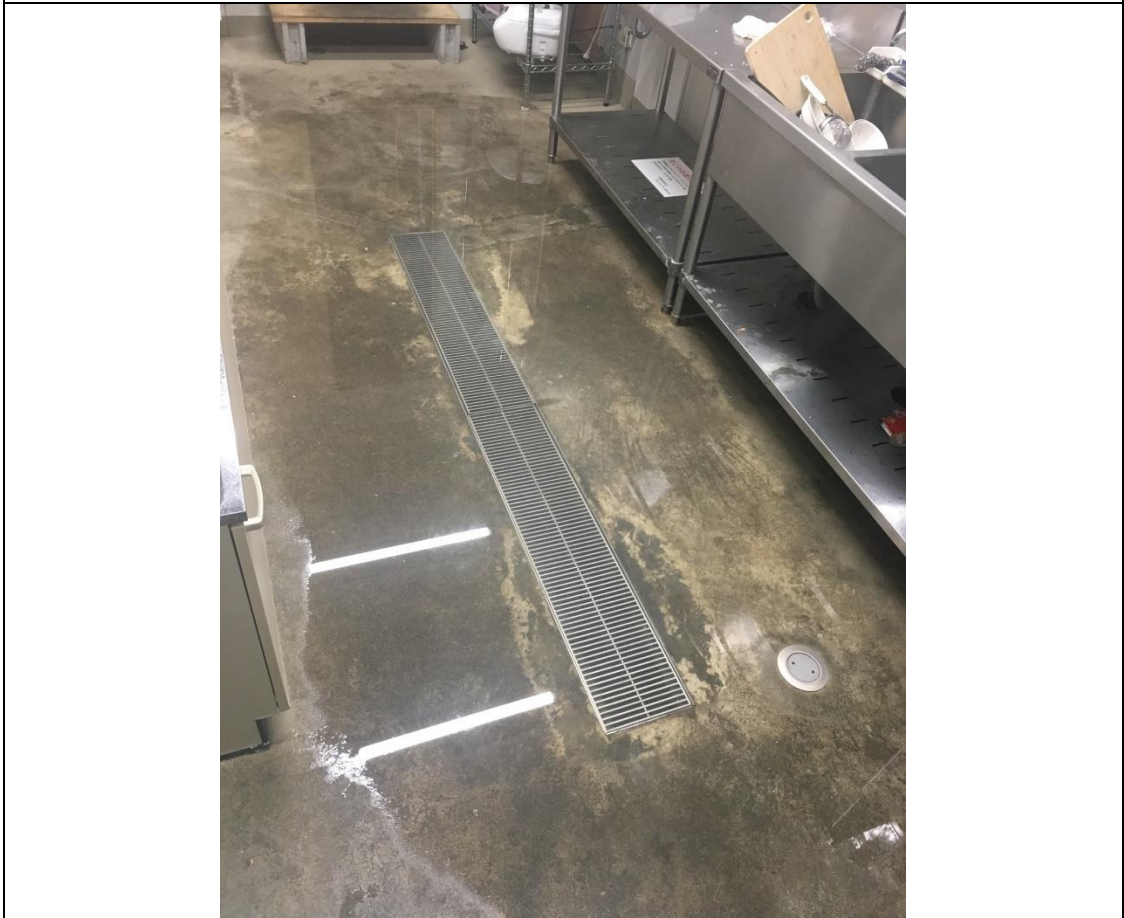
說明：宿舍聚會之後之廚房積水清澈版。(2019/02/17)