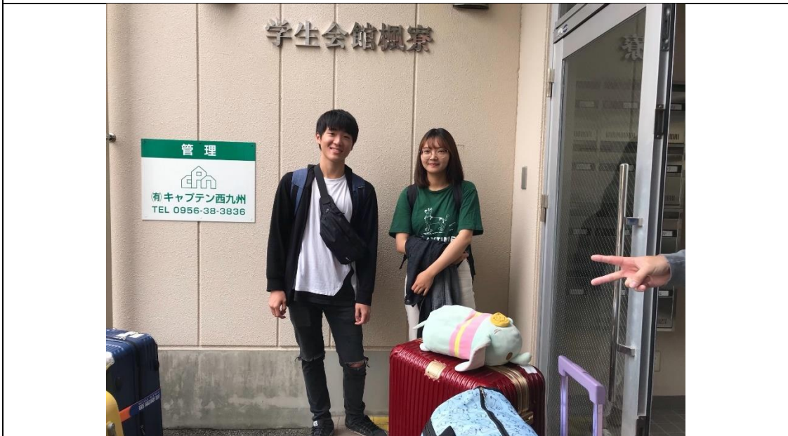
說明：回國前在宿舍外的最後一拍。(2019/08/30)