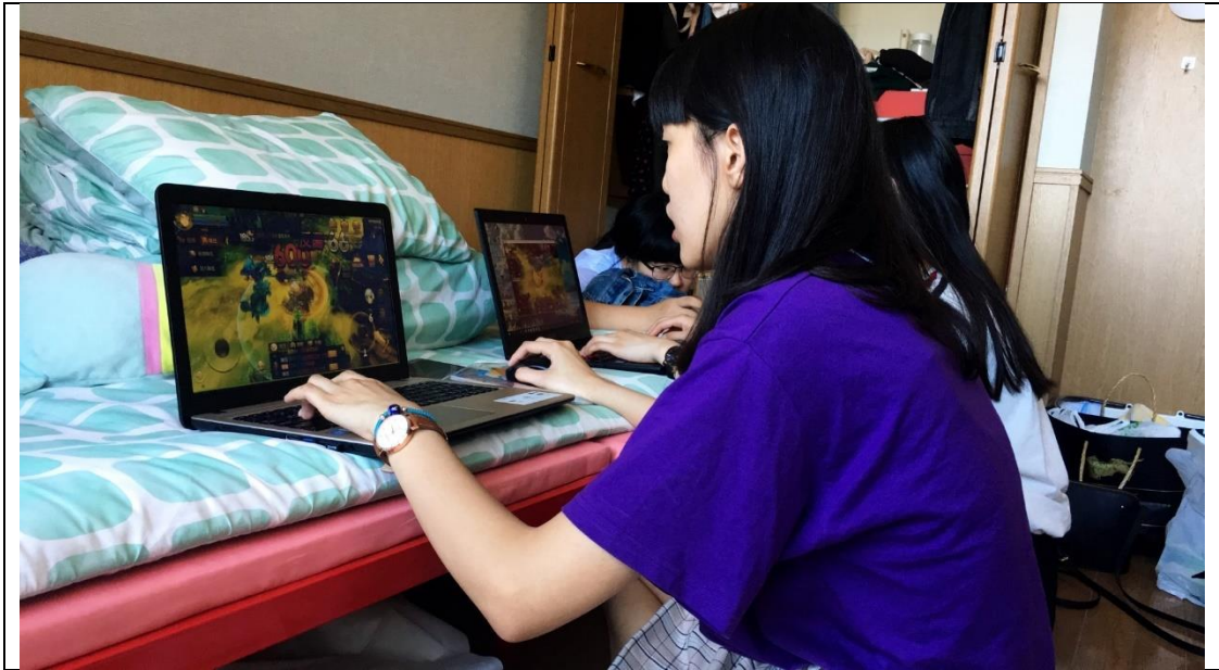
說明：香川實習三人組來佐世保玩之在我房間開網咖。(2019/06/24)