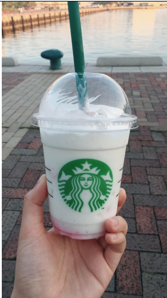
說明：在日本的第一杯星巴克。(2019/04/20)