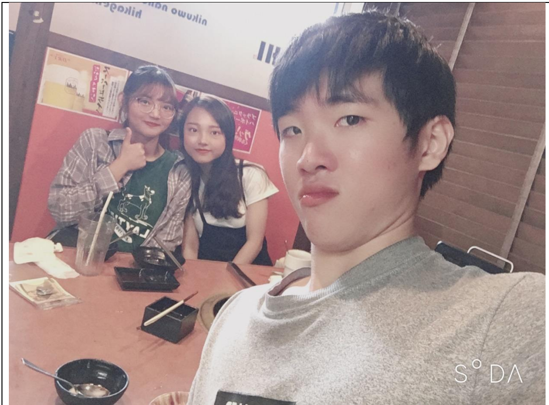
說明：被我慫恿玩而去吃的烤肉吃到飽。(2019/08/16)