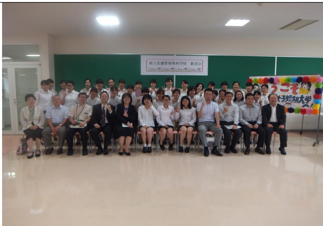
説明：留學生歡迎會(2017/09/21)