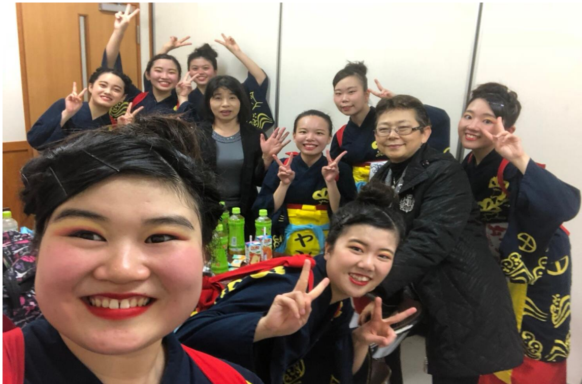
說明：留學生們的第一個舞台(2018/03/27)