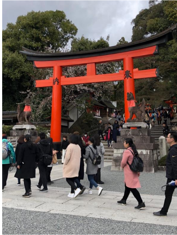
說明：京都伏見稻荷神社(2018/03/22)