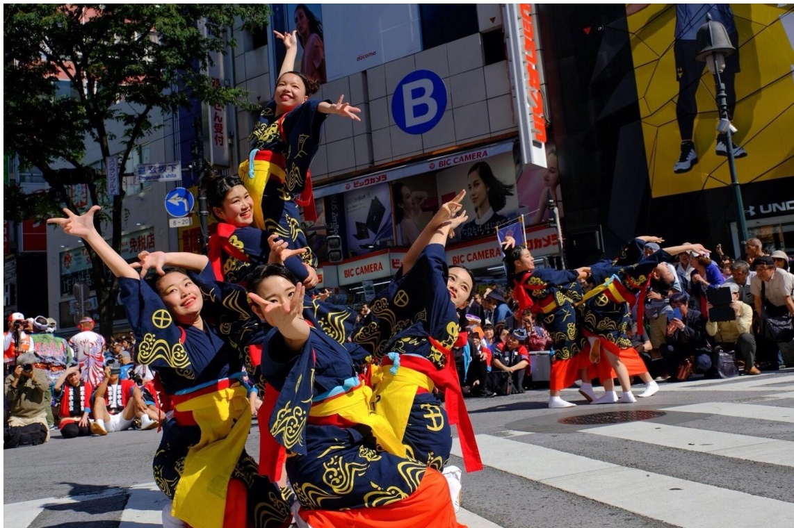
説明: 渋谷・鹿兒島小原祭(2018/05/20)