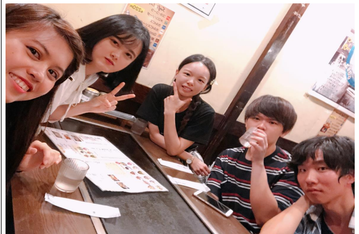
說明：長崎留學生到鹿兒島旅行(2018/08/16)