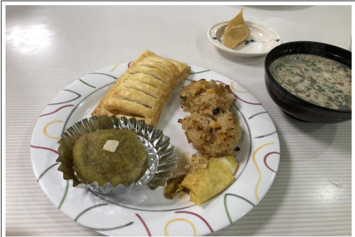
說明:和寮監老師一起製作的點心(2018/01/03)