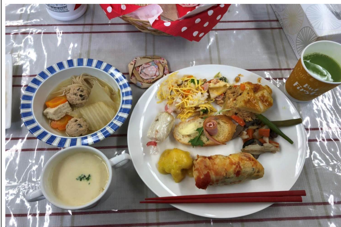
說明:學校食物營養專門科製作的料理(2018/01/10)