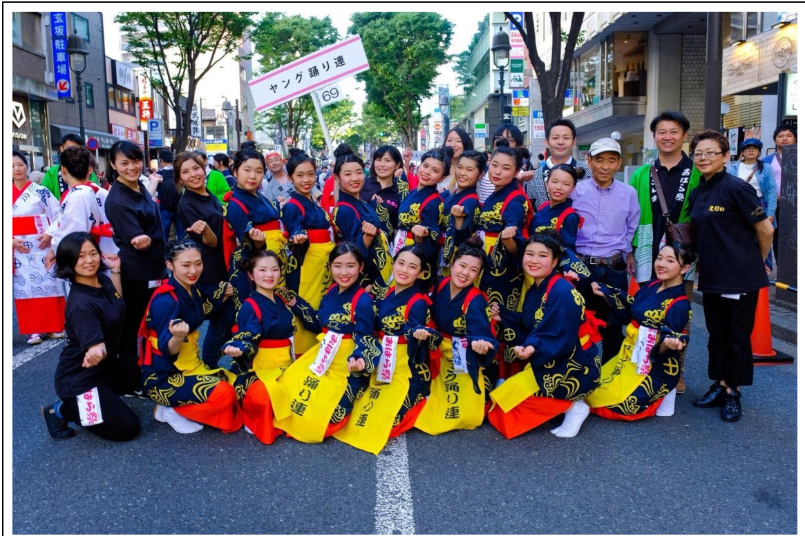
説明: 渋谷鹿兒島小原祭團體合照(2018/05/20)