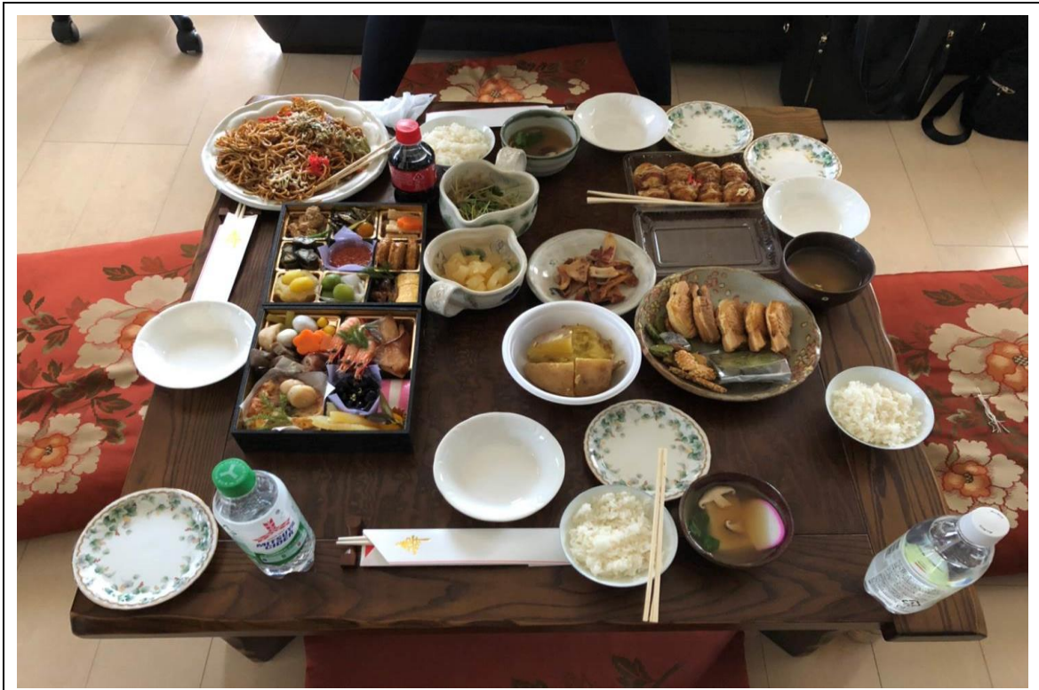
說明：在小松老師家過年(2018/01/02)