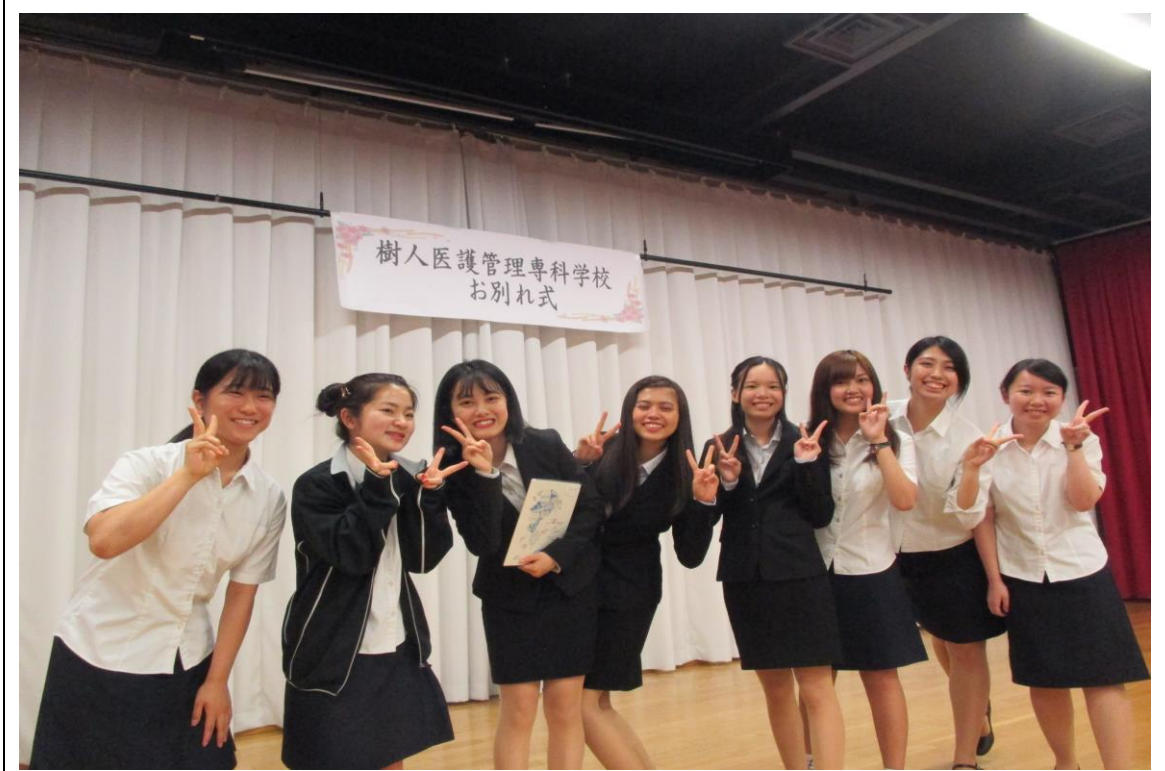
說明:留學生送別會-社團團體照(2018/08/07)