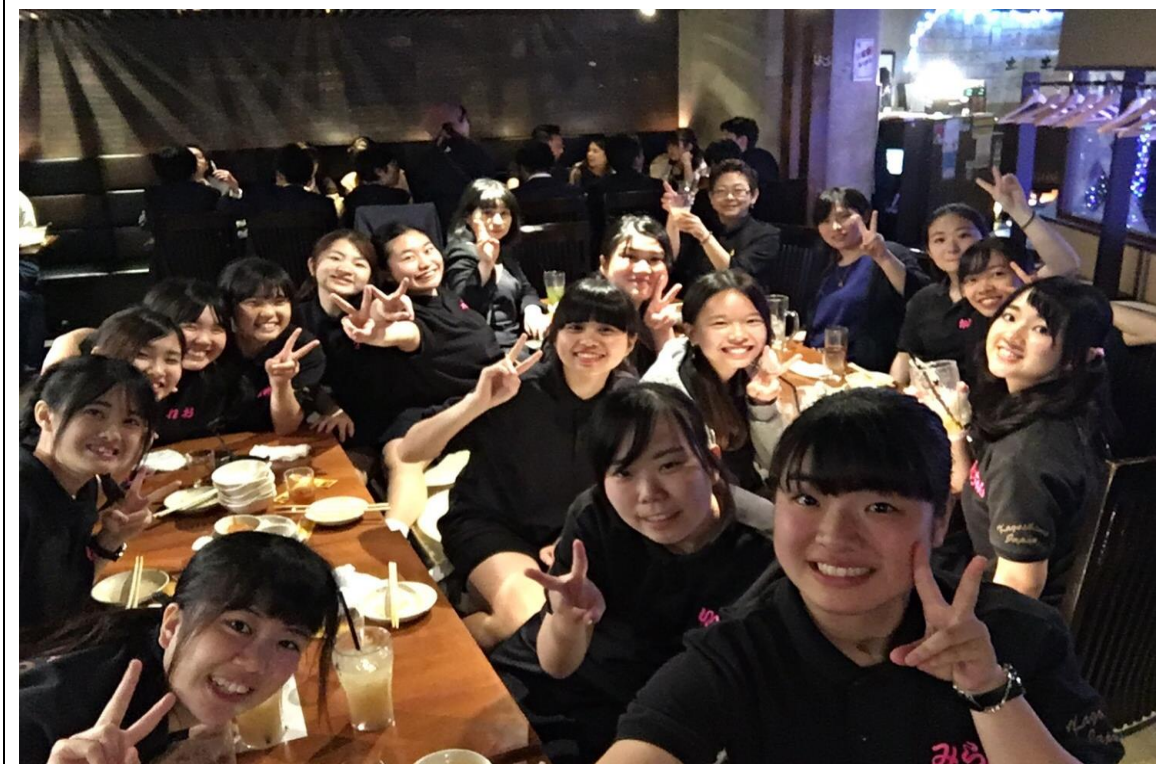
說明：涉谷・鹿兒島小原祭前天聚餐(2018/05/19)