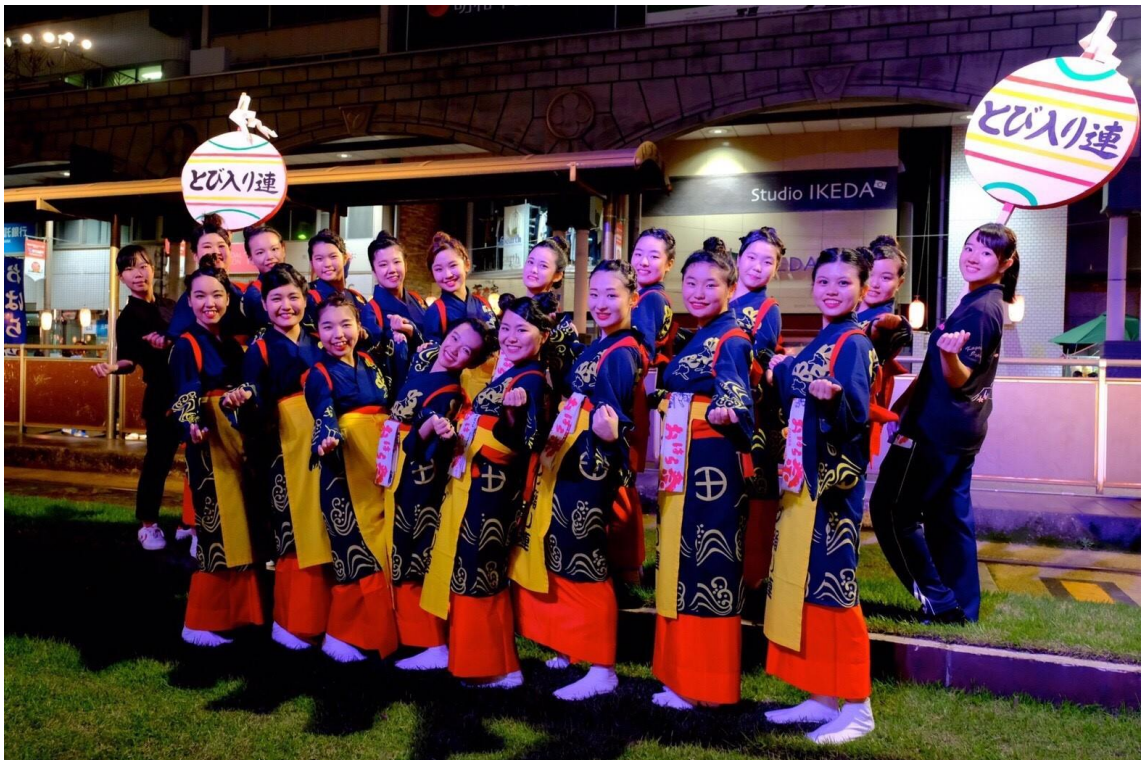
説明: 鹿兒島小原祭前夜祭(2017/11/02)