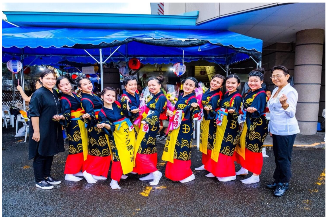
說明:最後的舞台-團體合照(2018/07/22)