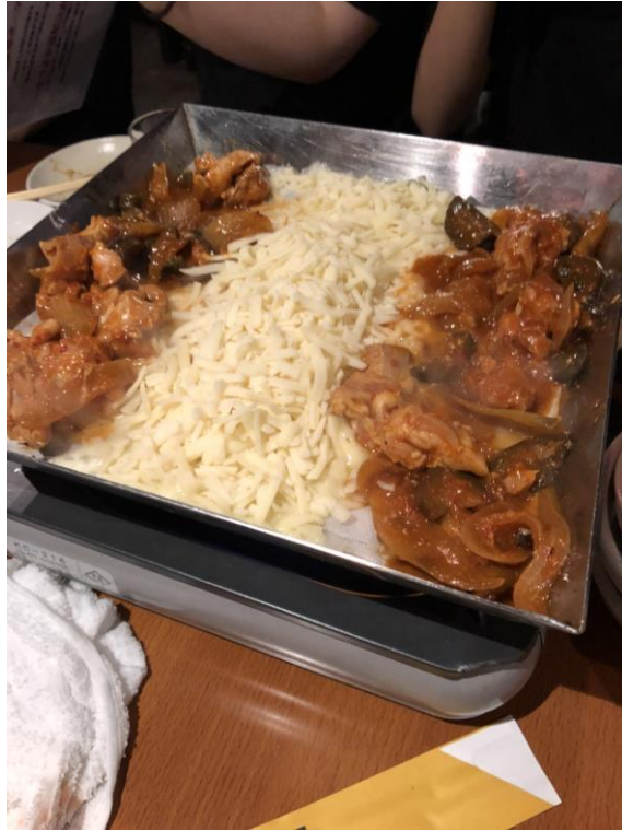
説明: 渋谷・鹿兒島小原祭-晚餐(2018/05/19)