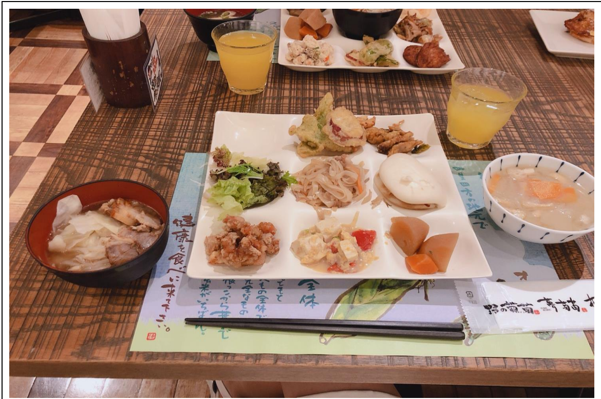
說明：朋友聚會-晚餐(2018/08/11)