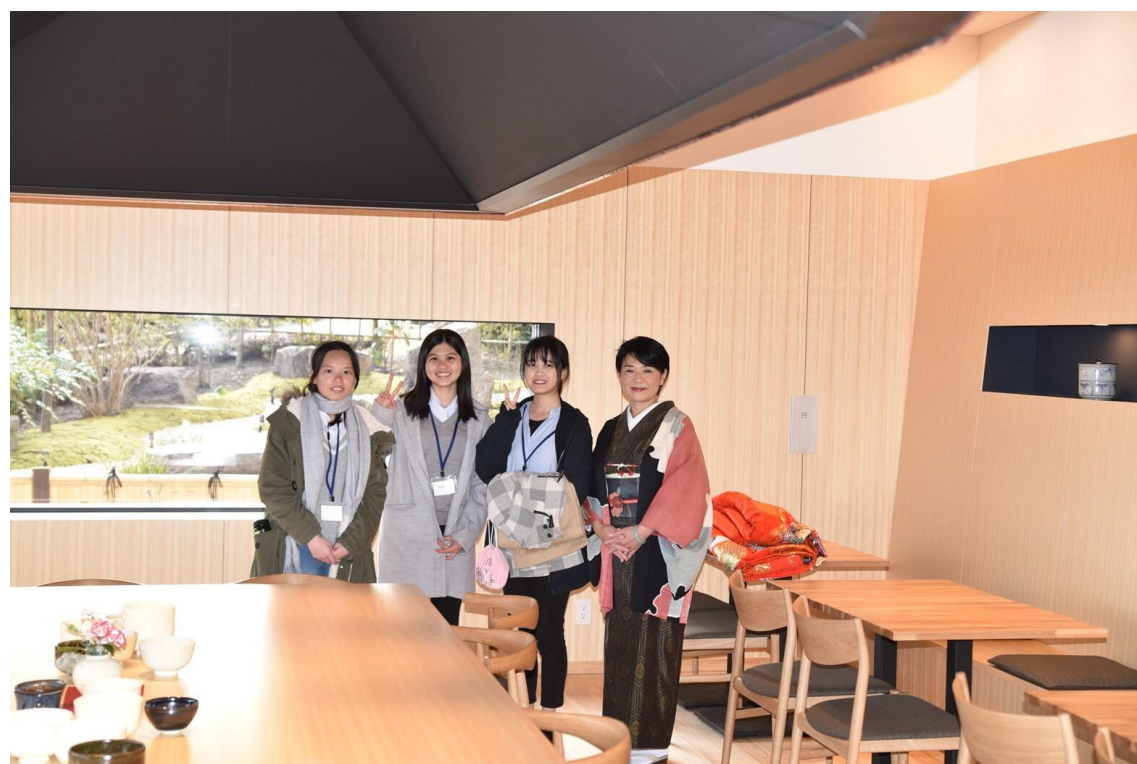
說明:仙巖園職場體驗(2018/02/17)