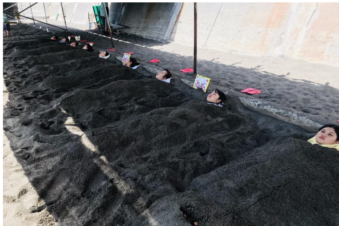
說明:社團旅行-沙蒸溫泉(2018/04/02)