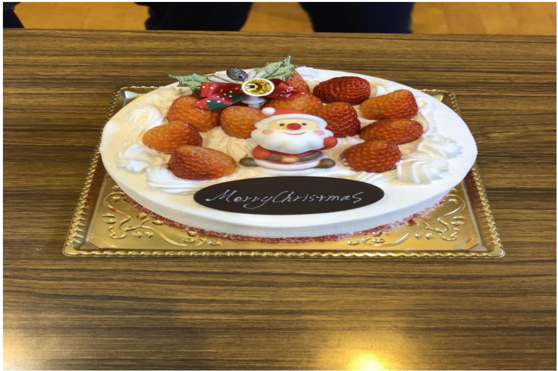
說明:社團聖誕節慶祝(2017/12/24)