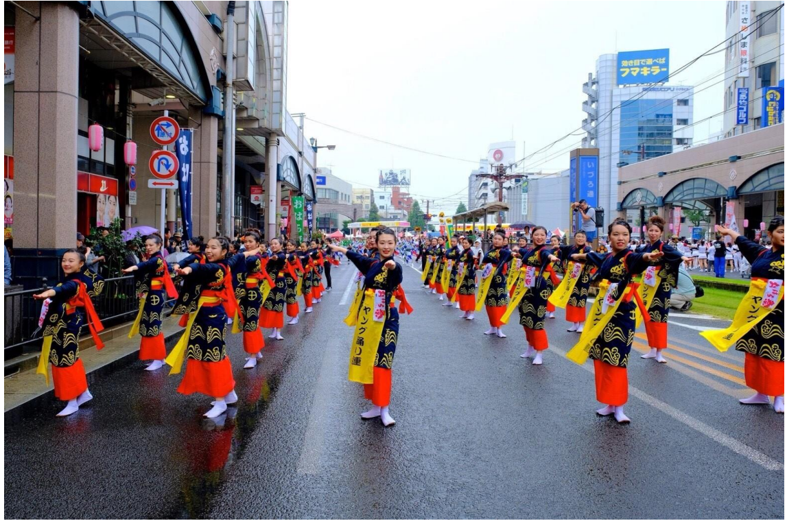
説明:鹿兒島小原祭(2017/11/03)