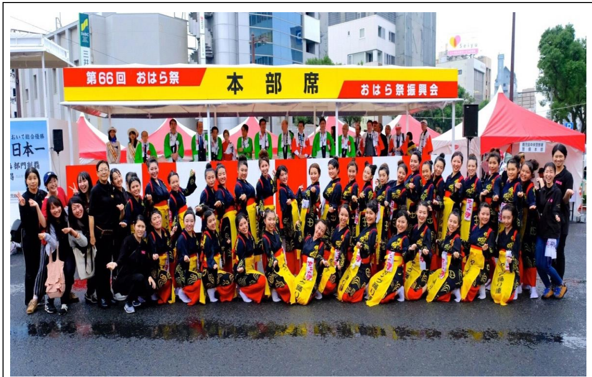
説明:鹿兒島小原祭團體合照(2017/11/03)