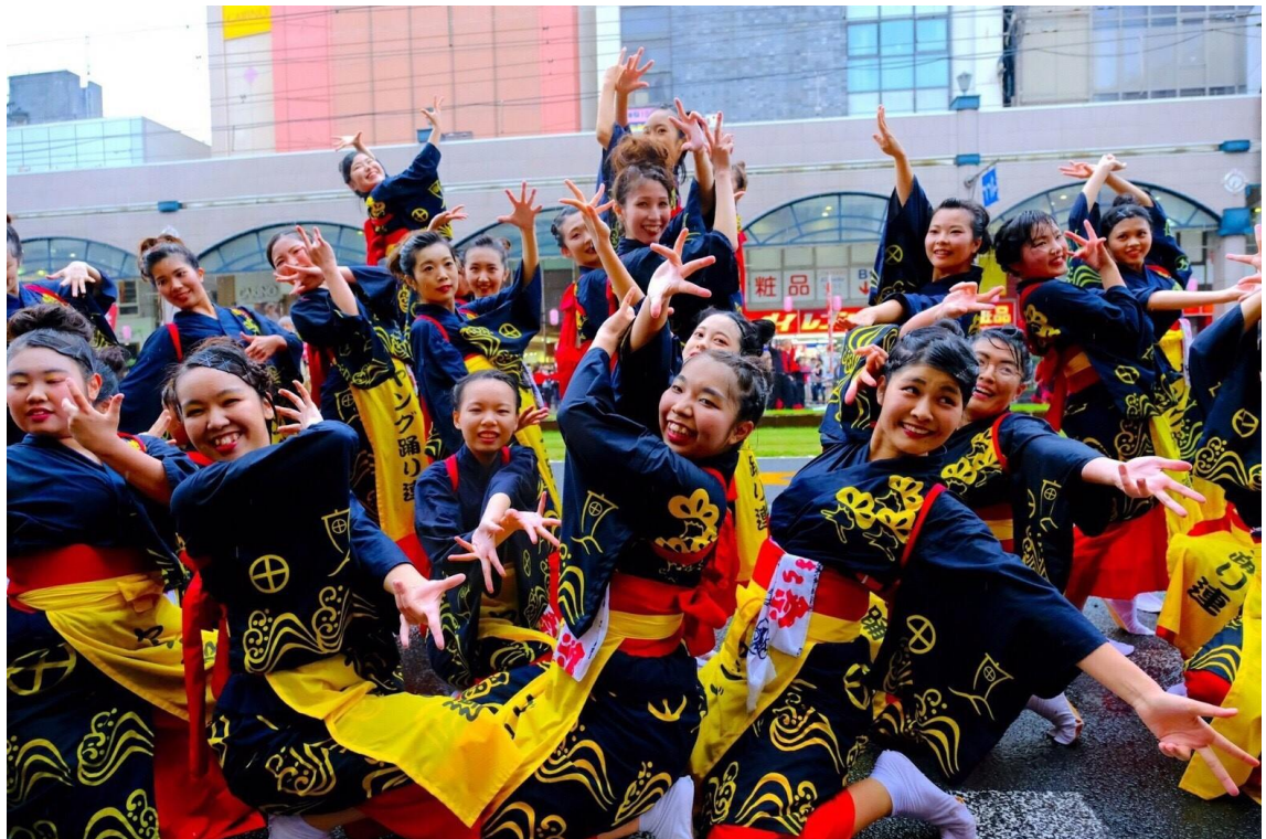
説明:鹿兒島小原祭表演(2017/11/03)