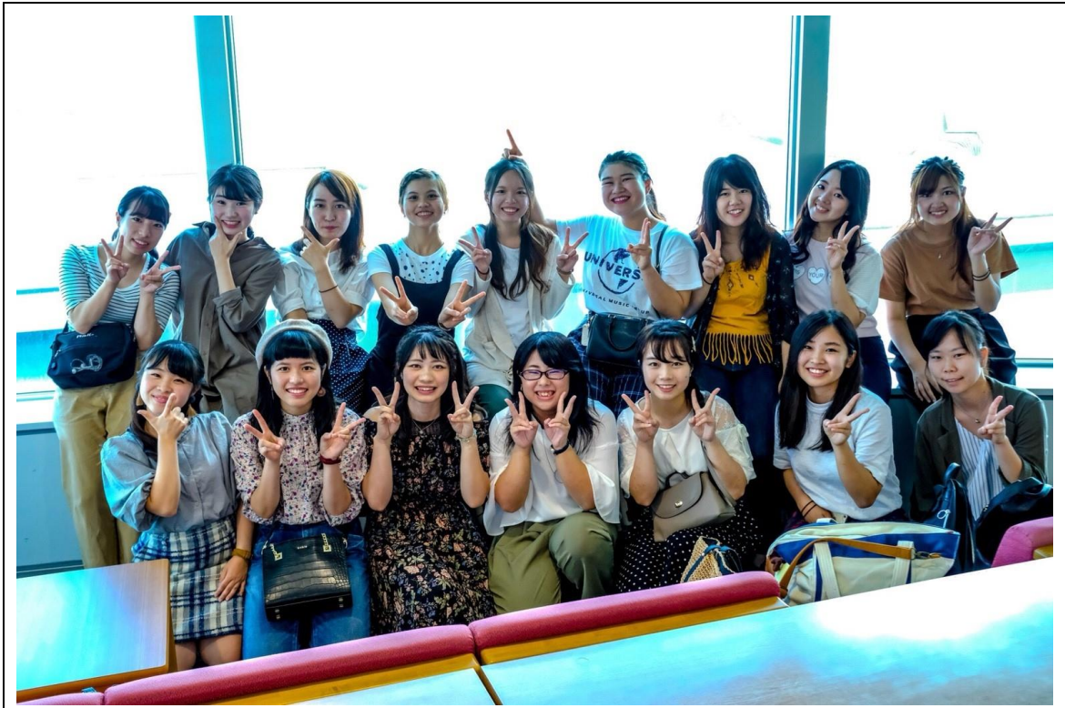
說明：機場送機-團體照(2018/09/03)