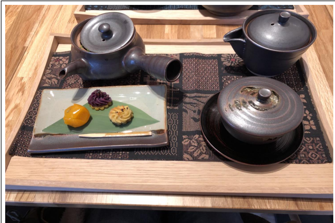
說明：鹿兒島茶和小點心(2018/02/17)