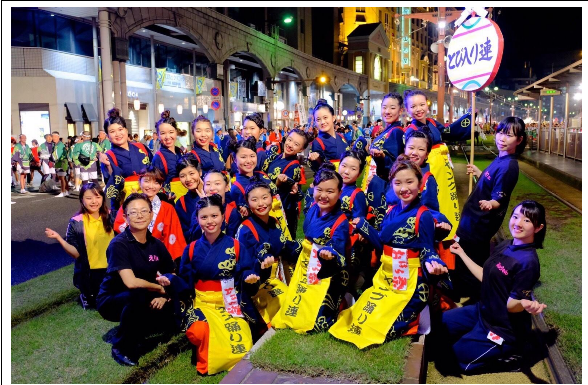
説明: 鹿兒島小原祭前夜祭(2017/11/02)