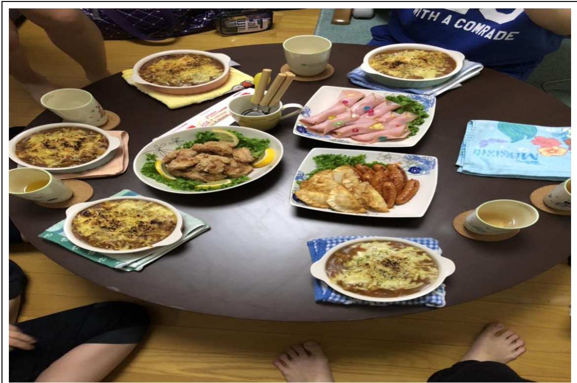
說明：朋友家過夜-晚餐(2018/05/03)