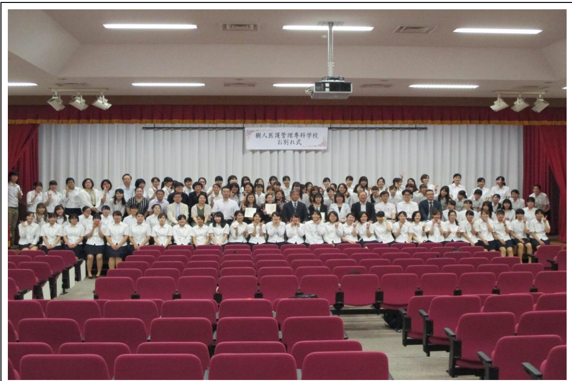
說明：留學生送別會-團體合照(2018/08/07)