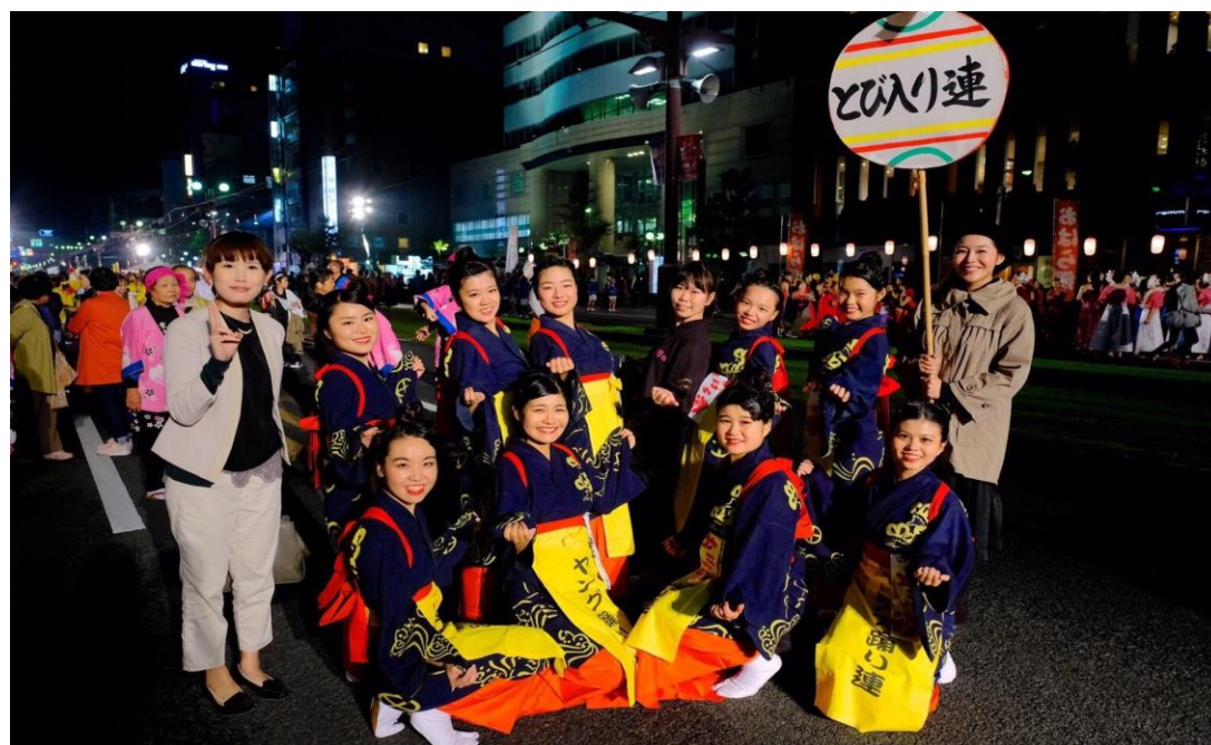
説明：鹿兒島小原祭前夜祭(2017/11/02)