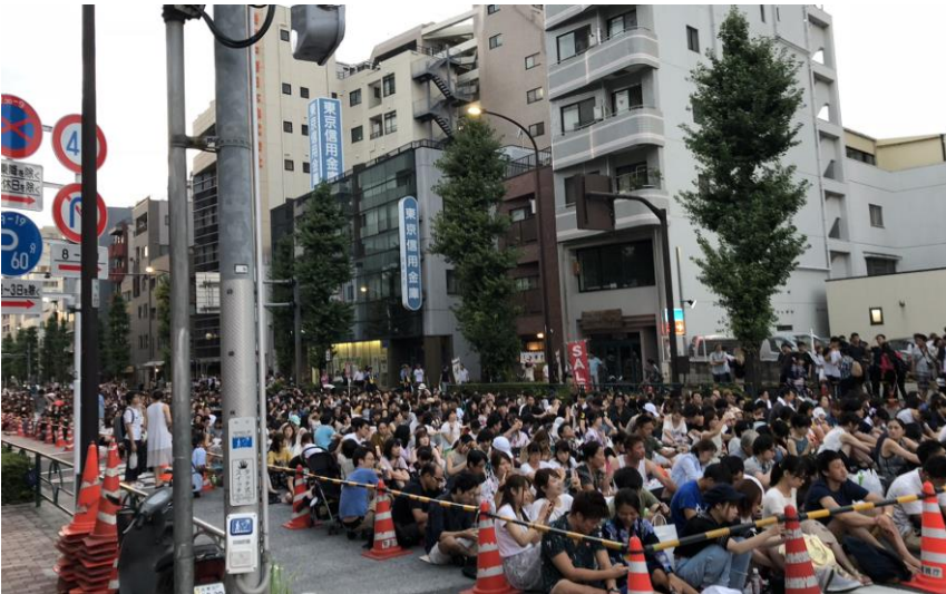
説明：隅田川煙火大會。(107/07/29)