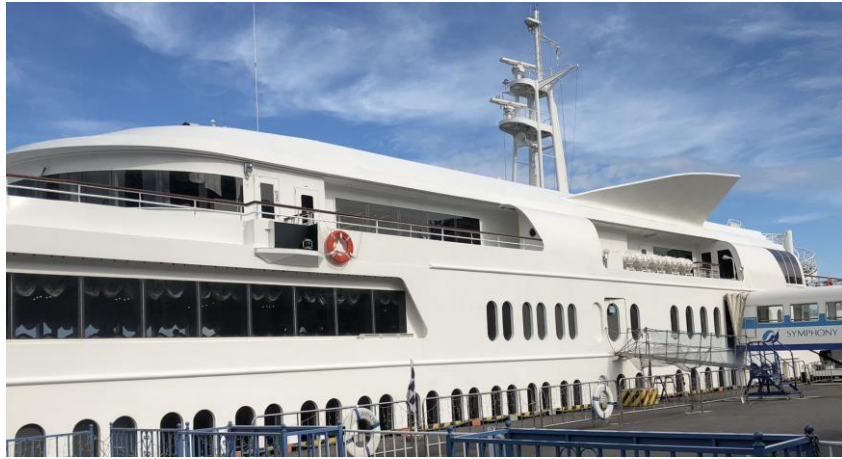
説明：シンフォニークルーズ。(107/07/08)