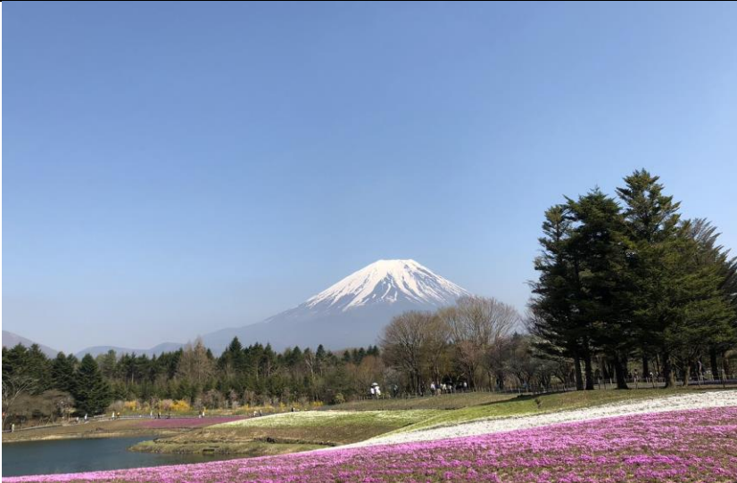
說明：富士山河口湖。(107/04/21)