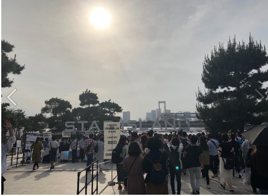
說明：未來型煙火娛樂。(107/05/26)