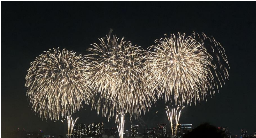
說明：未來型煙火娛樂。(107/05/26)