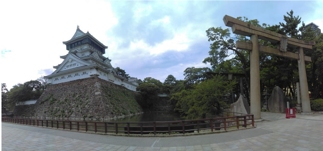
說明：小倉城。中國地區自住行(2018-8-16 福岡県 北九州市 )