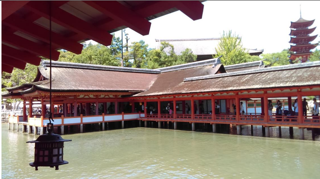
説明：巖島神社。(2018-8-17 広島県 廿日市 )