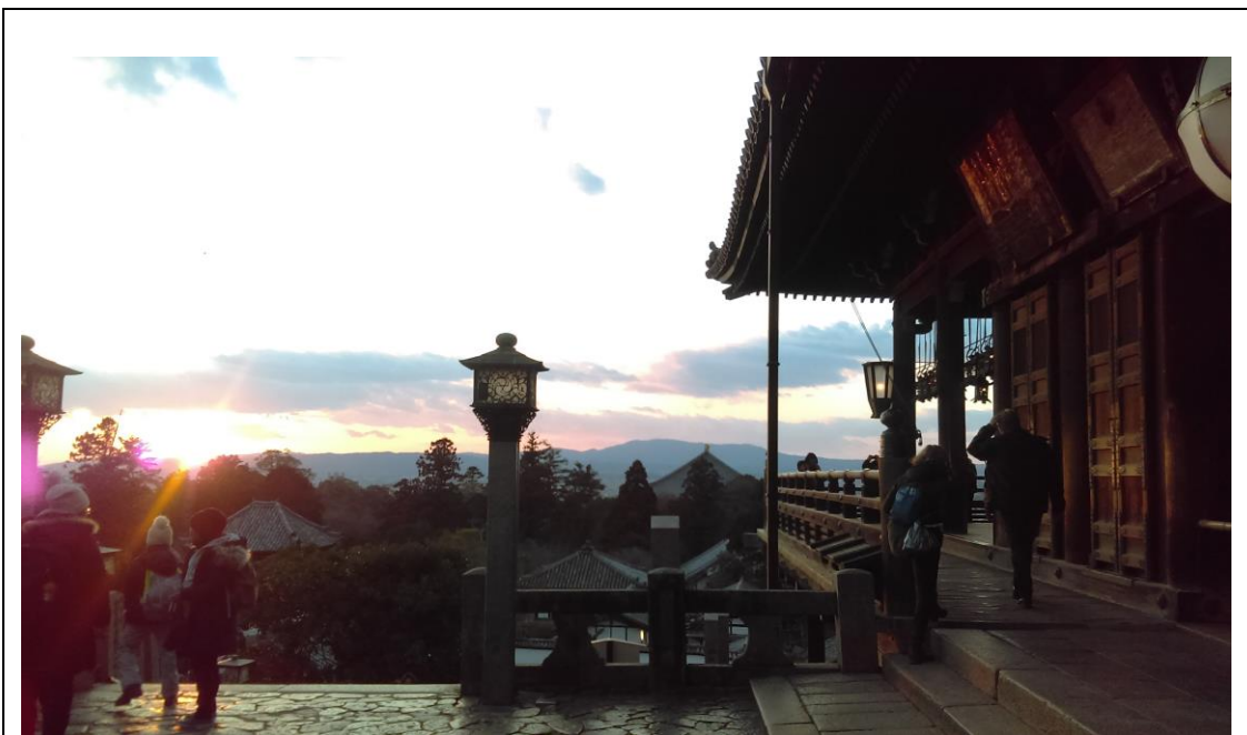
説明：東大寺。(2018-1-2 奈良市)