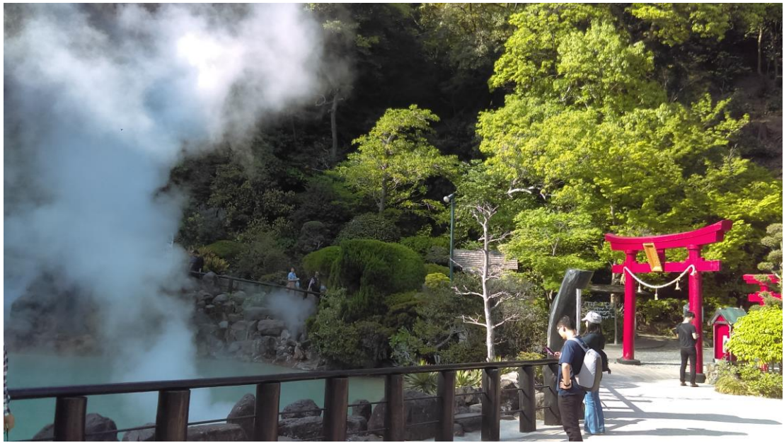
説明：別府地獄めぐり。與家人九州旅遊（2018-4-21 大分県 別府市）