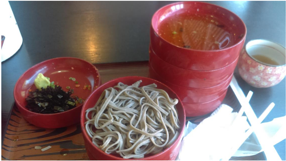
說明：“一枚一枚”的出雲蕎麥麵(2018-8-19 島根県 出雲市大社町 )