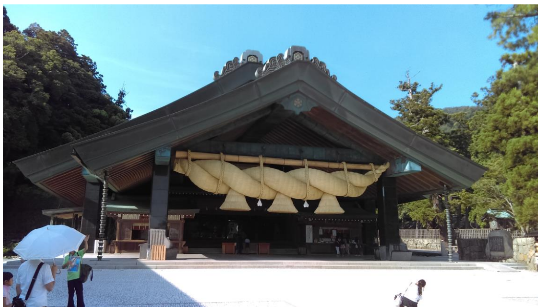
説明：出雲大社。神楽殿。注連縄(2018-8-19 島根県 出雲市大社町)