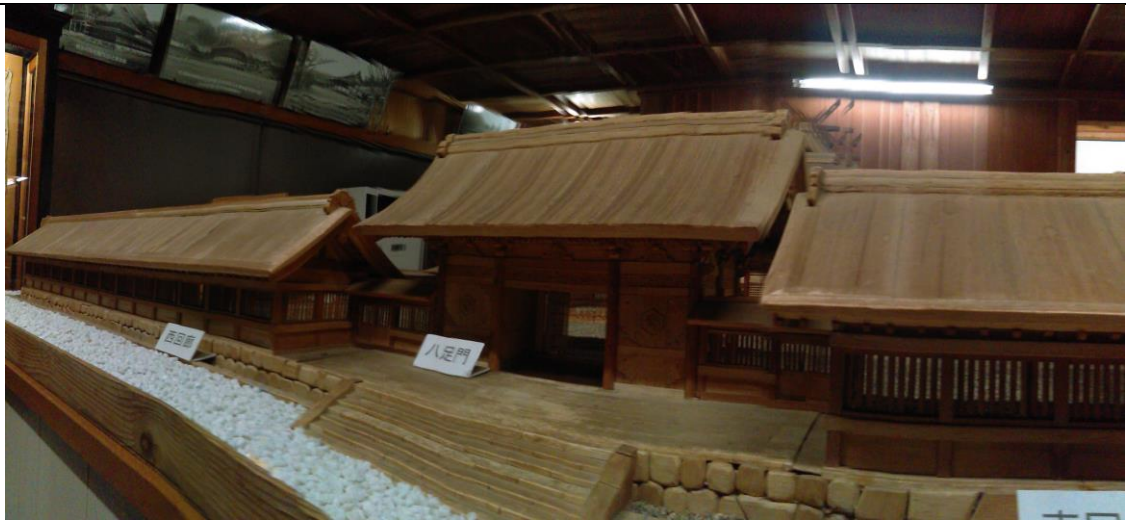
說明：出雲大社。模型(2018-8-19 島根県 出雲市大社町)