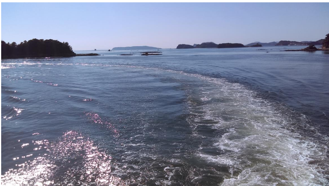
說明：參加留學生歡迎交流會。(2017-9-30 長崎縣 佐世保市 九十九島)