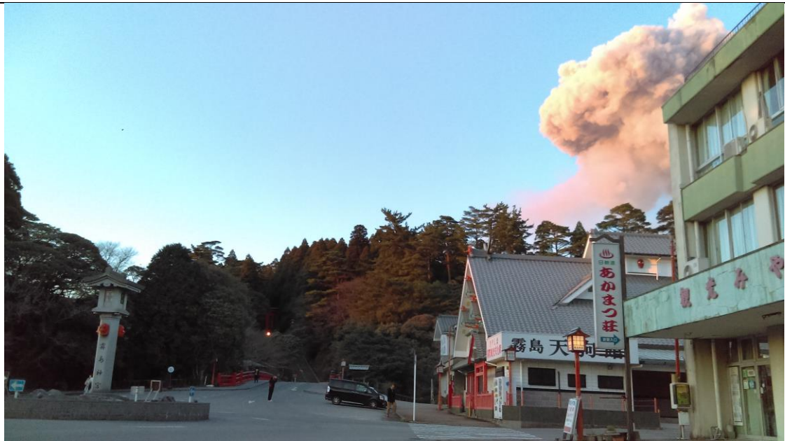
説明：霧島神宮。新燃岳火山(2018-1-3 鹿児島県 霧島市 )