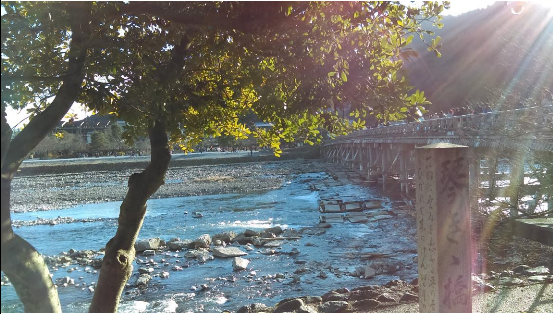
説明：渡月橋。(2018-1-1 京都市)