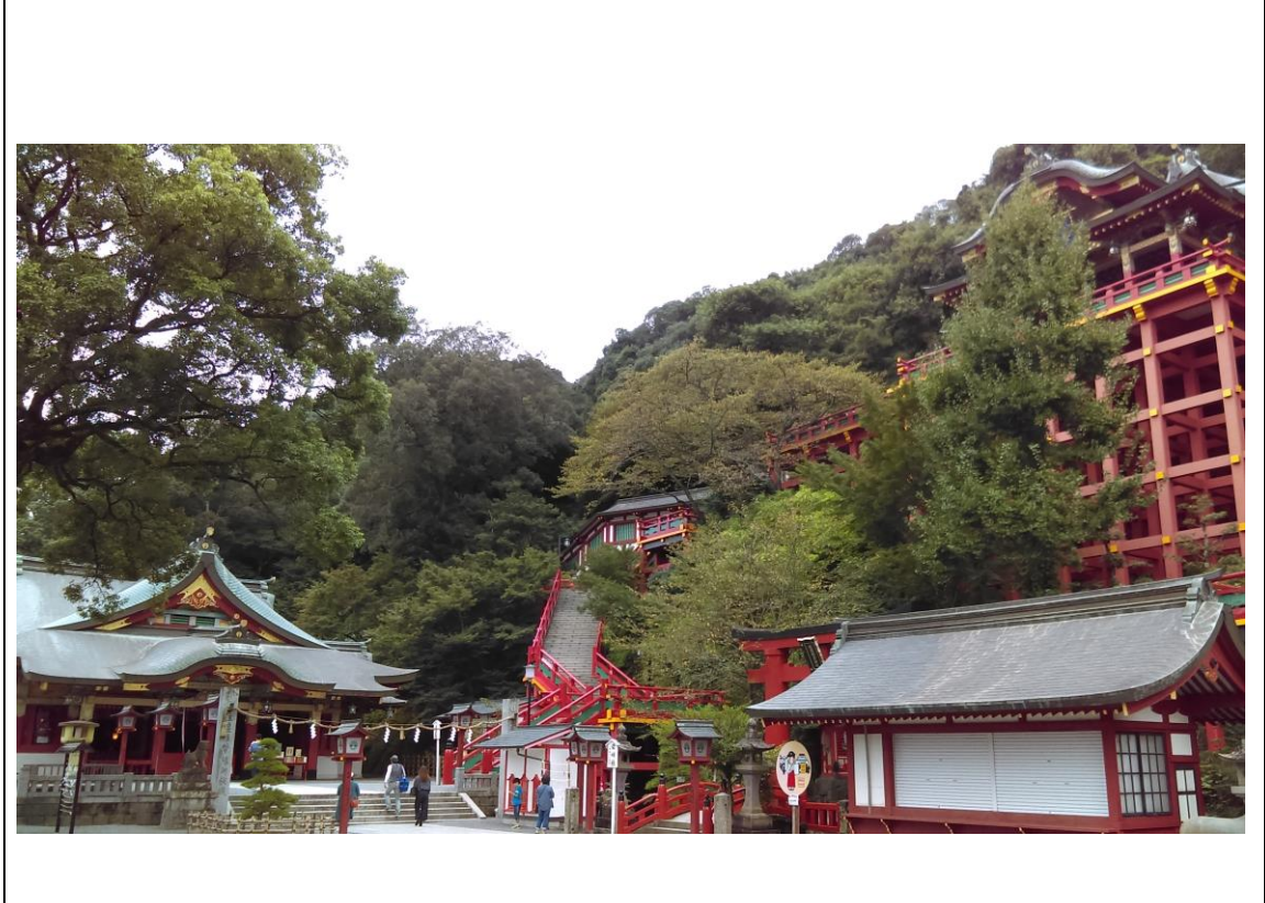
說明：祐德稻荷神社(2017-10-1 佐賀 鹿島市)