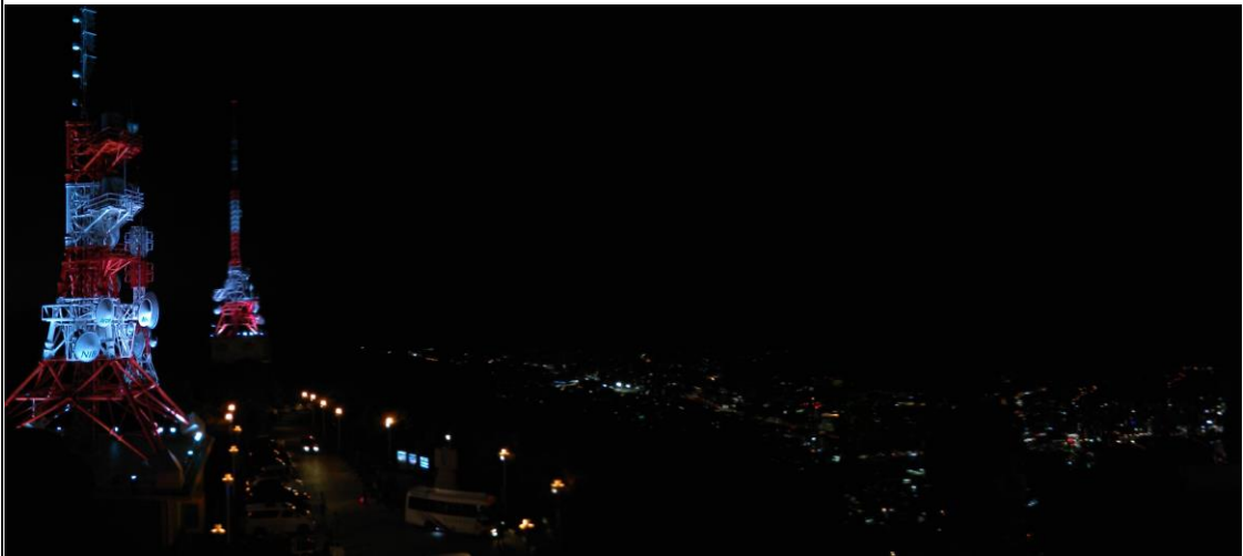
説明：稲佐山。夜景(2018-5-4 長崎市)