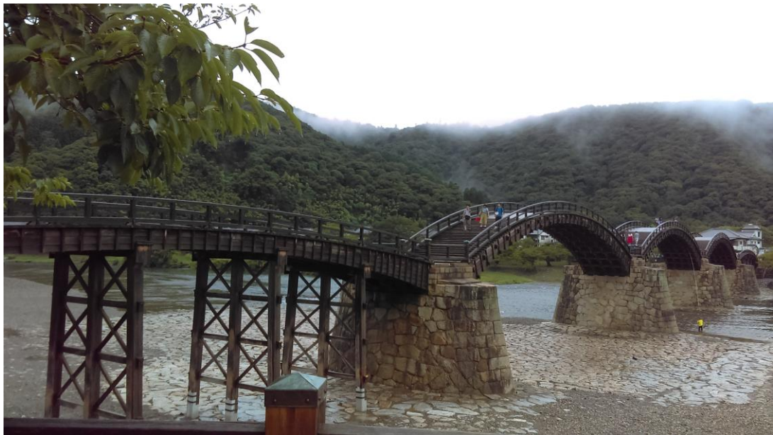
說明：錦帶橋(2018-8-16 山口縣 岩國市 )