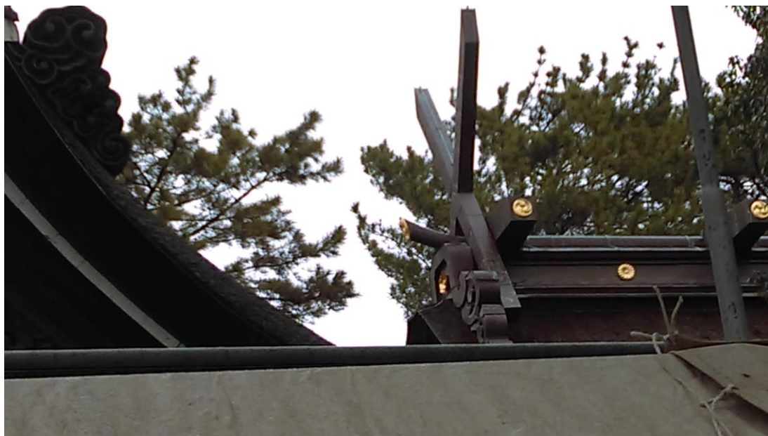
説明：住吉大社-住吉造(2018-1-5 大阪市)