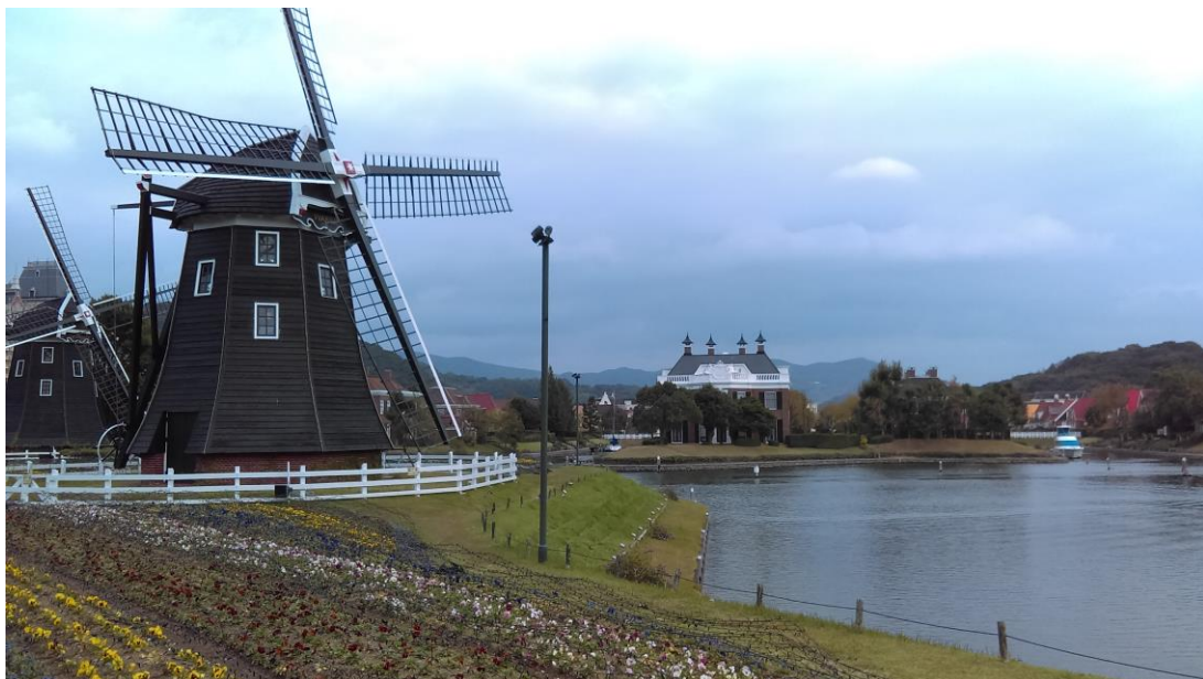
説明：豪斯登堡。(2017-11-10 長崎県 佐世保市)