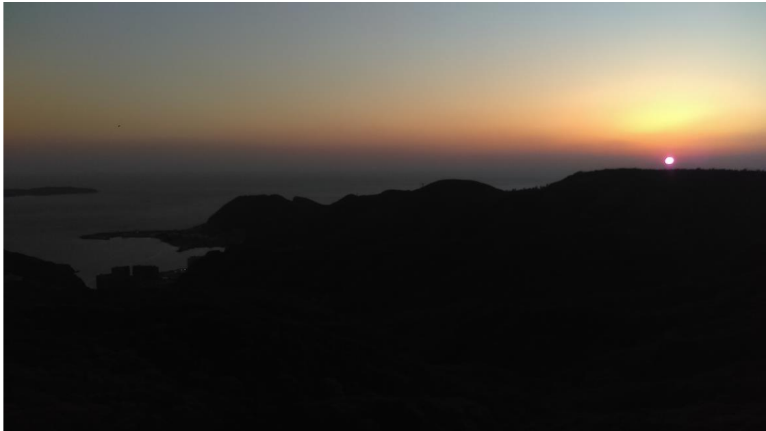
說明：稻佐山。夕陽(2018-5-4 長崎市)