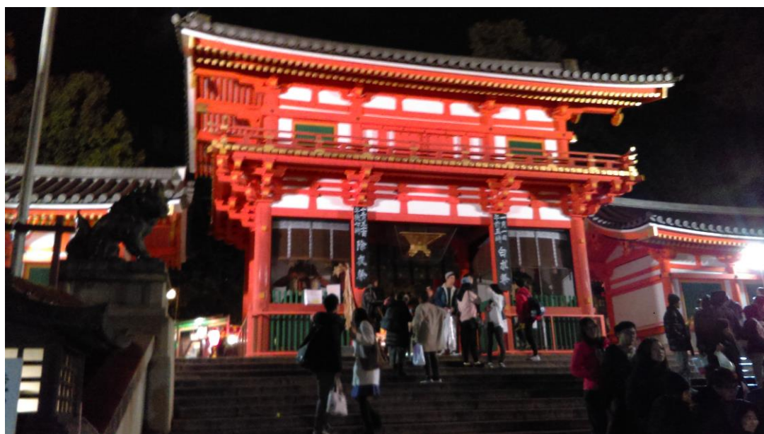
説明：八阪神社。初詣(2018-1-1 京都市)