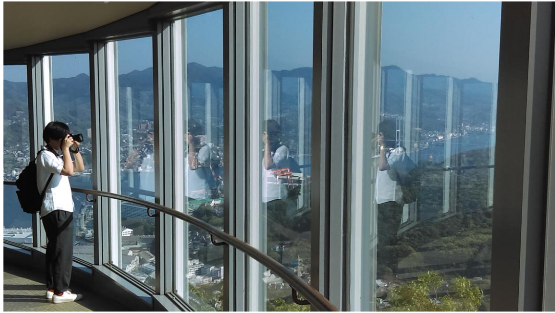
說明：稻佐山。與同僚出遊(2018-5-4 長崎市)