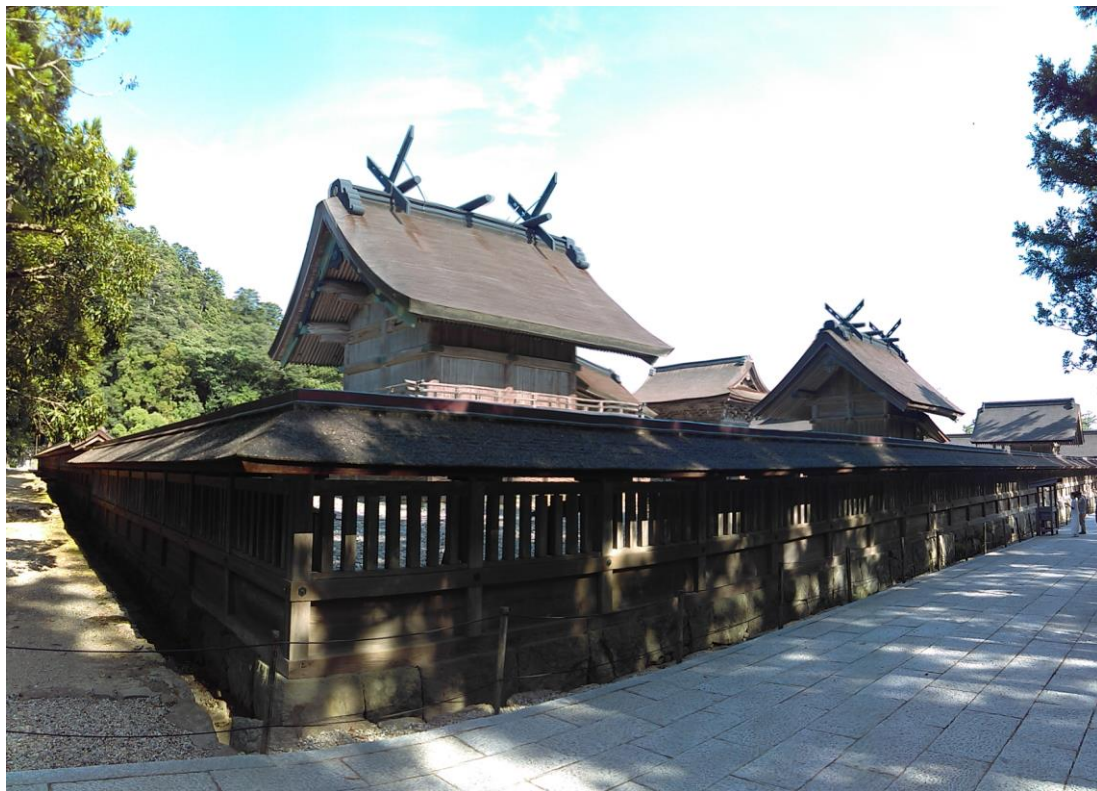
説明：出雲大社。大社造(2018-8-19 島根県 出雲市大社町)