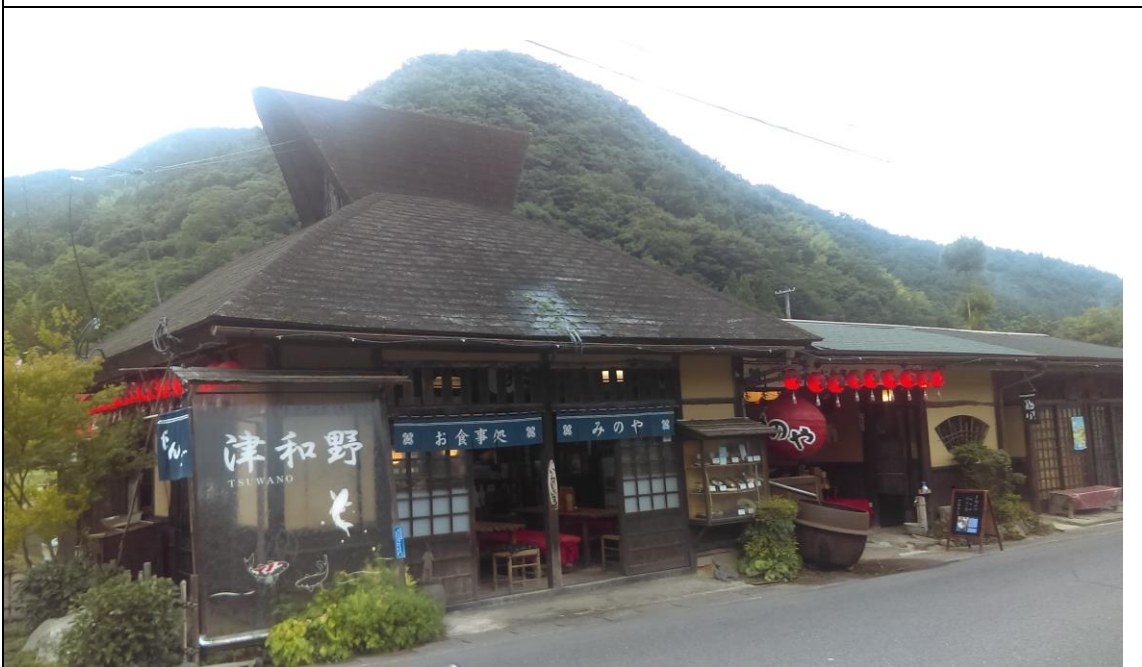
説明：津和野(2018-8-20 島根県 鹿足郡)