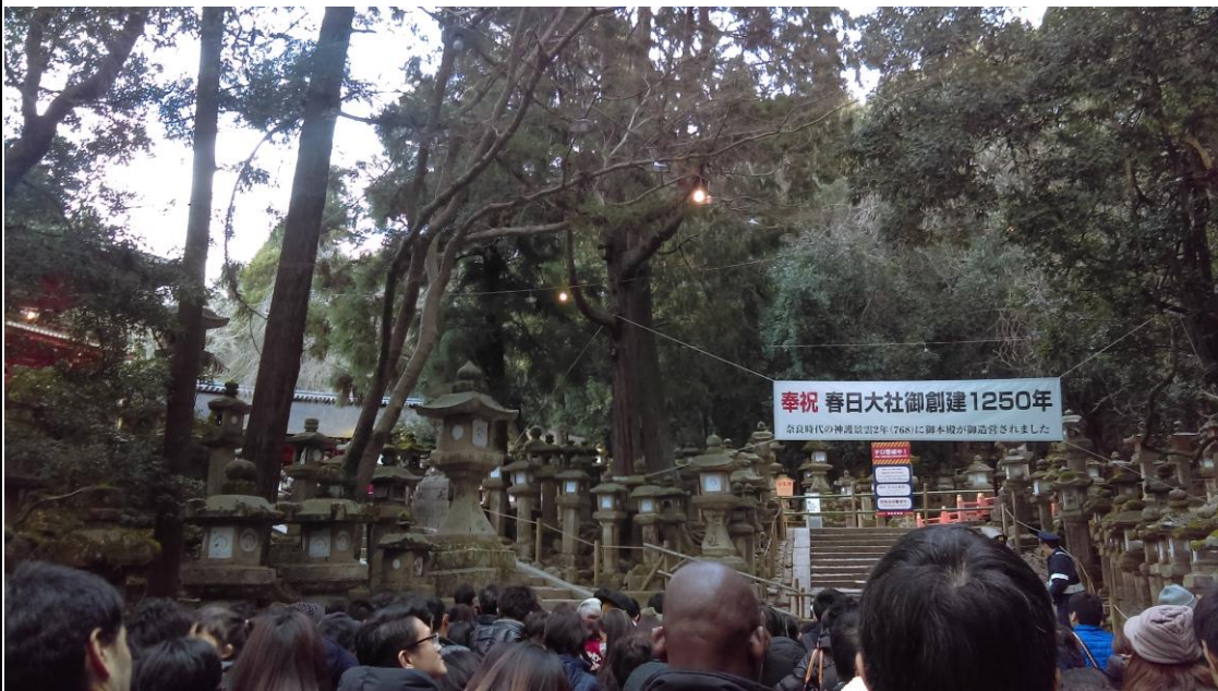
説明：春日大社。参拜(2018-1-2 奈良市)