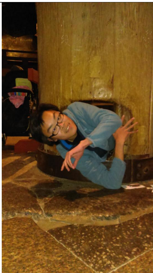
説明：東大寺。(2018-1-2 奈良市)