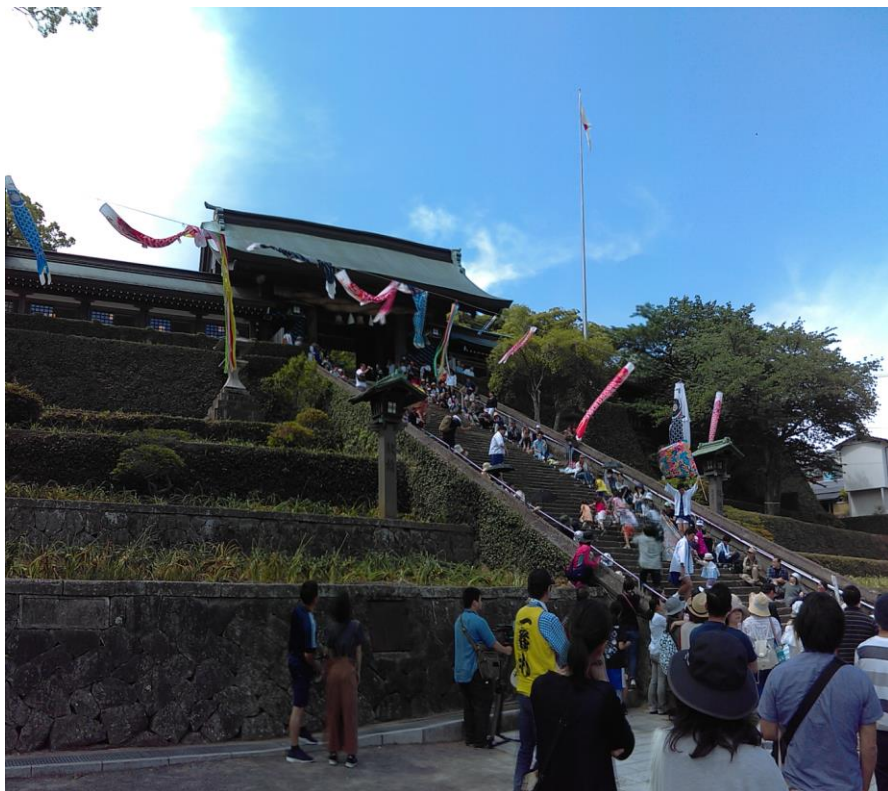
説明：諏訪神社。七五三。階段上り(2018-5-5 長崎市)