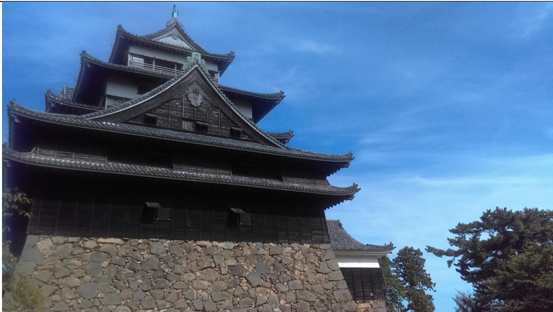
説明：松江城(2018-8-18 島根県 松江市)