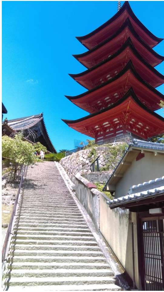
説明：巖島。豊国神社 五重塔(2018-8-17 広島県 廿日市 )