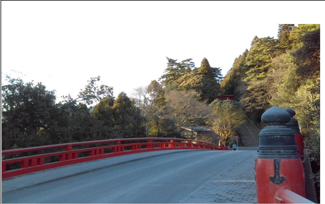
説明：霧島神宮。共 5km 徒歩路程(2018-1-3 鹿児島県 霧島市)