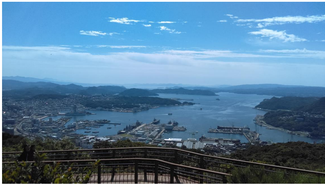
說明：留學生歡迎交流會。(2017-9-30 長崎縣 佐世保市 弓張岳)