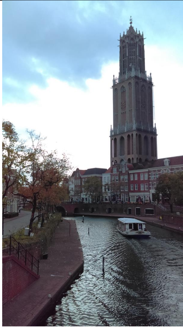
説明：豪斯登堡。(2017-11-10 長崎県 佐世保市)