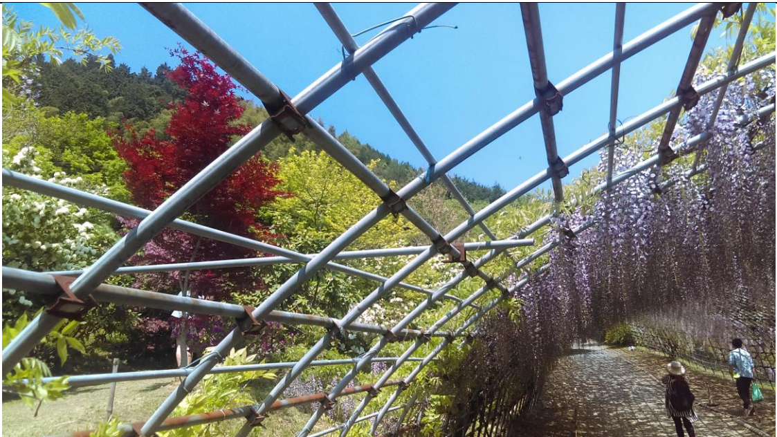
説明：河内藤園(2018-4-22 福岡 北九州市 )