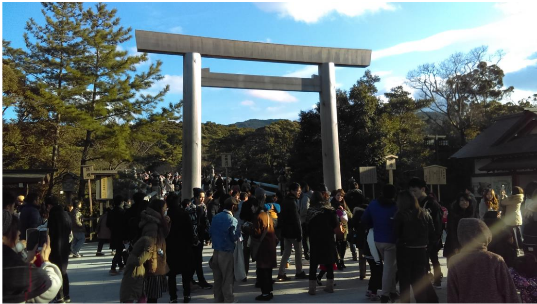
説明：伊勢神宮。参拜(2018-1-4 奈良市)