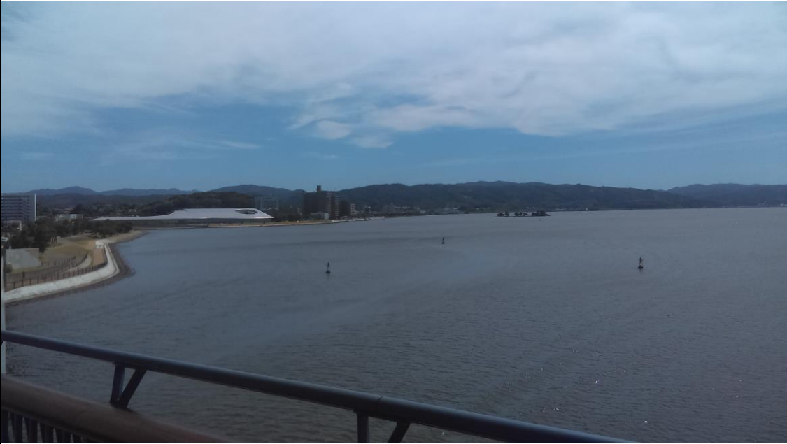
説明：宍道湖(2018-8-18 島根県 松江市)