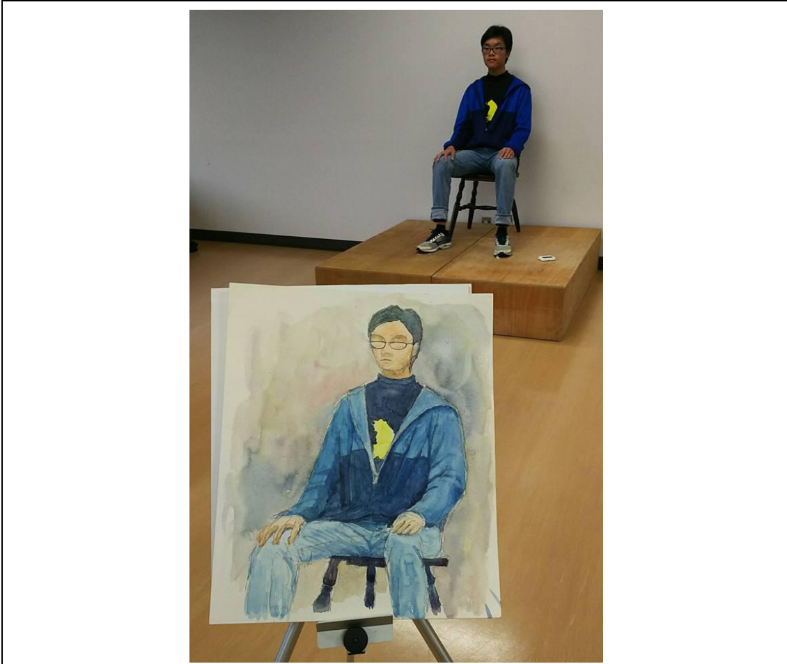
説明：短期打工。(2017-12-16 佐世保教育センター 短期バイト)