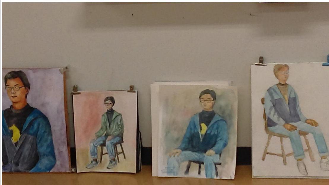
説明：短期打工。(2017-12-16 佐世保教育センター 短期バイト)