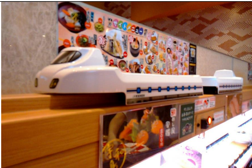
百貨公司裡的壽司店，點餐後送來時的電車 すしえもん