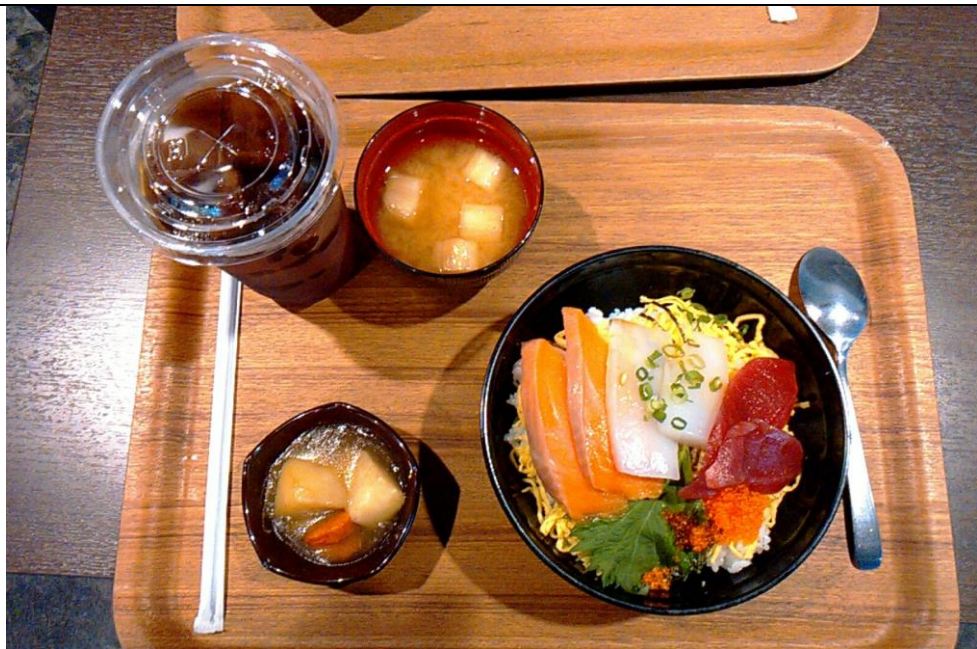
週替り丼 海鮮丼 グランエターナカフェ