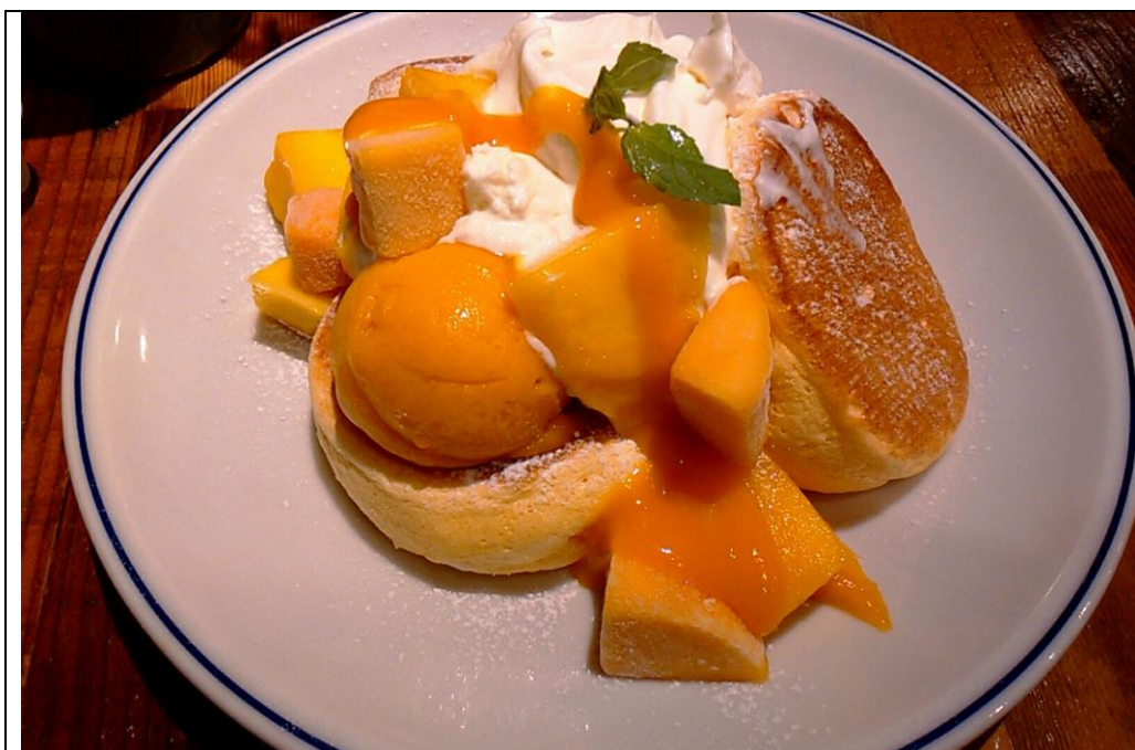
マンゴパンケーキ FLIPPER'S