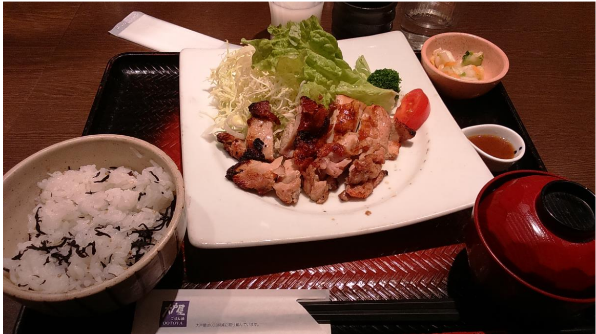
負責人帶我們辦在留卡資料和銀行開戶後來吃午餐 in大戶屋