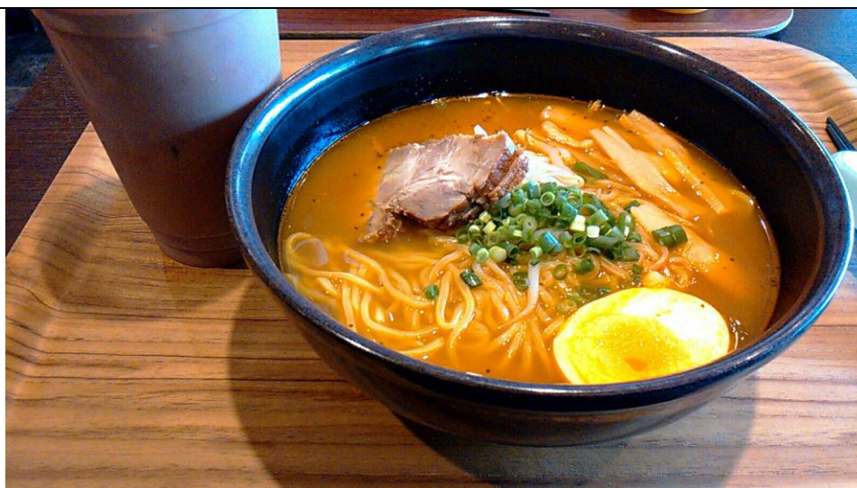
拉麵+冰可可 グランエターナカフェ