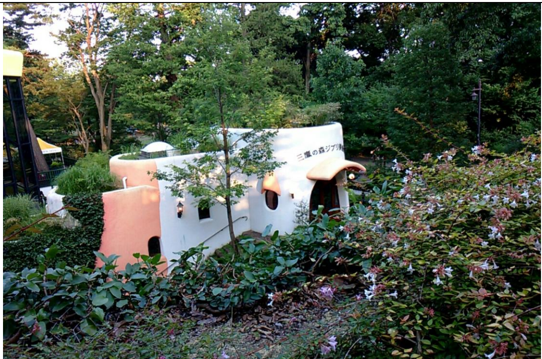
三鷹吉卜力美術館