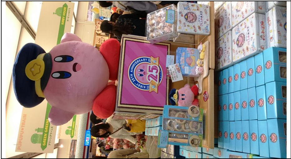
Kirby 25周年期間限定店 東京駅 キャラクターストリート