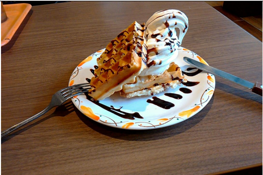
霜淇淋鬆餅 校內 オレンジカフェ