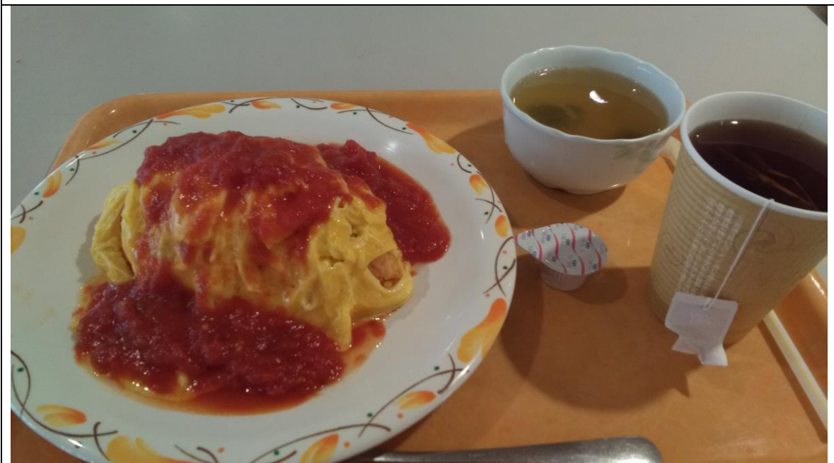
蛋包飯+紅茶 校内 オレンジカフェ