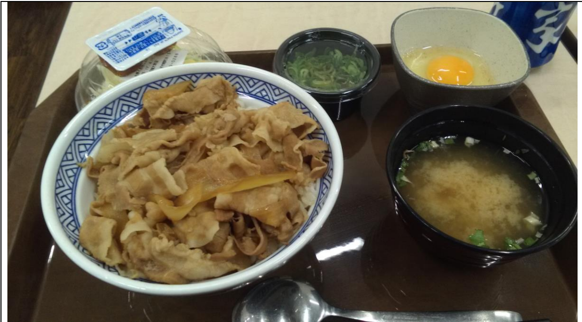
豚丼+Aセット 校内 吉野家