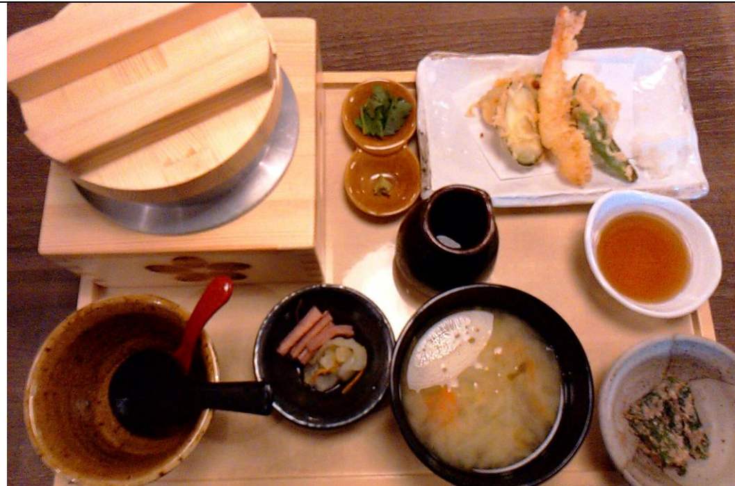
到新開的百貨公司吃飯