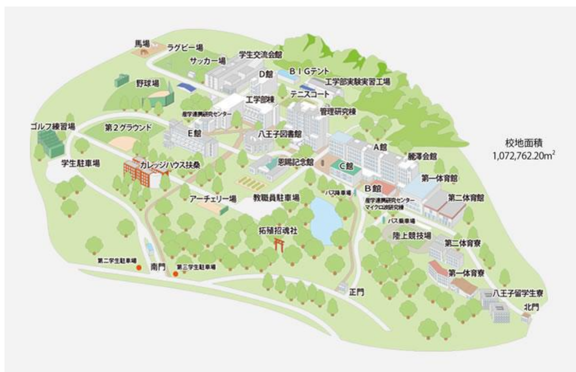
↑ 八王子校區校內導覽圖

校區範圍廣大，設有學生宿舍、學生食堂、小賣店及直通最近車站—京王高尾站的公車站。除了平日課程之外也有各式各樣的活動（社團、日本學生與留學生的交流活動等等）