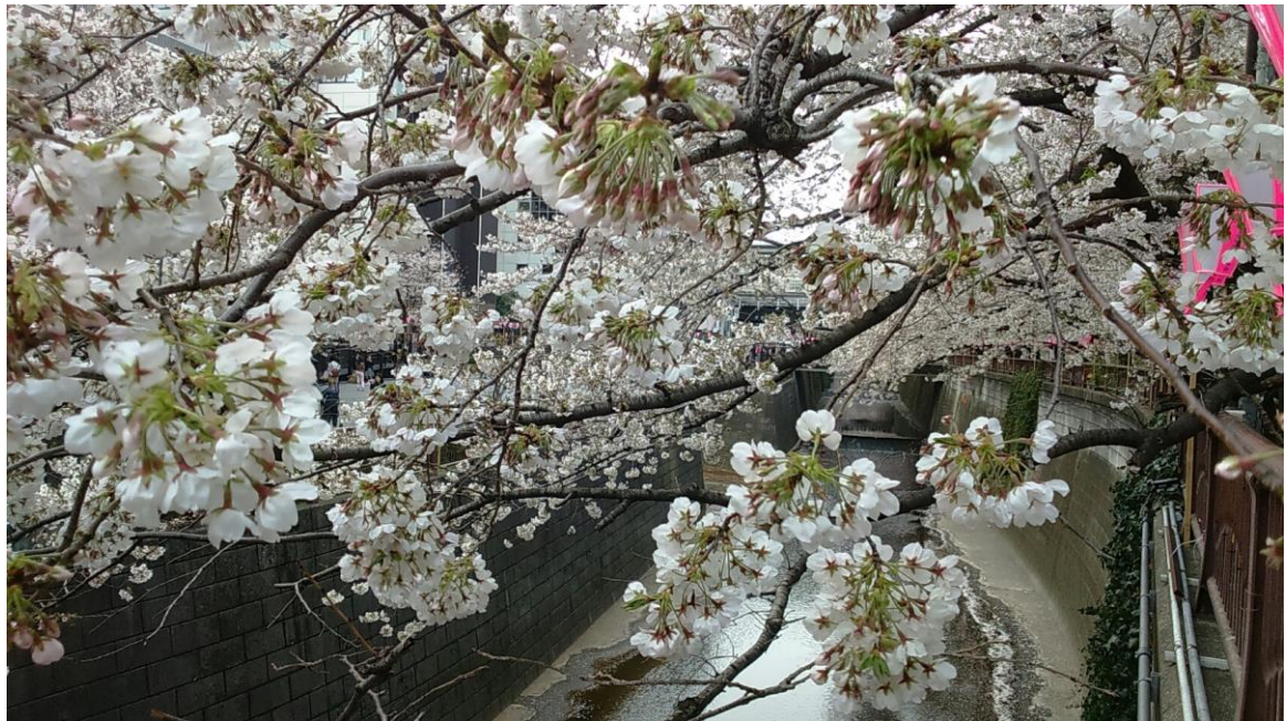
和同學們一起到目黑川賞櫻