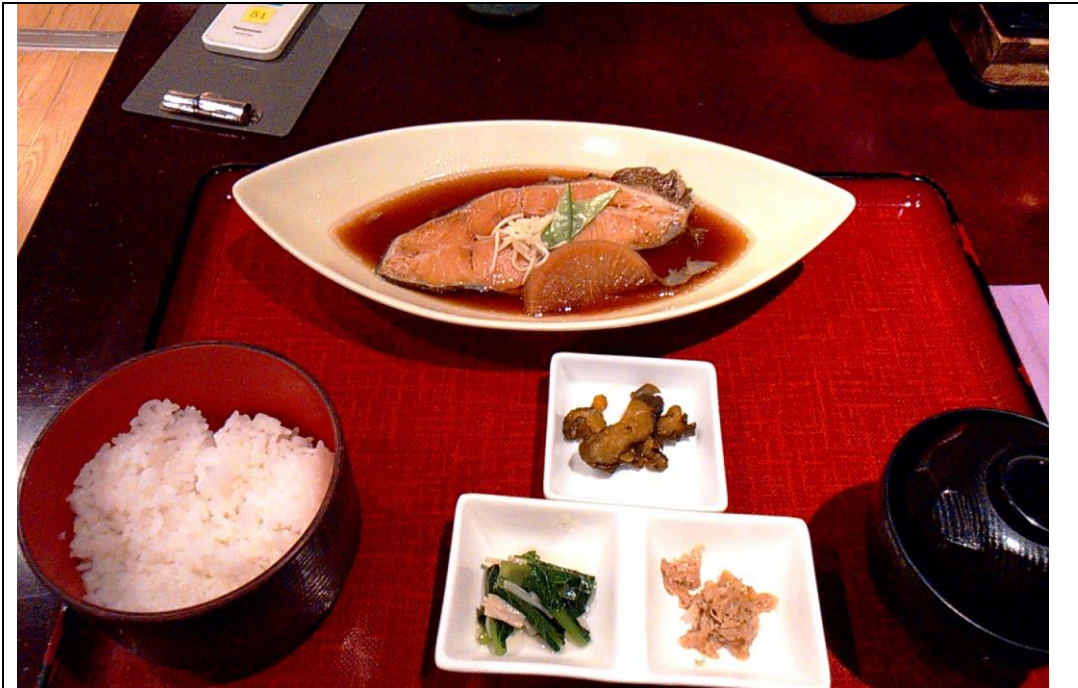
和朋友唱完歌後吃晚餐 八王子車站附近