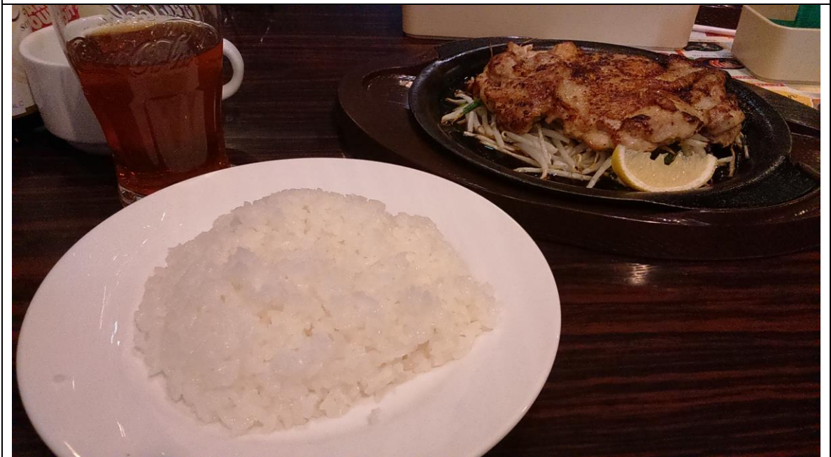
和親戚的朋友出來吃飯 ガスト