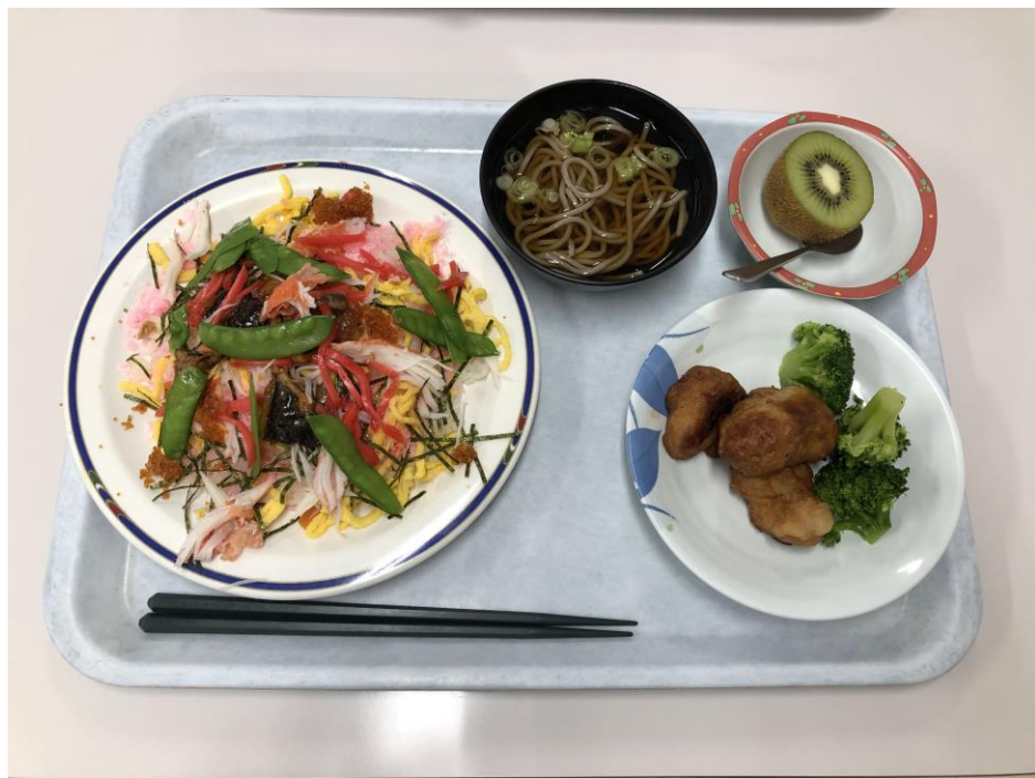
説明：一年一次的入社式員工餐。(108/04/01)