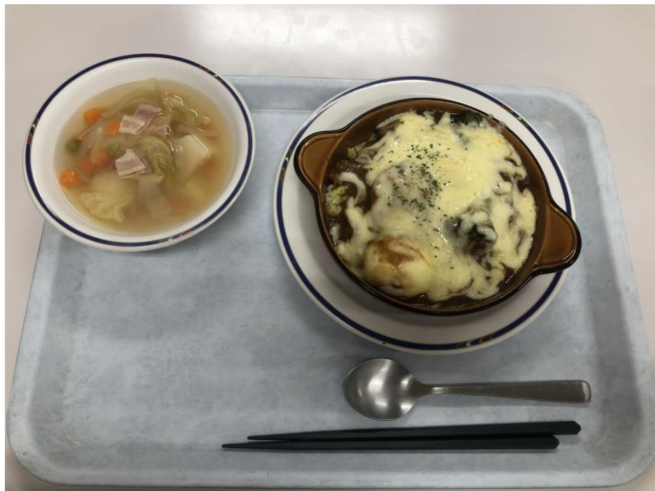
說明：最好吃的員工餐-焗烤燉牛肉。(108/05/10)