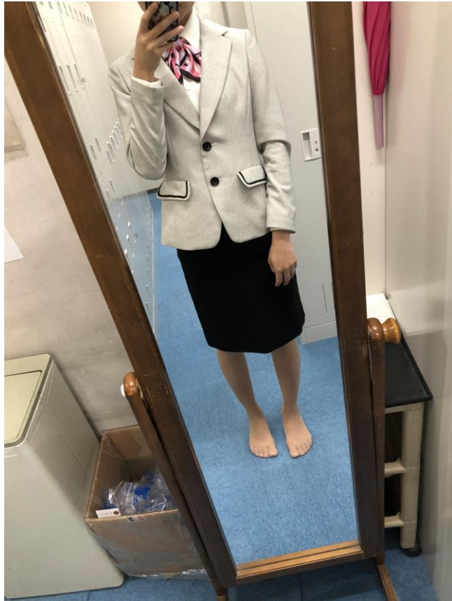
說明：櫃檯部的制服。(108/04/08)