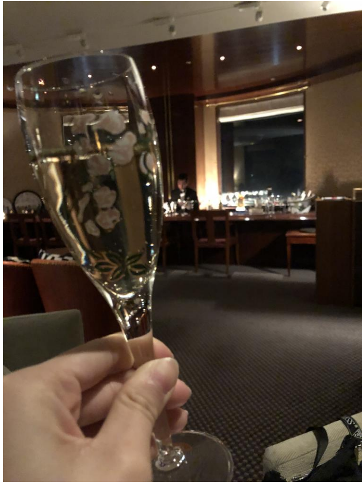
說明：飯店11樓的酒吧。(108/05/10)