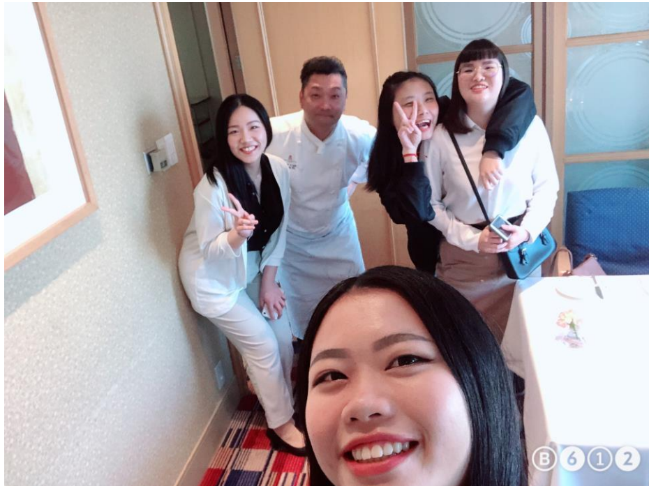
說明：與11樓的調理長合照。(108/06/02)