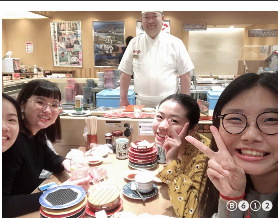
說明：晚餐去吃迴轉壽司與師傅合照。(108/04/27)