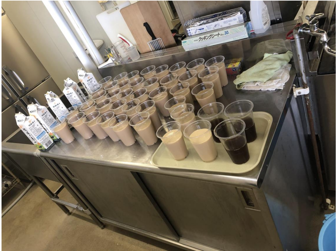
說明：做了珍奶給公司的人。(108/08/17)