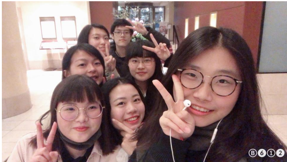
說明：東橫INN的同學來小樽玩。(108/05/10)