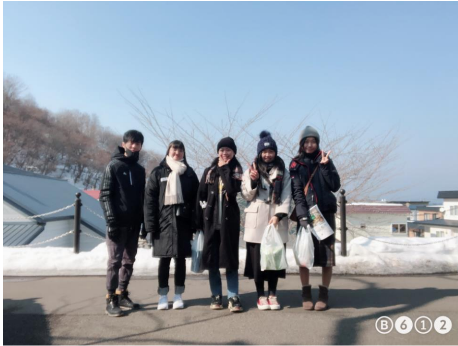
說明：與不同學校的實習生出門。(108/03/03)