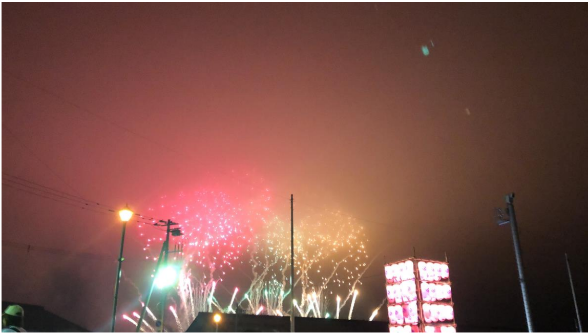
說明：一年一次的花火大會。(108/07/28)