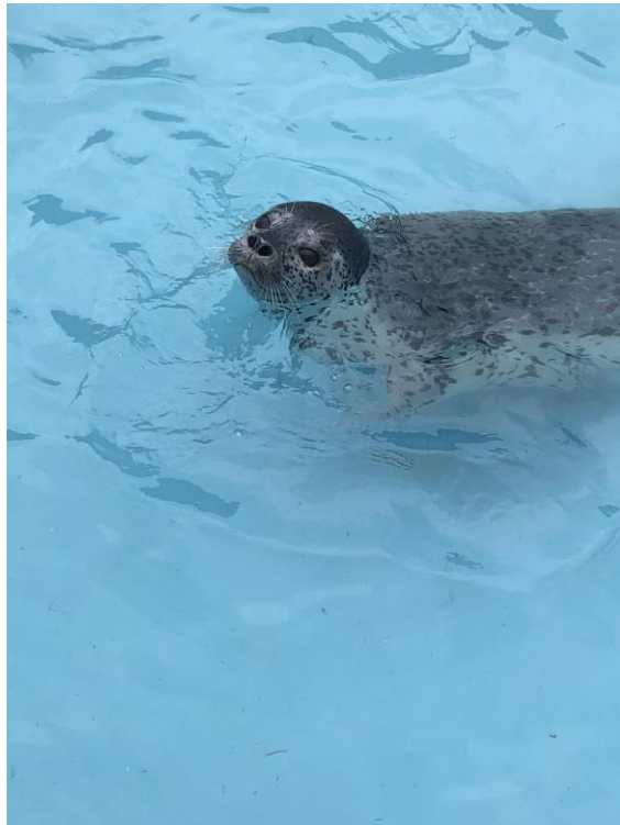
說明：去了小樽水族館。(108/04/27)