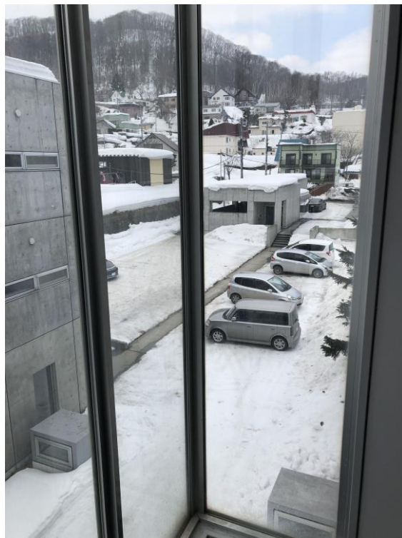
說明：宿舍走廊落地窗看出去景色。(108/03/02)