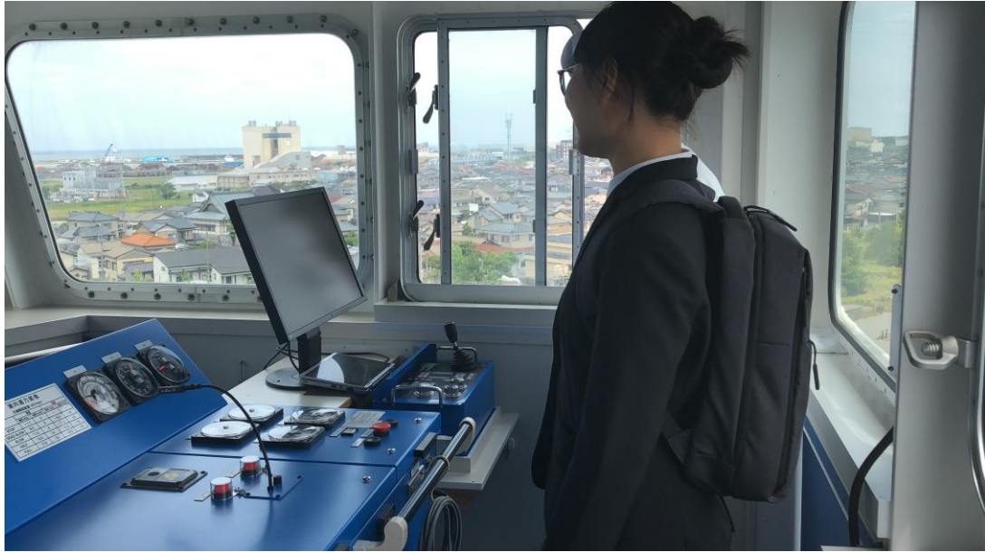
說明：在船長室體驗按鳴笛。(108/07/04)