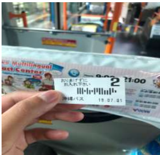
去美國村時的公車票 (2019/07/01)

當我們放假要出門玩的時候，就會上網去查詢當地的公車表，因為沖繩北部沒有像南部一樣有單軌列車，我們只能透過公車到各處玩。不過也很慶幸，名護市的公車可以到沖繩各個有名的觀光景點。所以我們在玩得上面，除了交通比較不便，不過基本的我們都有玩到。