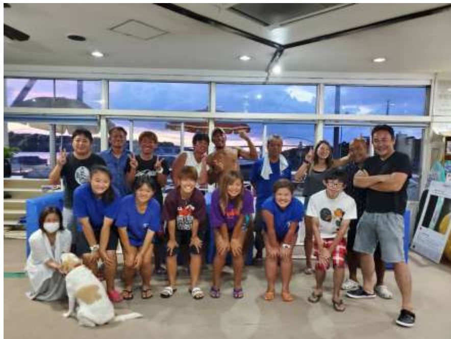
說明：會長的生日派對 (2019/07/23)