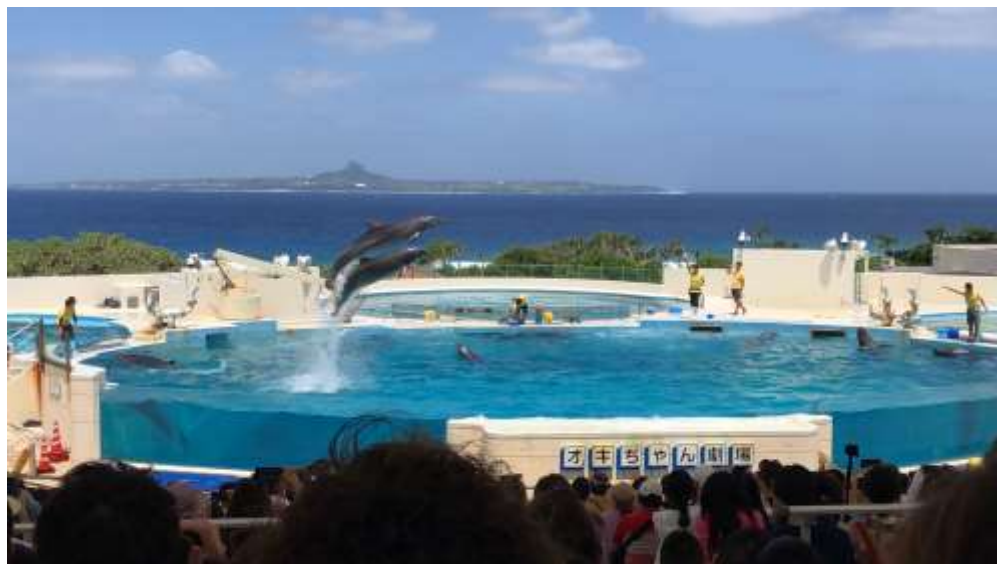
說明：美麗海水族館-海豚秀 (2019/05/22)