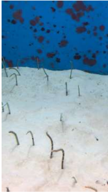
說明：美麗海水族館-花園鰻 (2019/05/22)