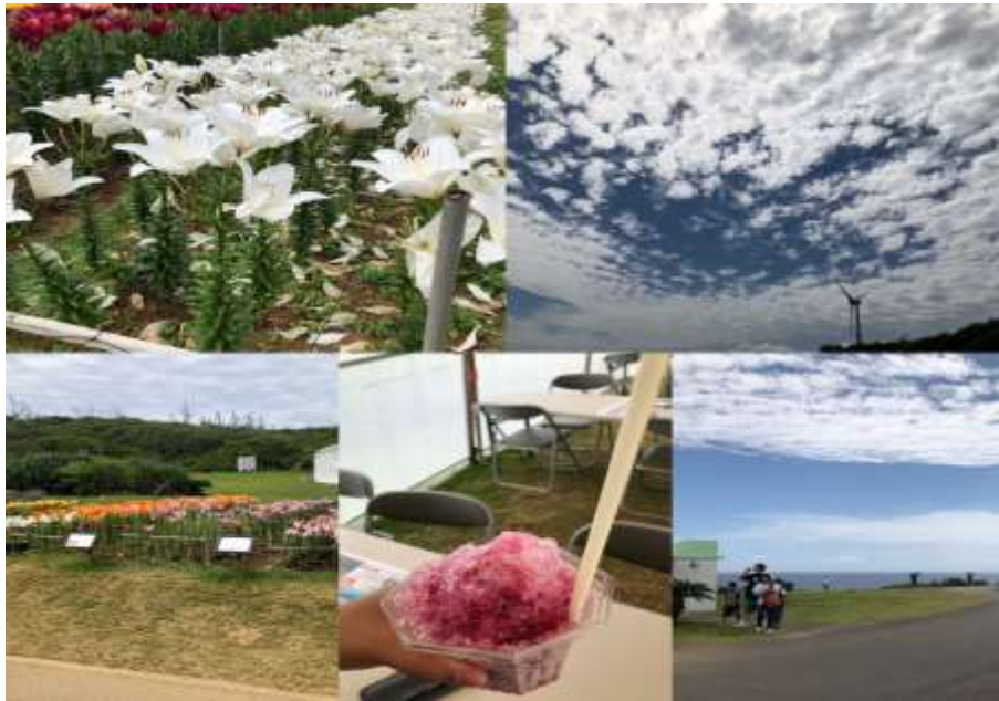
說明：伊江島百合花季 (2019/05/06)