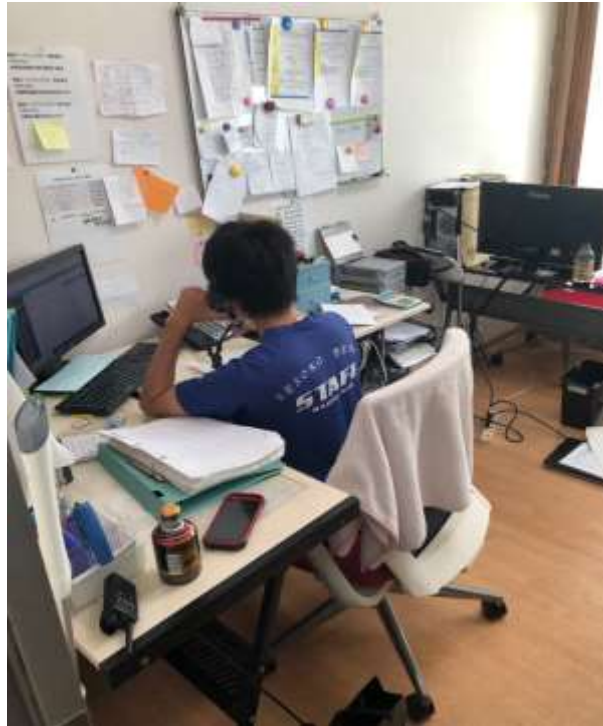
說明：同事工作畫面 (2019/08/06)