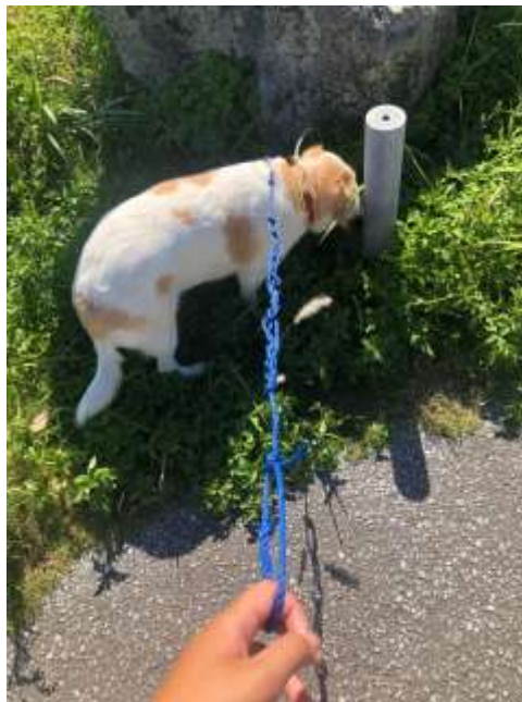
說明：工作後，帶經理的愛狗散步 (2019/07/25)