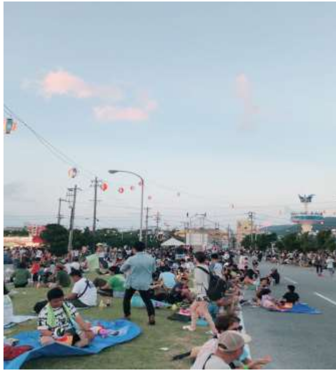
說明：名護市煙火大會 (2019/07/27)