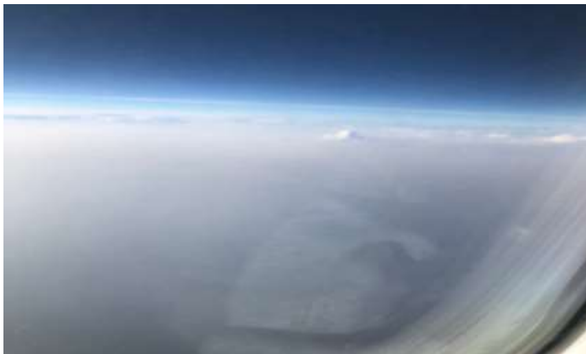
在沖繩與台灣之間的上空(2019/03/25)

不過出發前，也是充滿不安與興奮。一方面害怕自己到職場後，沒辦法獨自面對日本客人，而且對於第一次站櫃檯的我還是非常緊張。另一方面也期待自己可以在沖繩好好的體驗來自各國的文化以及日本當地的生活。最後調適了自己的內心情緒，就這樣懵懵懂懂地出發去沖繩了。