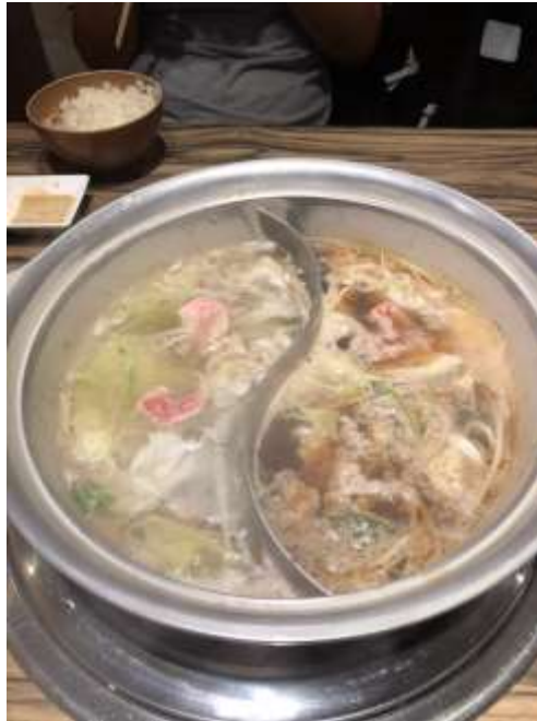
說明：美國村的涮涮鍋（2019/07/01）