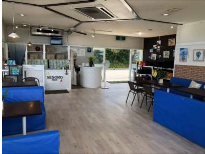
說明：整修後的店鋪 (2019/08/05)