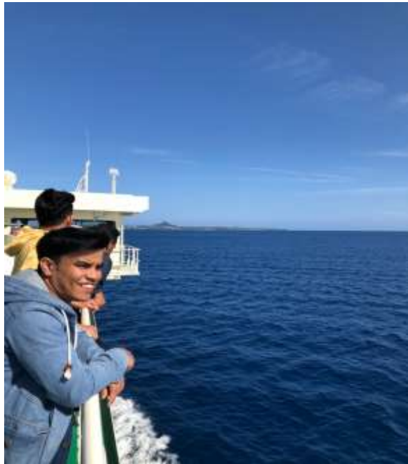
說明：前往伊江島的船上之外國留學生 (2019/05/06)