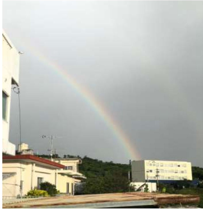
說明：雨過天晴的彩虹 (2019/08/01)