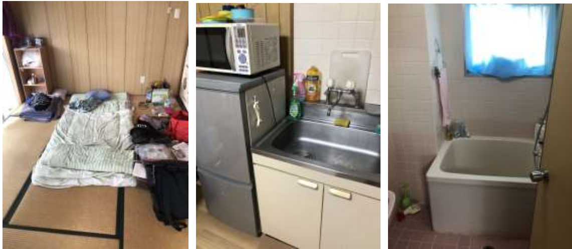
從左到右分別為房間、廚房、浴室(2019/04/01)

後面搬到新宿舍後，除了有小廚房、小客廳、兩間小和室、廁所、浴室、跟一間現在是日本室友住的房間。房租的部分，是直接從薪水裡面扣除。好處是，包含水電費，還有很重要的網路。而且宿舍附近有超商、超市、郵局等等的，努力一點的話，走路10分鐘可以到麥當勞。生活機能上已經算是非常方便了。