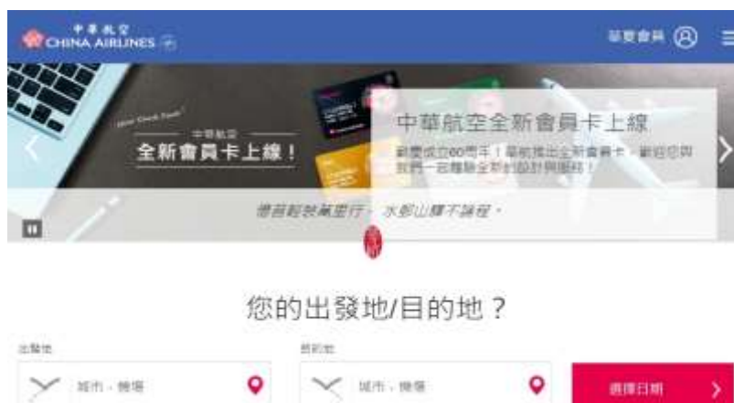
中華航空官方網站(2019/03/22)

我們瀨底只有兩位，也因為時間緊迫，所以我們只買去程的華航機票。回程的機票我們是在日本購買台灣虎航。