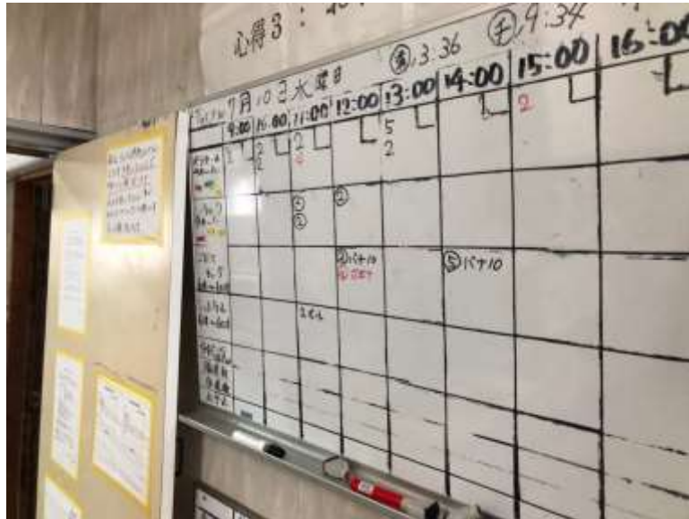
說明：每天的預約白板表 (2019/07/10)