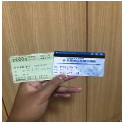
日本健保卡及醫院診療卡(2019/04/02)