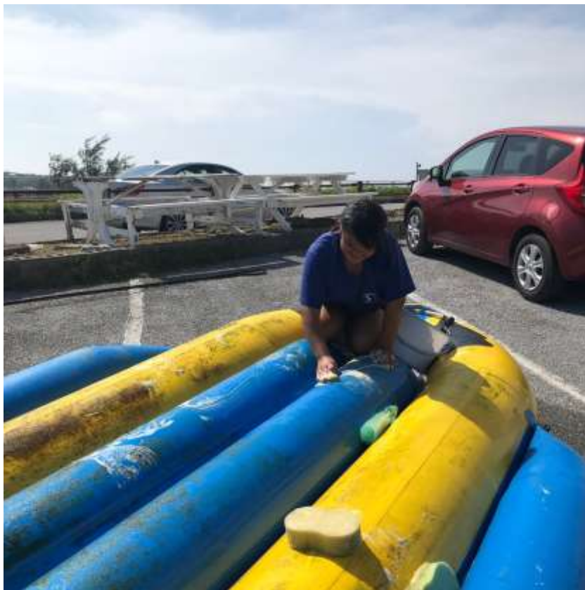
說明：清洗公司的香蕉船 (2019/07/11)