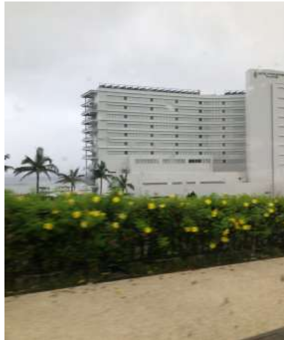
說明：到飯店接香港客人 (2019/08/02)