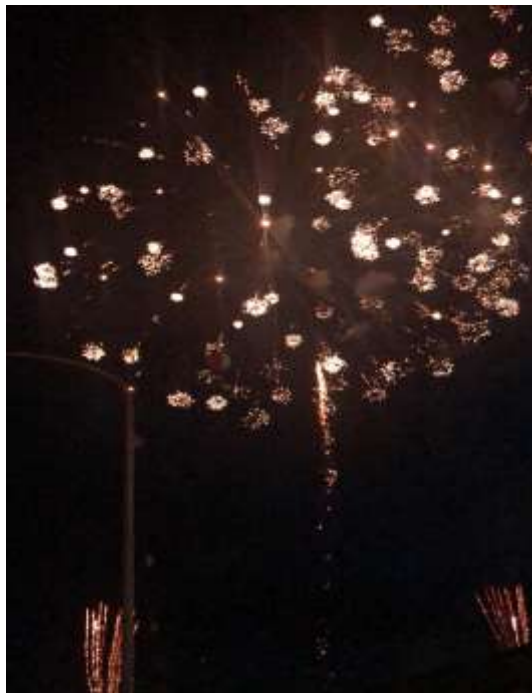
說明：名護市煙火大會 (2019/07/27)