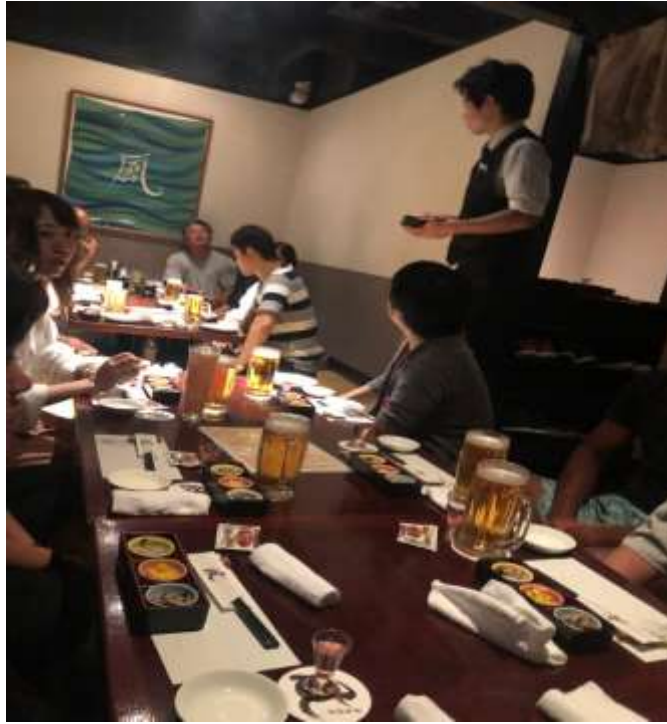
說明：全體員工跟社長和會長的聚餐（2019/06/09）