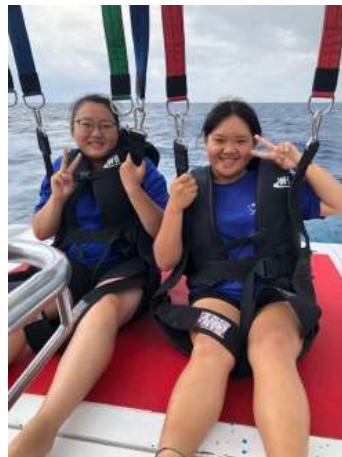
體驗公司的拖曳傘(2019/05/05)

還有只要有在這邊工作的員工，朋友跟家人的部分，體驗的費用可以打折，甚至人數少的話公司可以直接讓你們免費體驗，每一位新員工也會體驗公司大部分的項目，為的就是讓自家的員工可以更了解每個項目，還可以順便跟客人介紹和說明這些項目哪個好玩、哪個適合小朋友、哪個比較刺激。