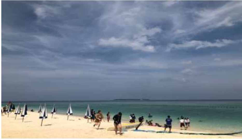
說明：國中生畢業旅行工作-瀨底海灘 (2019/05/25)