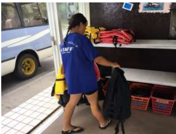
跟客人收他們回來後的救生衣

然後有些客人在回來後，會問一下剛剛在船上拍的照片之類的，所以就也要學會說明照片怎麼取得，從哪取得，大概什麼時候會有。有些則會問：「誒 這附近有什麼好吃的還是好玩的」，然後因為公司附近的觀光景點也算蠻多的，所以就介紹給他們，因為自己也去過，覺得很好，很適合觀光。