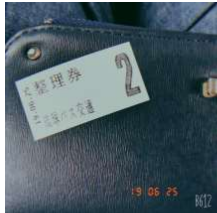
沖繩的 120 號公車跟整理卷 2019/06/25