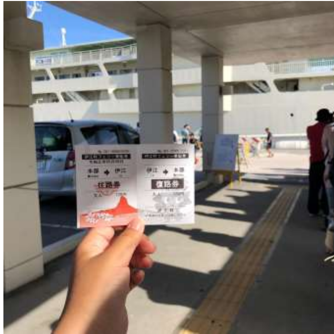
說明：搭渡輪去江島體驗百合花季 (2019/05/06)