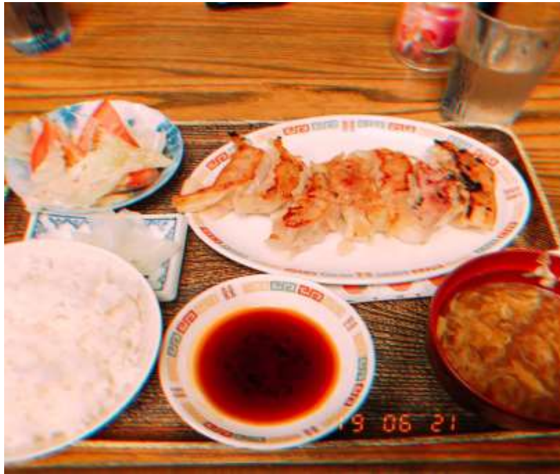
說明：跟住在一起的日本人去吃晚餐 (2019/06/21)