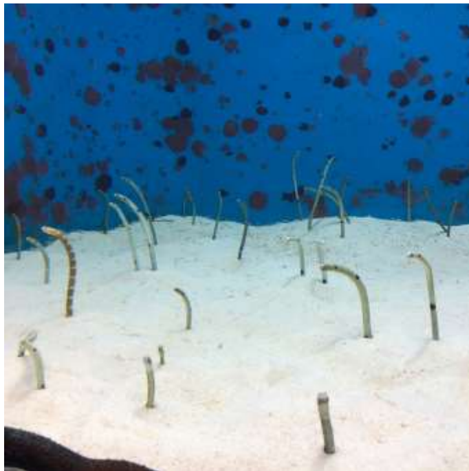
說明：「沖繩美麗海水族館」-花園鰻 (2019/05/21)