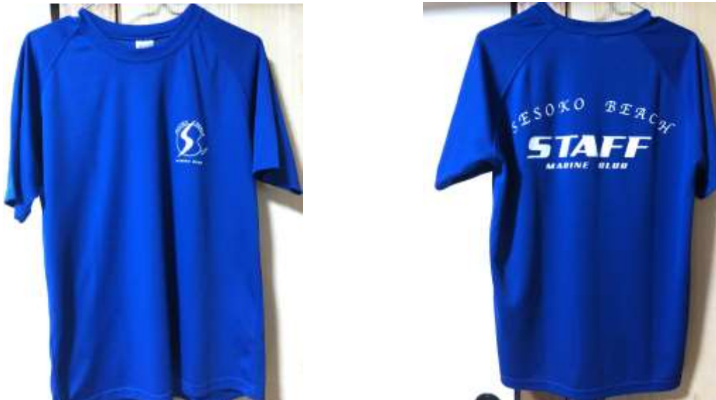
公司制服正面及背面(2019/03/26)

一開始公司跟沖繩這邊的負責人有交代說多帶點短袖跟短褲，不過因為想說有要出去玩，所以有帶著一些自己平常在台灣喜歡穿的衣服過來，公司也有發員工制服給我們穿，褲子就穿我們自己帶過來的短褲，鞋子的部分是拖鞋，因為會碰到水會濕掉，所以是以方便為主，就穿了拖鞋上班。