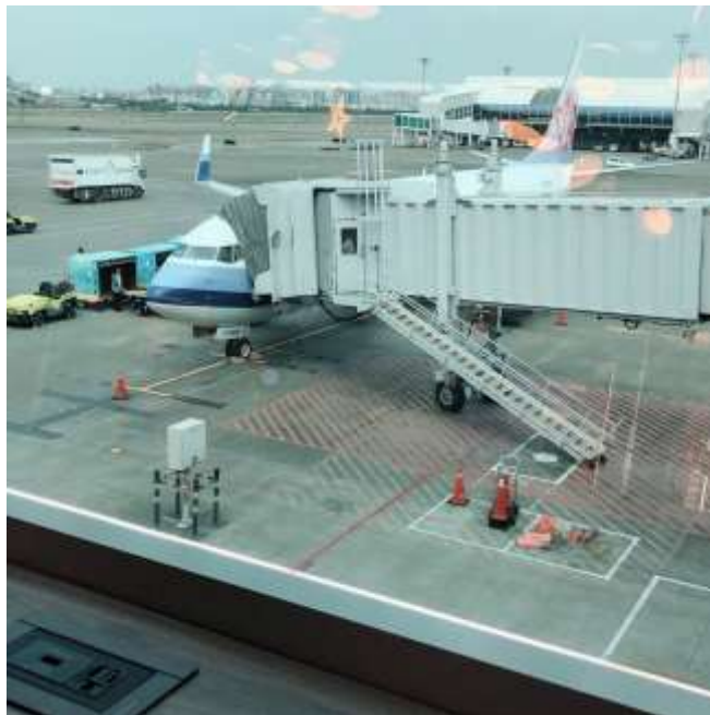
前在小港機場等待的時候(2019/03/25)

之所以會選擇到日本實習是因為可以體驗看看日本的職場文化，在台灣的時候有「日本文化」這門課程有說到日本的職場文化跟台灣有些許不同，也可以藉由這個實習機會體驗到日本的各種文化，例如參加他們這邊的祭典等等的。