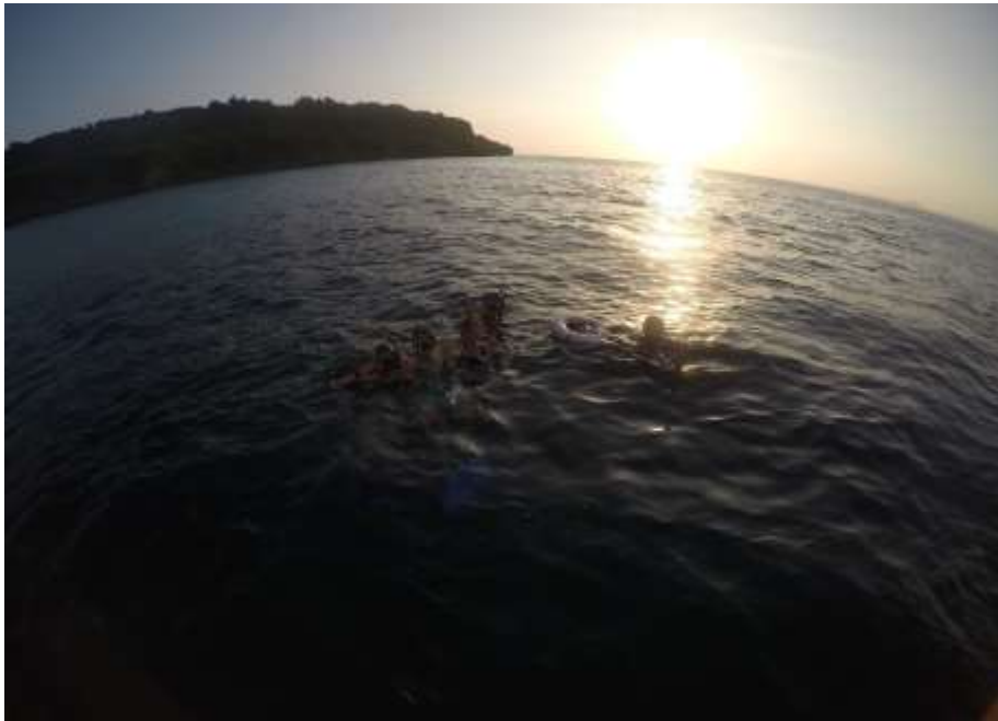
說明：跟同事們下班後一起去浮潛 (2019/07/14)