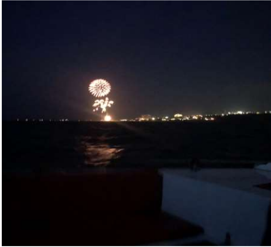
說明：在船上看「美麗海水族館」的煙火大會 (2019/07/13)