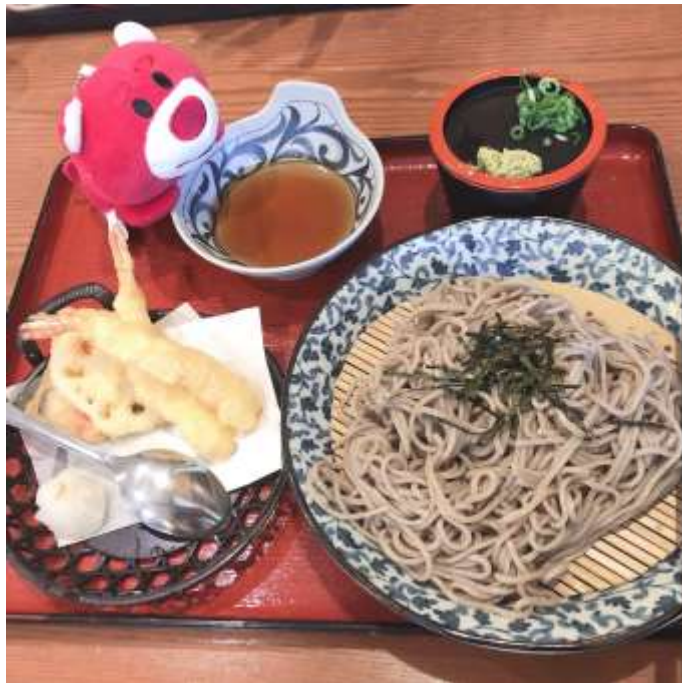
說明：一起放假跑去「AEON」百貨公司吃飯(2019/06/01)