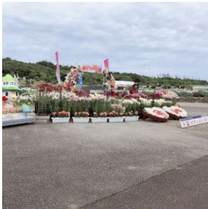
說明：伊江島百合花季 (2019/05/06)