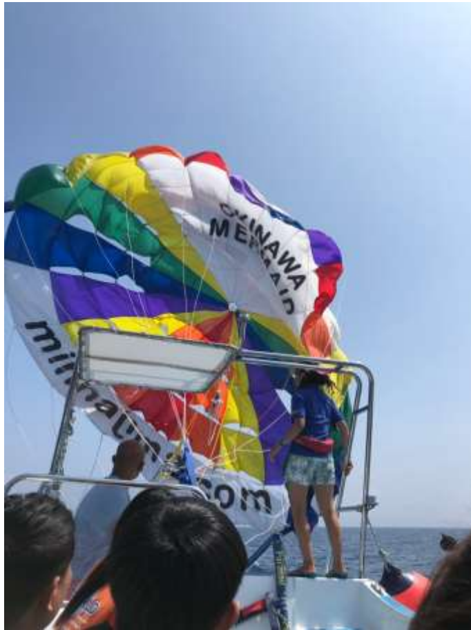
説明：擔任外國人的拖曳傘翻譯(2019/04/08)