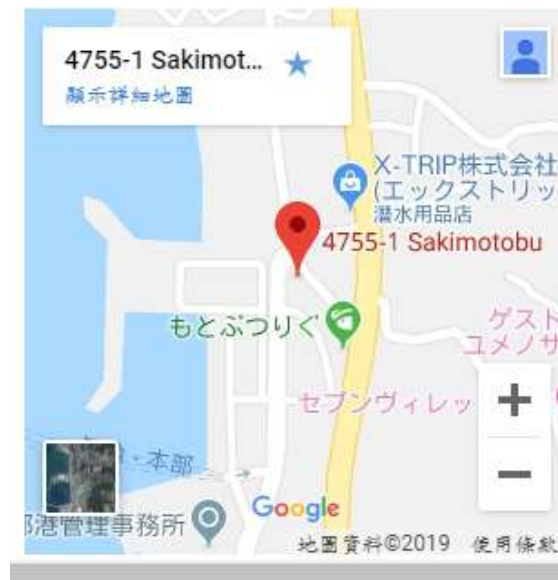
店舖跟簡略的 google 地圖 (2019/08/07)