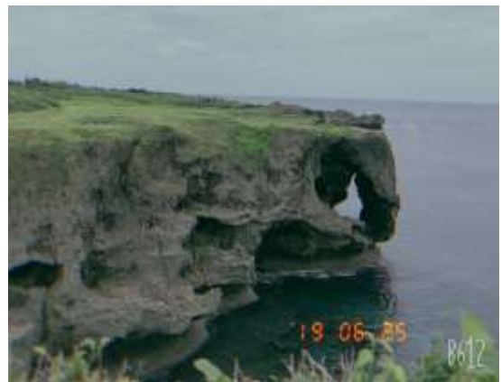
自己放假搭公車到「萬座毛」觀光 2019/06/25