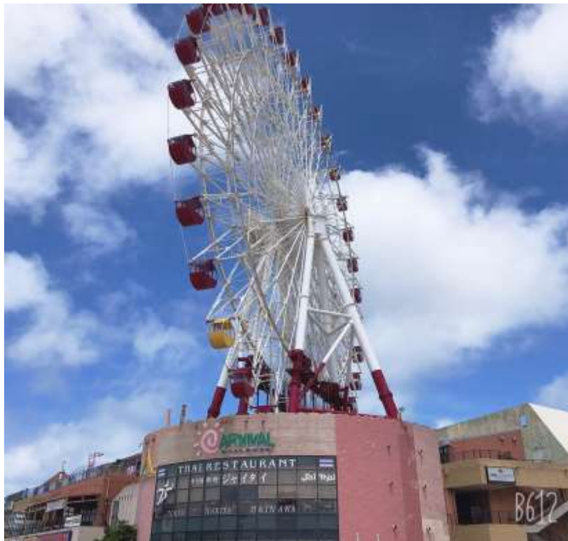
說明：兩個人踩點-「美國村」(2019/07/01)