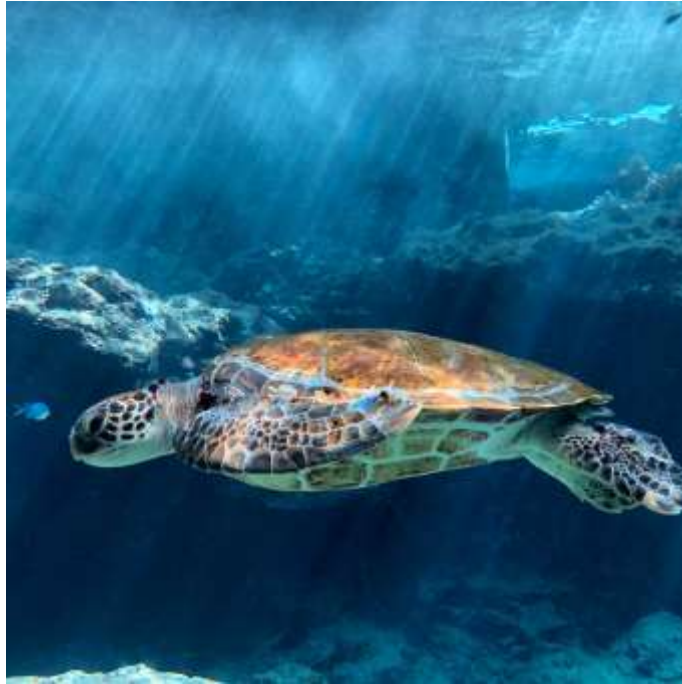
說明：「沖繩美麗海水族館」-海龜 (2019/05/21)