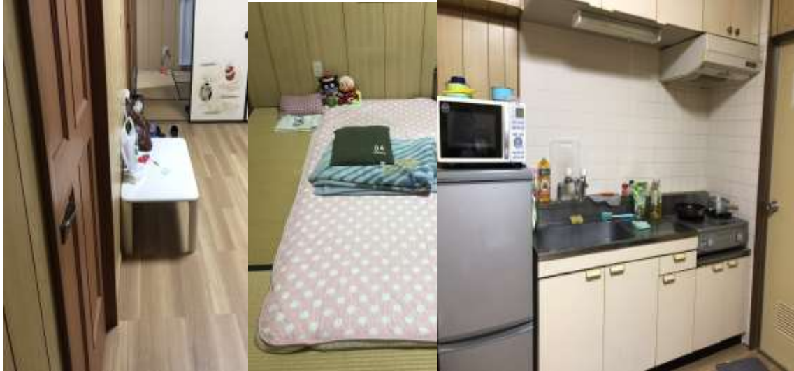
從左至右是小客廳、房間、小廚房 (2019/04/01)

3/25 到那霸因為已經傍晚了，所以在租車公司的同學他們公司的宿舍借住一晚，隔天再搭公車到公司，3/26 開始有一個禮拜住在公司的二樓，因為那個時候還在簽新的宿舍的合約，所以暫時借住在公司樓上，4/1 開始就正式搬過來新的宿舍這了。一開始也很怕料理不方便，沒想到這裡有跟客廳合併一起的小廚房，也乾濕分離，廁所跟浴室有分開，還有兩間榻榻米的房間，一間是木製地板。