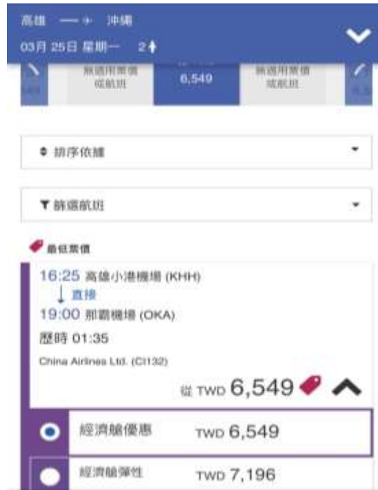
華航訂機票的頁面(2019/03/22)

一開始原本想說做虎航就好，因為想說距離蠻近的，不過因為要來的時候行李比較多，所以最後還是選擇了中華航空，因為最初不確定實習結束的日期，所以就只先買了去程的機票而已。