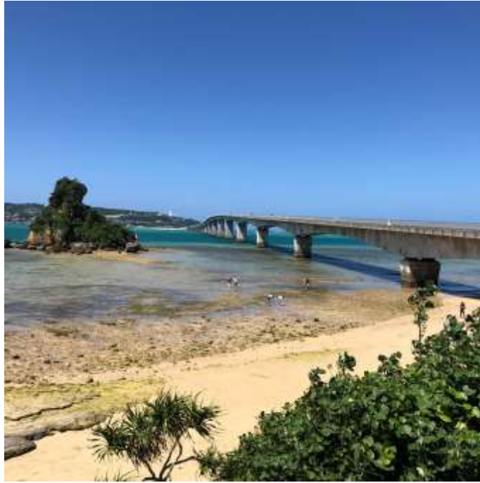
說明：沖繩知名景點「古宇利島」(2019/05/21)