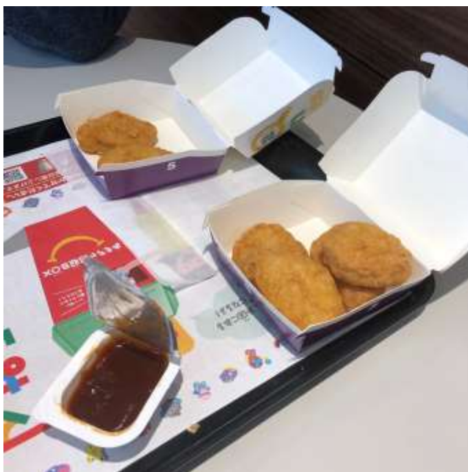
說明：剛搬到名護，跑去嘗試日本的麥當勞(2019/03/31)