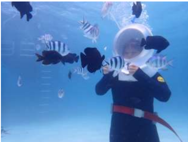
體驗公司的項目「海底漫步」 正在拿著魚飼料餵給魚群的我 2019/04/18

七月的時候因為有在一起休，所以兩個早早就出發往中部的「美國村」去了，剛好看到一家還不錯的涮涮鍋，所以就決定吃涮涮鍋當午餐了。