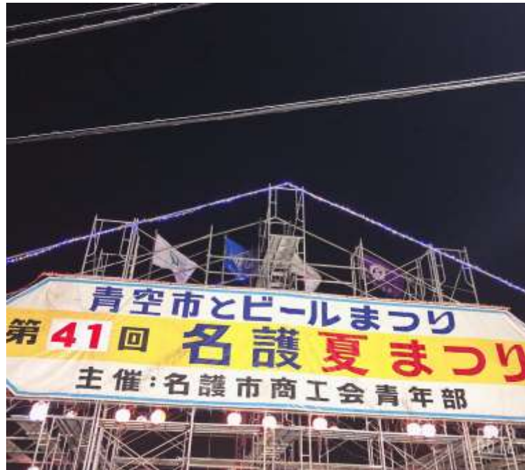
説明：名護夏日祭典-「煙火大會」(2019/07/27)