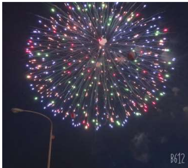
説明：名護夏日祭典-「煙火大會」(2019/07/27)