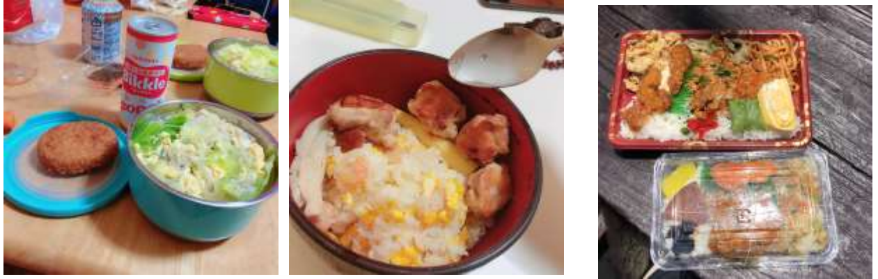
一些手做料理跟7月公司附的午餐(2019/03/26、2019/04/02、2019/07/01)

剛來的那個禮拜因為暫時借住在公司二樓的宿舍，樓下有廚房可以料理，也因為同是在我們住進去的第一天，就有先帶我們到附近的超市去買些東西了，所以就先暫時使用樓下的廚房；後來搬到新的宿舍後，因為本身就是想要自己料理，也覺得比較省，所以都自己料理三餐。不過到七月因為客人越來越多，所以公司有附午餐。每個月領薪水的時候也會到附近去吃東西，一個月算下來一個人的伙食費不到10000元