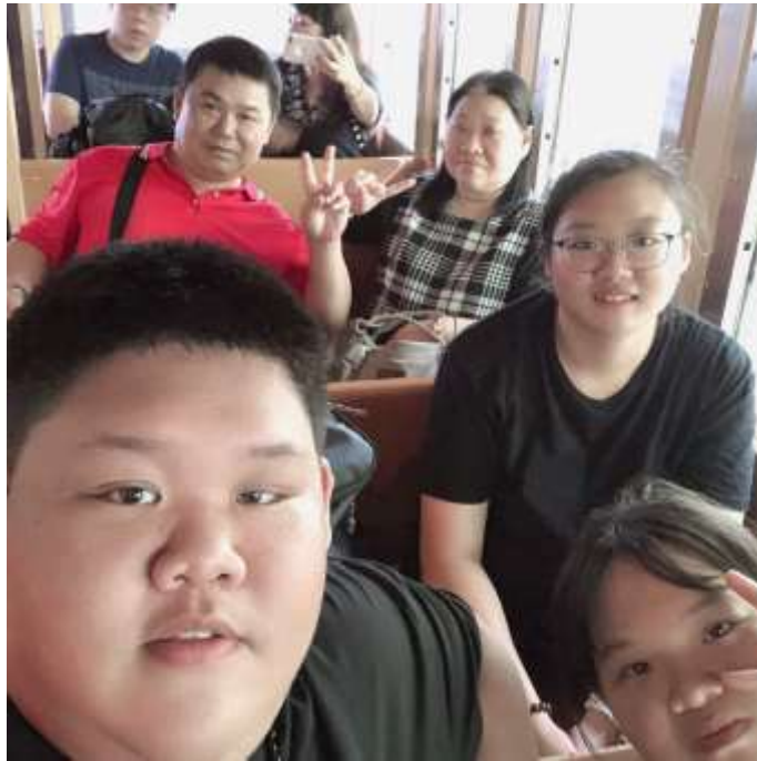
說明：家人過來沖繩一起去「動物園」（2019/05/20）