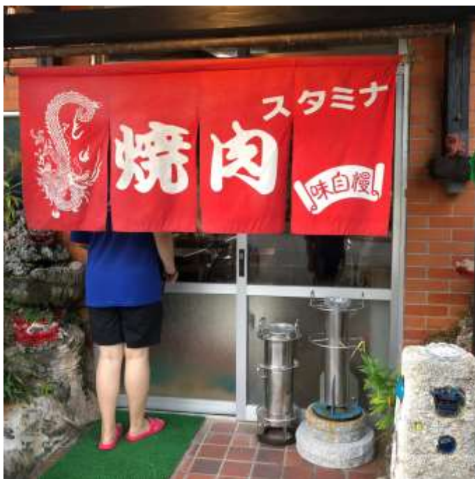
說明：下班後，去吃公司隔壁的燒肉(2019/03/30)