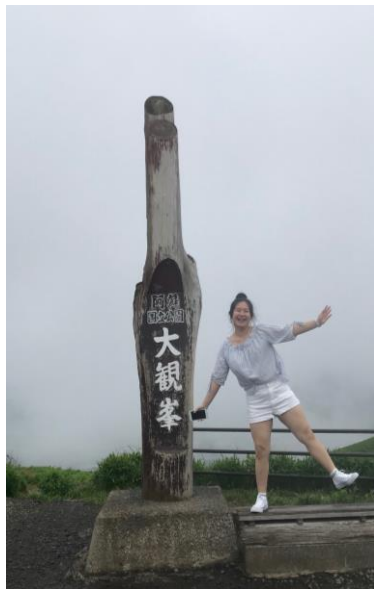
順路停下來的 大觀峯