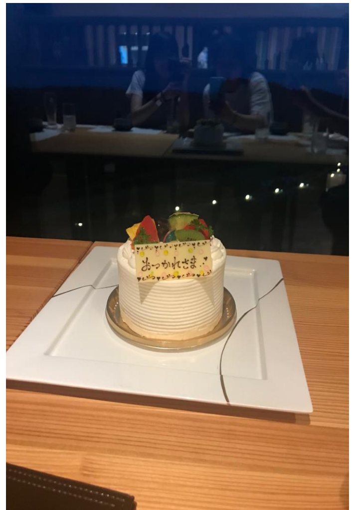
最後竟然還有サプライズケーキ (2019. 08. 18)