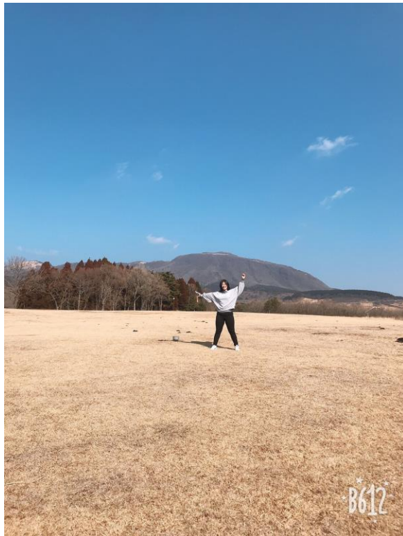
剛抵達飯店(2019. 02. 26)