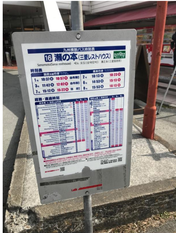
九州横断巴士時刻表