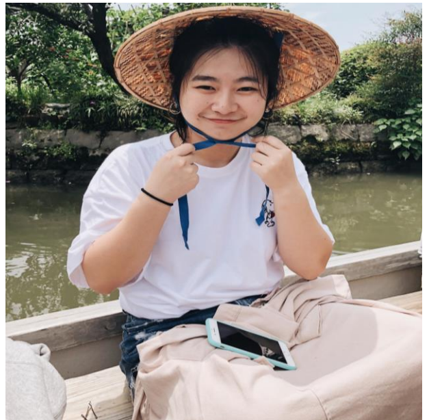
休館日, 盧家人來福岡玩 (2019. 07. 02~07. .05) 去了太宰府. 柳川