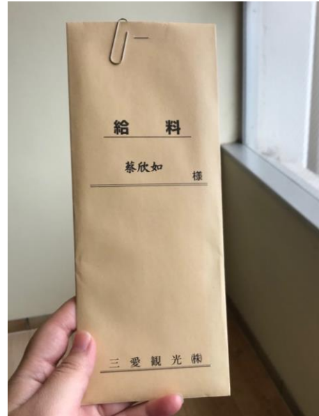
第一次領薪水(2019. 03. 25)