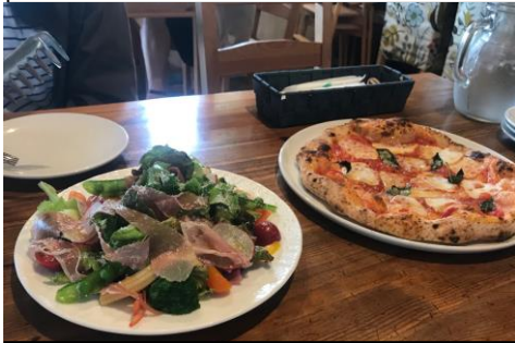
先去附近義大利餐廳吃飯