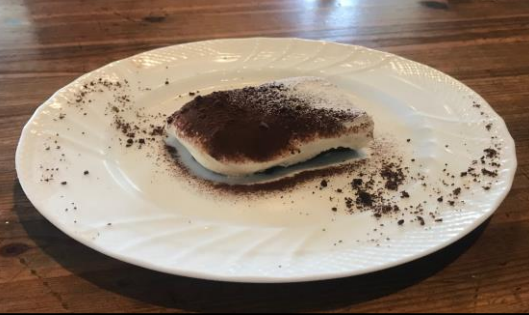
看起來不起眼卻超好吃的提拉米蘇