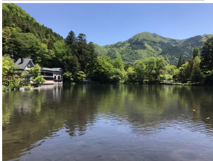
搭公車去由布院(2019. 05. 07)