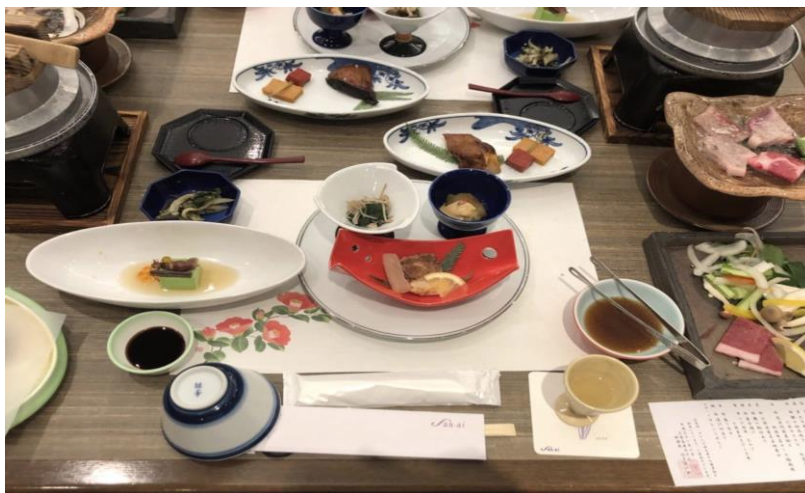
第一晚飯店請我們吃的料理 (2019. 02. 26)