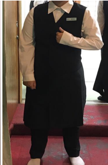
當服務生時穿的制服