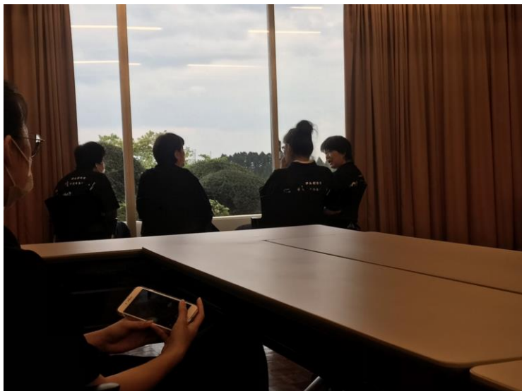
三愛的婆婆 F4 日常 (2019. 05. 05)