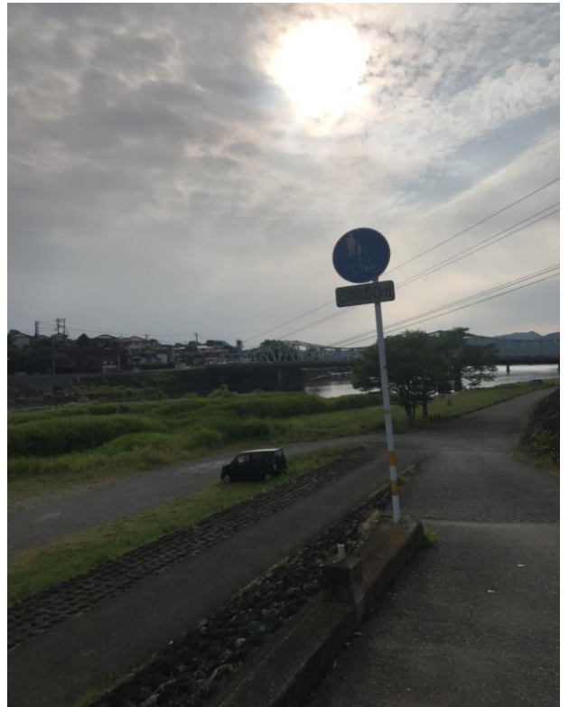
姐姐帶我們去豆田町. 筑後川. 久留米(2019.06.18)