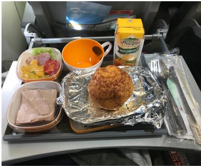
長榮飛機餐(2019. 02. 25)

至於有補助的人,建議是訂來回機票,才會方便核銷,然後一定要把機票收據那些收好,到時候才能寄回學校進行核銷,不然你的機票就沒補助了。