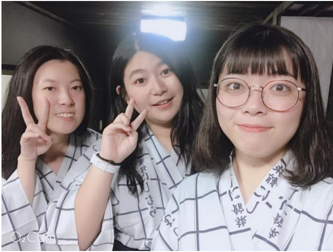
飯店讓我們住西村旅館 (2019. 03. 10)