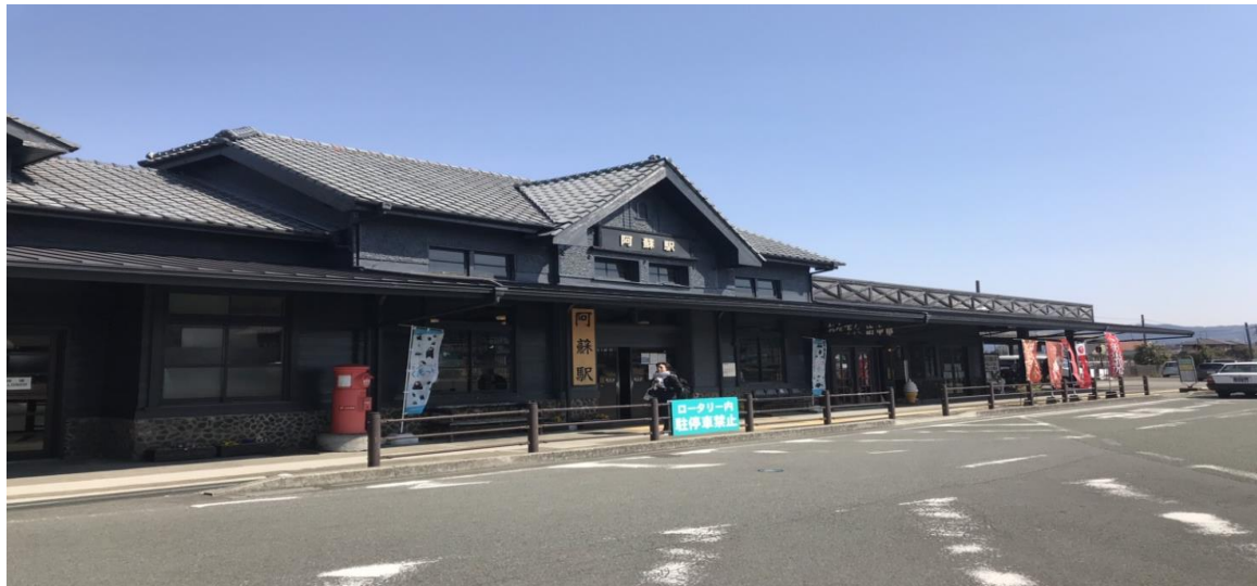
第一次搭公車出門去阿蘇車站(2019. 03. 15)

剛開始都搭公車,去了周遭景點,後來認識了那位姐姐,我們就去了更多地方,不再拘限於公車路線。