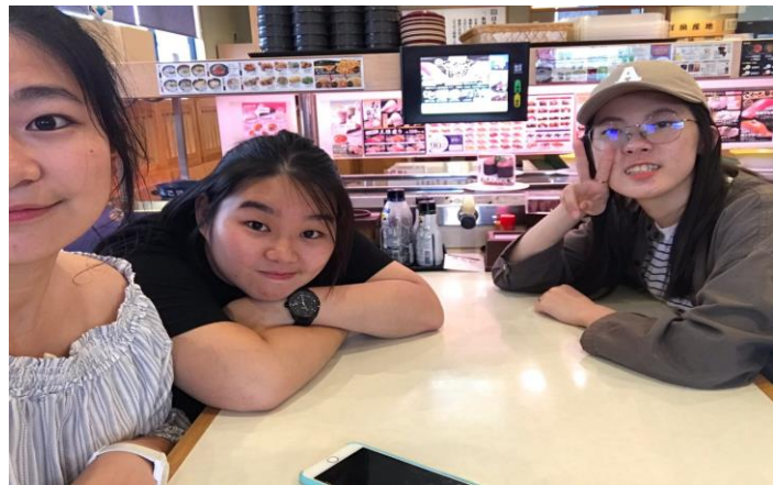
回去前吃個はま寿司