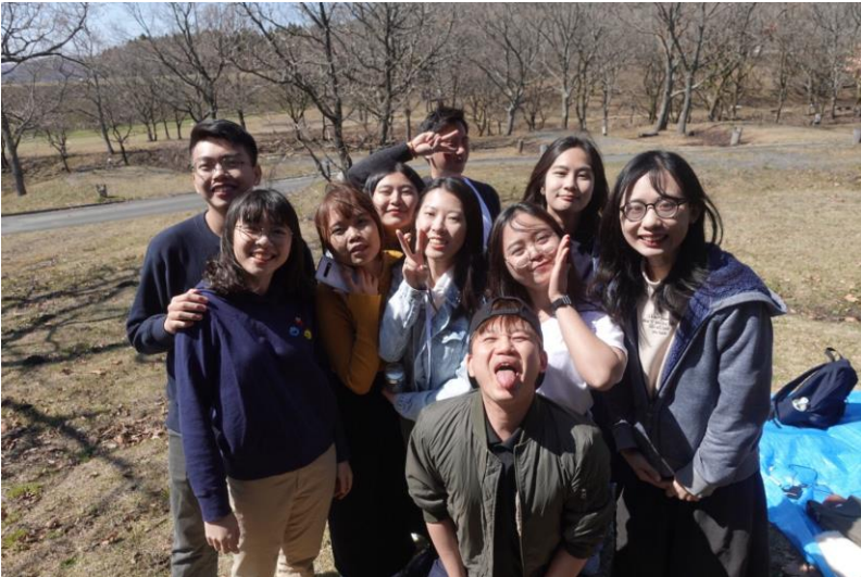
跟公司的同事們一起烤肉 (2019. 04. 15)