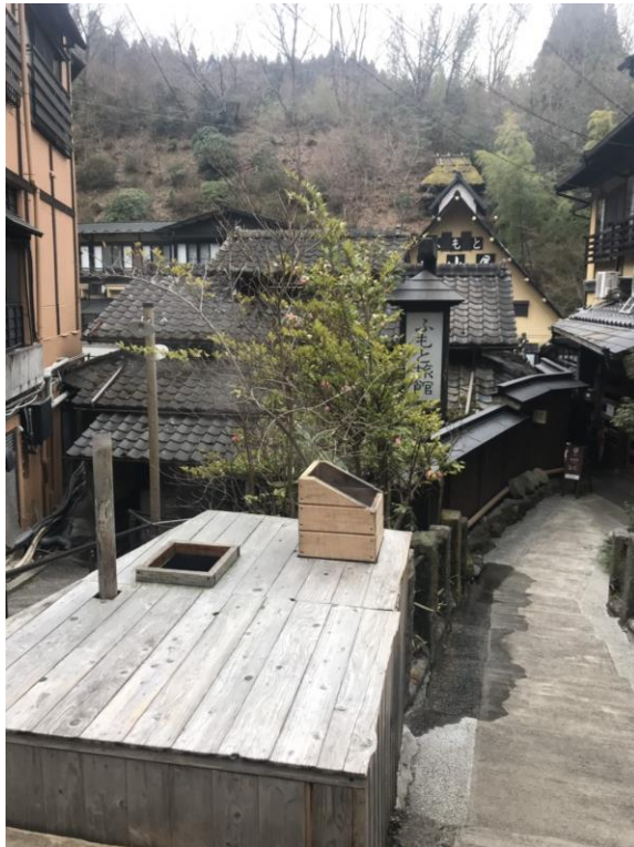
結束研習半天去黑川晃晃 (2019. 02. 27)