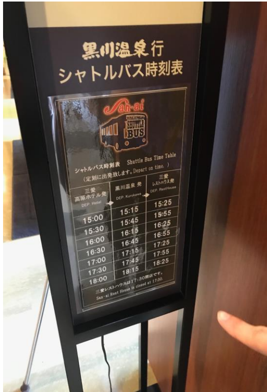
公司免費接駁時刻表

因為我們沒有車，所以唯一的交通工具是公車，日本的公車真的很貴，所以只有搭幾次，除了去比較遠的福岡以外，就沒有再搭公車了，我們也偶爾會搭公司的免費接駁到黑川溫泉晃晃或買東西，不過後來有一個來打工度假的台灣姊姊，她在日本買了車，多虧她我們才能去好多地方玩，每次放假她都會邀我們一起出去玩，因為有她我們才能去到很多地方玩，不然那裡太偏僻，公車很少，能去的地方也很少。