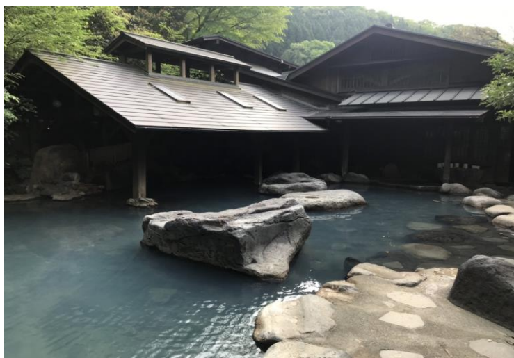
終於敢去泡溫泉了, 第一次去 黑川其它家溫泉(2019. 05. 06)