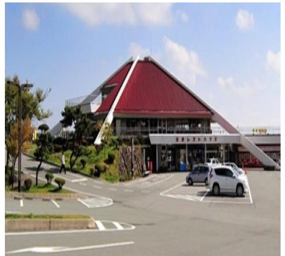
三愛レストハウス