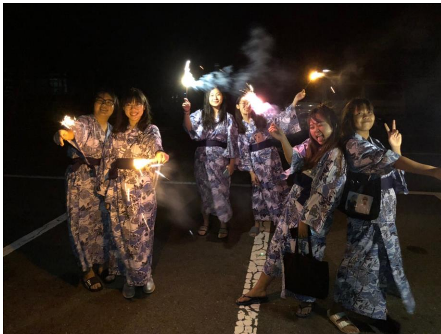
私下辦的小型送別會(2019. 08. 07)