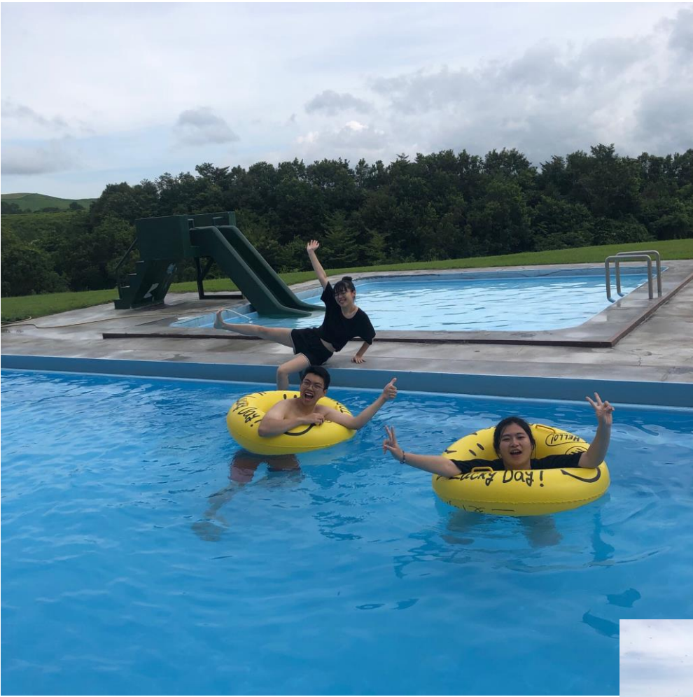
休假在飯店泳池玩耍 (2019. 08. 09)