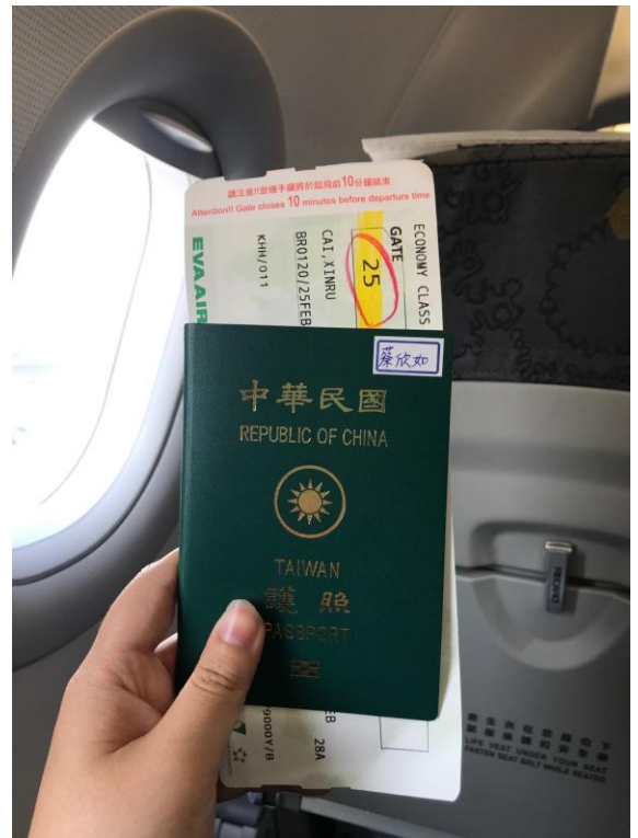
起飛前(2019. 02. 25)