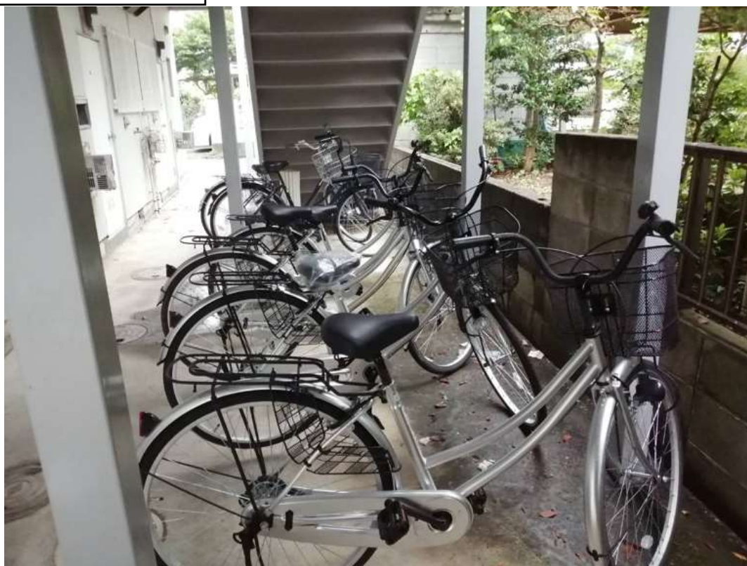
上下班的交通工具

接下來搬家後也都是騎腳踏車上下班, 只是差在距離公司的路和好不好騎而已, 從 BBQ 騎到公司路途中上下坡難騎所以會騎的比較久, 但是從モーニング騎到公司雖然有一個上坡, 但沒有 BBQ 難騎所以去到公司比較快。