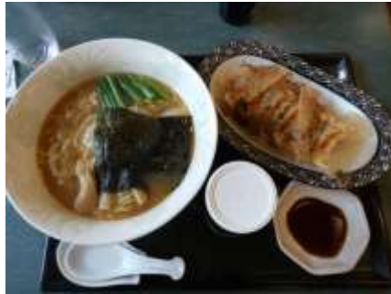
這是某天在餐廳吃的午餐

我們吃的部分公司是沒有提供的,所以三餐都是自理。早餐基本都是吃吐司或麵包配上麥片。午餐則是去食堂吃飯或是去溫泉那邊的餐廳裡面吃,然後剛開始食堂裡面有飯可以點來吃,但是現在改成需要預約沒辦法直接點來吃。在這裡基本上都是帶微波食品或是泡麵去吃有時候會去飯店裡的餐廳吃。