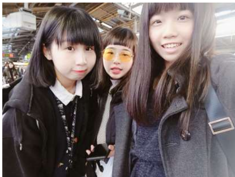
說明：第一次實習休假去原宿玩（2019/03/11）