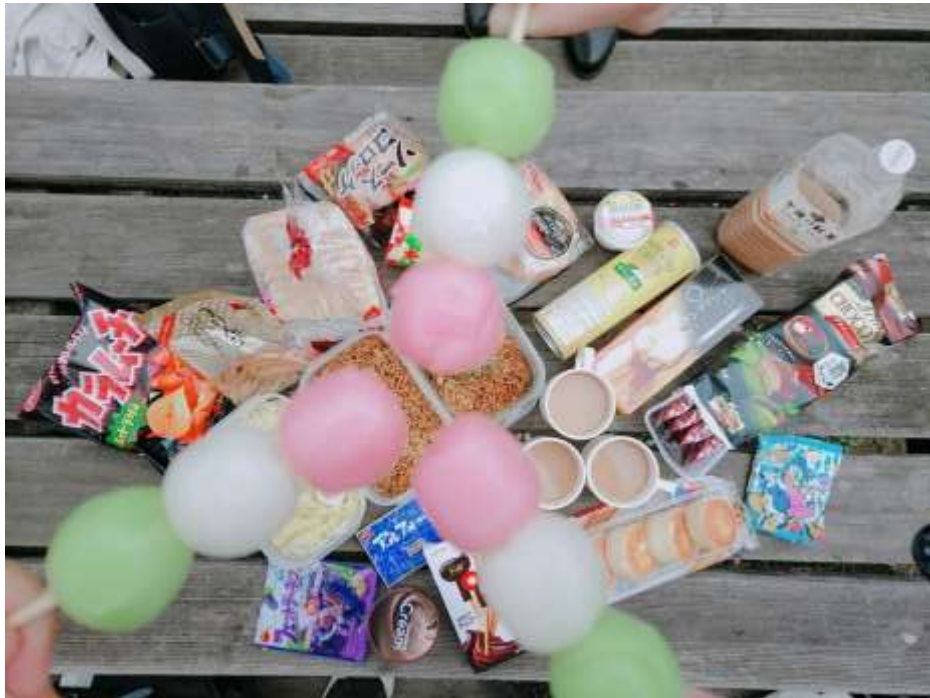
說明： 去武藏丘陵森林公園賞櫻花（2019/04/08）