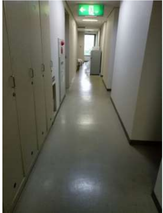
這個門打開後是我們住的地方