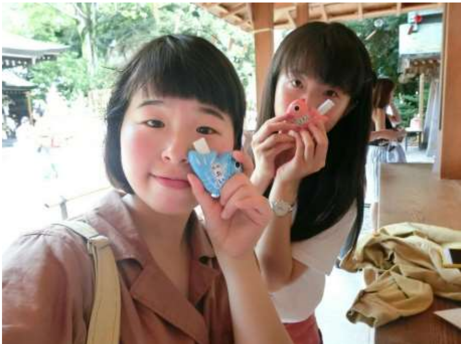
川越 冰川神社 (2019/08/06)