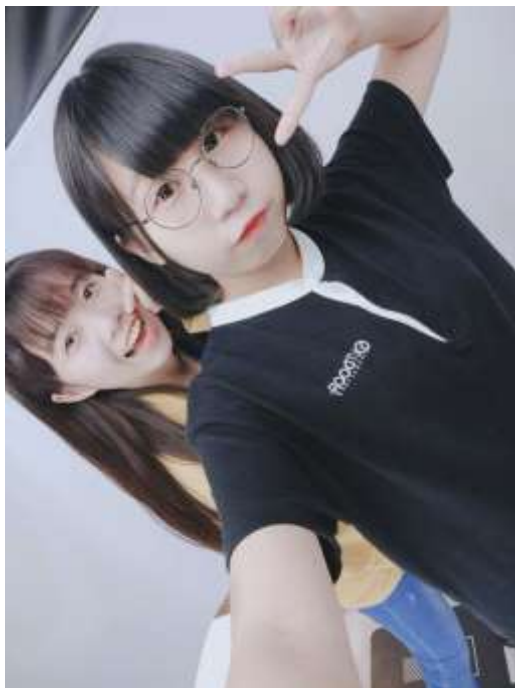
熊谷車站附近逛逛 (2019/06/20)