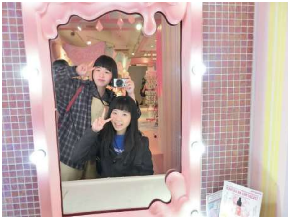
說明：連休第二天去了澀谷（2019/04/27）