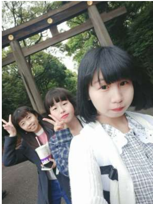
説明：連休第一天一起去明治神宮（2019/04/26）