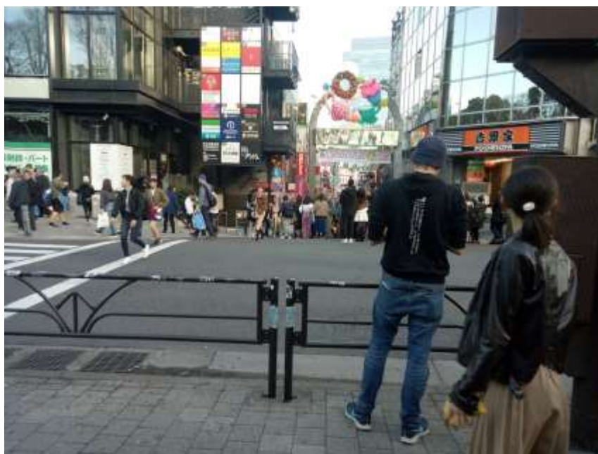
說明：在原宿拍的街景