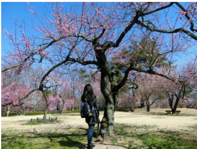
說明：去武藏丘陵森林公園看花（2019/03/14）