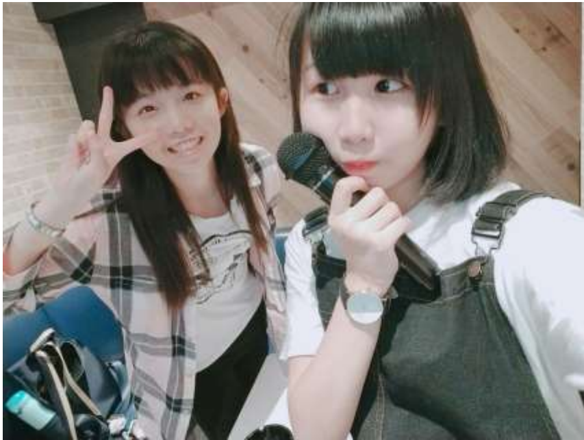
説明： 去新宿唱カラオケ (2019/05/30)