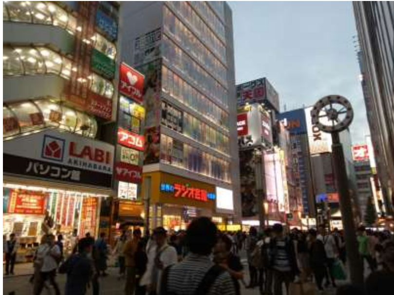
說明：晚上的秋葉原（2019/06/01）