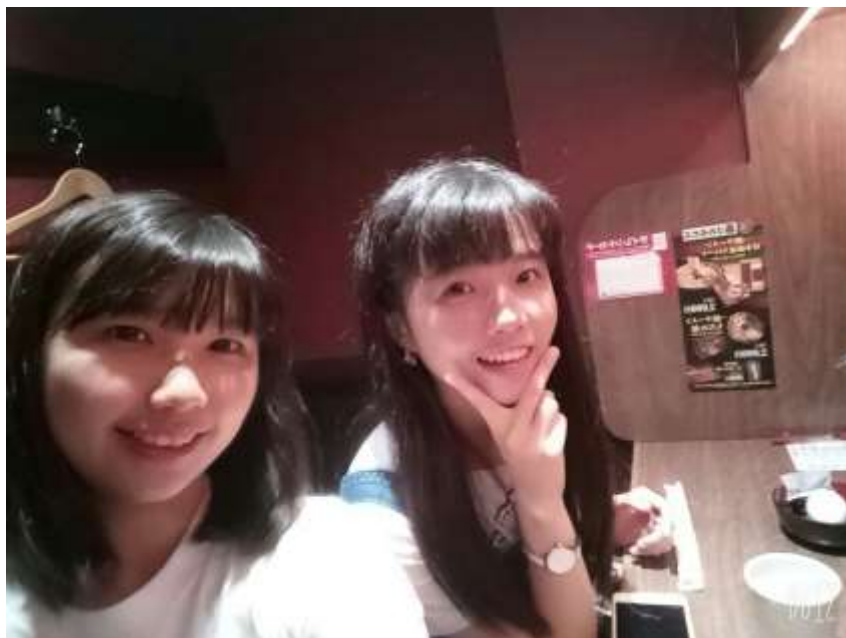
在上野吃一蘭拉麵 (2019/07/18)