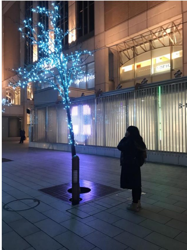
說明：試著和燈泡樹拍了一張照。(107/3/14)