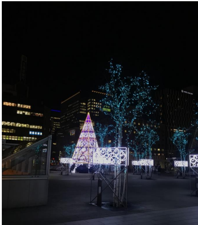
說明：冬天時札幌車站會有燈泡做的耶誕樹。(107/3/14)