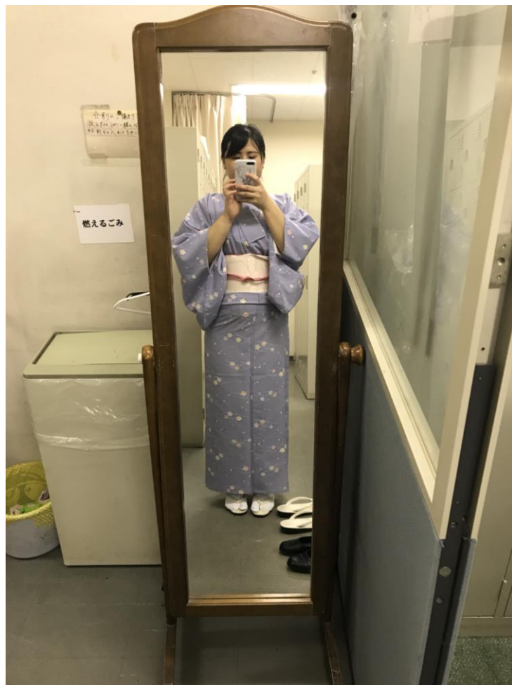
說明：總之穿上了和服看看。(107/3/13)