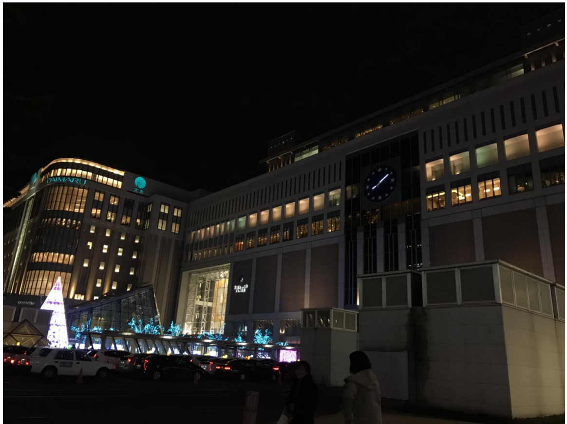
說明：夜晚的札幌車站。(107/3/14)