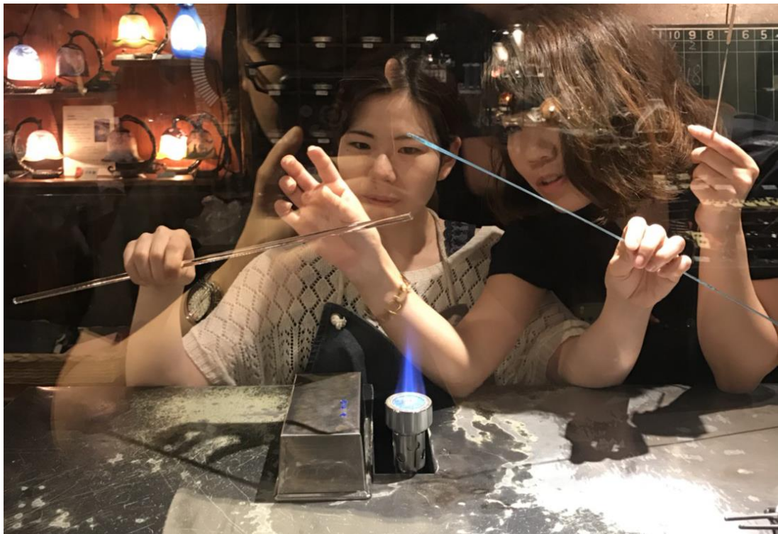
說明：和同事去小樽運河附近逛逛，一起做玻璃珠珠。(107/8/3)