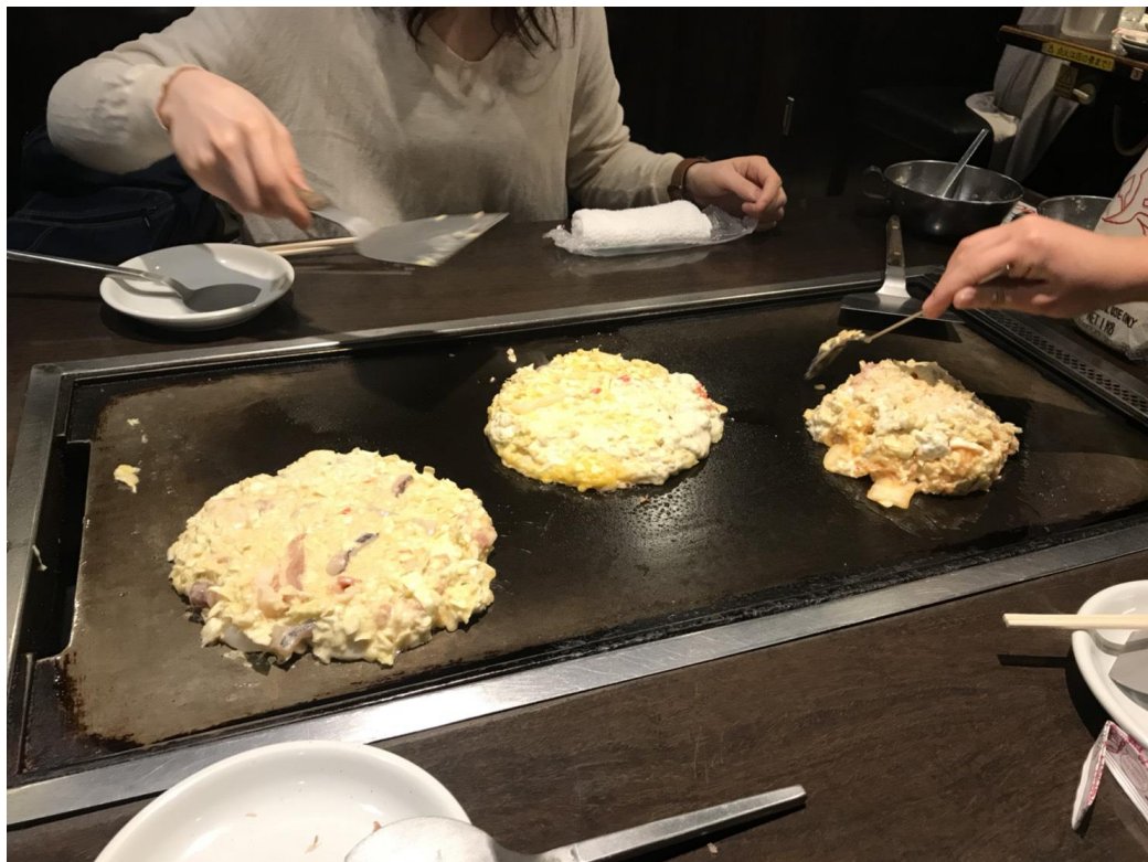
説明：一起做了このみやき。(107/4/7)