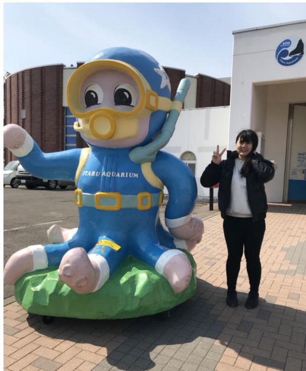
說明：去了小樽水族館。(107/3/31)