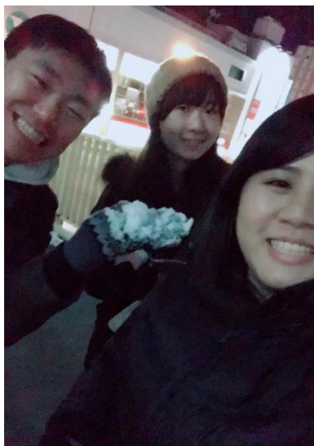
說明：第一次碰到雪。(107/2/28)