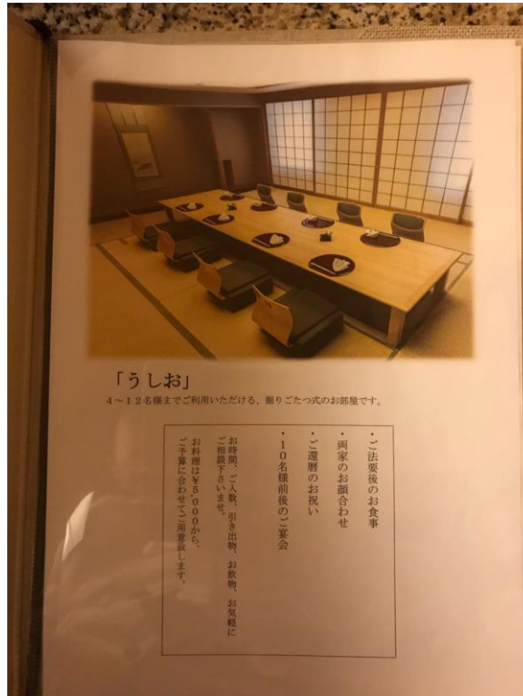
説明：日料的大和室うしお的簡介。(107/3/10)