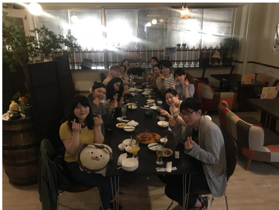
說明：大家幫我們辦了送別會。(107/8/24)