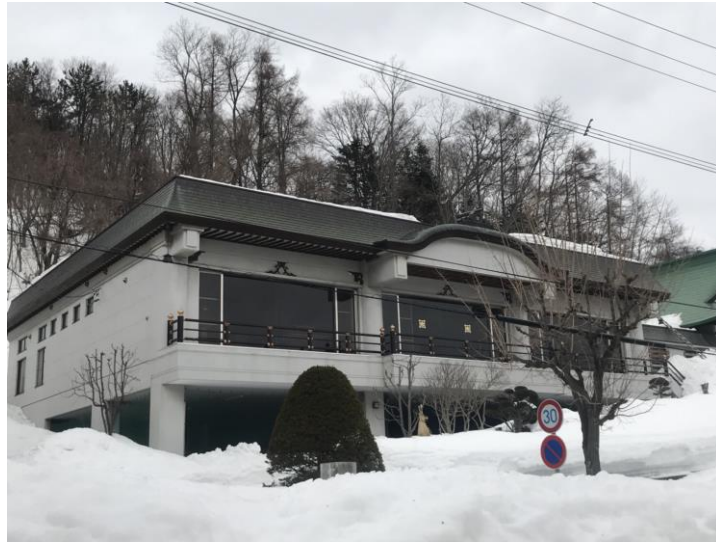
說明：被雪覆蓋的房子。(107/3/5)