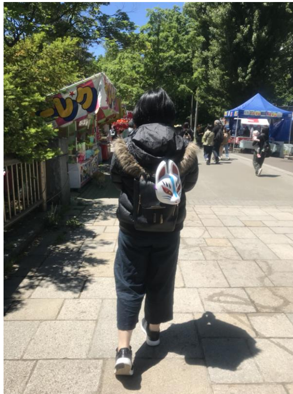
說明：在北海道祭典時去附近有攤位的地方逛了一下。(107/6/15)