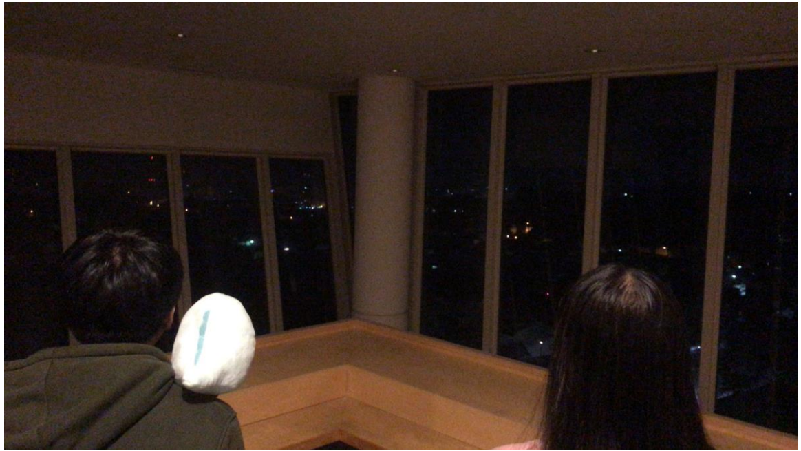
說明：三人一起眺望夜景。(107/3/13)