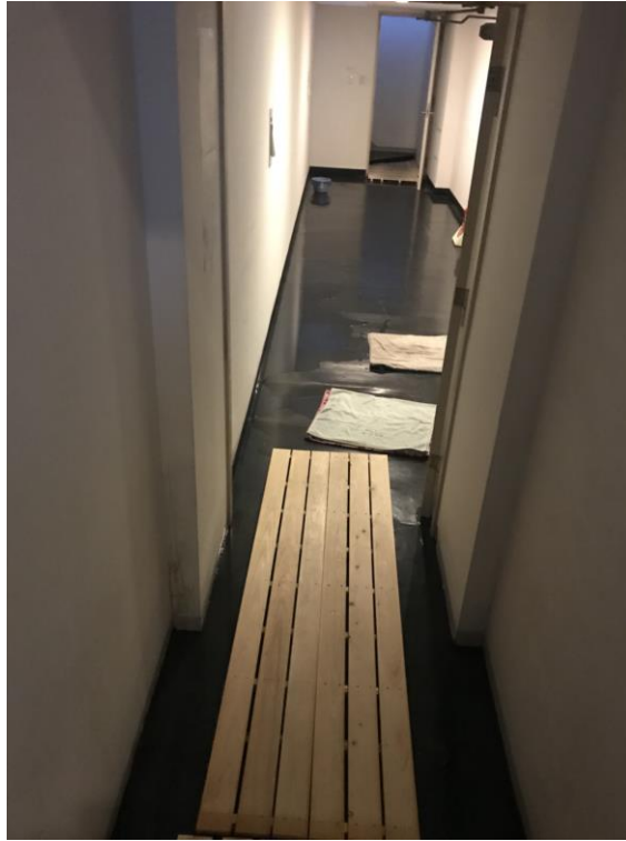
説明：下大雪或下大雨時總是會淹水的通道。(107/3/9)