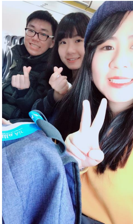
說明：前往日本的飛機上。(107/2/27)