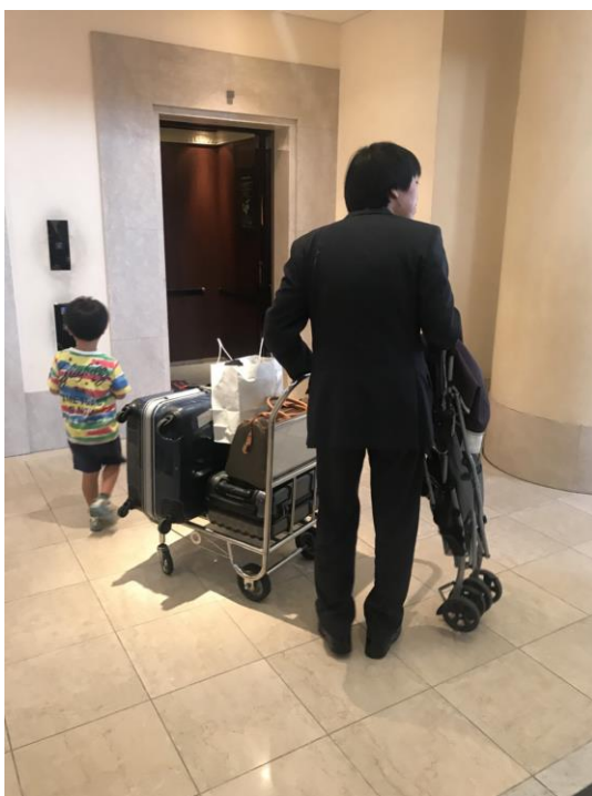
說明：俊欽工作的樣子。(107/8/20)