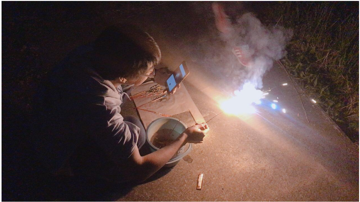
說明：玩了日本的仙女棒。(107/6/26)