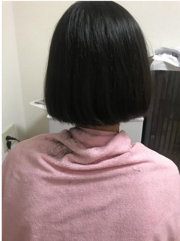
說明：幫莠嫚剪了短髮。(107/3/22)