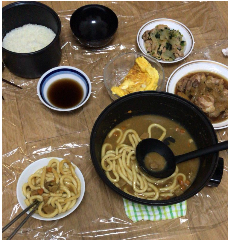
說明：三個人第一次一起吃晚餐。(107/3/7)