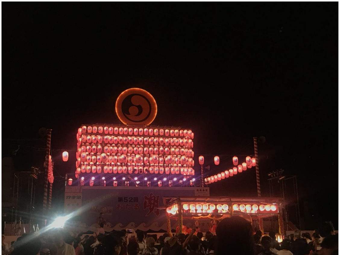
說明：小樽最大的祭典潮祭り。(107/7/28)