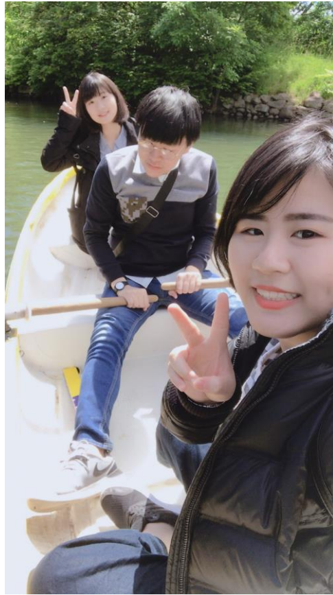
說明：人生第一次的划船。(107/6/15)