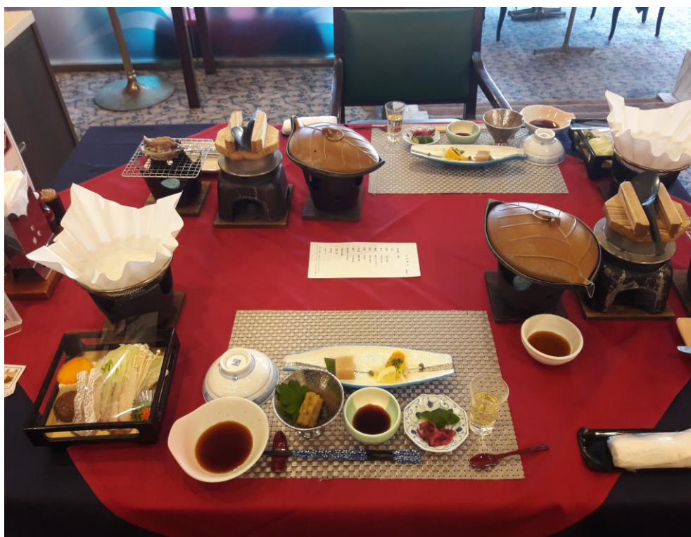
說明：豪華絢爛料理前置配置。(2018/9/23)