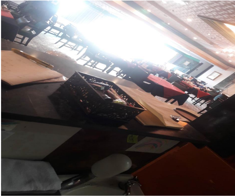
說明:我的筆記本與最後ダイニング。(2018/9/24)