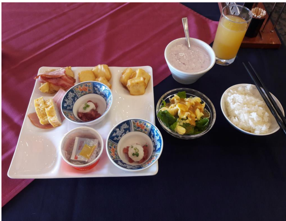
說明：在飯店的最後一次吃早餐。(2018/9/24)