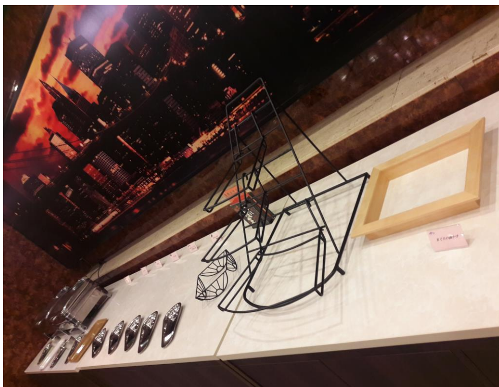
說明：拍給新人的隔日早餐的預先設置。(2018/9/22)