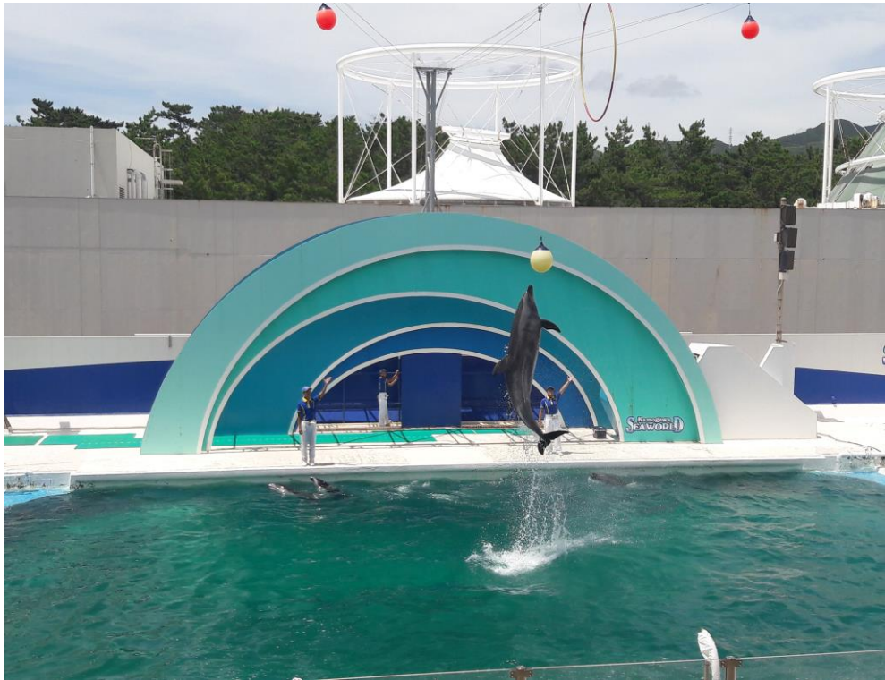
説明:鴨川水世界 海豚跳水。(2018/7/3)