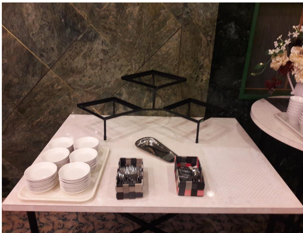
説明：拍給新人的隔日早餐的預先設置。(2018/9/22)