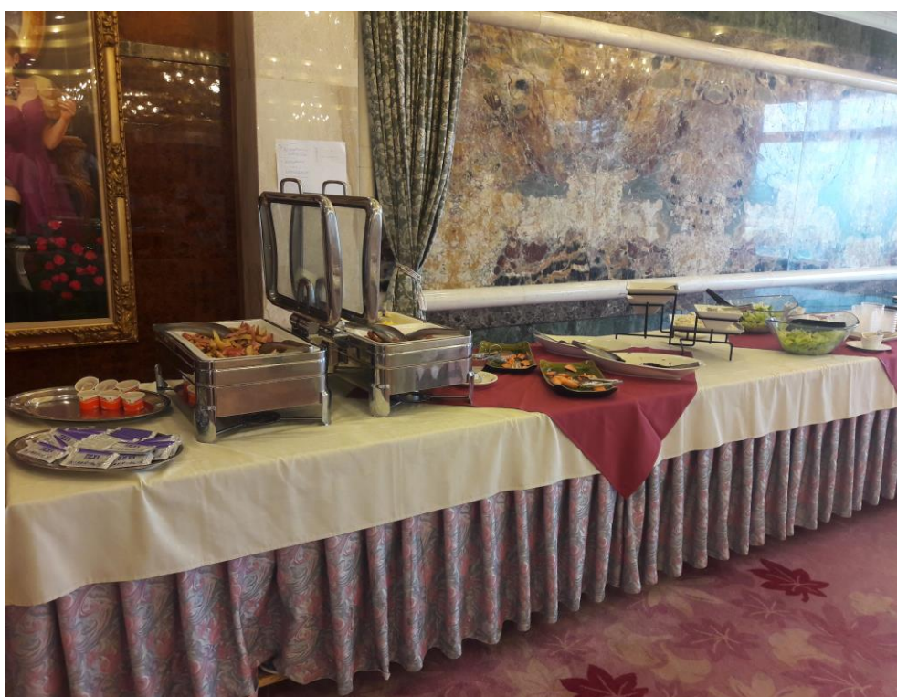
說明：學生包場早餐配置。(2018/9/21)