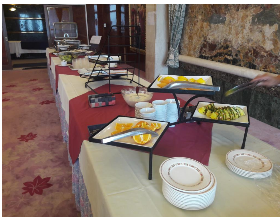
說明：學生包場早餐配置。(2018/9/21)