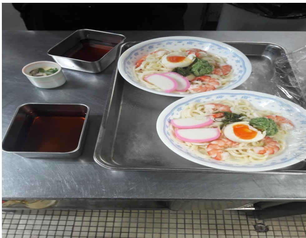
說明:拍給朋友看的中華冷面(晚餐)。(2018/6/6)