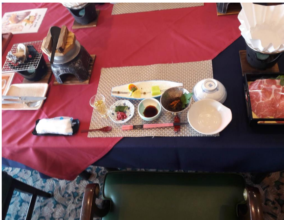
説明：蒼海料理前菜擺設。(2018/7/12)