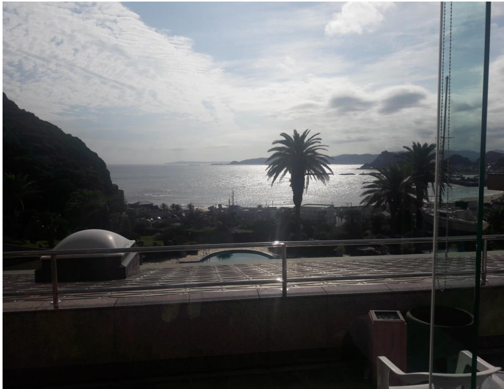
說明：小久違的太陽先生。(2018/9/23)