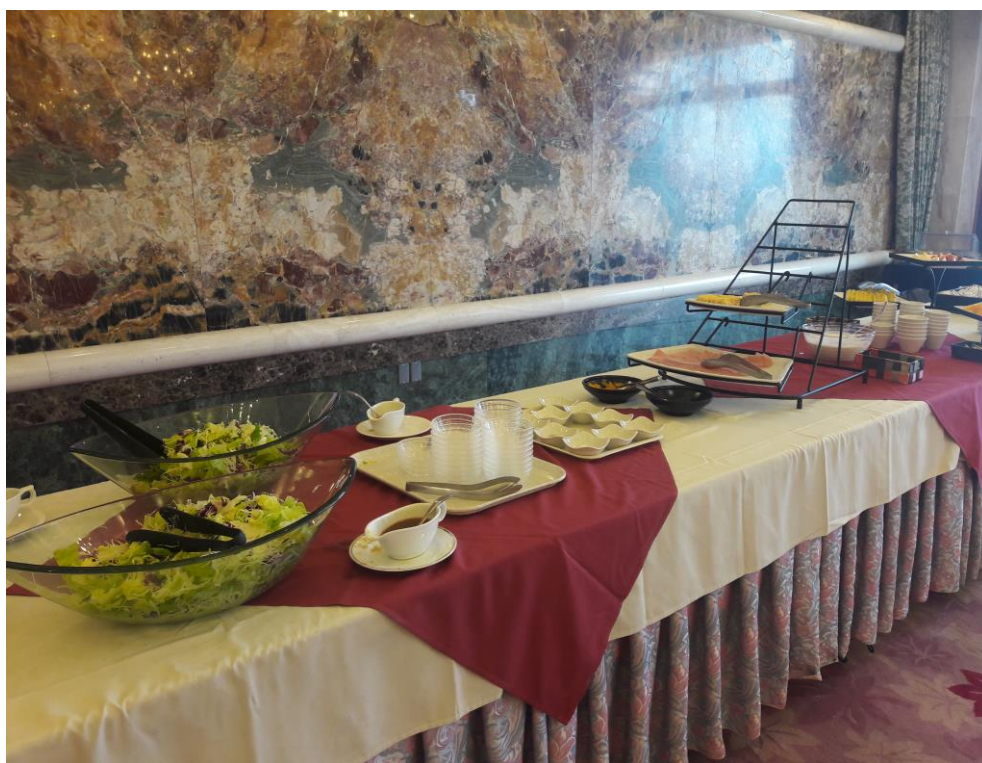
說明：學生包場早餐配置。(2018/9/21)