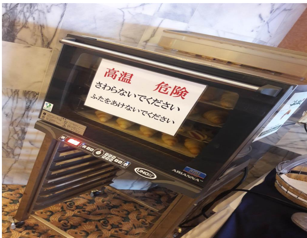
説明：最後一次烤麵包。(2018/9/24)