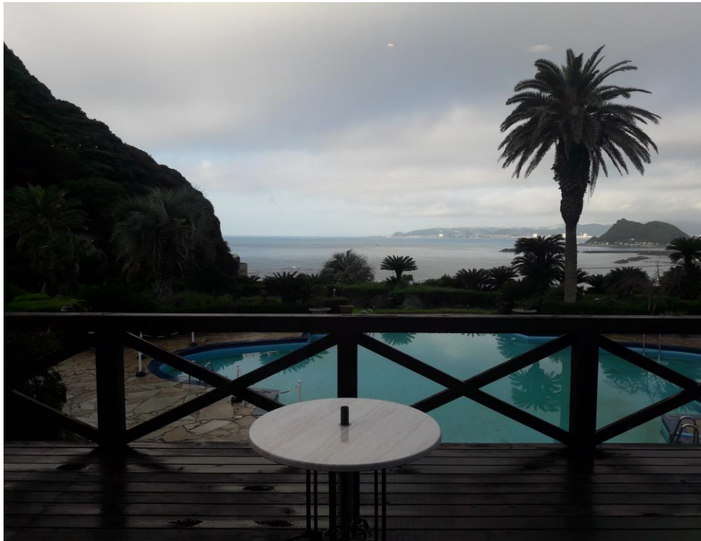
說明：準備時的窗外風景。(2018/9/24)