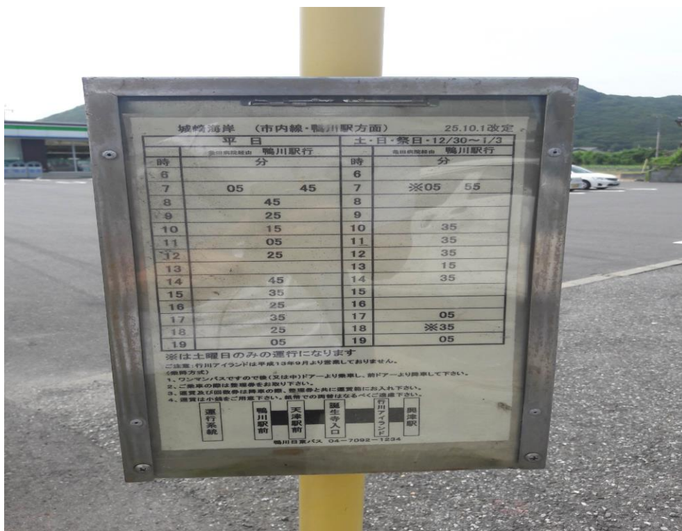
説明：鴨川公車站牌。(2018/7/11)