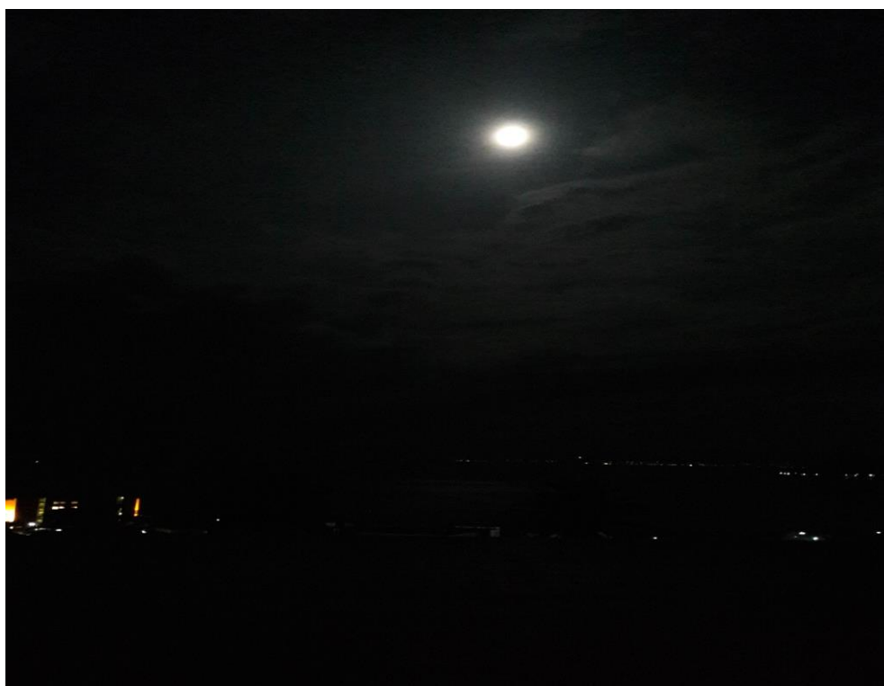
說明:要回去了還失眠,跟來的時候一樣。 然後最後一天的月亮一樣美。(20188/9/25)