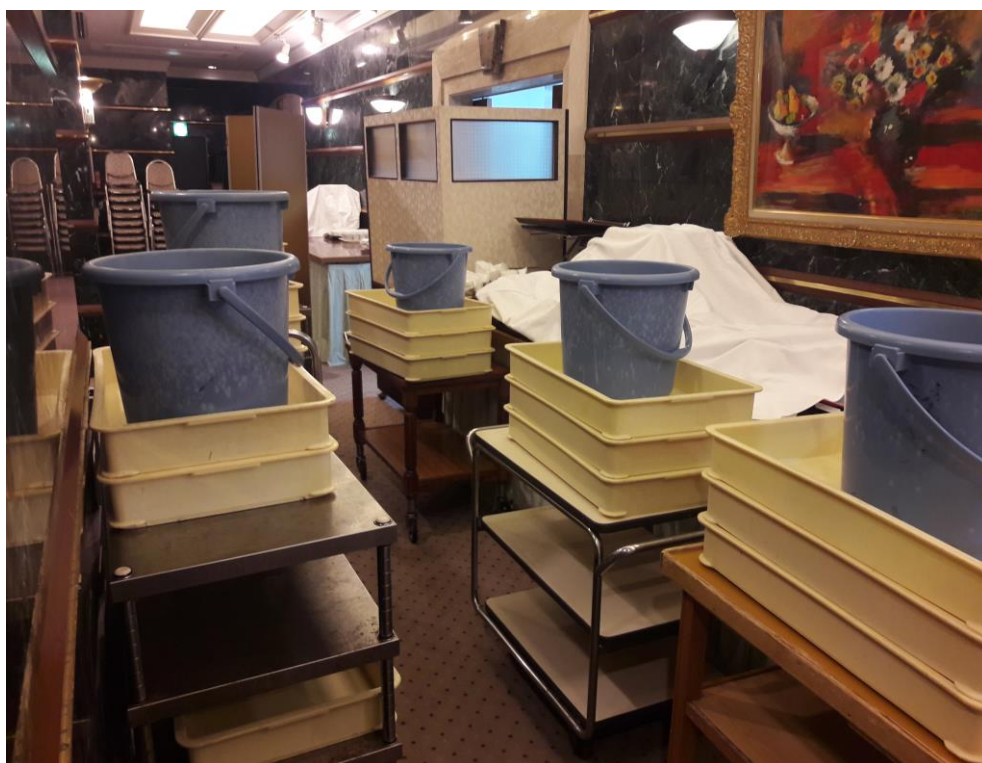
説明： 学生包場晚餐之整理大隊!。(2018/9/21)