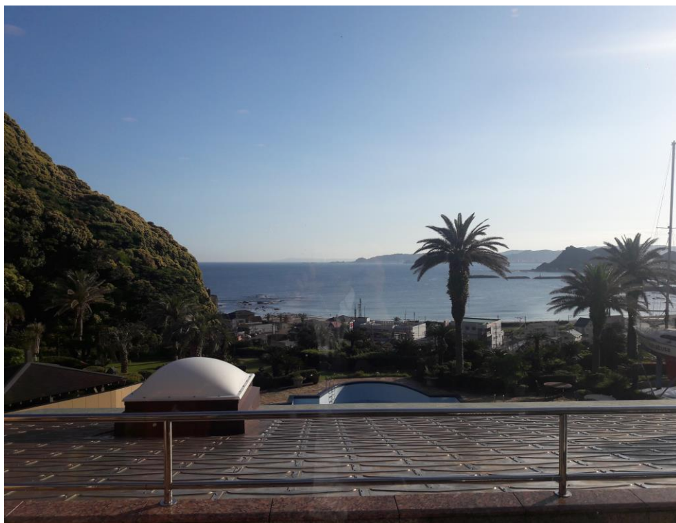
說明：飯店外的海景。(2018/6/4)