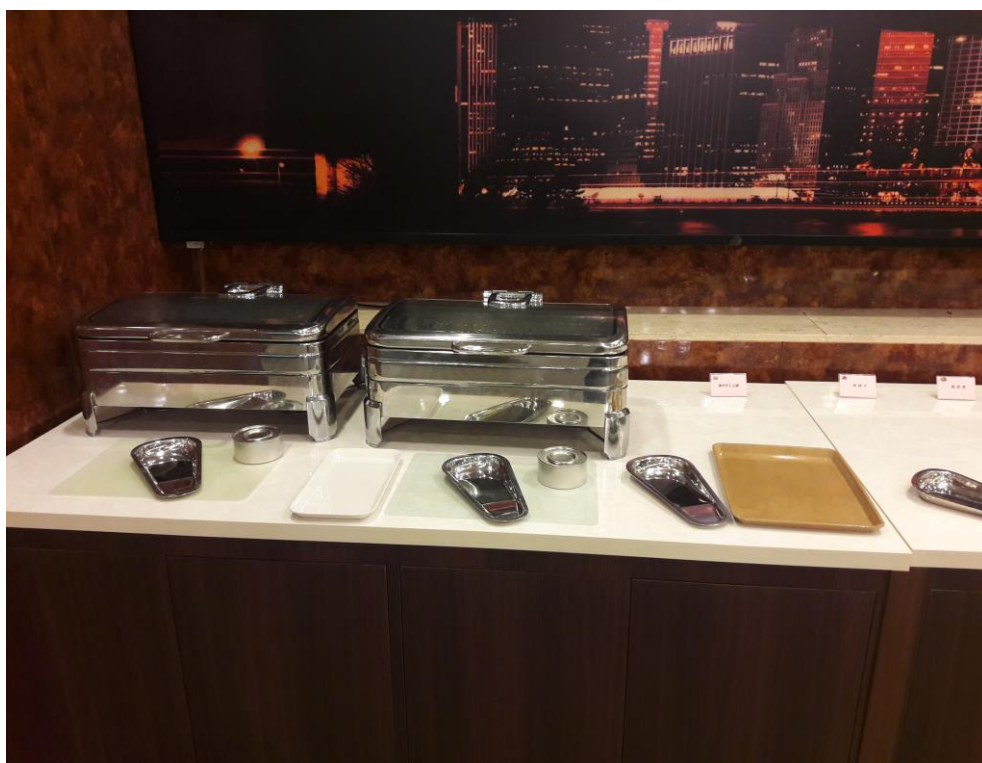
說明：拍給新人的隔日早餐的預先設置。(2018/9/22)