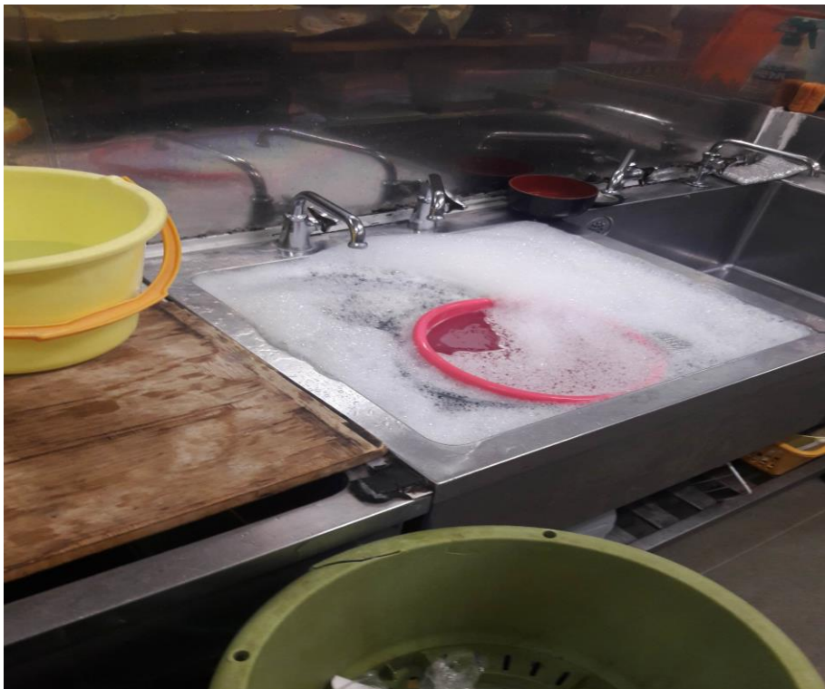
說明:前輩忘記關水。(2018/9/24)