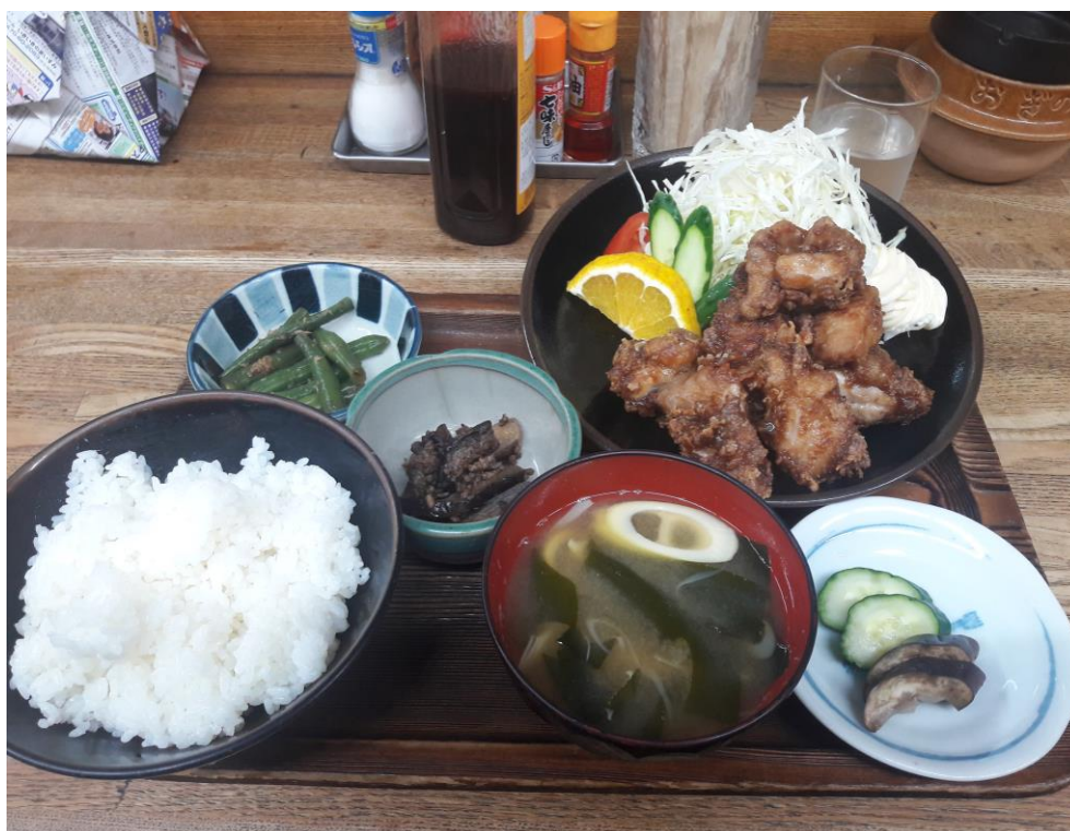
說明:達摩屋 唐揚定食。(2018/6/10)