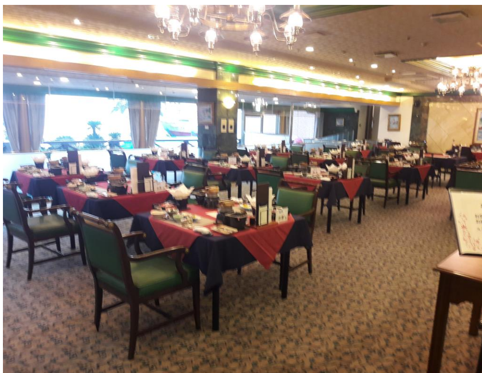
説明： 正常版ダイニング位置配置。(2018/9/22)