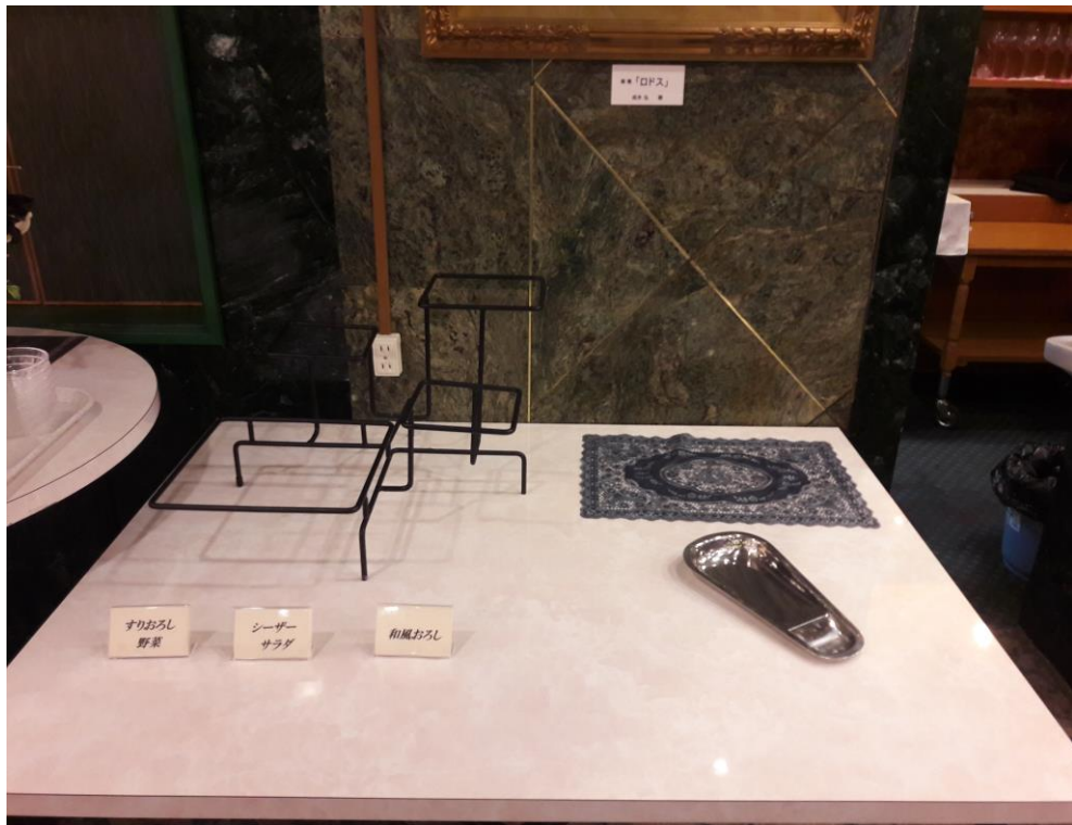
説明：拍給新人的隔日早餐的預先設置。(2018/9/22)