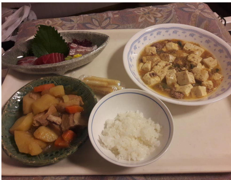
說明:不明所以的最後一餐之馬鈴薯燉肉。(2018/9/24)