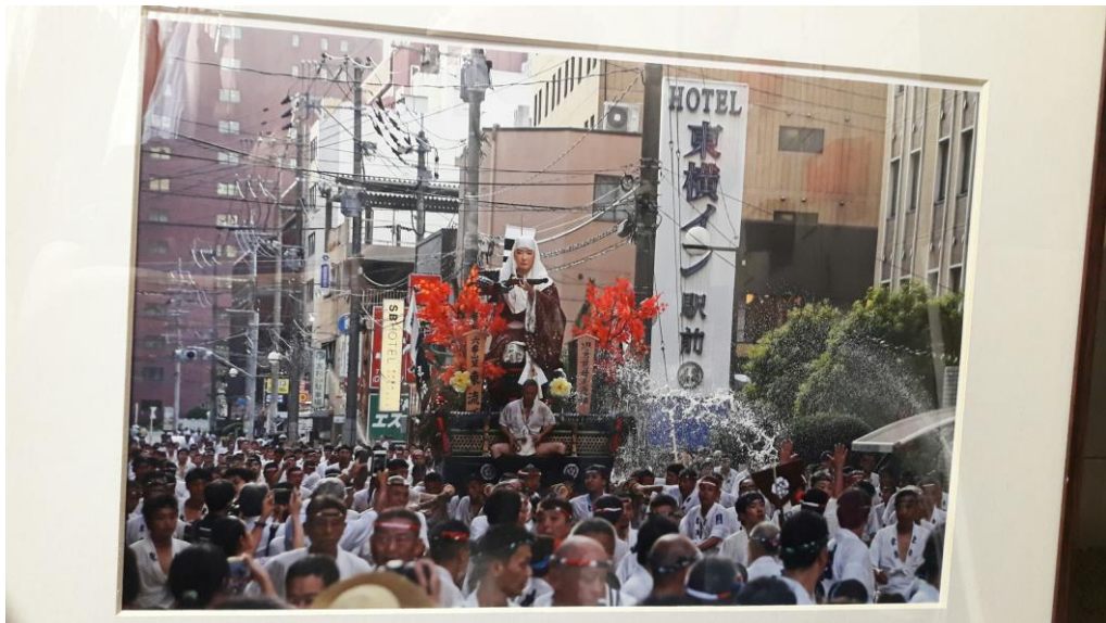
說明：在飯店前面經過的大人版祇園祭的遊行。(2018/07/13)