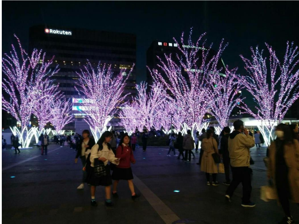
說明:下班回家途中經過博多車站時所看到的景色。(2018/03/17)