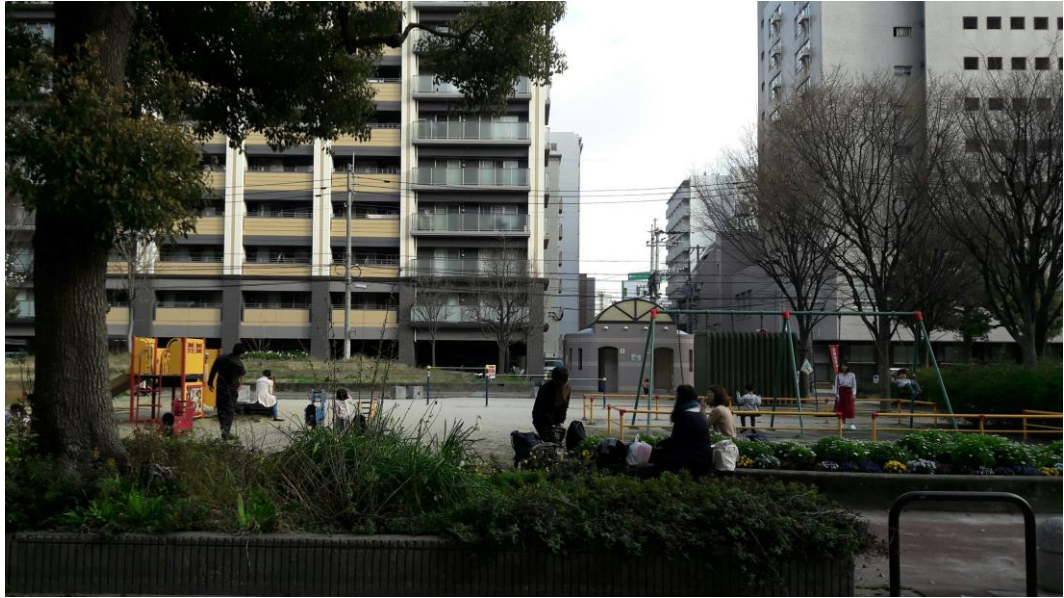
說明:與朋友一起回家的途中看到的日本的公園，意外的有點空。(2018/03/24)