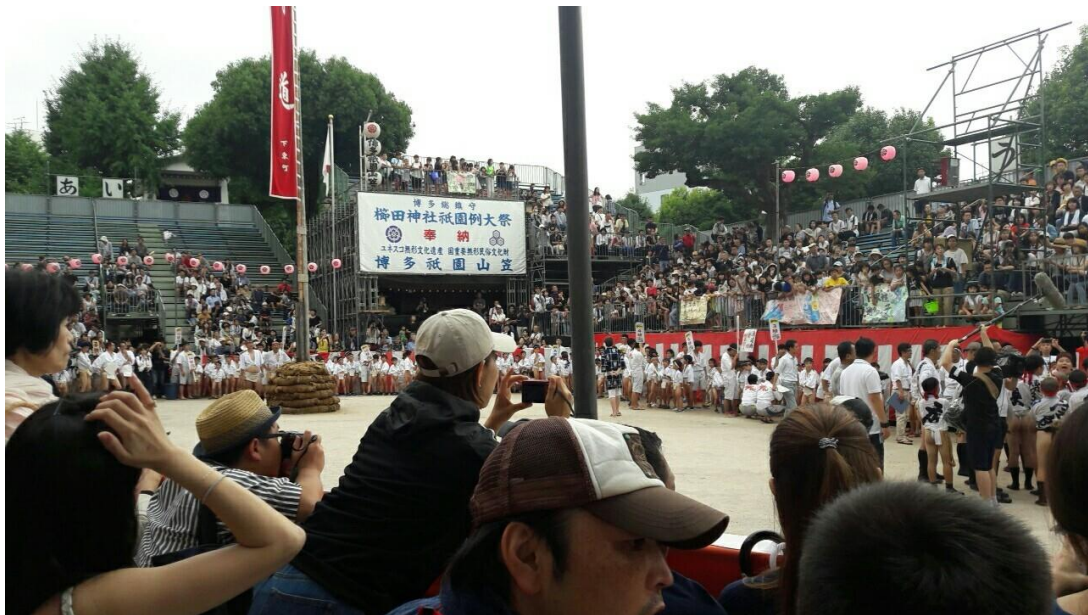
說明:與做房務的其中一位姊姊一起參加小孩子版的祇園祭。(2018/07/07)