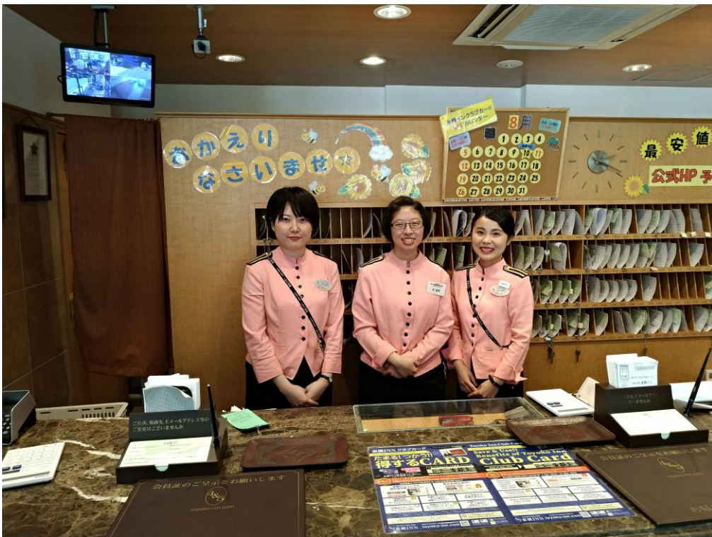
說明:與當天上班的前輩們的合照。(2018/08/10)