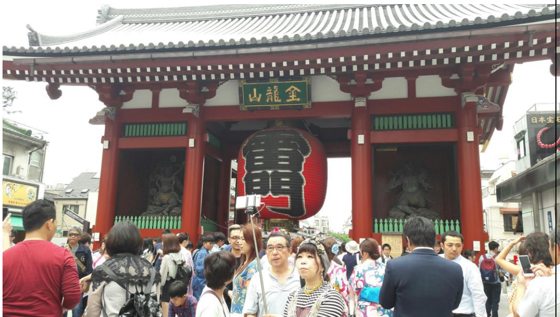
說明：與兩位前輩到淺草觀光。(2018/06/12)