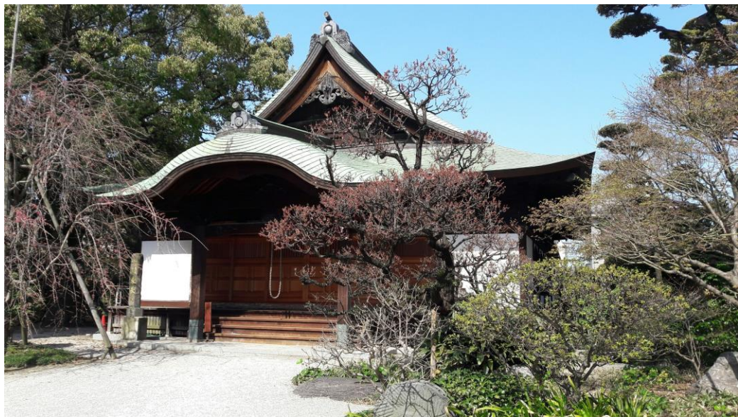
說明:支配人帶我認識附近的路時所經過的寺廟。(2018/03/23)