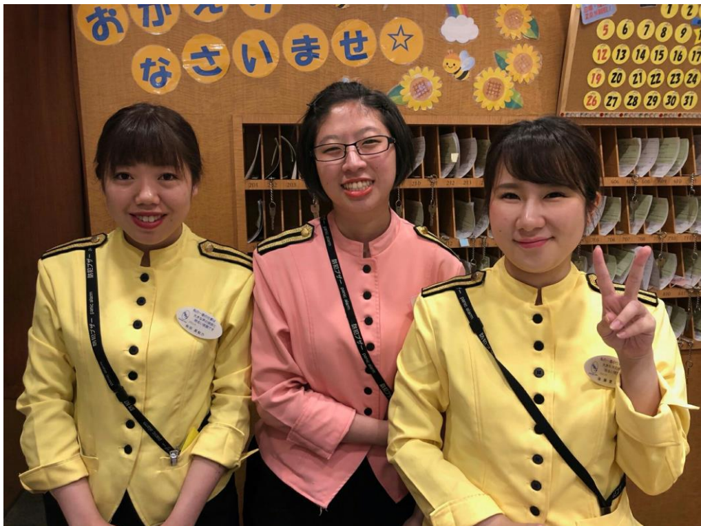
說明:上班的最後一天與前輩們的合照。(2018/08/23)