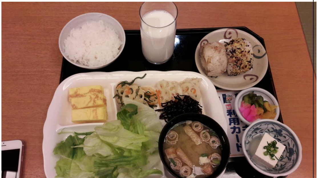
說明:在萬葉的湯裡所享用到的早餐。(2018/04/07)