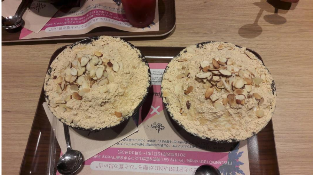
說明:最終報告會結束後和支配人和兩位實習的夥伴一起去吃冰。(2018/08/21)