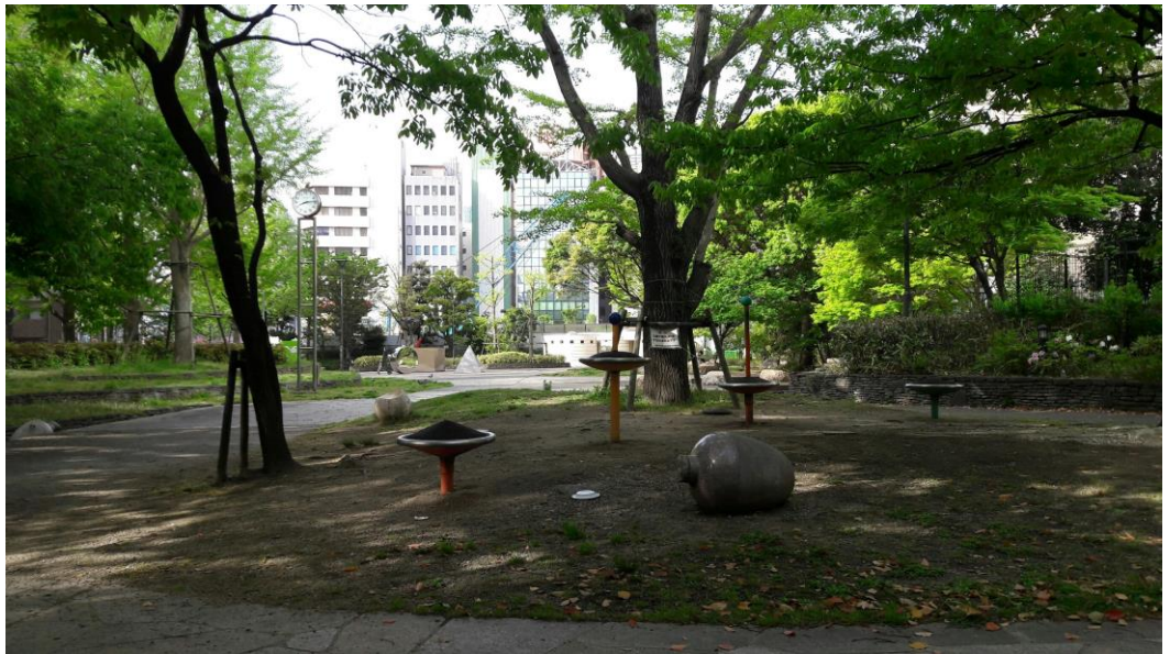
說明:去區役所辦理健保卡前時所經過的公園，意外的很漂亮。(2018/4/10)