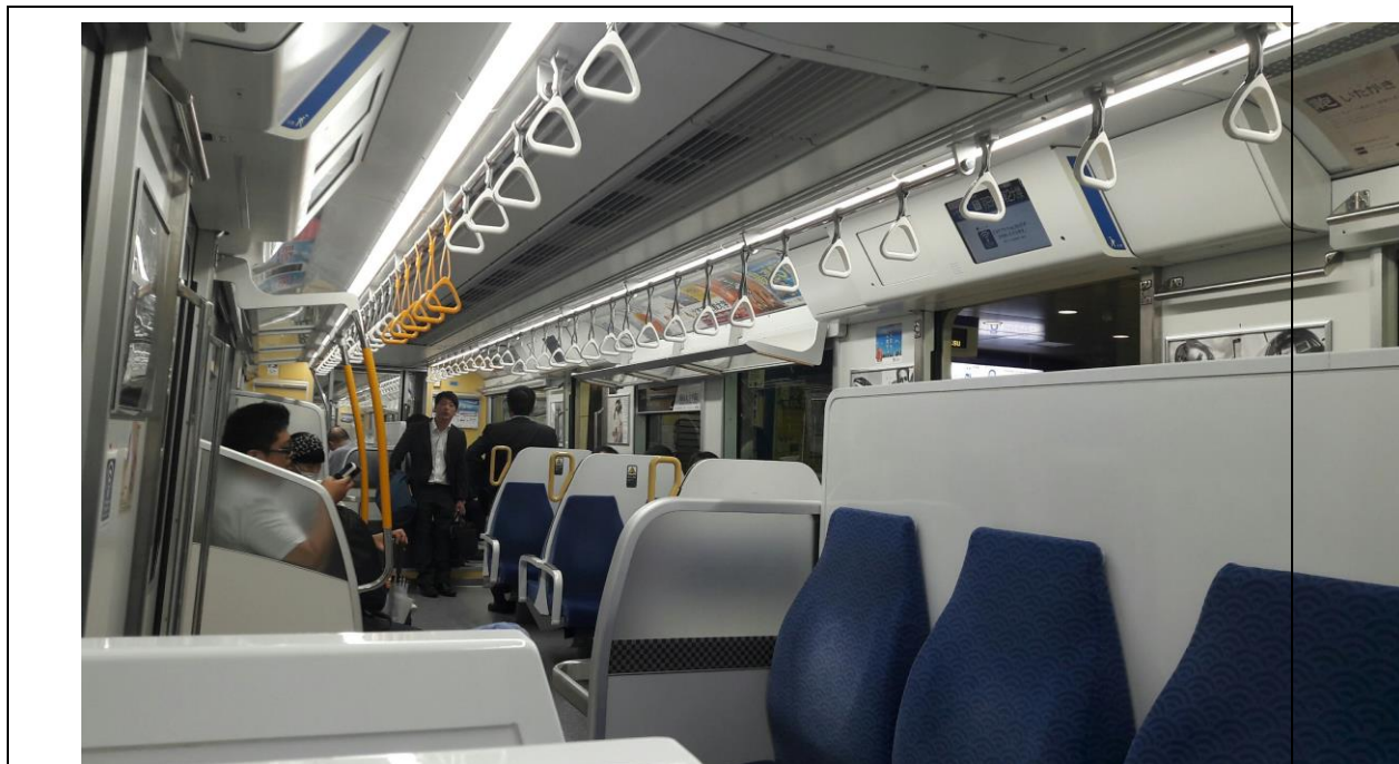
說明：和兩位前輩前往淺草時所搭乘的單軌列車。(2018/06/12)