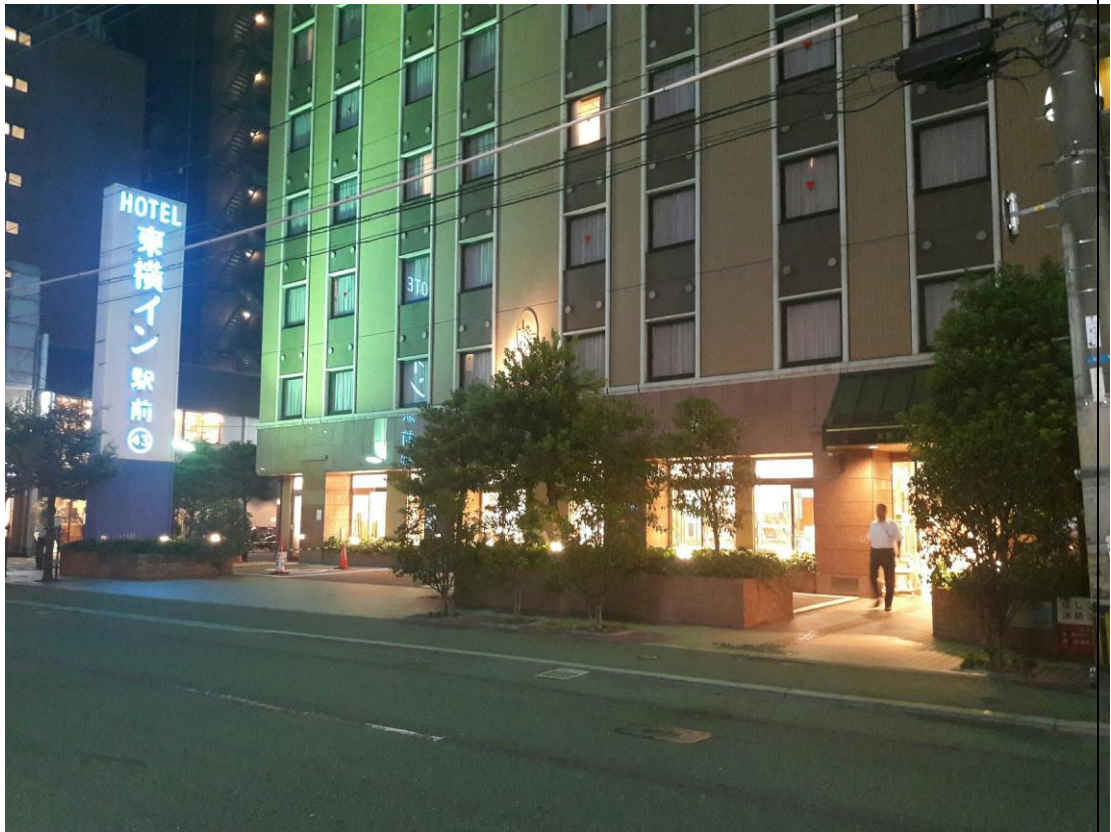
說明:夜晚的飯店(因為很美,所以就拍下來了)。(2018/08/20)