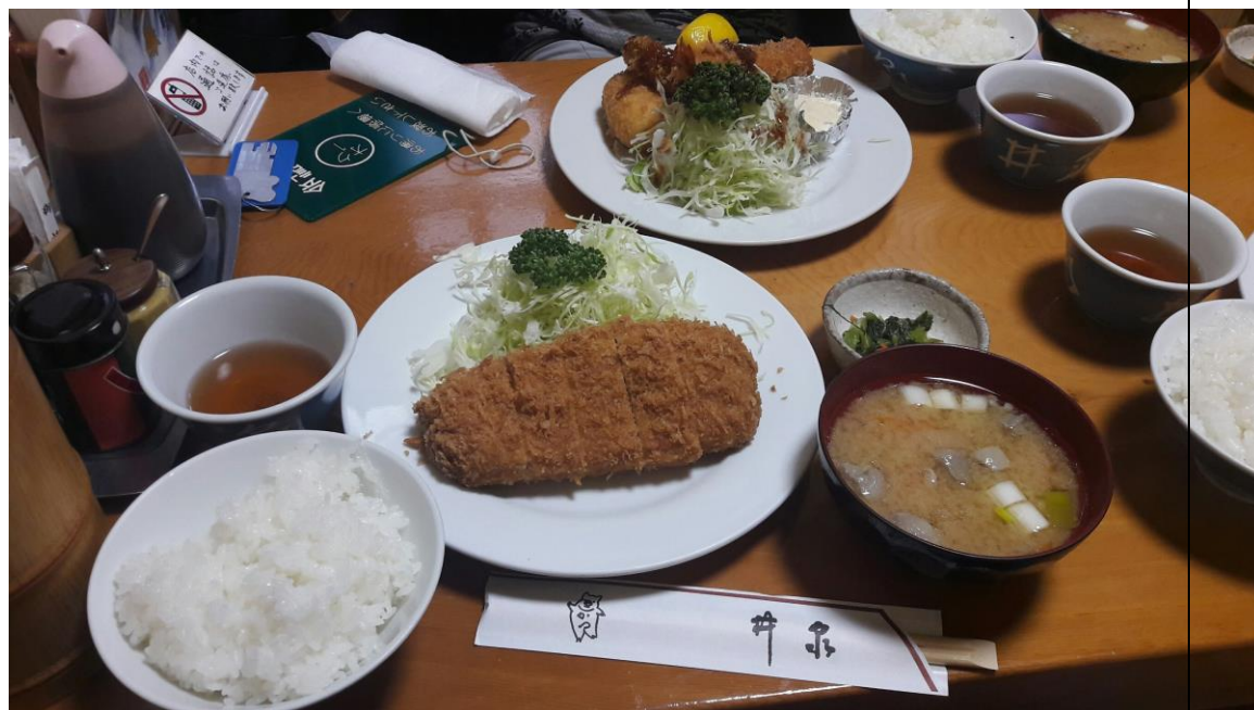
說明：與支配人和輔佐在東京的井泉本店所享用的午餐。(2018/06/10)