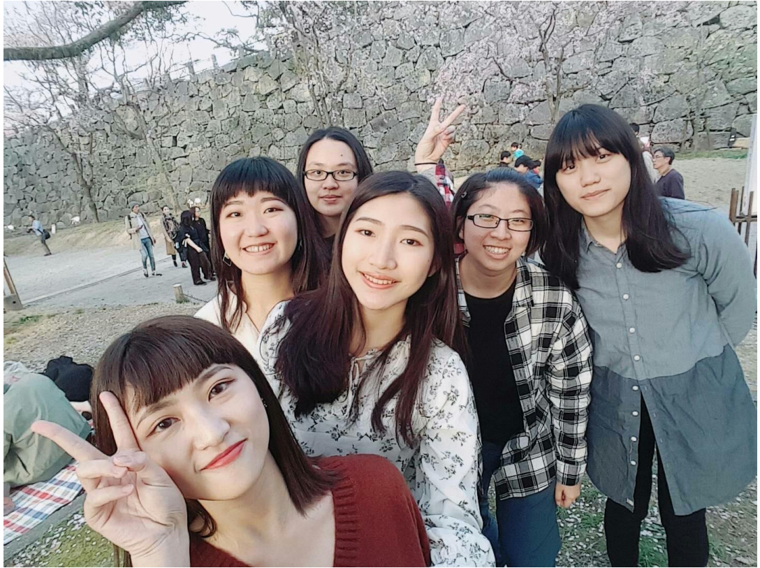
說明：與留學的三位同學和實習的夥伴一起去賞花。(2018/03/31)