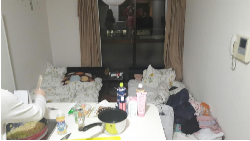
說明：在狹窄的家準備晚餐中。(2018/03/02)