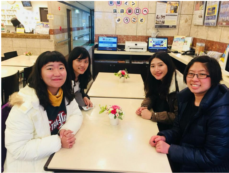
說明:剛到達東京報到的東橫實習生。(2018/2/27)