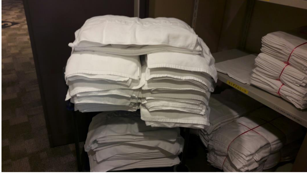
說明：在房務研修時所學的做隔天所要使用的床單和毛巾的準備。(2018/03/14)