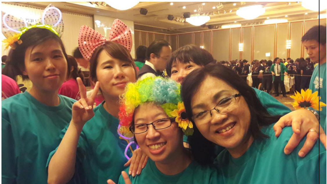
說明：在東京與支配人和輔佐和兩位前輩參加社員總會。(2018/06/11)