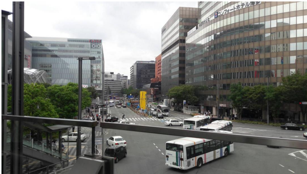
說明:在博多的最後一天從天橋看過去的景色。(2018/08/25)