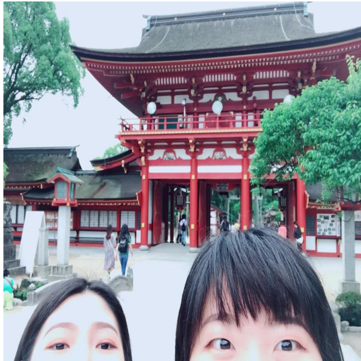
說明：去參觀在必去名單裡很久的太宰府(2018/6/23)