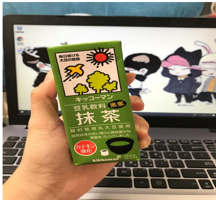
說明：日本的手搖店少又貴，為了補足想喝飲料的心，發現了這豆乳啊！有很多種口味，其中我最喜歡的是圖中的抹茶和紅茶的！（2018/4/3）