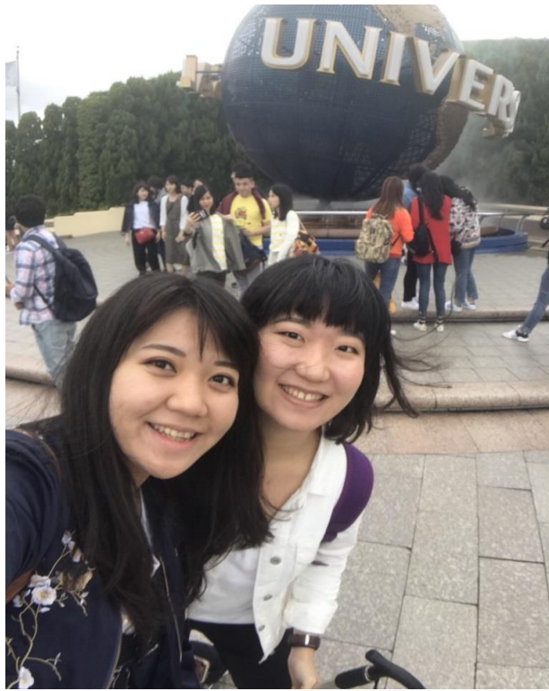
說明：家人來找我，一起去環球影城(2018/5/20)