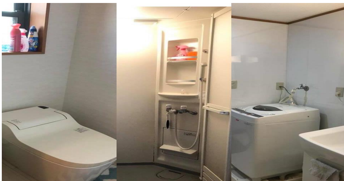
2018/3/1 共用空間 廁所 衛浴 洗臉台 洗衣機