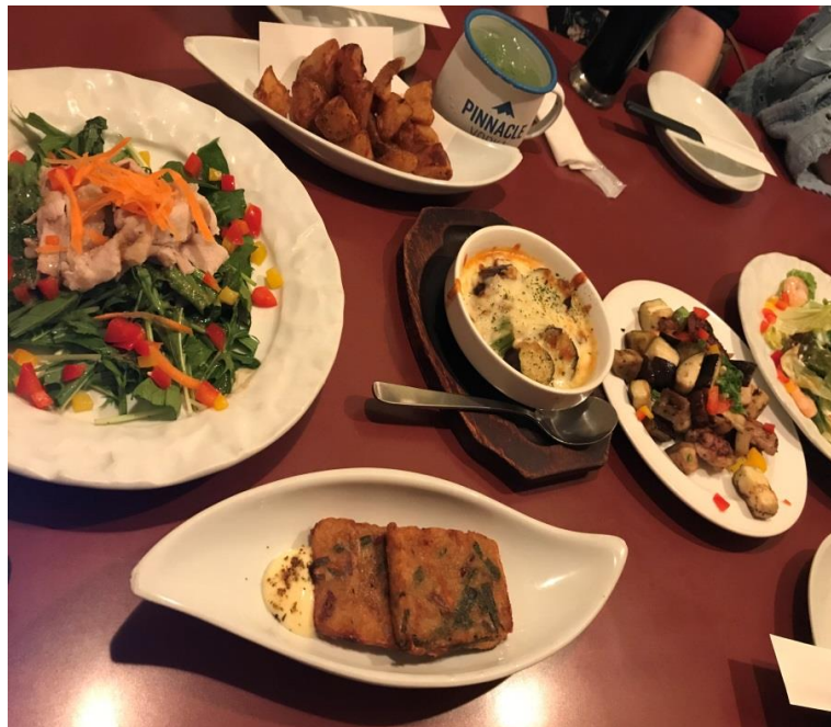
說明：下班和同事聚餐(2018/7/12)