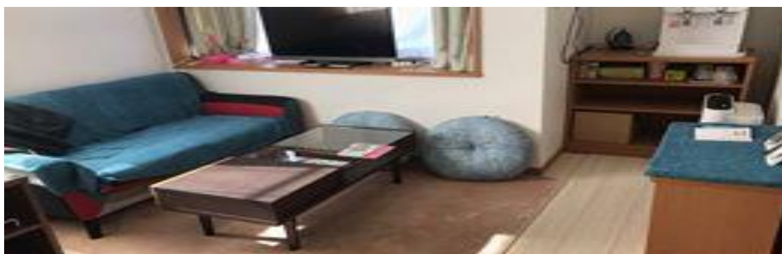
2018/3/1 共用空間 客廳