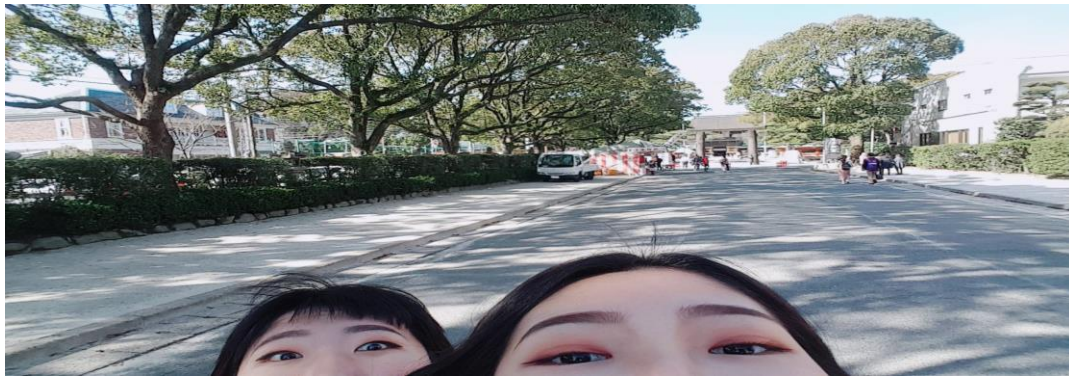
2018/3/17 剛到日本的第二個禮拜 終於出門繞繞