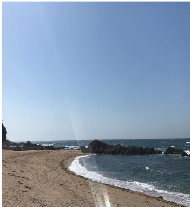
說明：受到室友支配人很多照顧，其中去系島時所拍(2018/5/26)