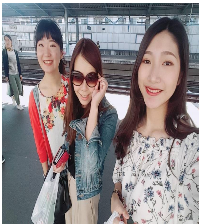
說明：和室友房東一起去賞紫藤花(2018/4/29)