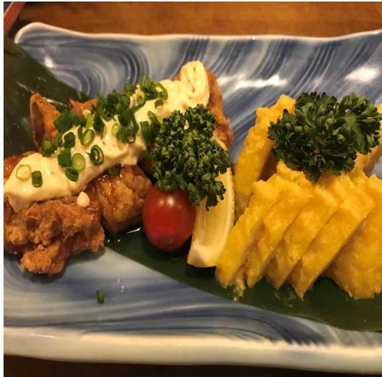
說明：左上是在日本最喜歡的一道肉料理（2018/5/25）