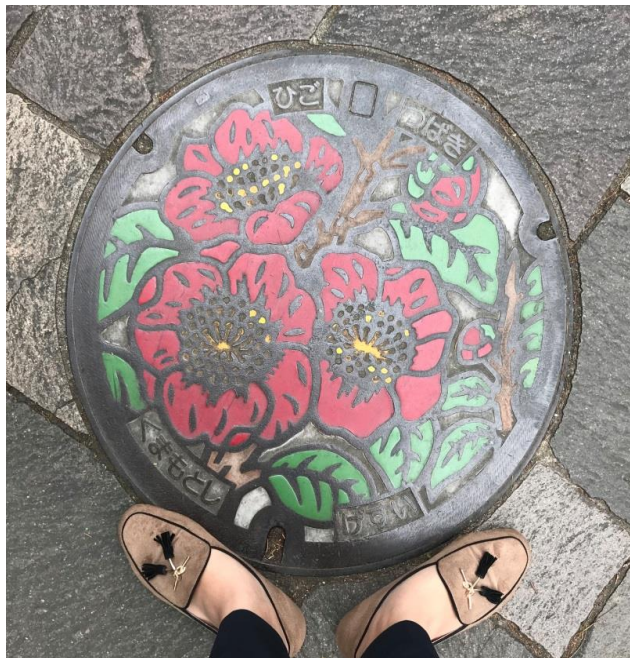
說明：在熊本發現和自己日文名字一樣的水溝蓋(2018/6/3)