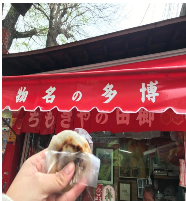
說明：在日本第一次沒有室友的陪同，出門亂晃(2018/4/7)