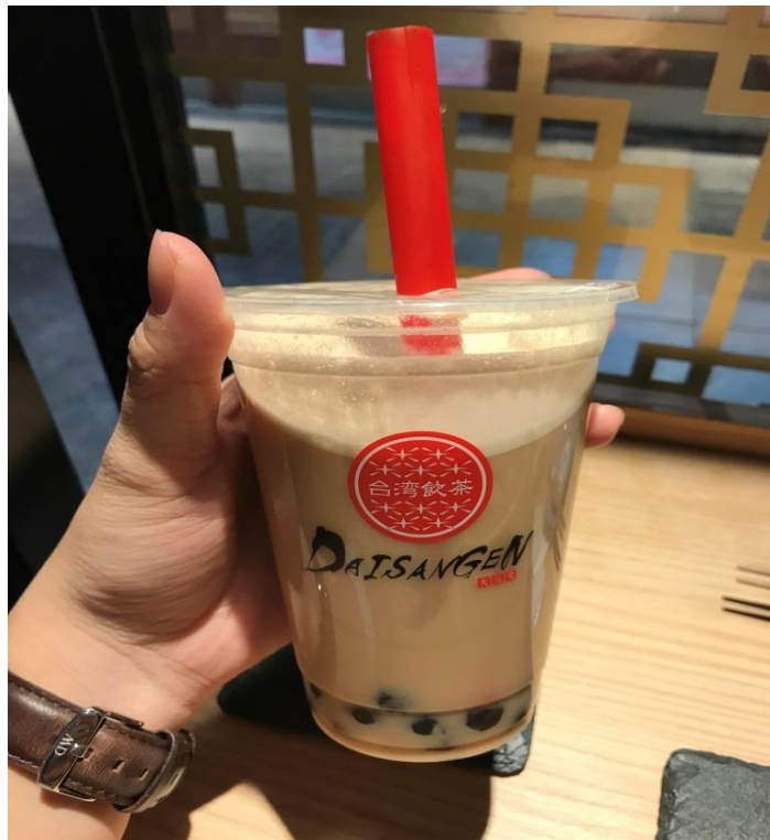
說明：太想念台灣的珍珠奶茶，經由留學組的推薦來嘗鮮(2018/3/24)