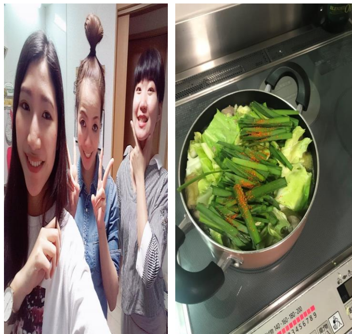
說明：提早幫室友慶生，煮了博多有名的料理もつ鍋(2018/4/20)