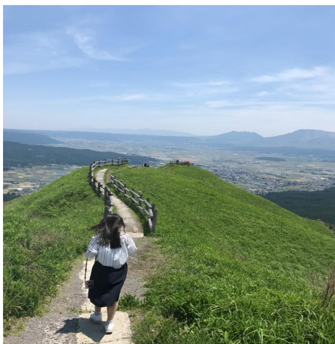
說明：和室友的第一個小旅行，熊本行!(2018/6/2)