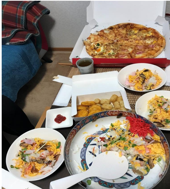
說明：和房東、掃房間的奶奶相見歡(2018/3/17)