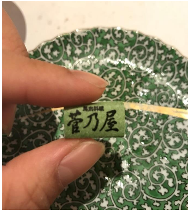
說明：人生第一次的馬肉體驗(2018/6/3)