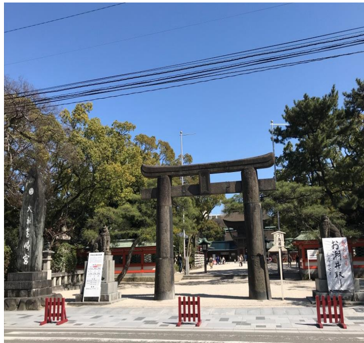
說明：到日兩個禮拜第一次到家裡附近走子(2018/3/17)