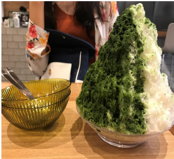
說明：要排很久但很好吃的冰店 店名おいしい氷(2018/7/7)