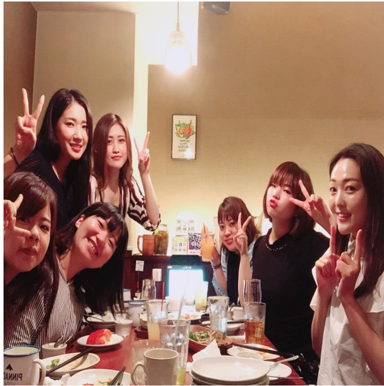
說明：下班和同事聚餐(2018/7/12)