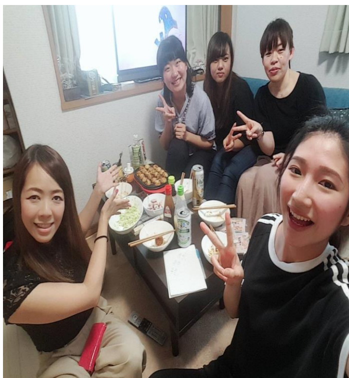
說明：和房東、室友、室友同事一起的章魚燒派對(2018/5/27)