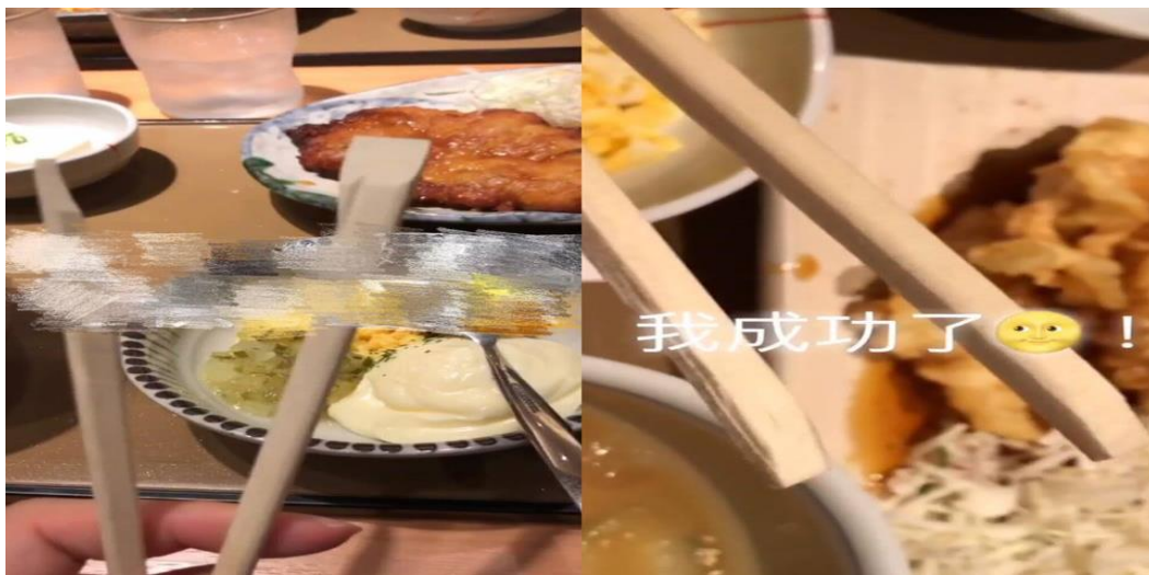
2018/5/31 一周一次的外食日，一直為不能好好掰開筷子困擾。