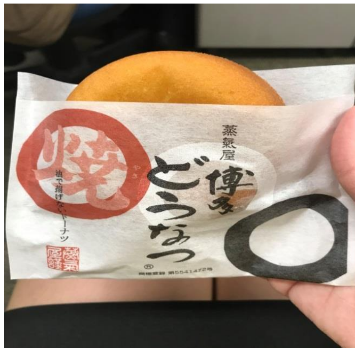
說明：公司辦了小提琴演奏會，當時拿到的小點心(2018/3/20)