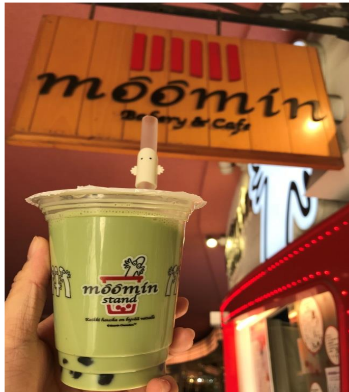
說明：來日本發誓一定要來朝聖的魯魯米餐廳(2018/4/7)