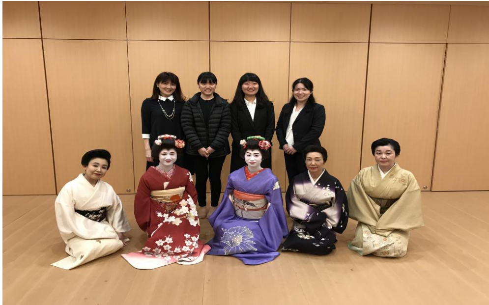
2018/4/14 和表演者合照 因為從台灣來的身分當天還被問了好多問題…