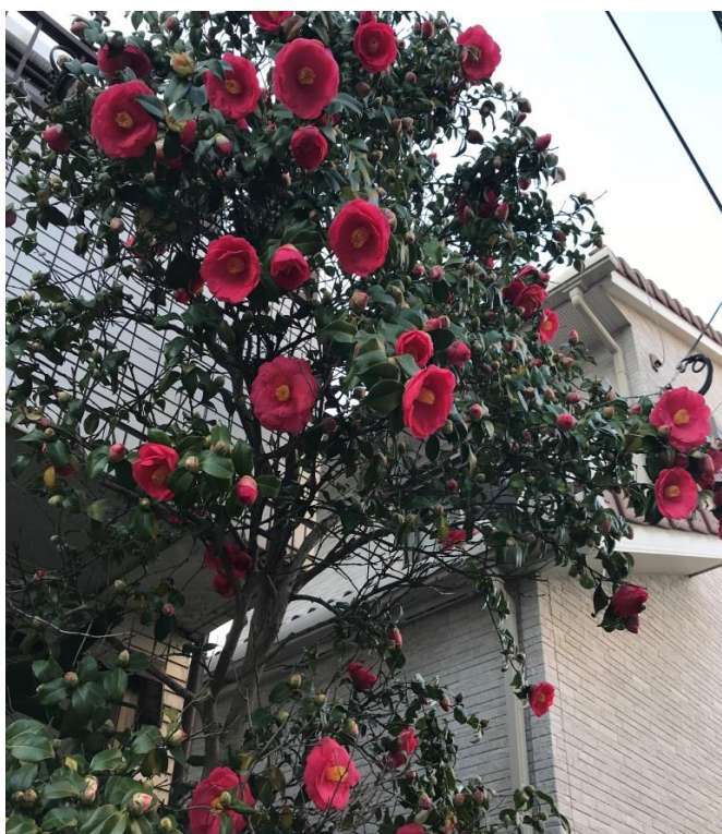
說明：家門口很神奇，兩個禮拜換一次的花(2018/3/24)