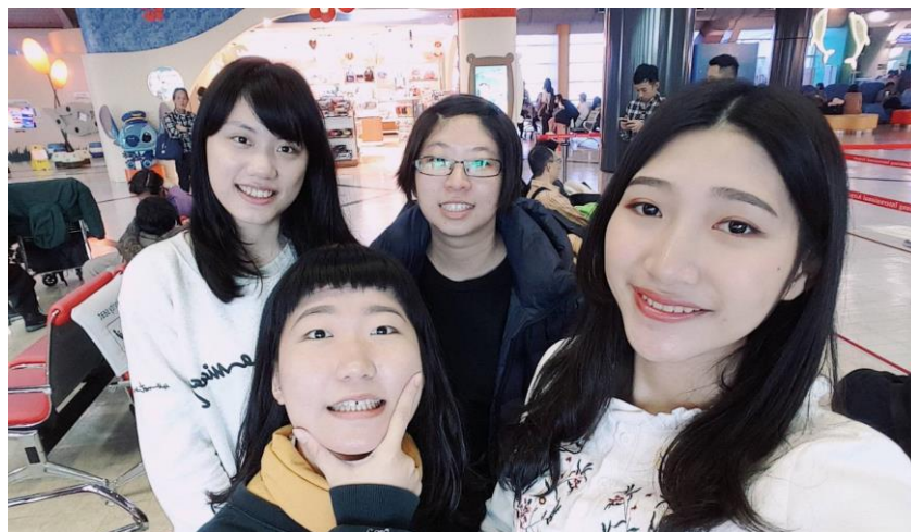
東橫 INN 四人組出國前合照(2018/02/27)

當初對要去飯店櫃檯工作這件事感到非常焦慮，雖然想著一個人去一間滿是日本人的公司日文一定可以進步飛速，但對自己的日文能力還是非常沒有把握，想著自己去北海道時的慘痛經驗就害怕的無法前進，但只要一想到如果不突破這關，就真的要放棄日文了，最後還是下定決心的踏出了這一步。