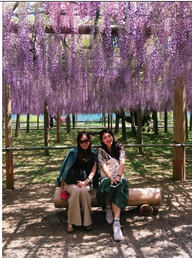
說明：和房東、室友一起去北九州賞花-河內藤園(2018/04/29)