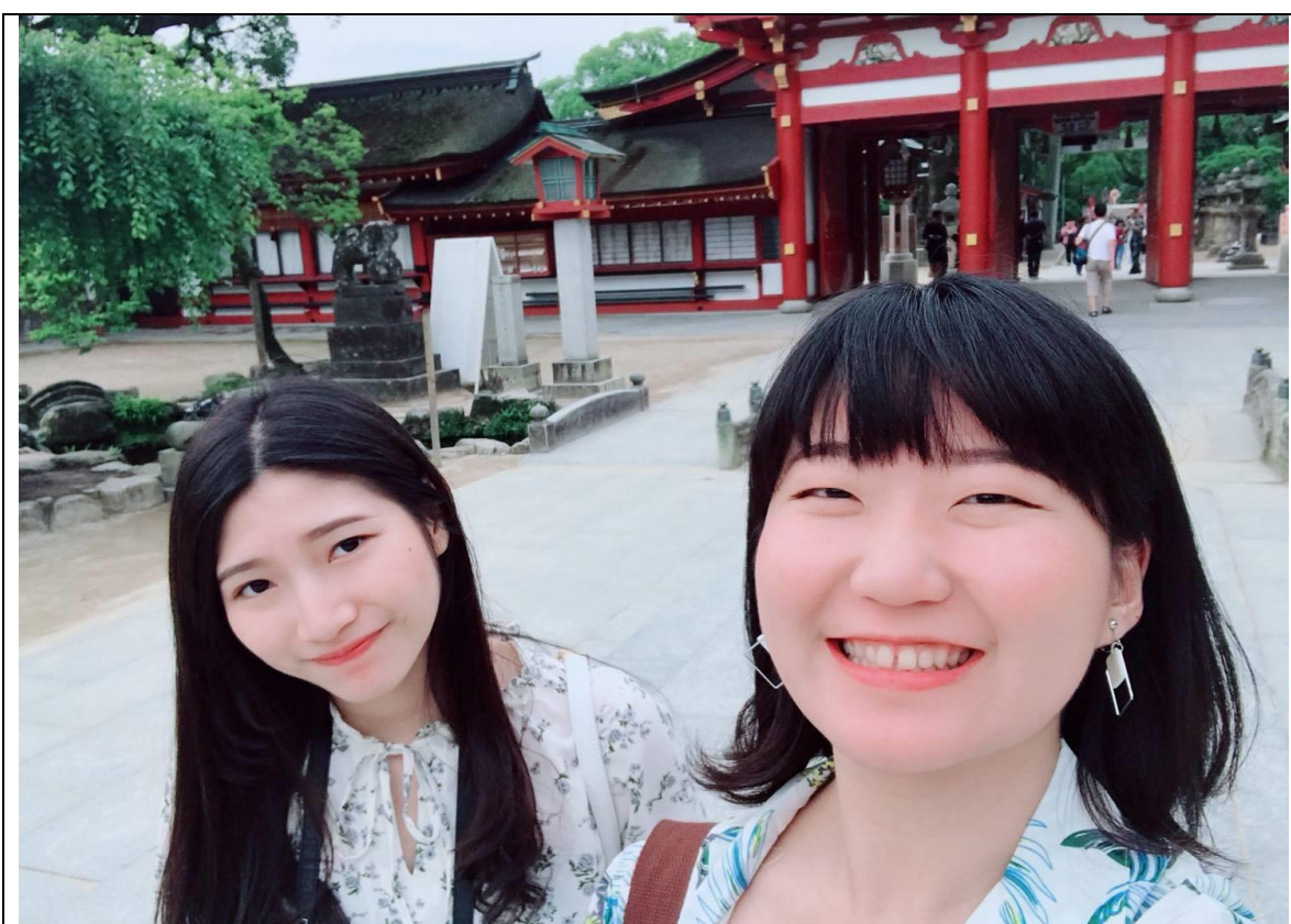
說明：休假和室友一起去太宰府神宮。(2018/06/24)