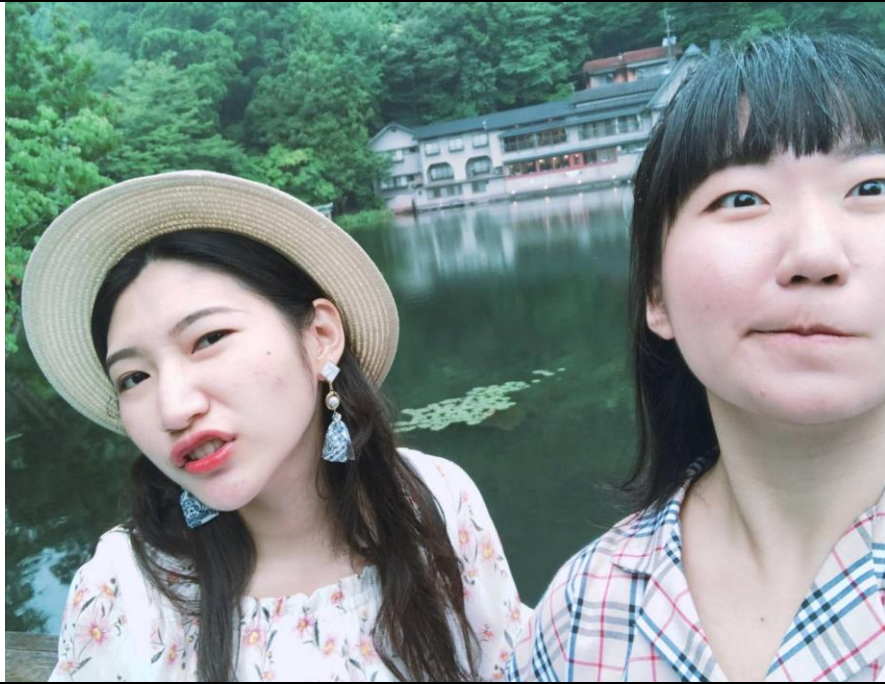
說明：大分之旅-金鱗湖(2018/07/29)