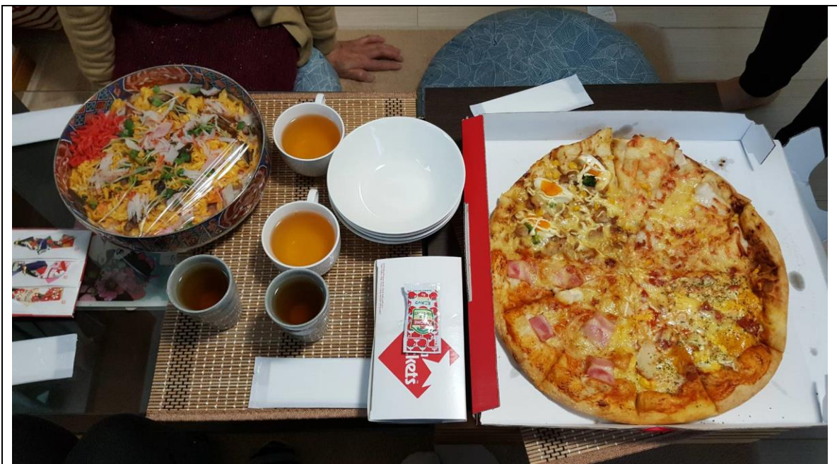
說明：和房東、打掃阿姨一起吃飯。(2018/03/17)