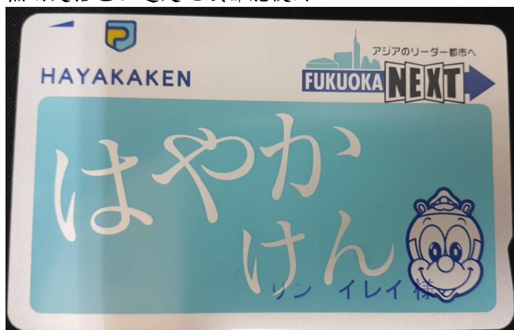
記名的 IC 卡 (2018/07/22)

外出基本上就是走路跟電車這兩種方式，因為生活圈在福岡市最熱鬧的博多天神一帶，靠走路就能去很多地方了。公司有補助交通費，所以上班以定期券為主，每個月會更新一次。之後去買了一張IC卡，類似台灣的悠遊卡，休假去其他地方玩無論是搭巴士還是地鐵都能使用。