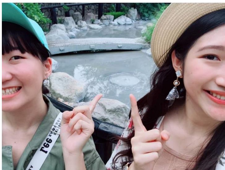
和室友一起去大分的別府地獄めぐり。 (2018/07/28)