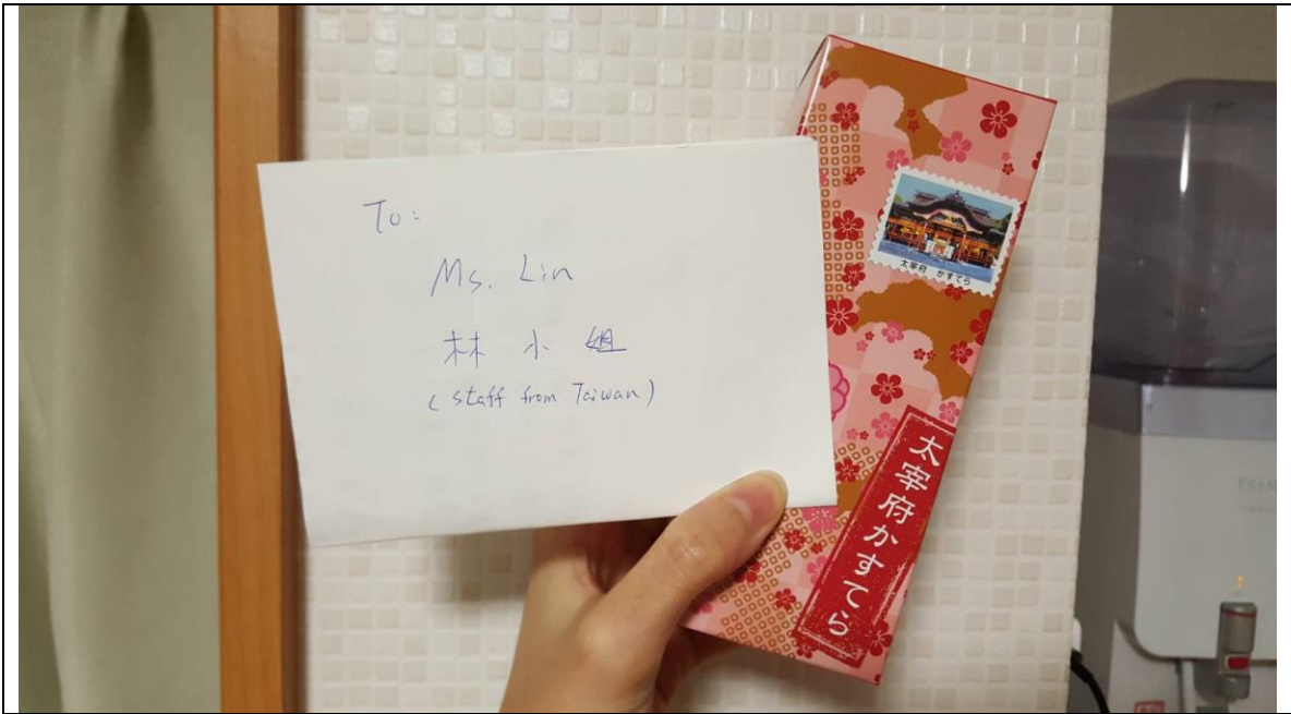
說明：從台灣客人那裡收到的伴手禮和信。(2018/06/22)