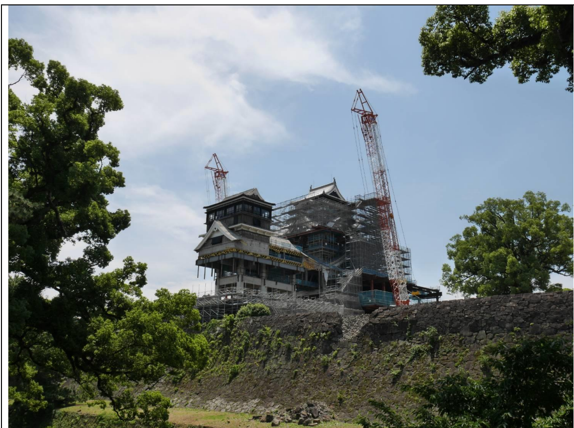
說明：熊本之旅-熊本城修復中的照片。(2018/06/04)