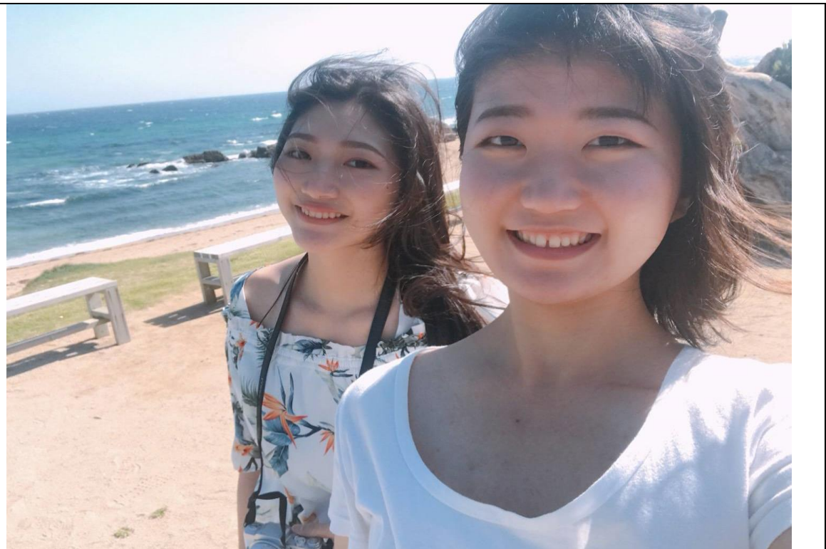
說明：負責人帶我和室友一起去系島看海。(2018/05/26)