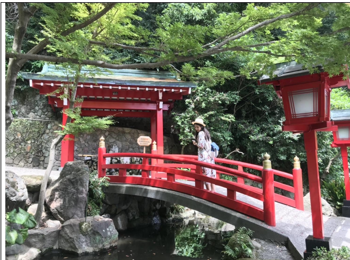
說明：大分之旅-別府地獄めぐり (2018/07/28)