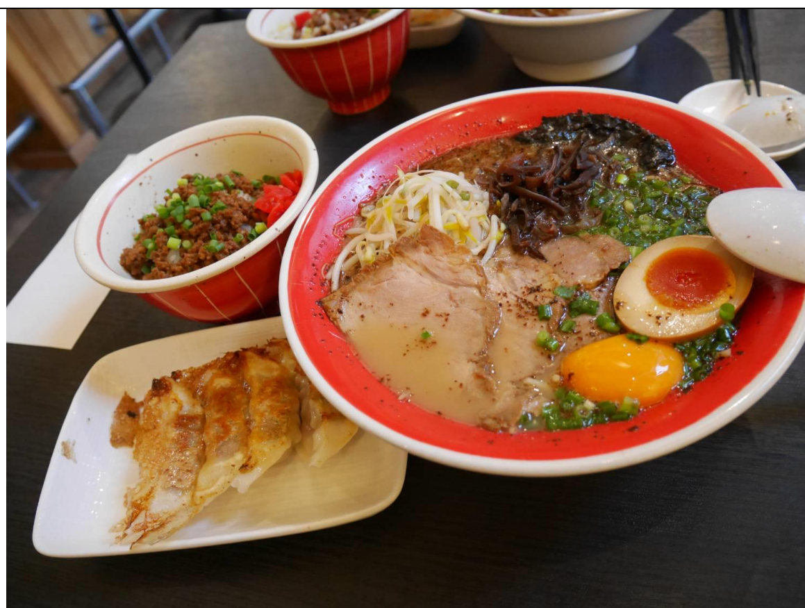
說明：熊本旅-當地著名的黑亭拉麵。(2018/06/03)