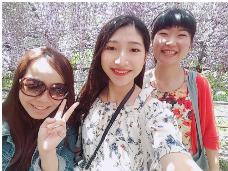
和房東姊姊一起去北九州看藤花。 (2018/04/29)

這半年和室友一起去了很多小旅行，去北九州賞花、去大分泡溫泉、去熊本看古蹟...等，休假時也很常一起去天神附近的百貨逛街吃好料，雖然只有兩天的休假沒辦法去很遠的地方，但還是非常足夠了，交通部分可以的話盡量都選擇搭巴士，好好省錢才能去下一趟旅程啊！