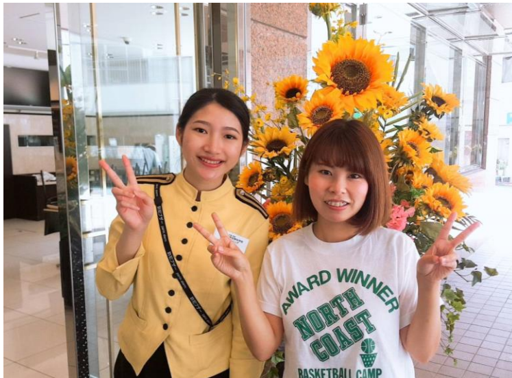
和同事的合照，制服分黃粉兩色，覺得自己的形象較適合黃色所以選擇了黃色制服。 (2018/08/24)

居住的地方因為靠近海，冬天時風真的特別特別冷，除了圍巾毛帽以外，口罩絕對是不可或缺的，上班的制服是統一長袖的，所以冬天時會在裡面穿發熱衣，夏天則是換成小背心這樣，福岡的夏天跟台灣差不多熱，衣著上跟在台灣沒什麼變化。