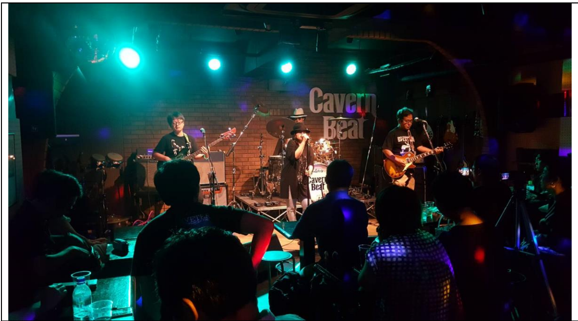
說明：受同事邀約去LIVE HOUSE看了她們樂團的表演。(2018/08/05)