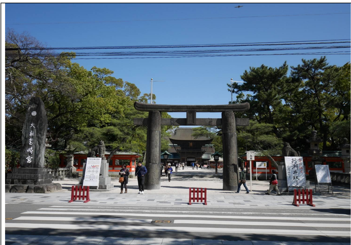
說明：離家裡三分鐘距離的千年歷史神社-箱崎宮 (2018/03/17)