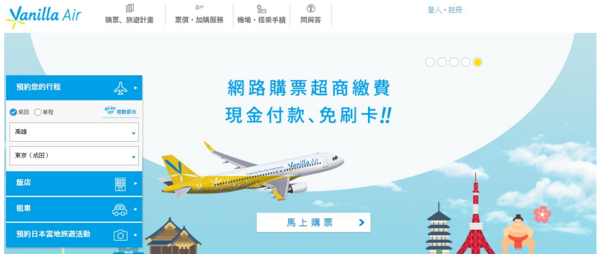
香草航空官方網站(2018/01/16)

我們東橫四人主要分兩兩行動，我跟另外一位同學想省點機票錢，所以選擇廉航公司的香草航空，回程時間還沒正式確定下來，就先買了去程的機票而已。