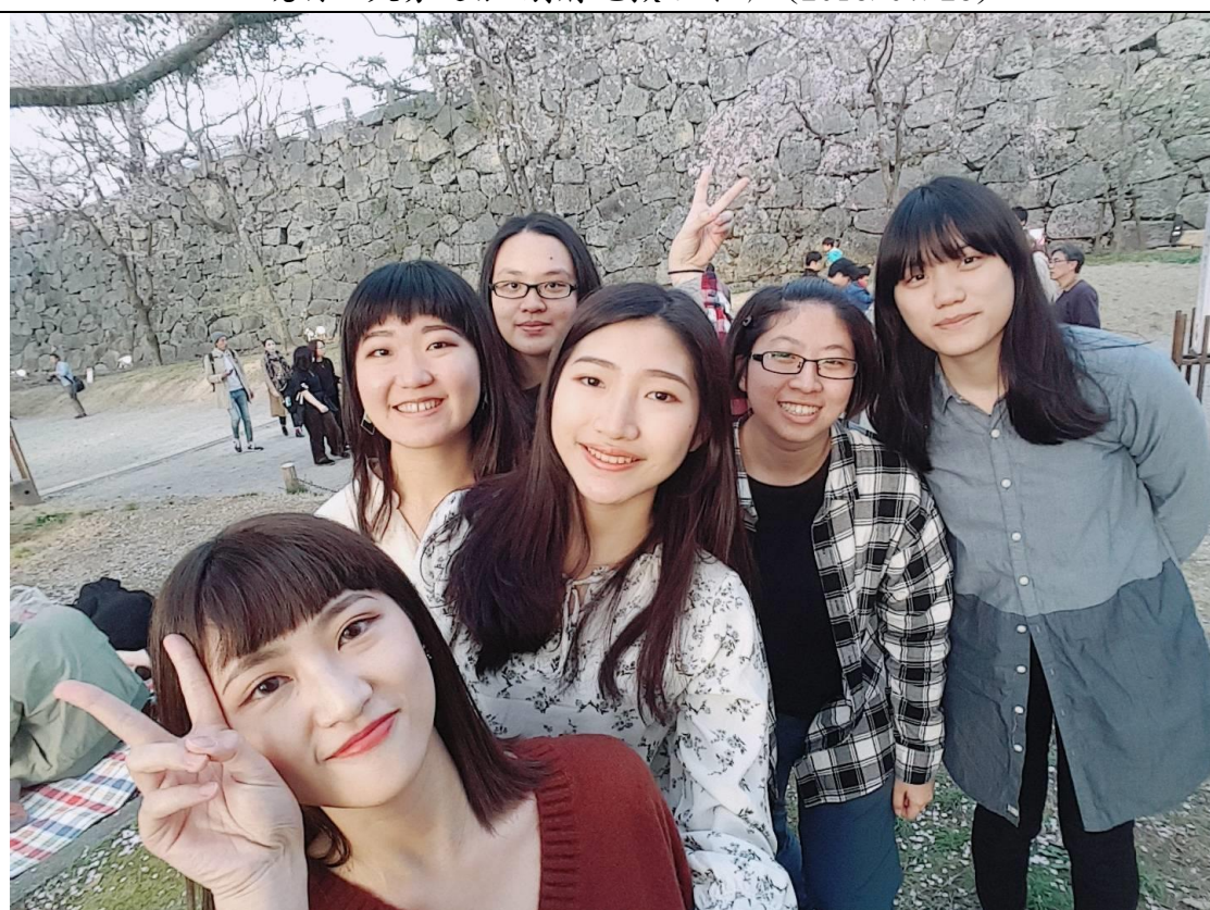
說明：和在福岡留學的同學們一起去賞櫻 (2018/03/31)