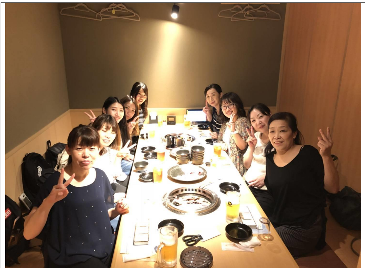
說明：最後一次開會後大家一起去吃燒肉。(2018/08/18)