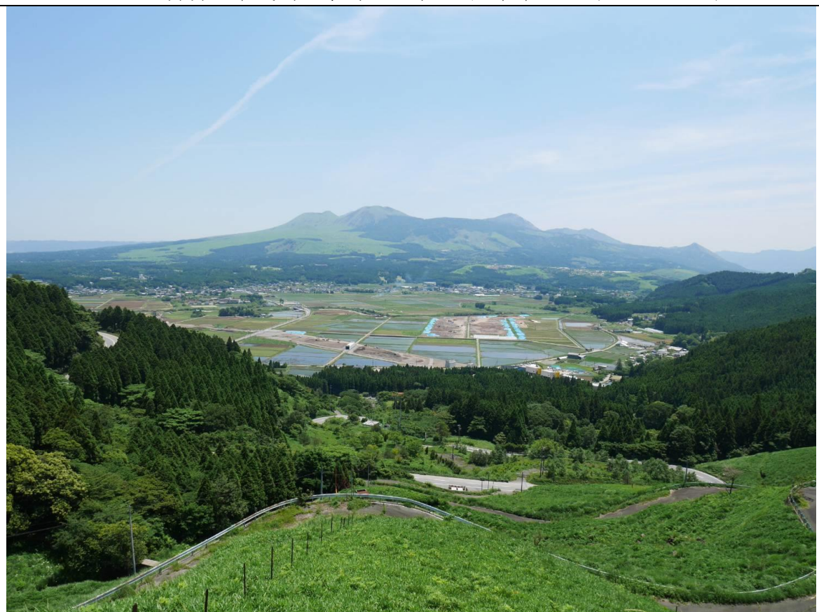
說明：負責人帶我們去熊本知名景點-大觀峰。(2018/06/04)