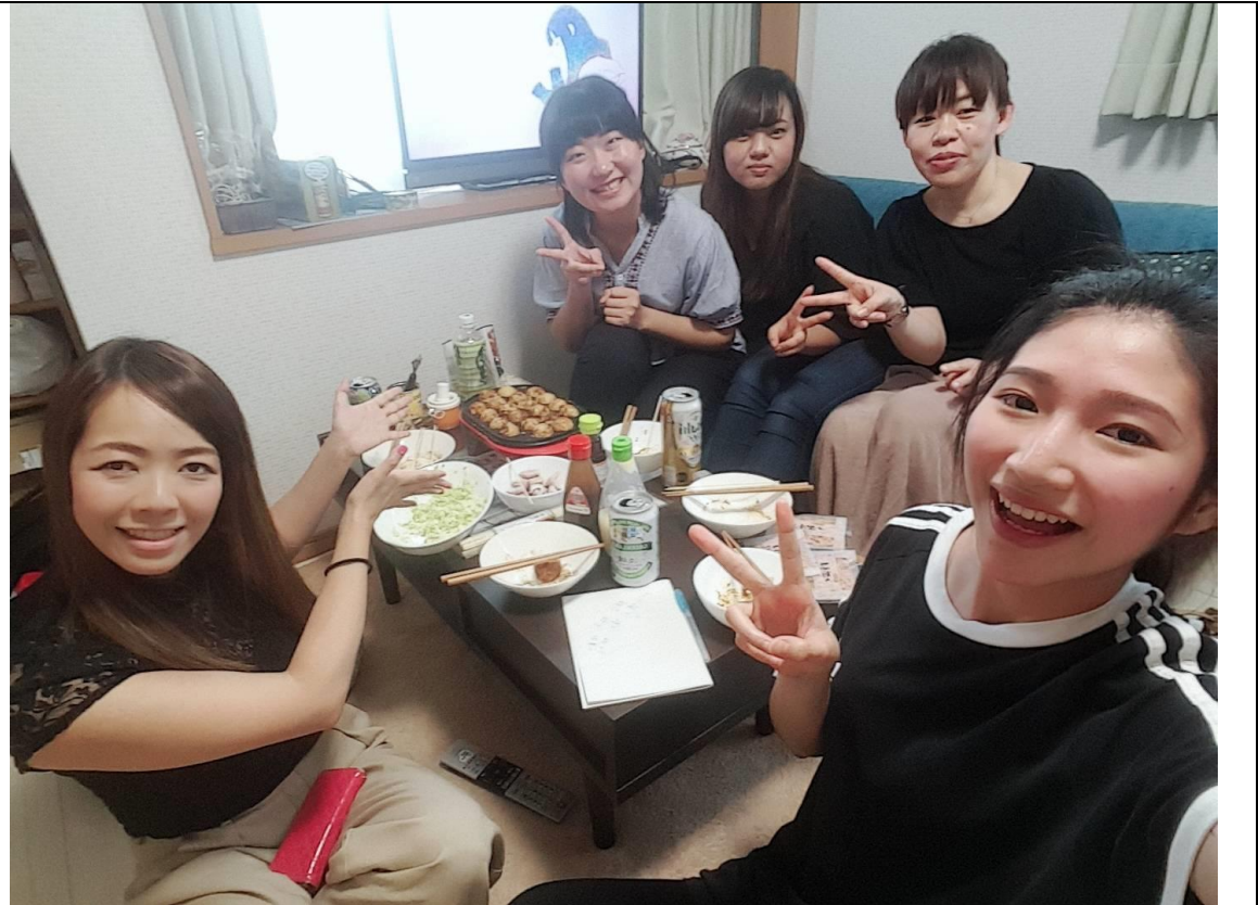
說明：和室友、同事、房東一起辦章魚燒派對。(2018/05/27)