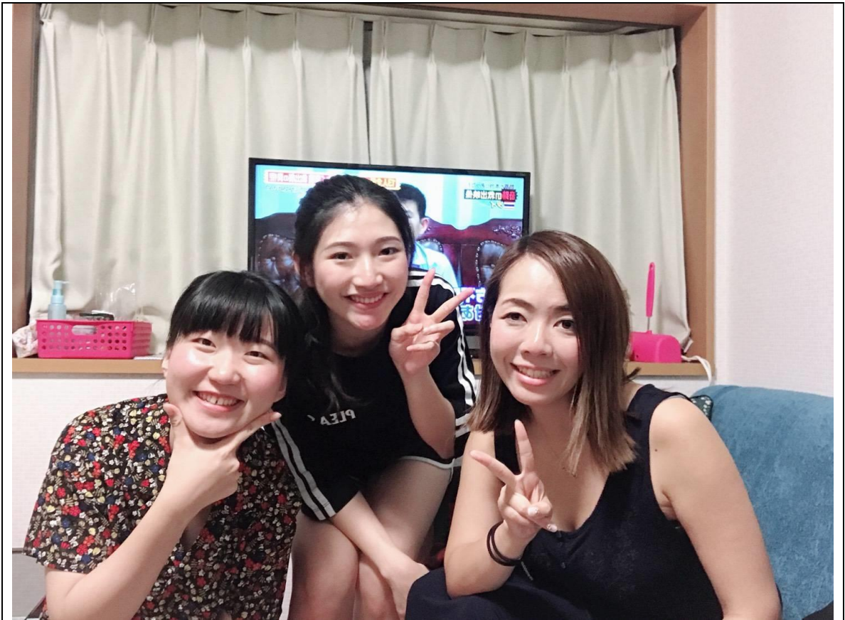
說明：和房東、室友最後的合照。(2018/08/26)