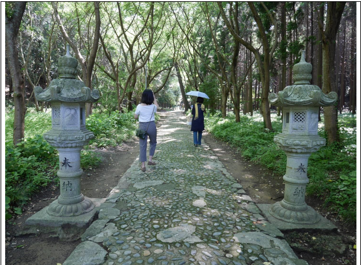
說明：負責人帶我們去糸島知名景點-櫻井神社。(2018/05/26)