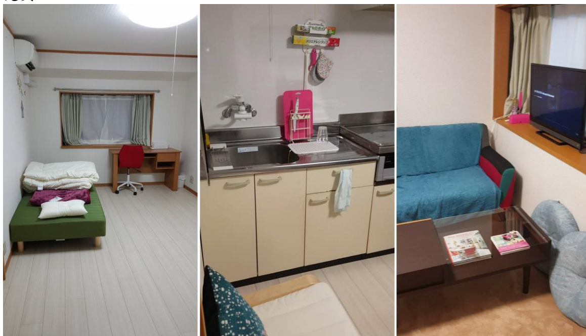
左到右分別為房間、廚房、客廳。(2018/03/01)

我和另外一位同學最開始就決定要一起住了，在簽證確定通過後馬上就開始找房子了，因為年紀未滿二十，又是外國人，一開始幾乎頻頻碰壁，但最後還是很幸運地找到一間非常非常棒的Share House！廚房器具應有盡有、房間非常寬敞、客廳溫馨舒適、衛浴空間也很乾淨，我們的Share House的房租繳交方式比較特別，是分三個月一次這樣，所以初期剛過去先繳了三個月份的房租，為了要存下三個月的房租其實過的還滿緊張的... 但繳完後真的超輕鬆！雖然房租不算很便宜，但家離地鐵走路只要5分鐘，到離公司最近的車站只要8分鐘，超市也非常近，生活機能非常完美。