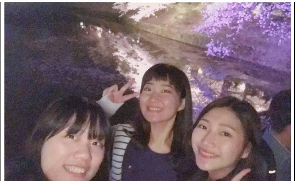
說明：負責人帶我們去賞夜櫻。(2018/03/30)