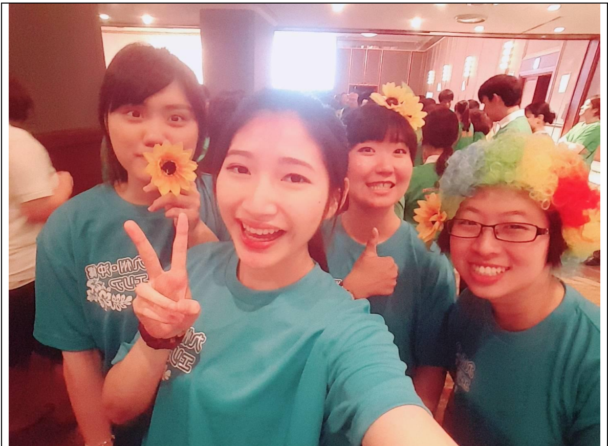
說明：社員總會和一起來福岡實習的同學們合照。(2018/06/11)