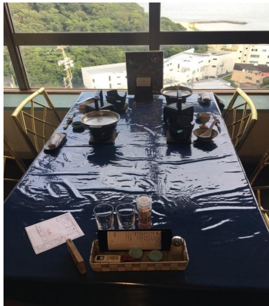
說明：餐廳基本擺設。(2018/6/30)