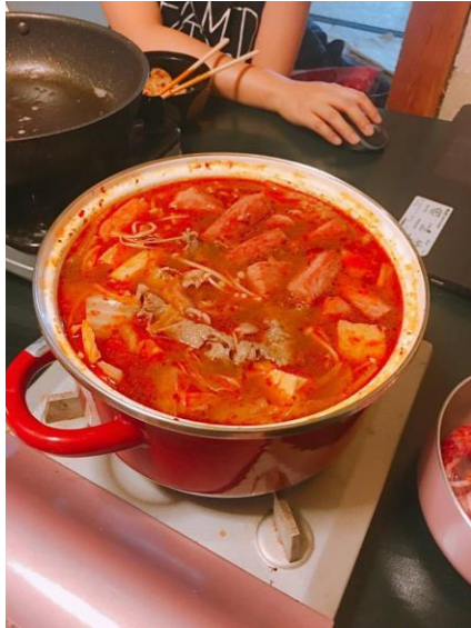
說明：某天吃的麻辣鍋

但是我們比較少吃，通常都是拿白飯而已因為我們跟另外兩位同事姊姊會一起煮飯吃。宿舍的一樓有廚房冰箱微波爐可以使用應有盡有。