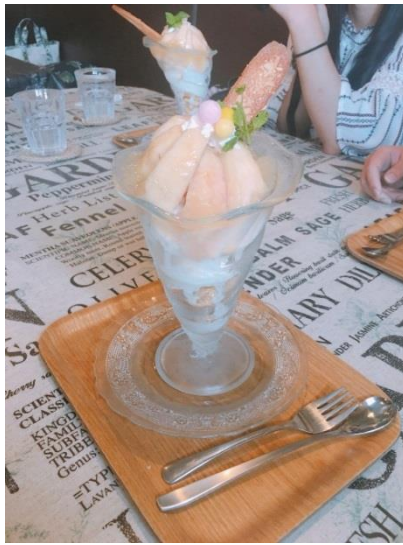
說明：超好吃的水蜜桃聖代。(2018/7/20)