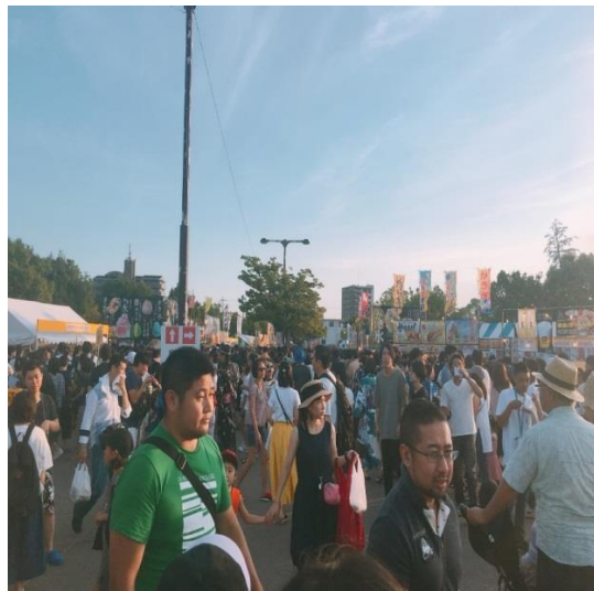
説明：煙花大會屋台。(2018/8/18)