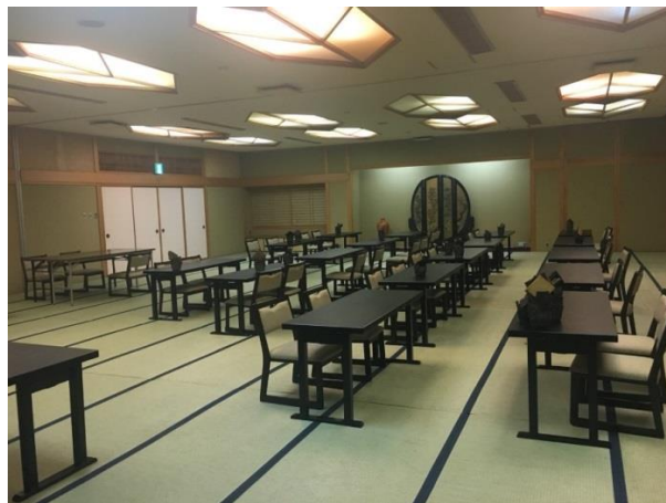
說明：二樓宴會廳桌席。(2018/6/28)