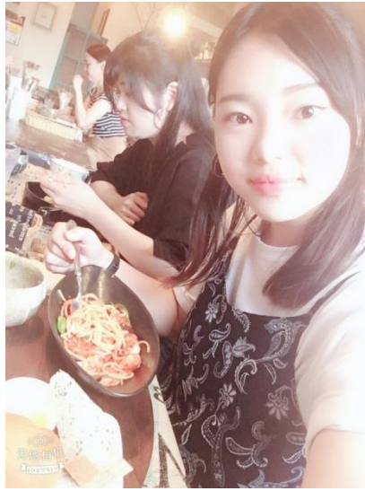
說明：走很遠去吃有名的咖啡廳。(2018/7/20)