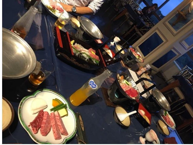
說明：第一天吃餐廳的晚餐。(2018/6/19)