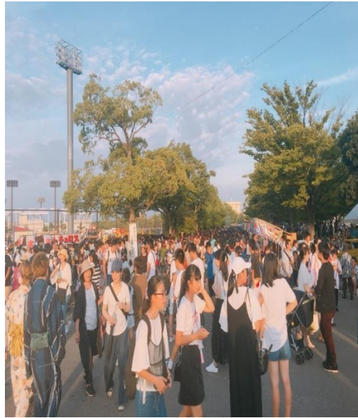
説明：：煙花大會屋台。(2018/8/18)