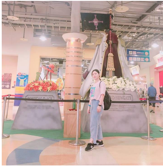
說明:知名動畫場景。(2018/7/17)