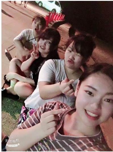
說明：海邊參加盆踊り。(2018/8/10)