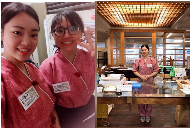
說明：這是我們的和式制服下半身是長褲。在餐廳工作時需要系圍裙

因為我們是中期才去的那時候就已經算是暑假的期間了，所以我跟另一位同學都沒有帶甚麼禦寒衣物就只帶一件薄外套而已。又逢日本熱浪真的是溫滿高的。