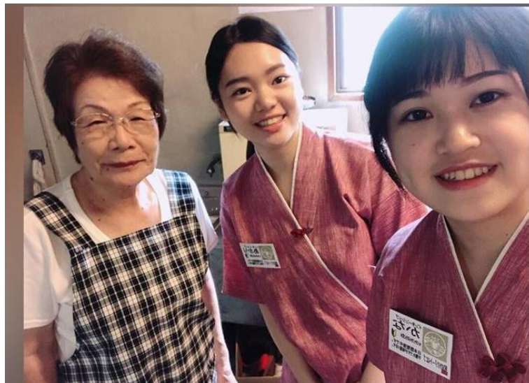
說明：對我們很好的同事婆婆。(2018/9/1)