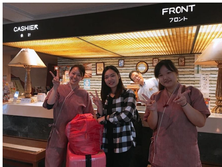
說明: 與支配人跟同事們最後的合照。(2018/9/27)