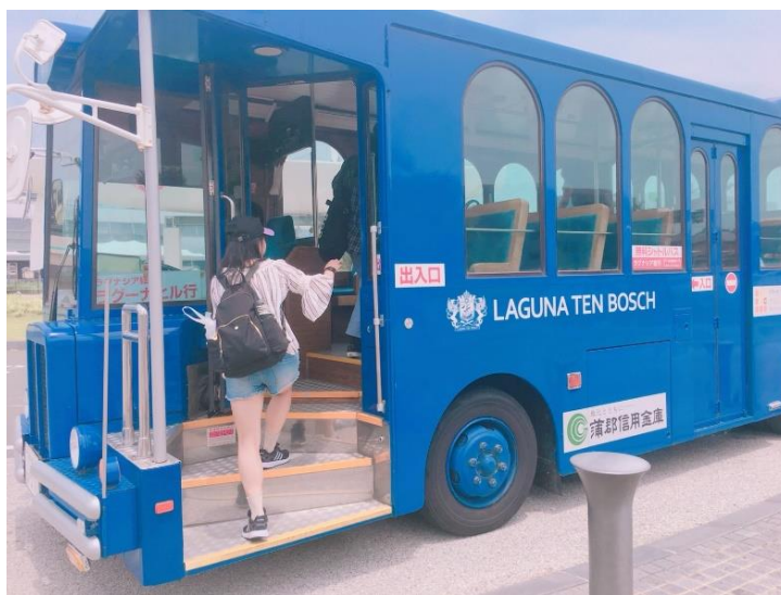
說明:LAGUNA水樂園接駁車。(2018/7/17)