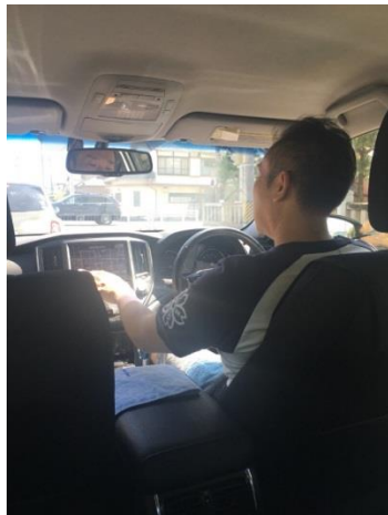
說明：同事載我們出去吃飯加採買。(2018/7/2)