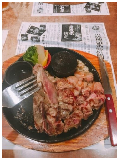
說明：與同事一起去吃人氣牛排。(2018/7/2)