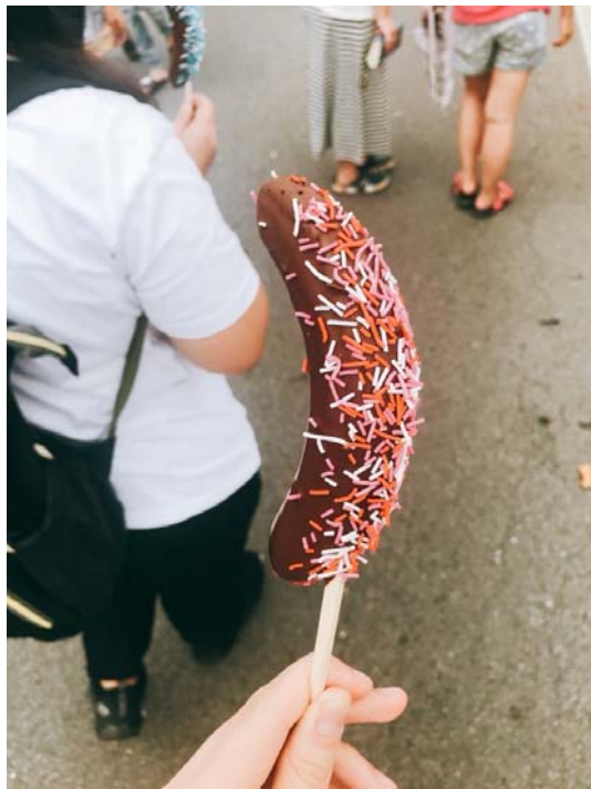
說明：第一次吃巧克力香蕉（2018/08/15）