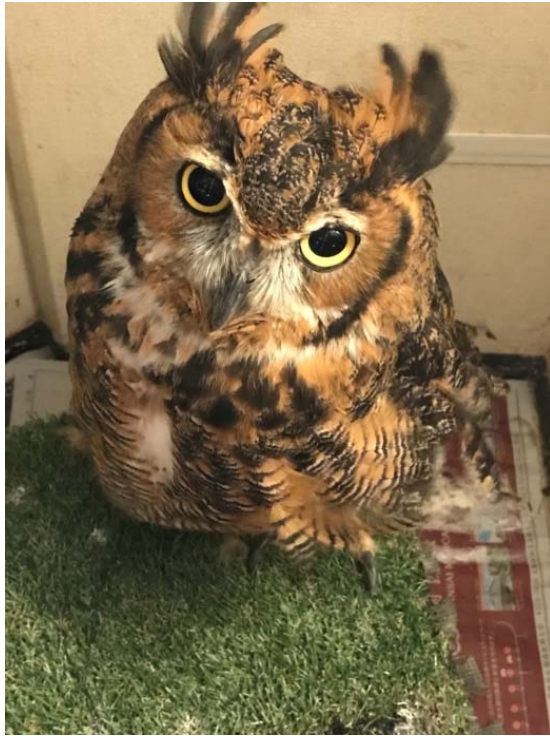
說明：秋葉原的貓頭鷹咖啡廳（2018/09/26）