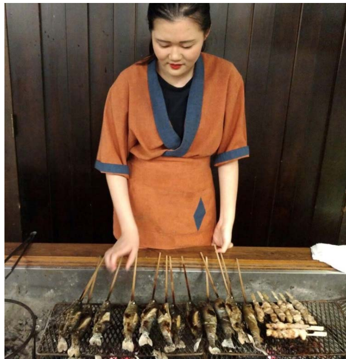
說明：工作時烤肉的照片（2018/07/23）