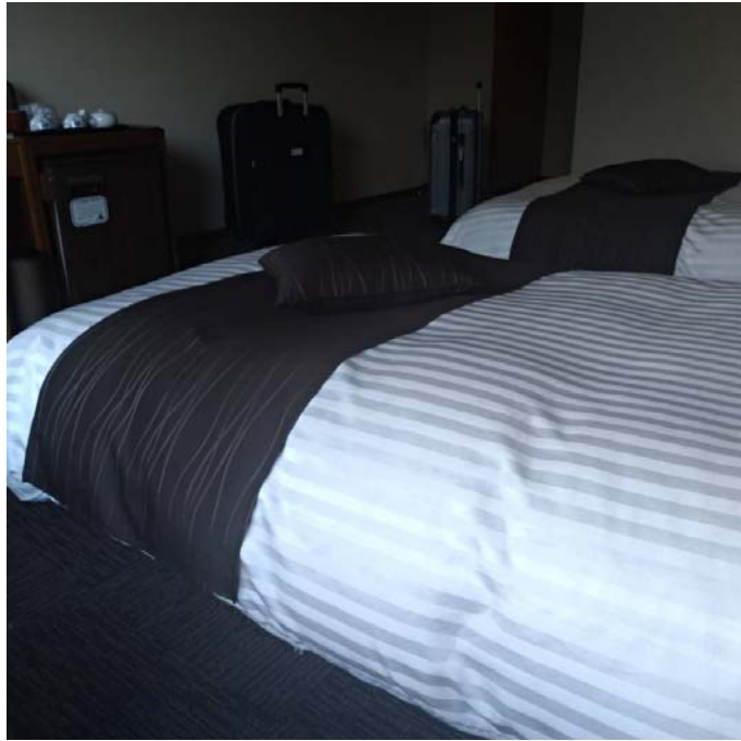
說明：飯店客房內部照片（2018/06/25）