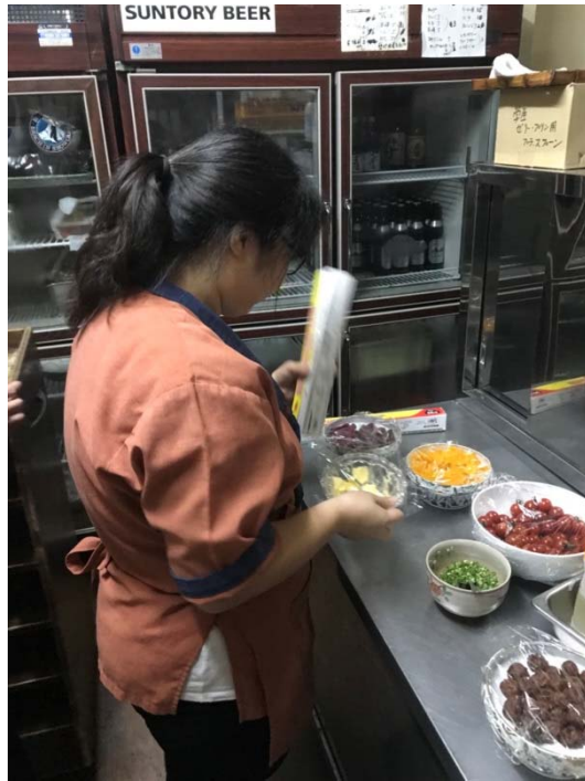
說明：郁淳包保鮮膜的照片（2018/09/03）