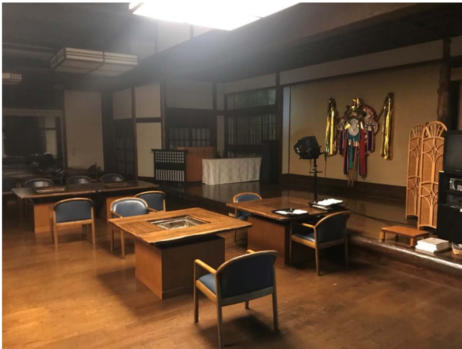
說明：宴會廳整體照片（2018/06/30）