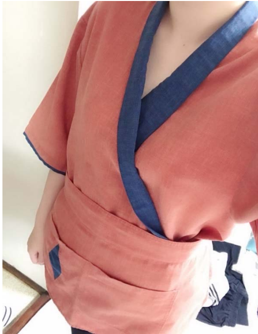
説明：晩班制服照片（2018/07/02）