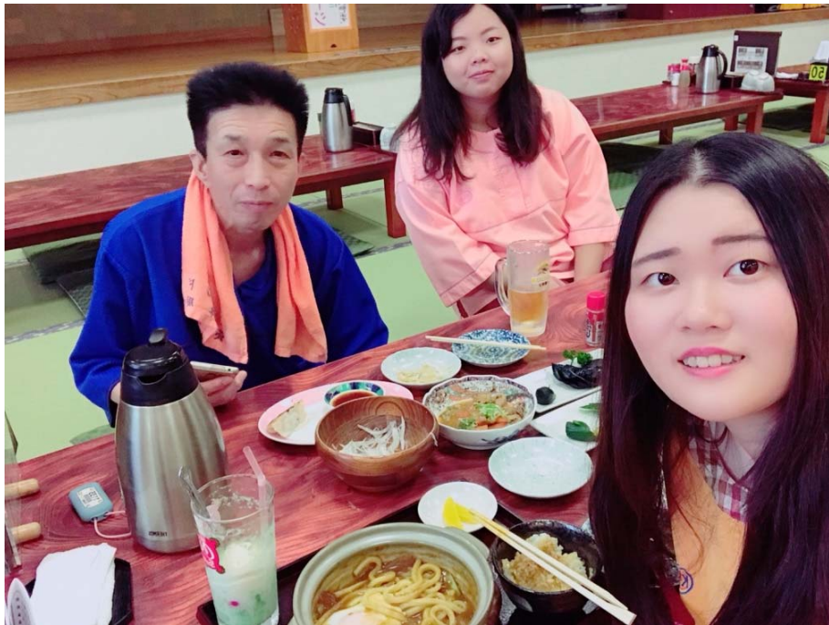
說明：上司帶我們出去玩的照片（2018/09/18）