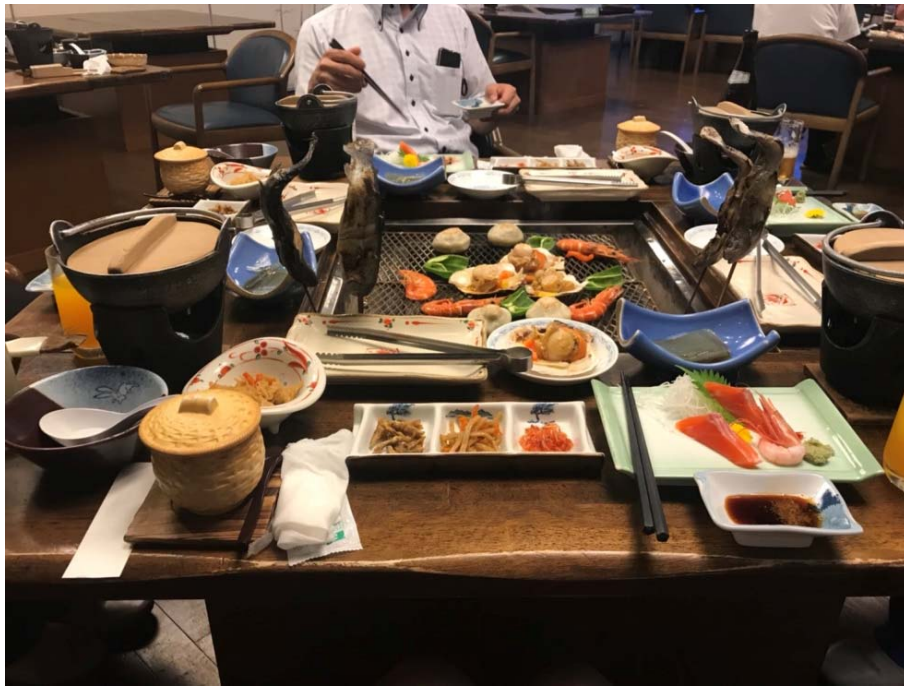
說明：第一天到飯店被招待的晚餐（2018/06/25）