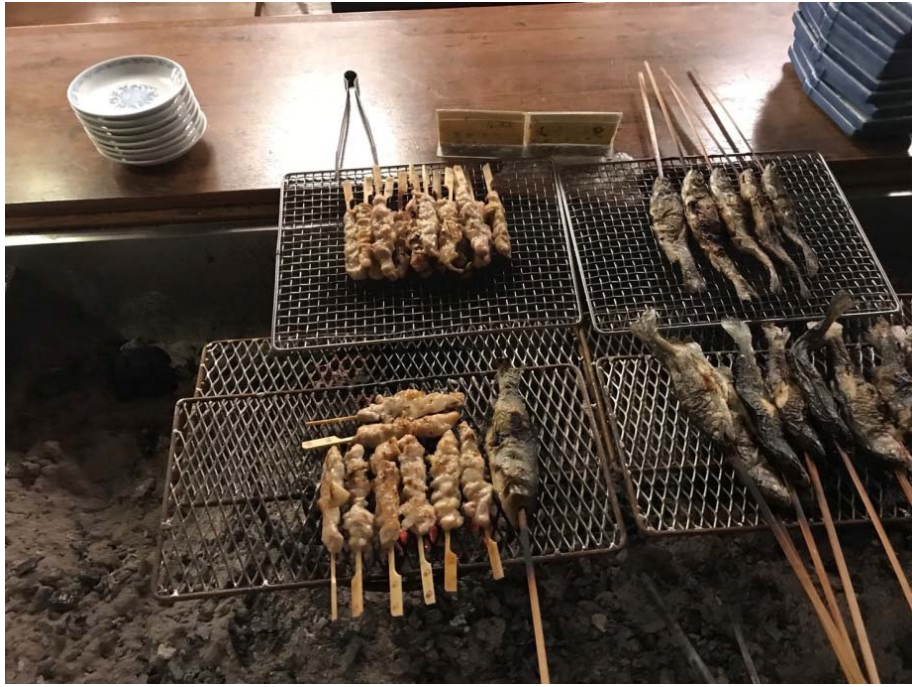
說明：自助餐的烤魚跟烤雞肉串（2018/08/19）