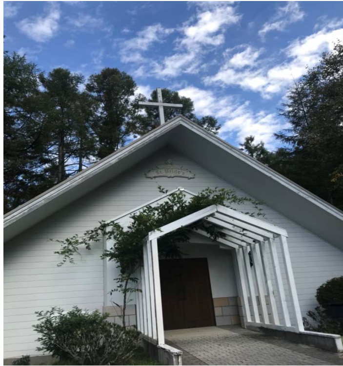
說明：飯店對面的教堂（2018/09/24）