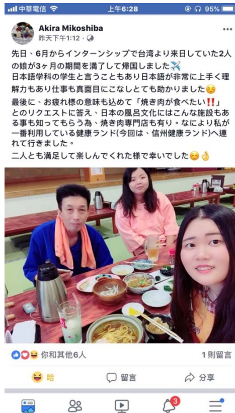
說明：上司在facebook上po的文章（2018/10/01）