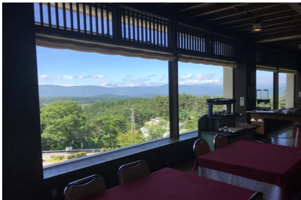
說明：餐廳戶外風景（2018/07/02）