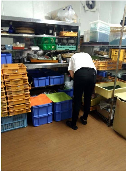
說明：在倉庫找東西的時候（2018/09/10）