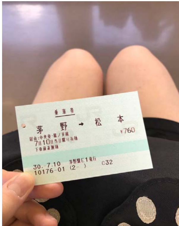
說明：第一次放假去松本玩時的車票（2018/07/10）