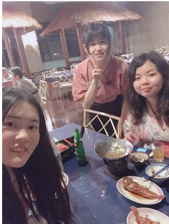
說明：去名古屋找家好 (2018/09/20)