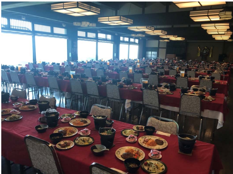
說明：學生團體200人擺盤完成時的照片（2018/07/16）