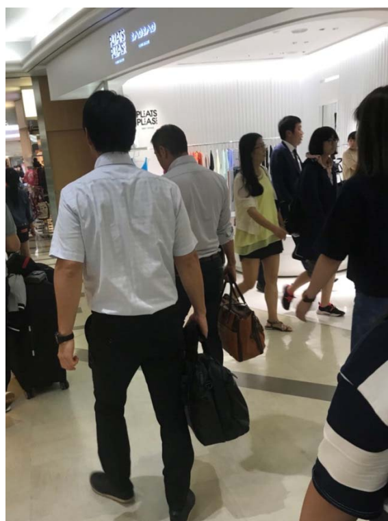
說明：仲介帶領我們去飯店（2018/06/25）