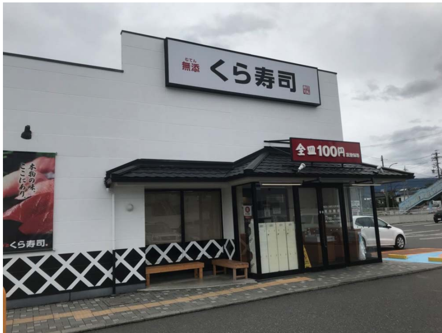
説明：第一次在日本吃壽司（2018/09/01）