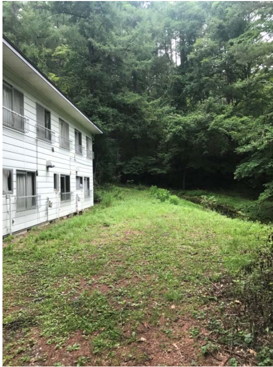
説明：宿舎外観の照片（2018/08/07）