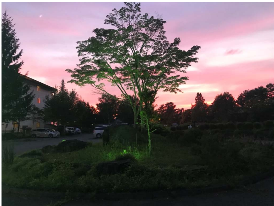
說明：飯店戶外黃昏的照片（2018/07/16）