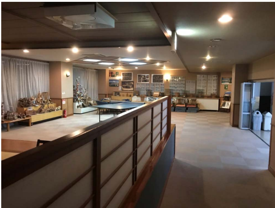
說明：餐廳到澡堂的走廊（2018/06/25）