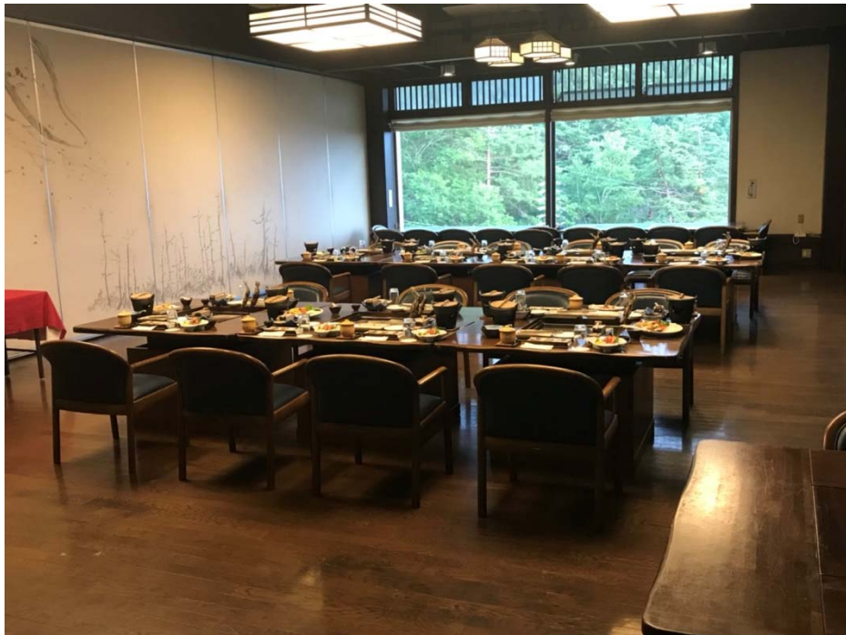
說明：宴會擺盤完成時的照片（2018/07/18）