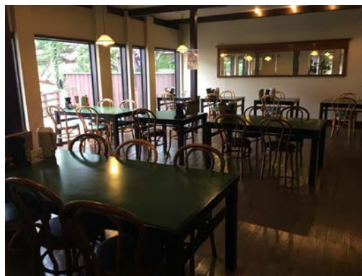
花小道食事區也是四季紙的食事區