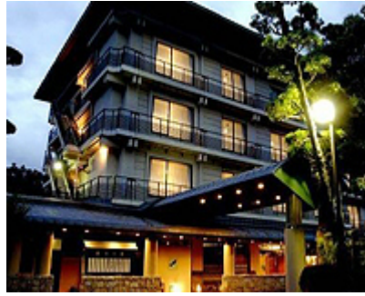
靜岡縣伊豆市修善寺桂川飯店

(五星級飯店)修善寺出名的就是溫泉,所以這附近有很多溫泉飯店或旅館也是著名的觀光景點。桂川飯店介紹...2樓是宴會廳 3樓是大廳 4樓是散客區 4~8樓房間 9樓大浴場