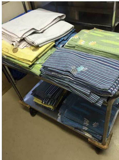
放入新浴衣的準備