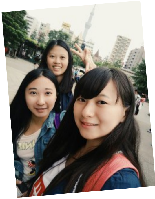
静岡組-分組活動-淺草