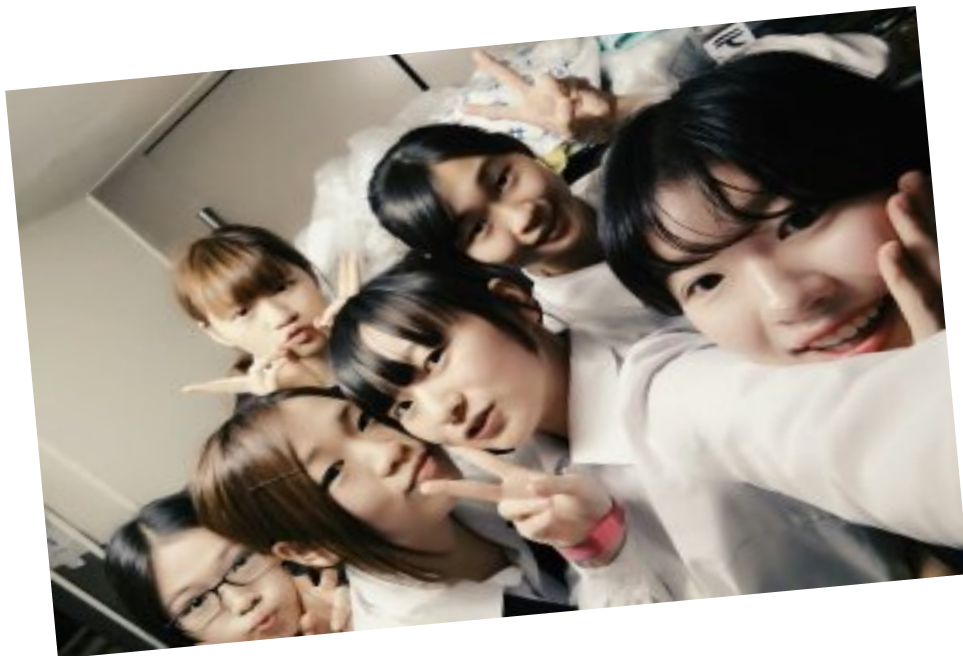
早班的一個人辭職了(105/04/30)