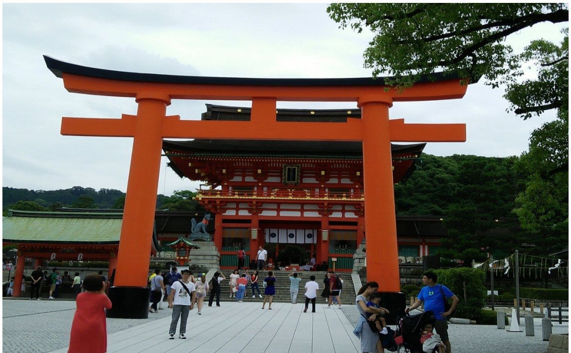
京都-伏見稻荷大社(105/06/30)