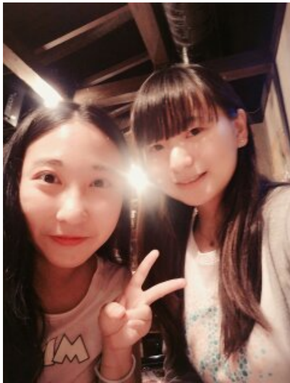
靜岡組-分組活動-新大久保(105/06/14)