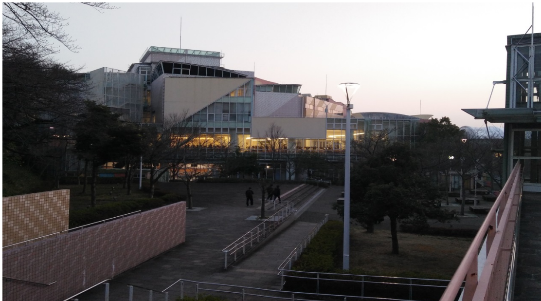
剛開始去住的地方 (105/03/07)

海外実習を選んだ本当に良かったと思います、嫌のこともあるけど、 でもたくさん友達を会って、一緒に色々なことをやって、嬉しかった です。離れての気持ちちょっと複雑、意外な泣いてない、多分自分 もまだここ戻ると思いました。