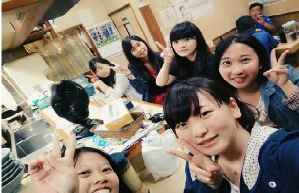
静岡組集合修善寺(105/06/15)