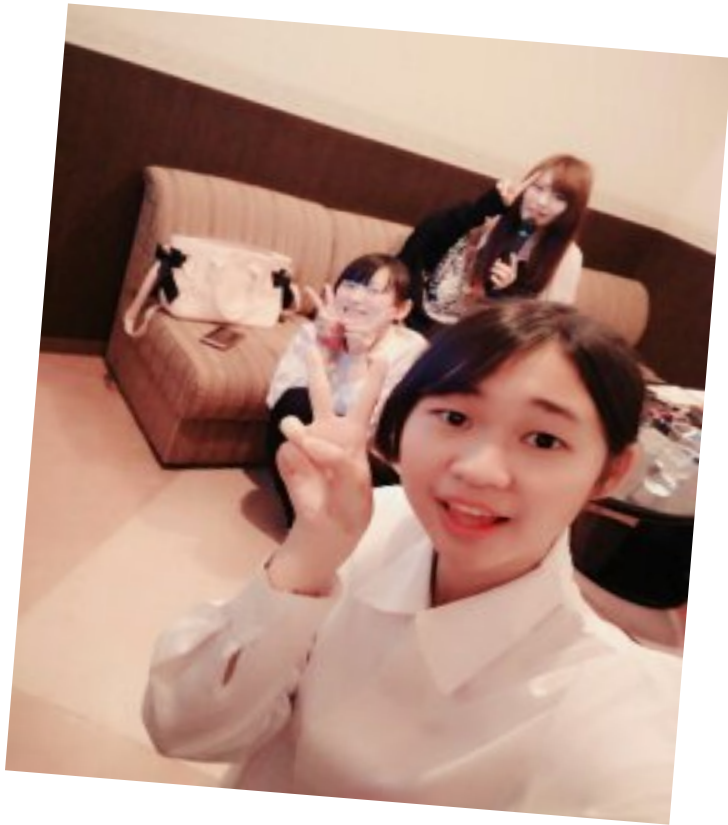
台灣姐姐離開前一唱(105/05/09)