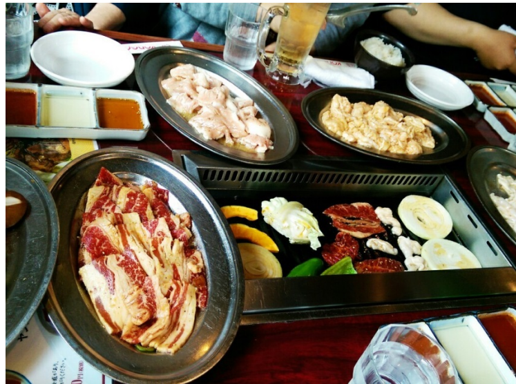
2016/4/26和同事阿姨們的聚會