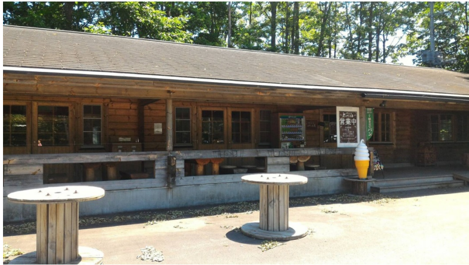
2016/06/03飯店的麵包店好吃好吃