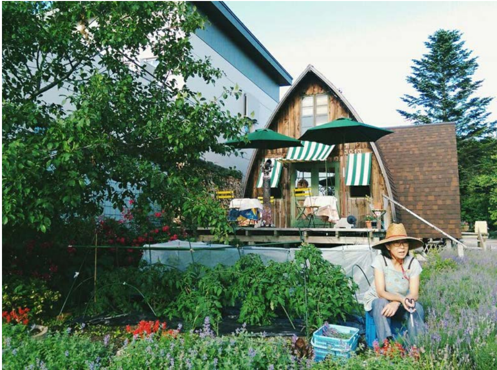
2016/06/25阿姨給了我們薰衣草超棒