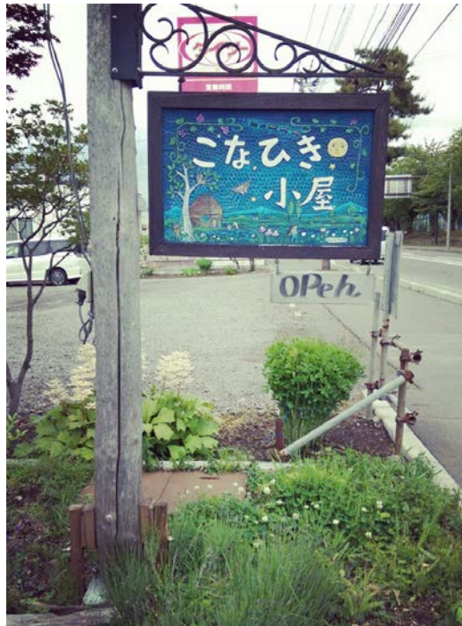
2016/6/10好吃的麵包店 每次去人都很多