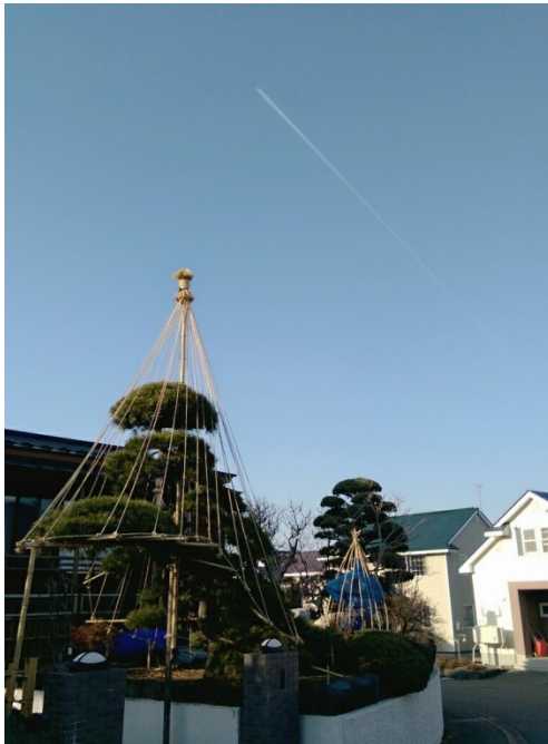
2016/03/26和朋友散步時拍的