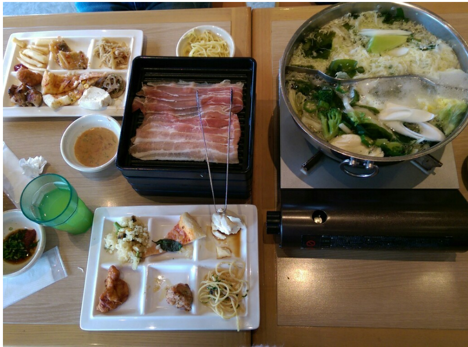
2016/4/15和朋友一起去吃火鍋