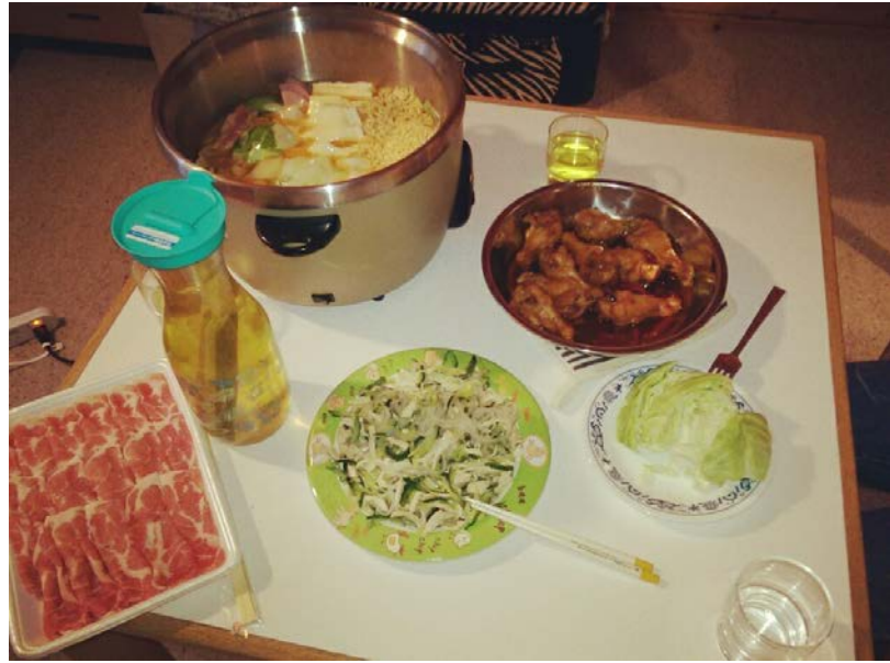
2016/6/05台灣姊姊煮飯給我們吃