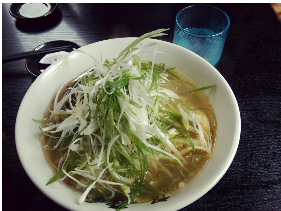
2016/6/2同事帶我來吃日本拉麵