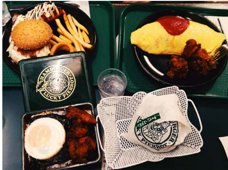
2016/630我們下班後最常去的餐廳