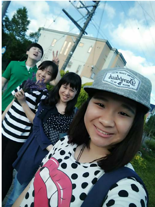
2016/6/25跟同事們一起出遊