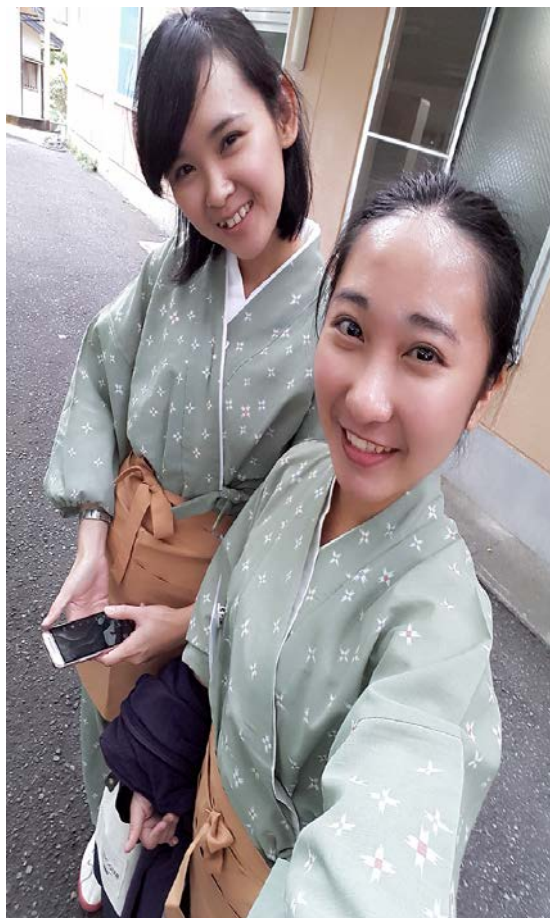
因為是溫泉旅館所以要穿上面這種工作制服