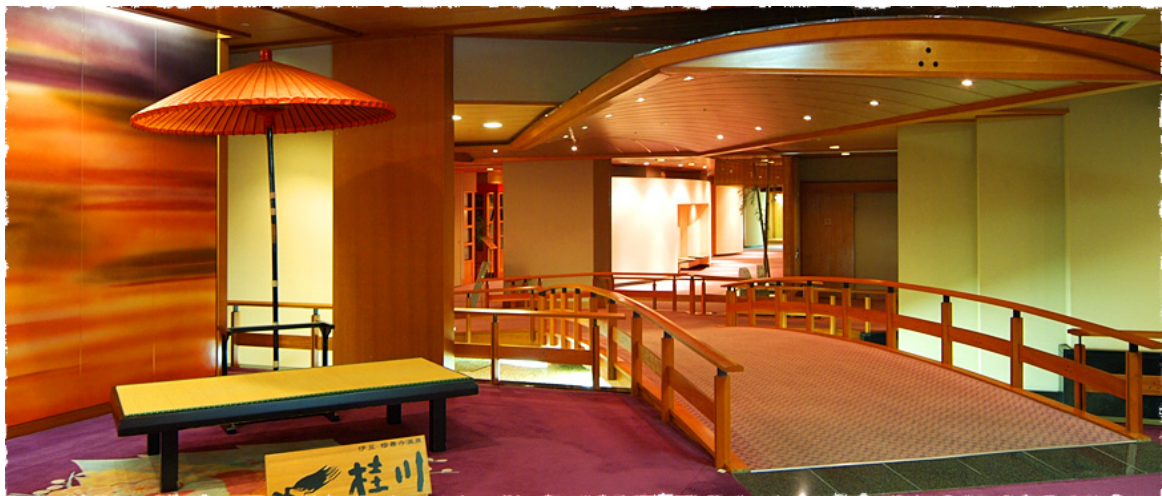
飯店景色，充滿日式風格

這是我們的飯店桂川，是一間很古樸的日式溫泉旅館，2F 是宴會廳（瑞雲の間、翔雲の間、慶雲の間…），3F 是櫃台大廳、売店、ラーメンコーナー，4F 是家庭式餐廳（花咲小路），5F~8F 是客房（分東西邊房間），是大澡堂